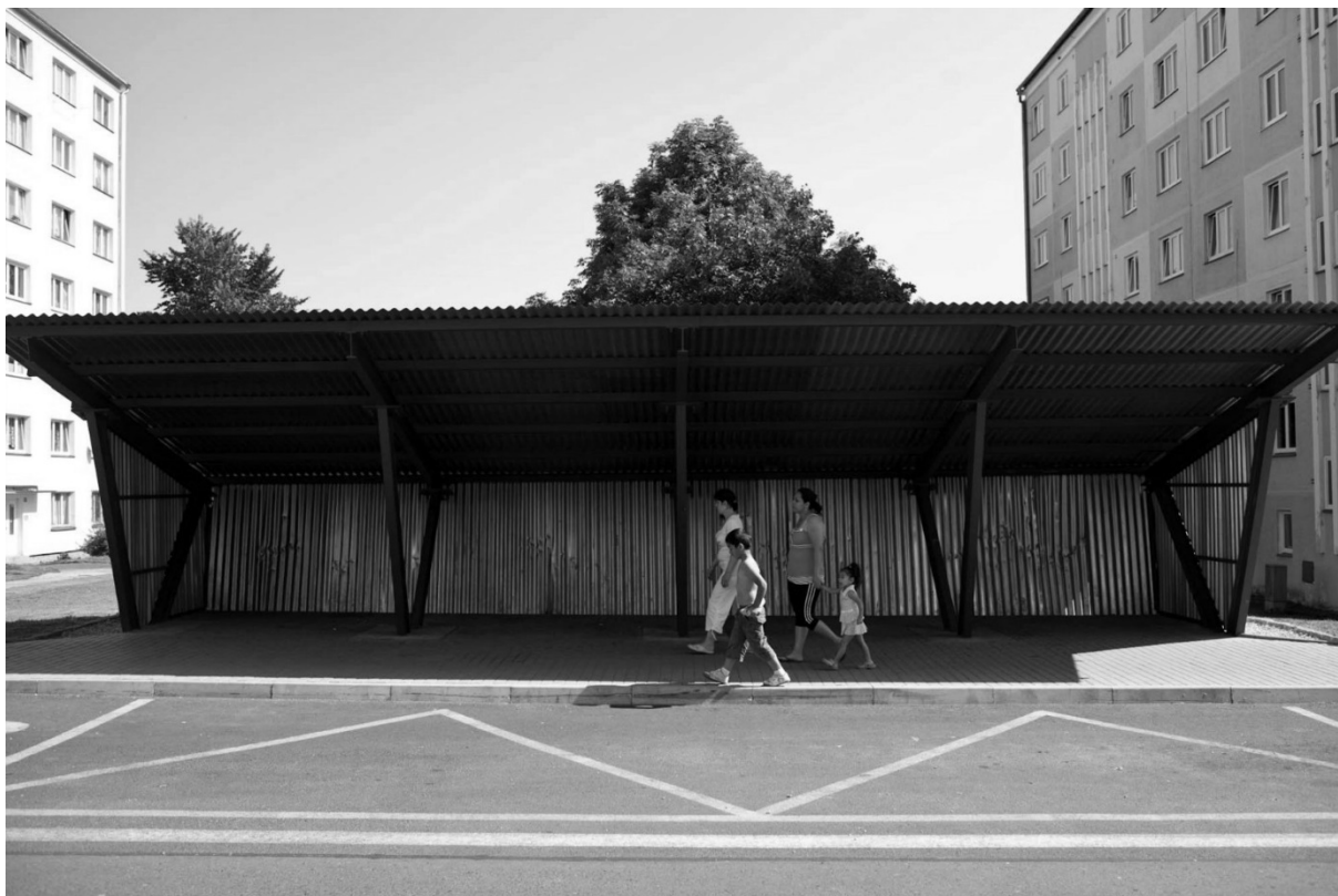
Fotografie č. 37: Autobusová zastávka v Rotavě, ze které byly odstraněny lavičky.