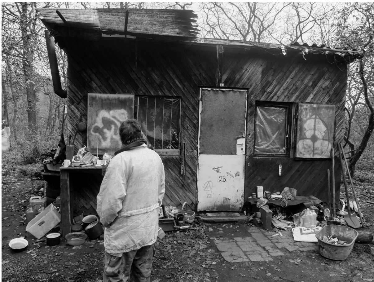
Fotografie č. 14: Bývalá zahradní chatka, nyní místo bezdomovců v reziduálním prostoru.