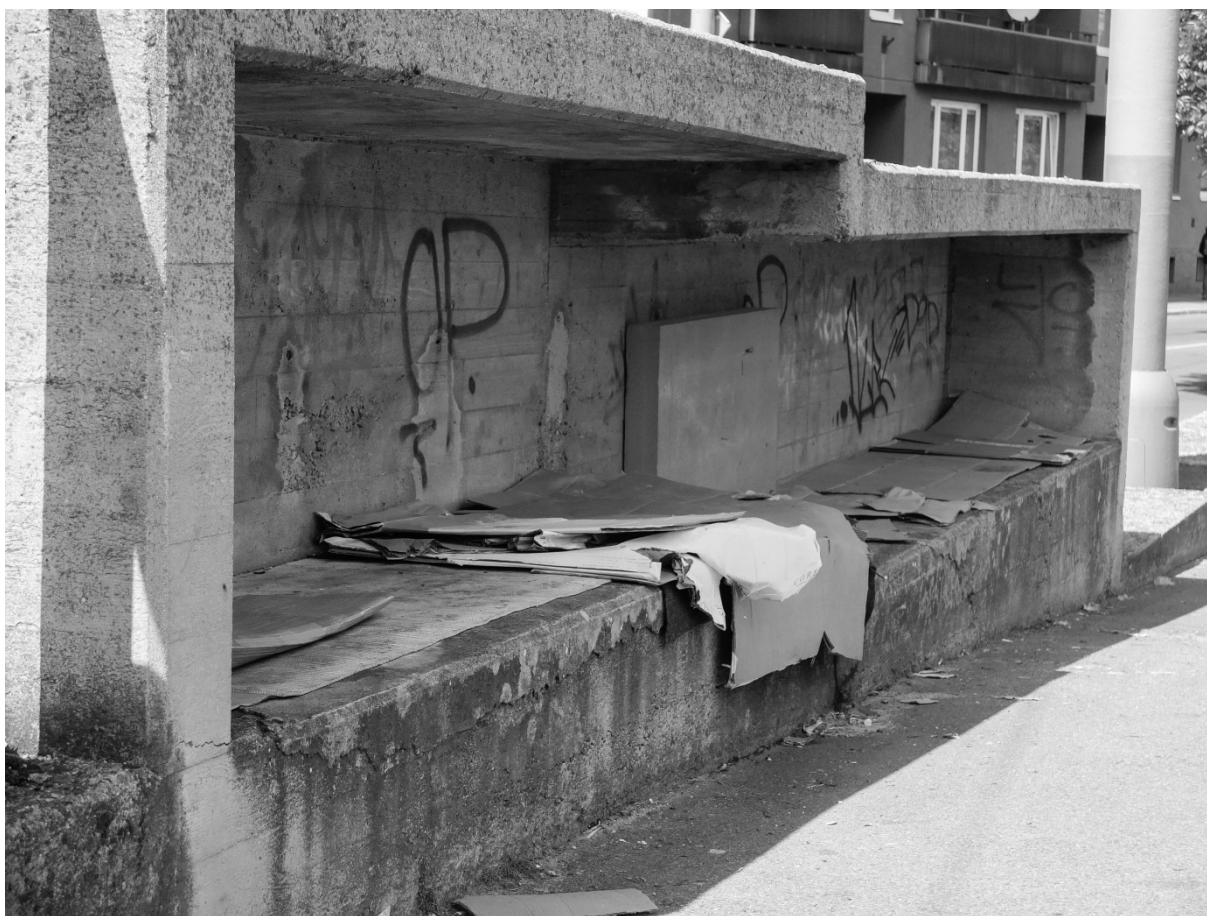
Fotografie č. 10: Kousek reziduálního prostoru ke spaní ve veřejném prostoru v centru města.