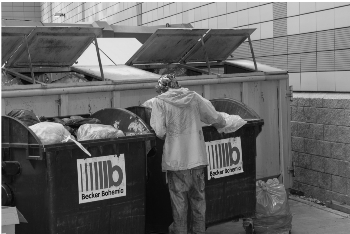
Fotografie č. 19: Fárání v kontejneru za supermarketem.