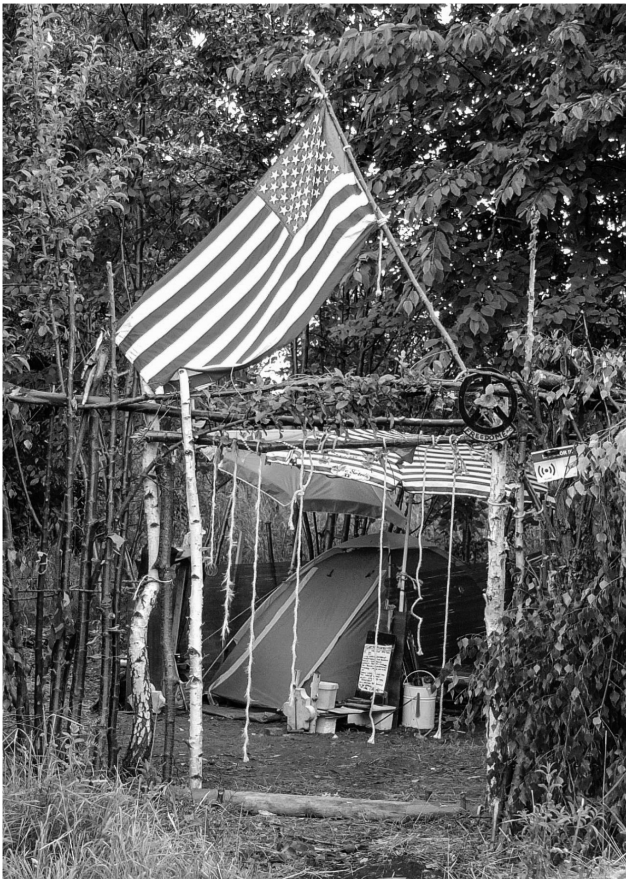
Fotografie č. 11: Místo vytvořené v reziduálním prostoru s nápisem „freedom“ na vstupní bráně.