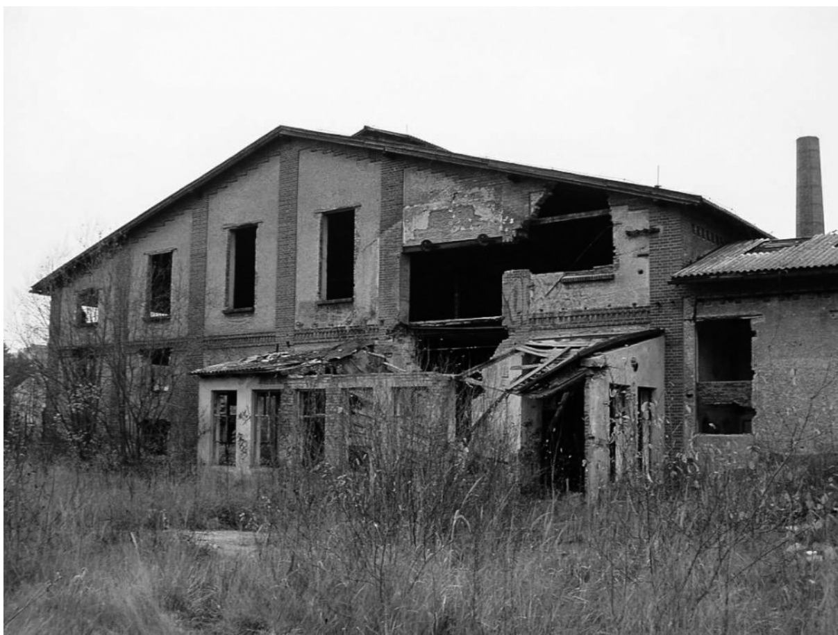
Fotografie č. 15: Bývalá Klotzova cihelna. Stav budovy pře požárem.