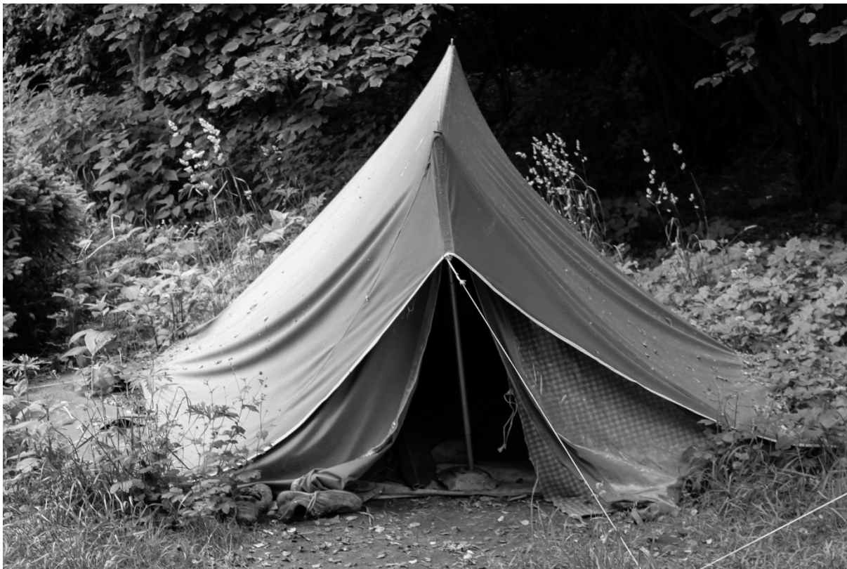
Fotografie č. 7: Stan Pichti v reziduálním prostoru uprostřed města.