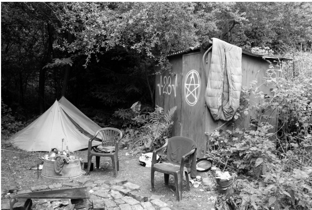
Fotografie č. 8: Místo Pichti a jeho kolegů v reziduálním prostoru bývalé zahrady.