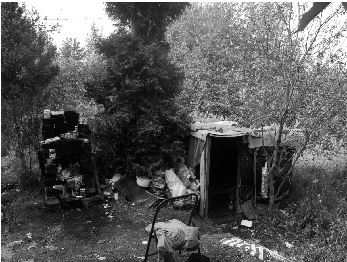
Fotografie č. 12: Štefanem postavený příbytek v reziduálním prostoru tzv. zahrádek.