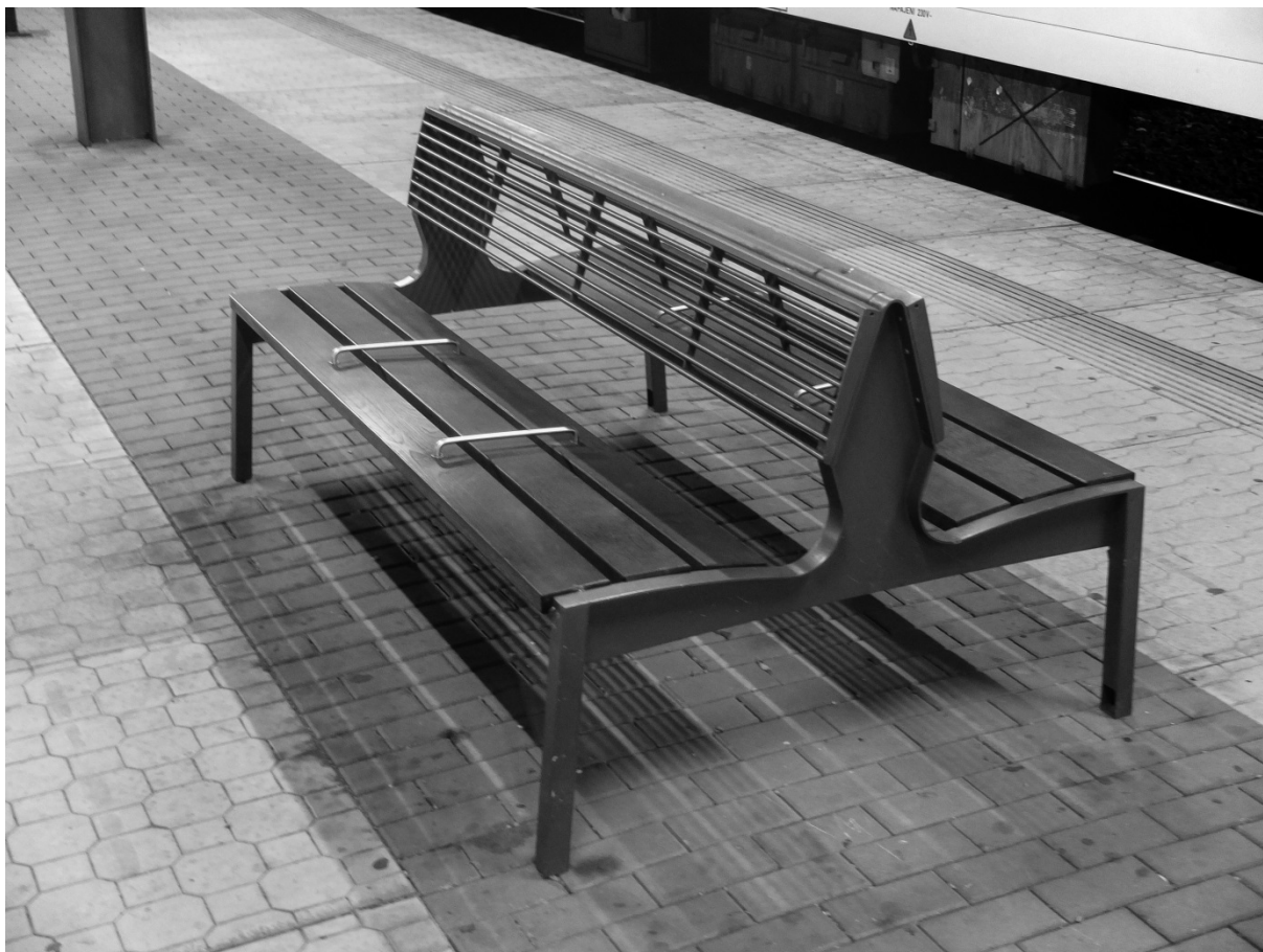
Fotografie č. 23: Lavička s „antibezdomoveckou“ úpravou, nádraží Rokycany.