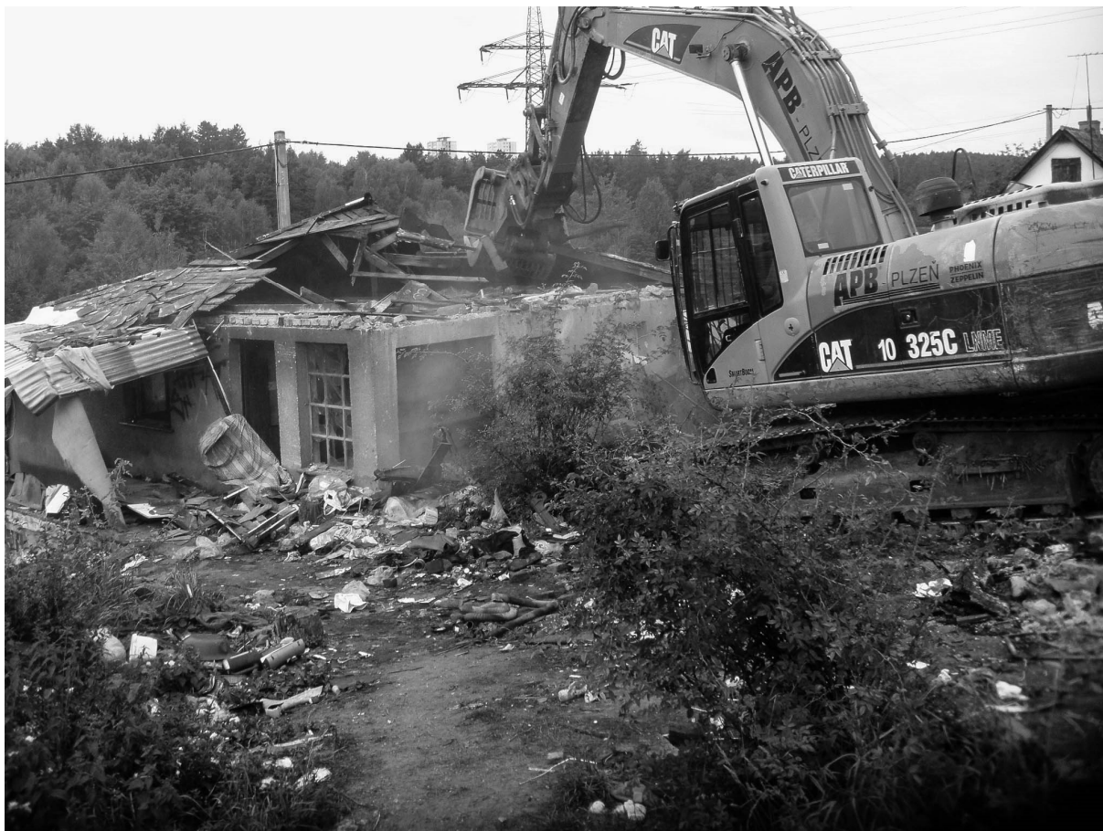
Fotografie č. 3: Demolice squatu II.