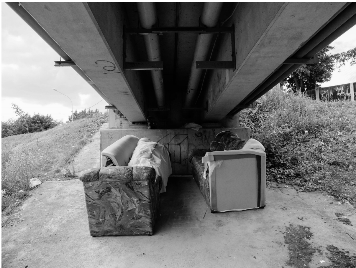
Fotografie č. 9: Jednoduché nocležiště v reziduálním prostoru pod mostem.