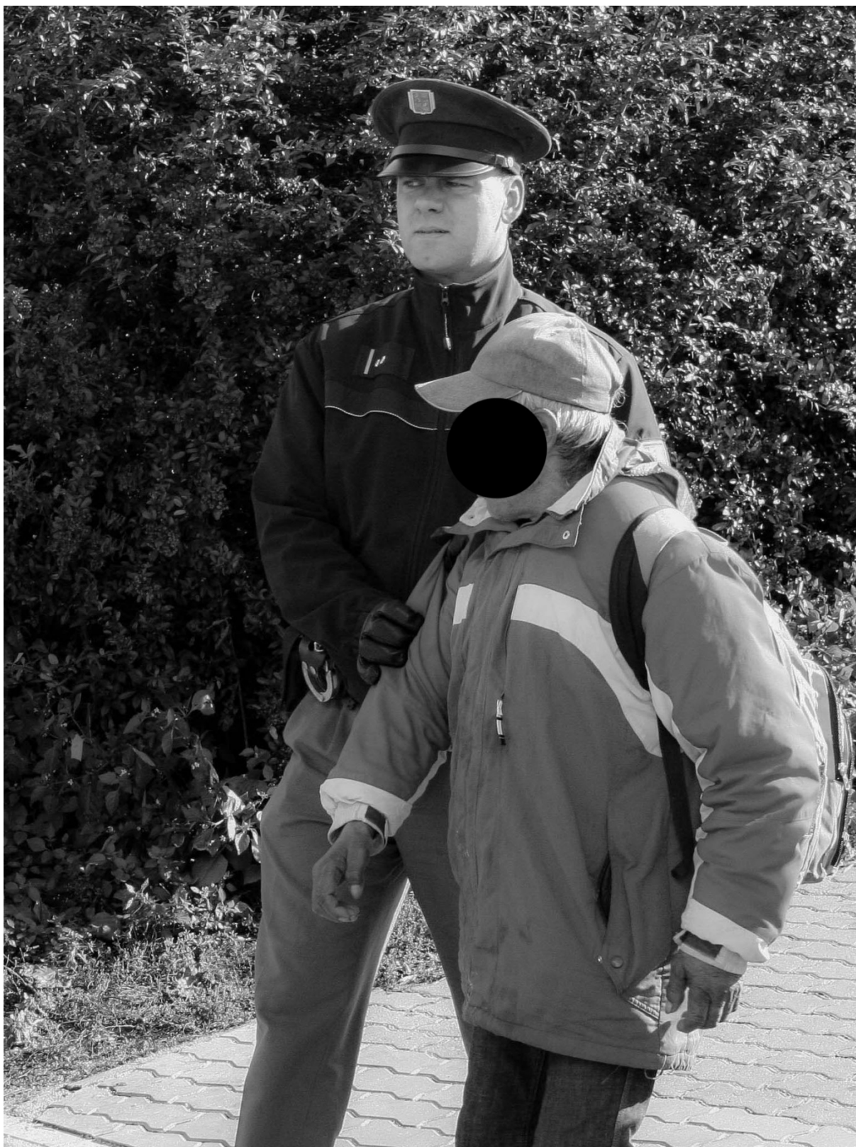
Fotografie č. 28: Policista odvádí zadrženého muže během mimořádné akce zaměřené na „kontrolu bezdomovců, žebráků a dalších asociálních osob“.