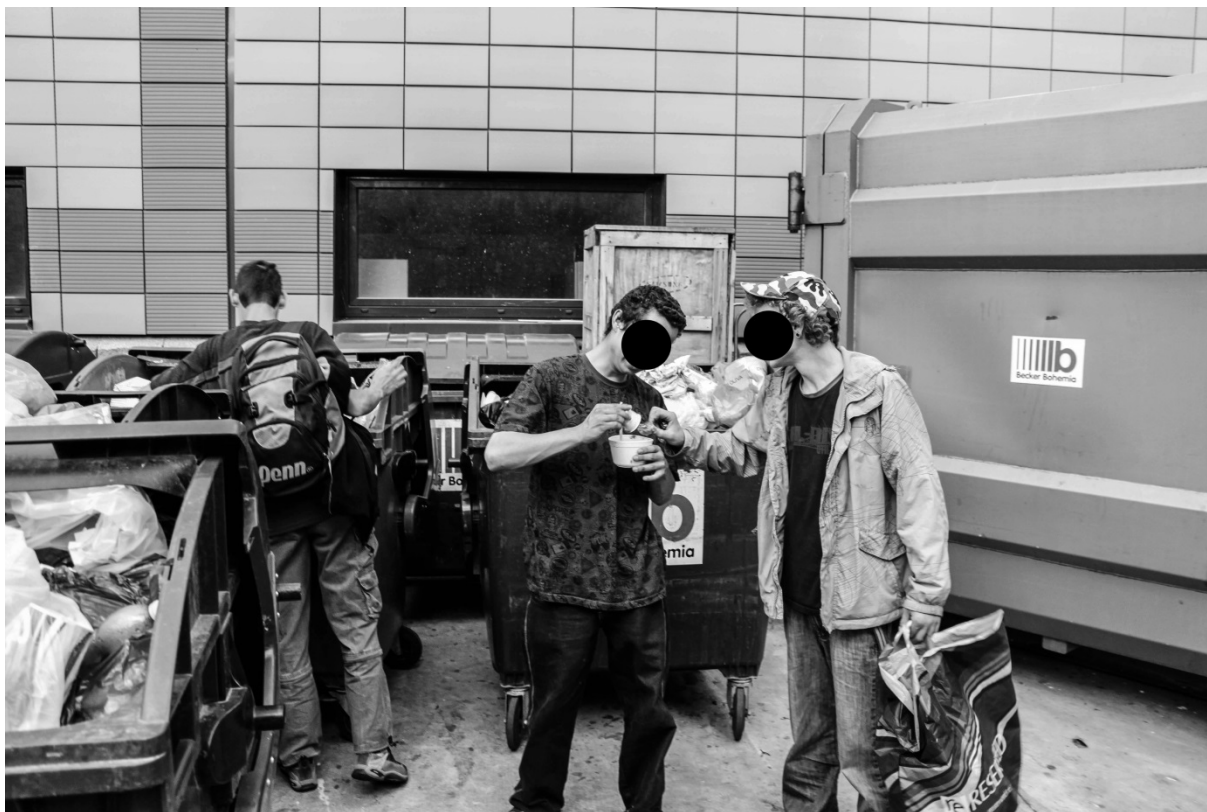
Fotografie č. 21: Koucour a Ejzi jedí vyhozené jídlo z čínské restaurace za obchodním centrem.