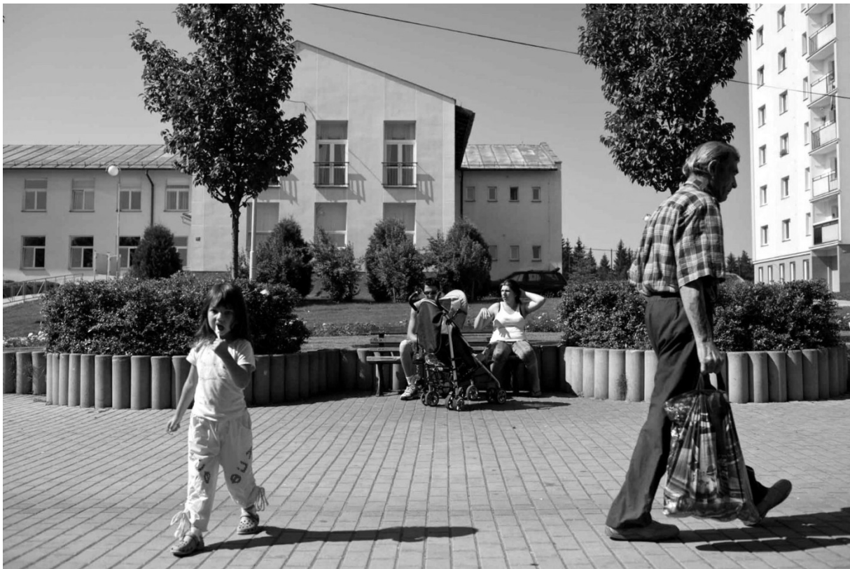
Fotografie č. 35: Jedna ze tří laviček v Rotavě.