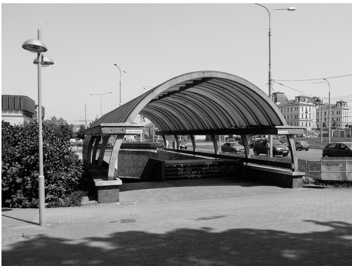
Fotografie č. 32: Tzv. Eskalátory, místo pro trávení času ve veřejném prostoru.