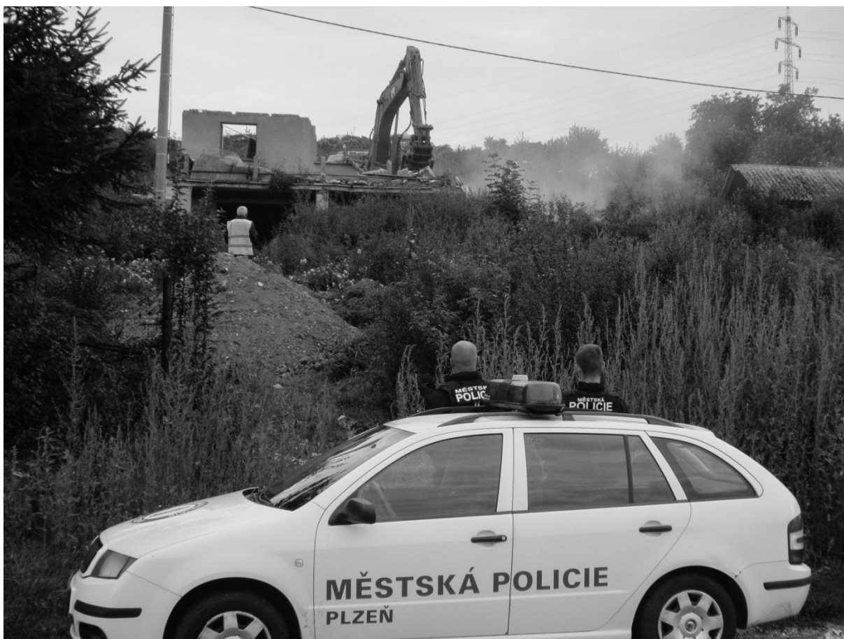
Fotografie č. 2: Demolice squatu I.