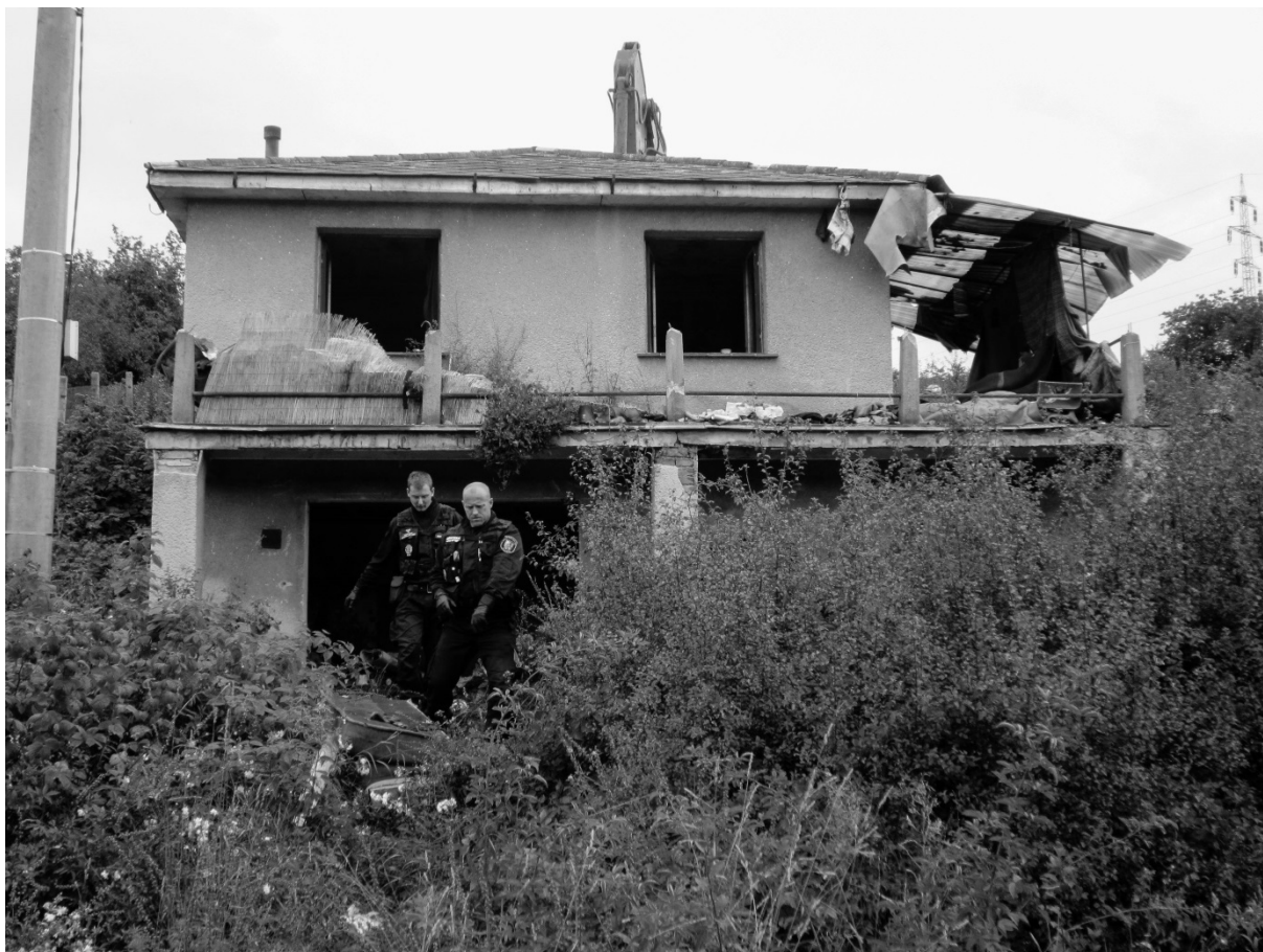
Fotografie č. 1: Vykližení squatu informátorů Městskou policií Plzeň.