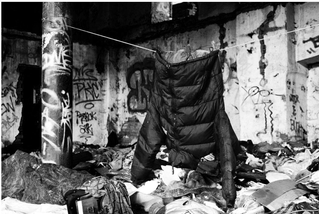
Fotografie č. 16: Sušení bundy v reziduálním prostoru cihelny.