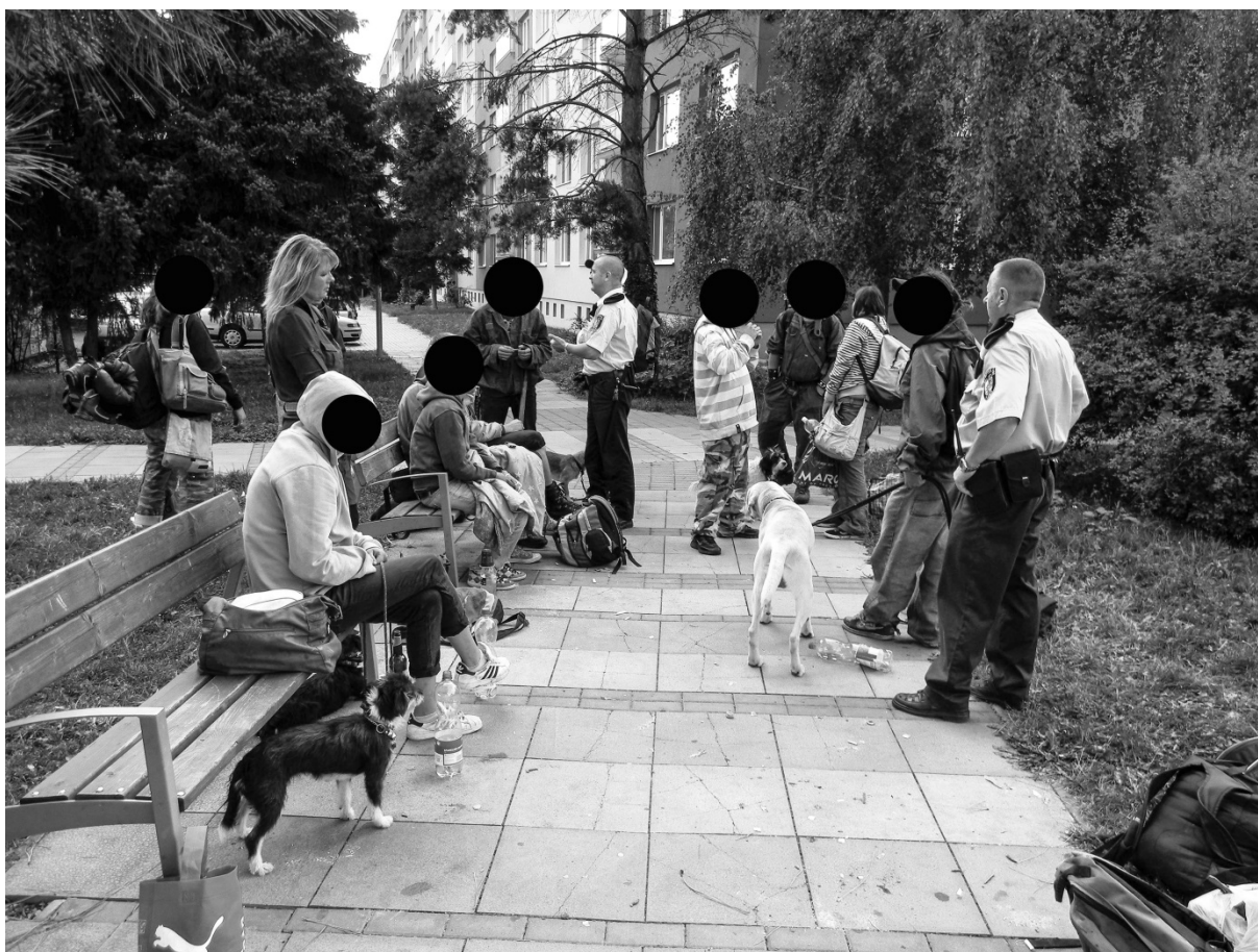
Fotografie č. 4: Informátoři vystěhování ze squatu za přítomnosti Městské policie Plzeň a České televize.