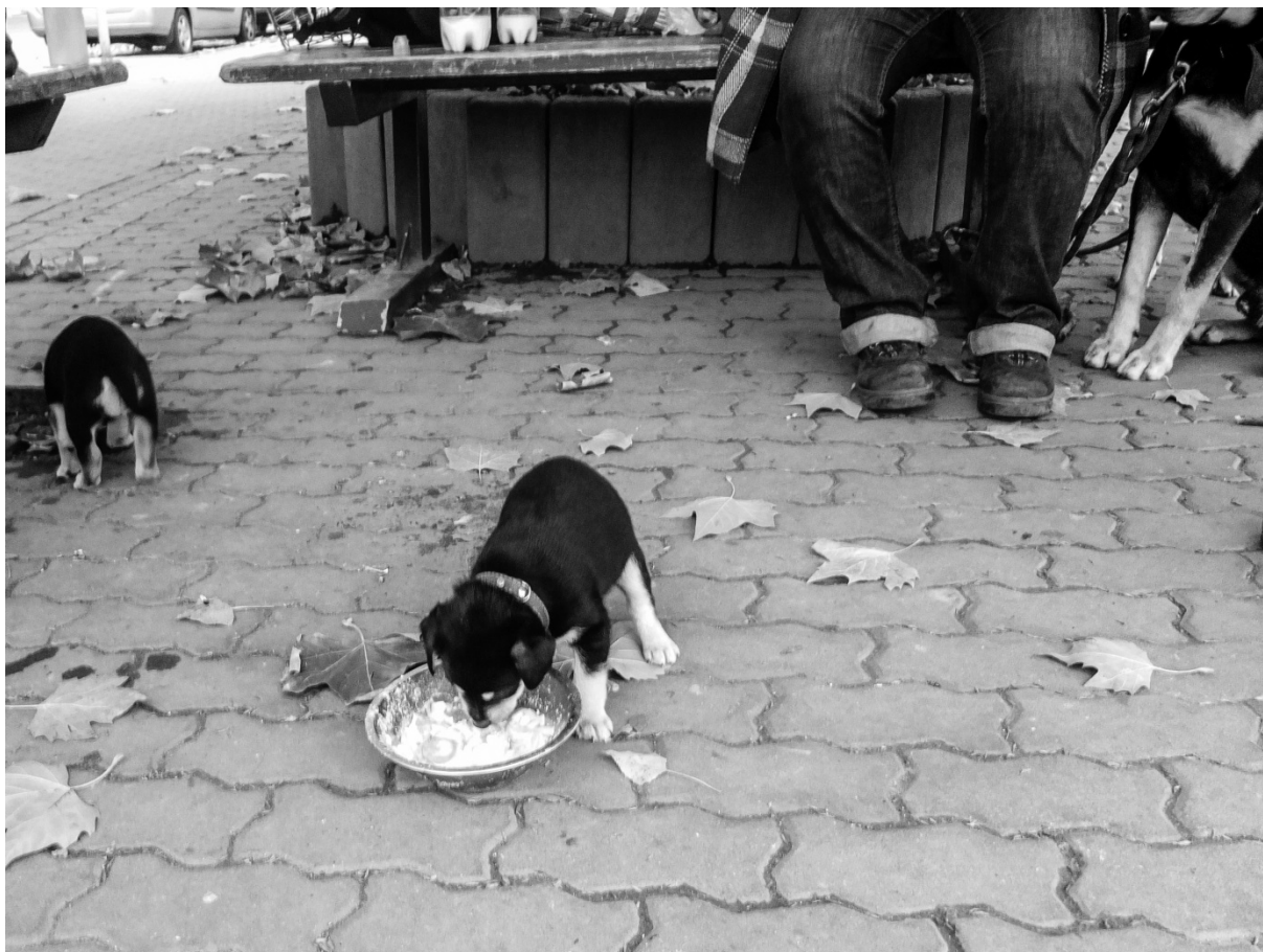
Fotografie č. 29: Krmení štěňat ve veřejném prostoru.