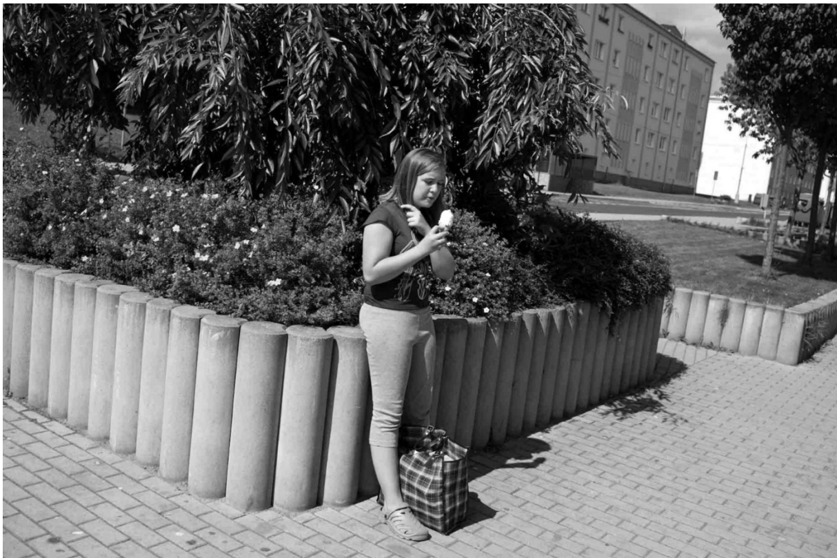
Fotografie č. 36: Dívka se opírá v Rotavě o palisádu a dopouští se přestupku.