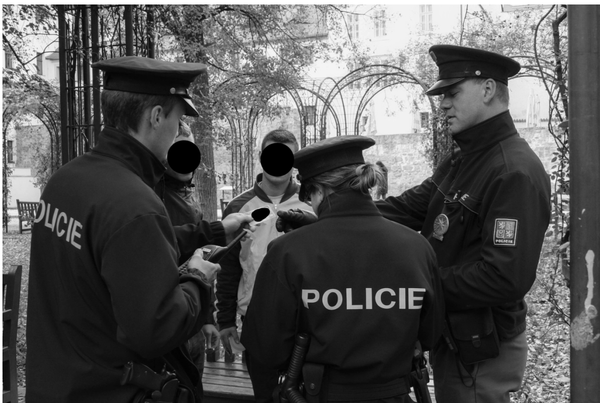
Fotografie č. 24: Police lustruje návštěvníky parku během mimořádné akce zaměřené na „kontrolu bezdomovců, žebráků a dalších asociálních osob“.