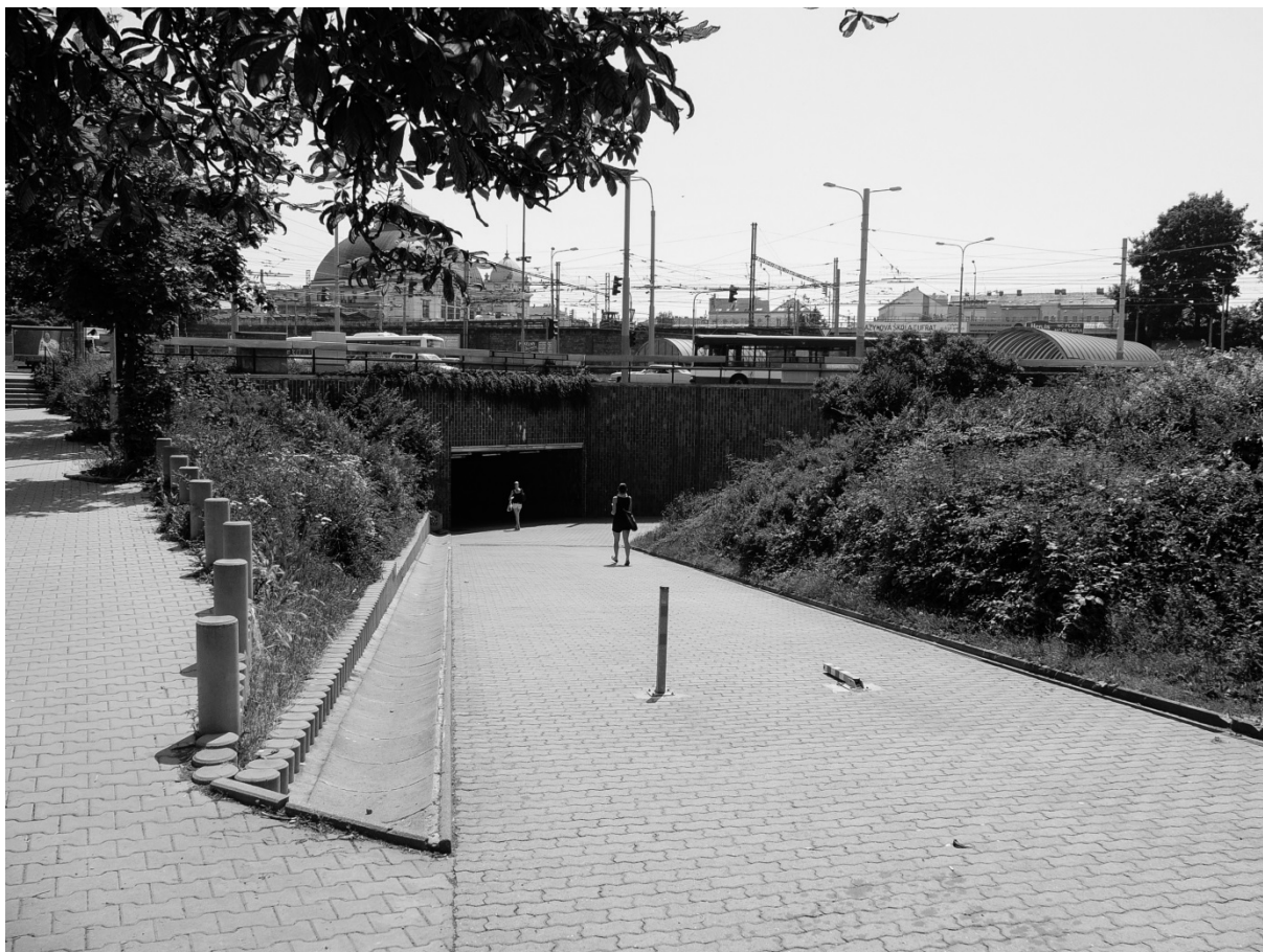
Fotografie č. 31: Cesta k podchodu na hlavní vlakové nádraží, oblíbené místo pro somrování.