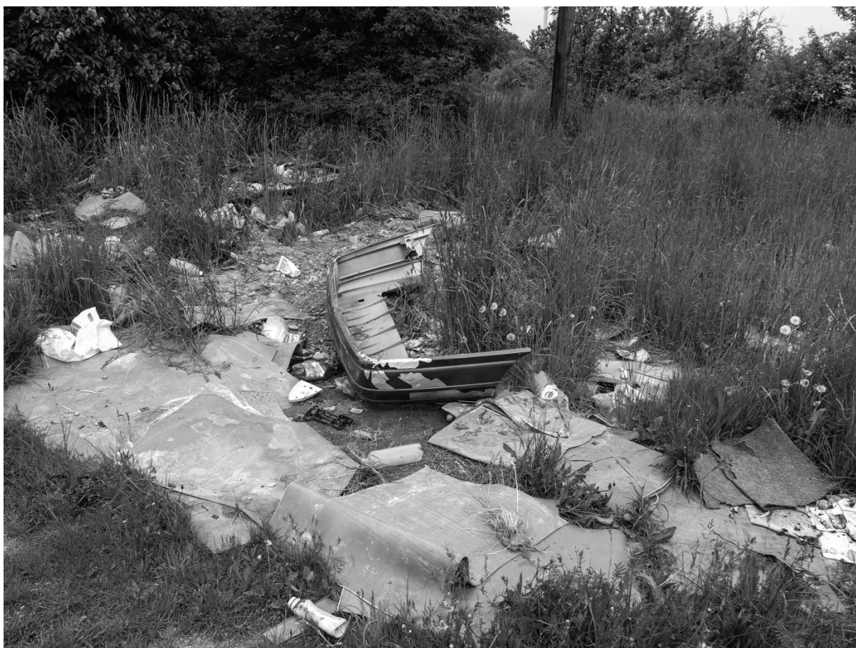
Fotografie č. 6: Skládka v reziduálním prostoru tzv. zahrádek.