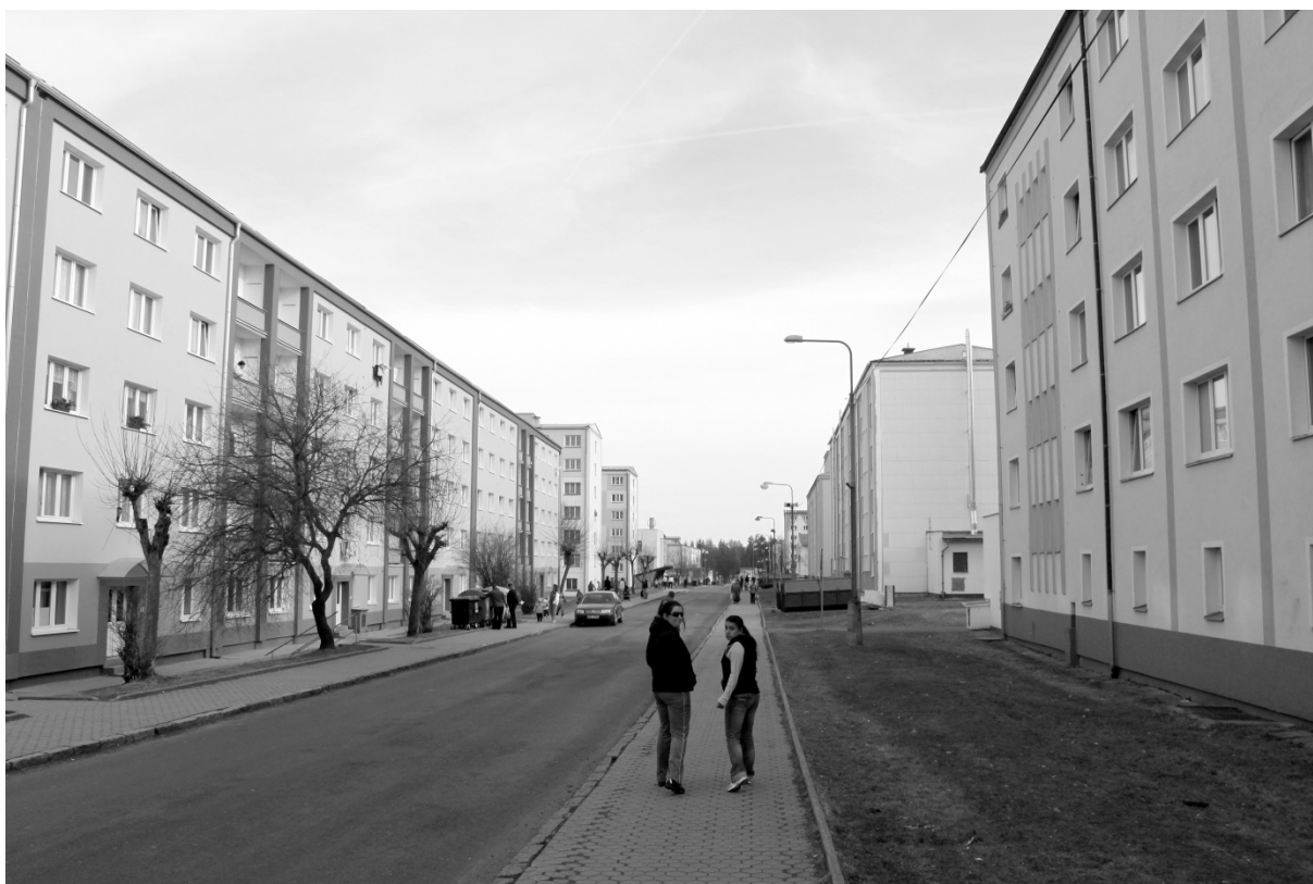
Fotografie č. 34: Hlavní ulice v Rotavě.