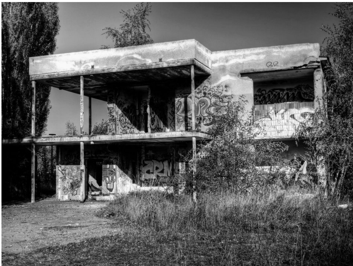
Fotografie č. 17: Reziduální prostor bývalé plovárny Lopatárna.