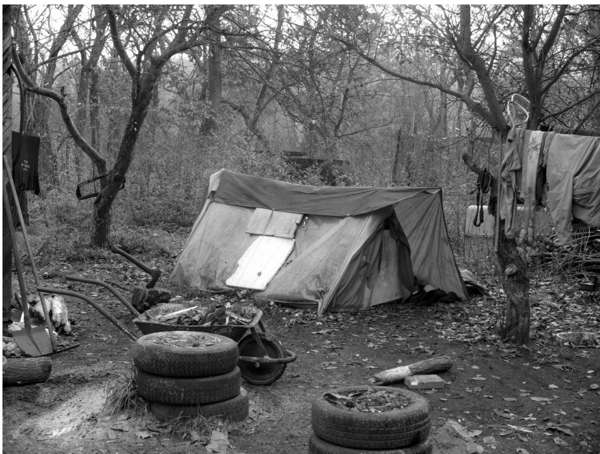
Fotografie č. 13: Stan v reziduálním prostoru (k zlepšení tepelné izolace jsou podlážka a stěny obložené polystyrenem).