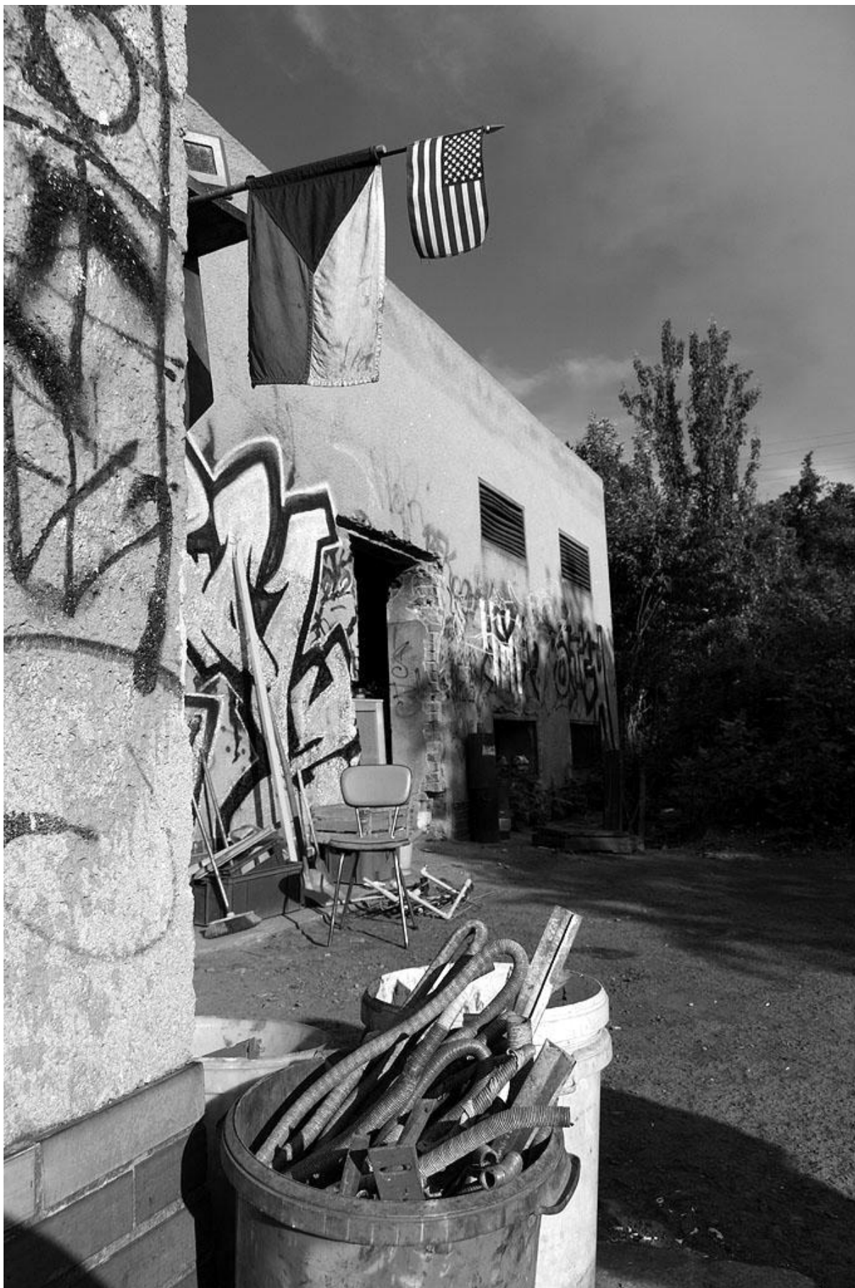
Fotografie č. 18: Místo obývaný bezdomovci v bývalé plovárně.