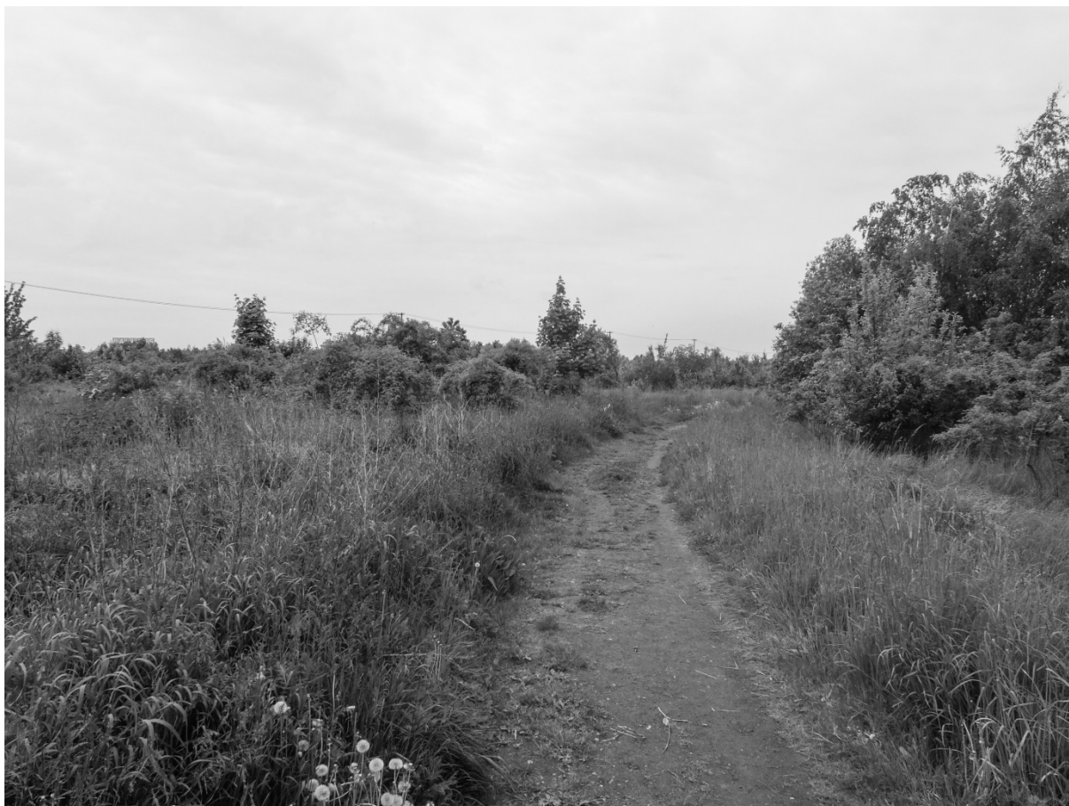
Fotografie č. 5: Reziduální prostor tzv. zahrádek.