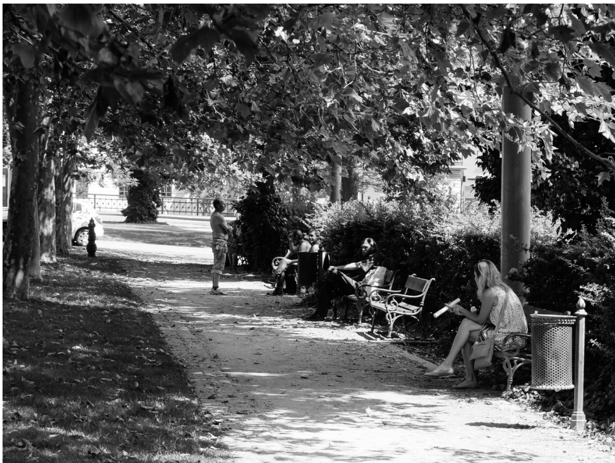
Fotografie č. 33: Tzv. Špek park, místo pro trávení času ve veřejném prostoru.