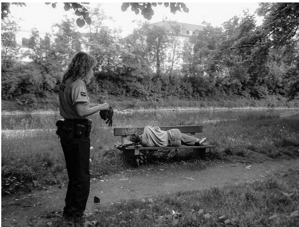
Fotografie č. 26: Příslušnice Městské policie Plzeň si nasazuje rukavice před kontrolou spícího muže.