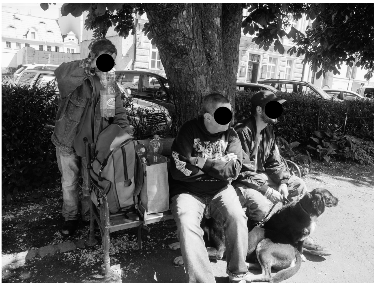
Fotografie č. 30: Jarní odpolední den trávený informátory v parku na lavičce.