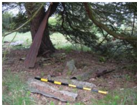
Obrázek 2. Relikt dětského přístřešku na Indigo ostrově.