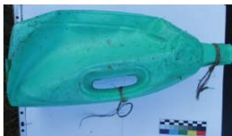
Obrázek 3. Láhev od aviváže vybavená popruhem z provázku.

bývání se na lokalitě dodnes zachovalo mnoho hmotných pozůstatků, které jsou předmětem této studie.