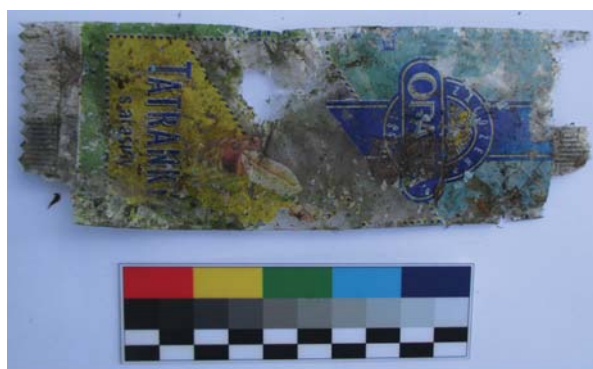
Obrázek 7. Obal od arašídových Tatranců nalezený na Indigo ostrově. Dole současná podoba stejného výrobku.