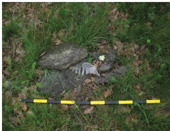
Obrázek 5. Zvířecí hrob.