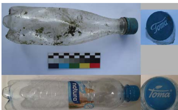
Obrázek 6. Láhev neperlivé vody Toma nalezená na Indigo ostrově. Dole současná podoba stejného výrobku.