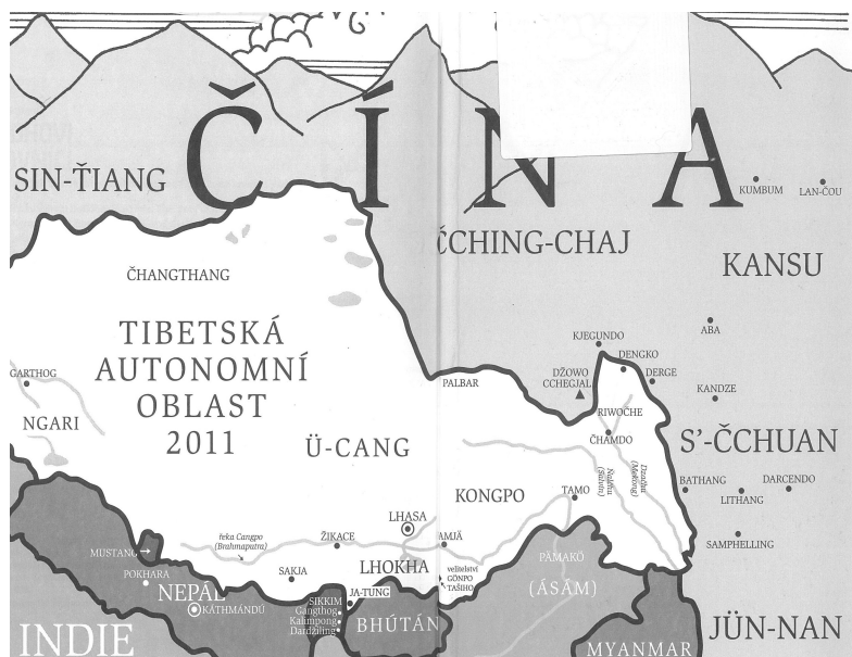
Příloha č. 3, mapa Tibetské autonomní oblasti