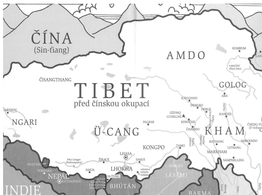
Příloha č. 2, mapa Tibetu před čínskou okupací, zdroj: DUNHAM, Mikel, Buddhovi bojovníci, Praha 2011.