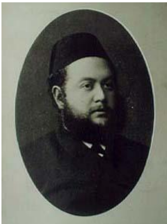
Shmuel Shneersohn, čtvrtý cadik

Chabadu.