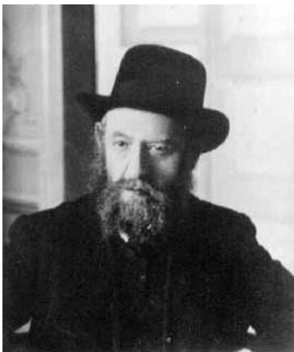
Sholom Dov Ber Schneersohn, pátý

Chabadu.