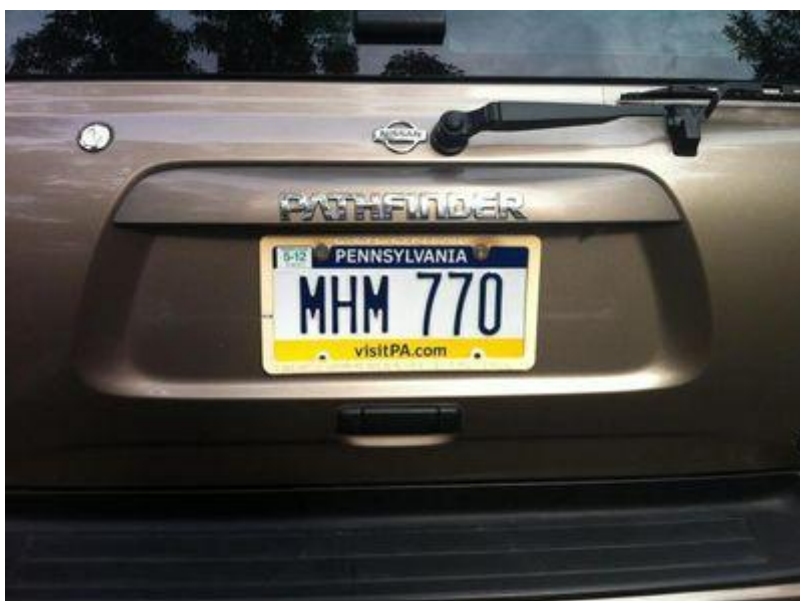
SPZ Nissanu Pathfinder,

http://failedmessiah.typepad.com/failed_messiahcom/2012/02/new-chabad-mitzvah-tank-look-portrays-dead-rebbe-as-king-messiah-234/comments/page/2/