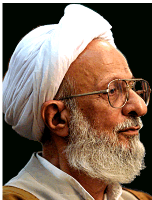
Príloha č. 3 – Mohammad-Báqer Madžlesí. 373 Príloha č. 4 – Mohammad Taqí Mesbáh-Jazdí 374