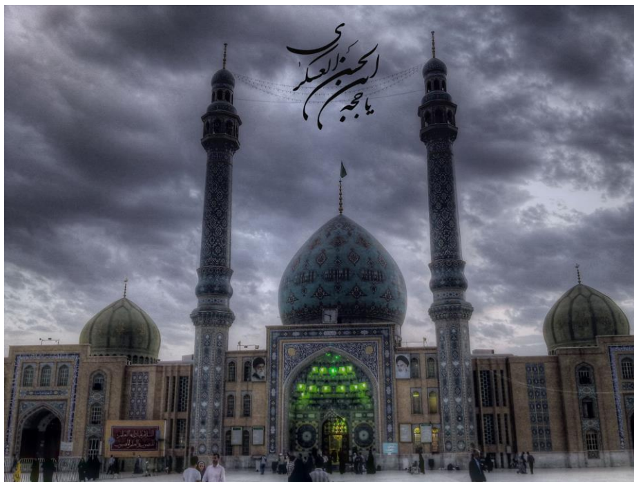
Príloha č. 2 – mešita Džamkarán. 372