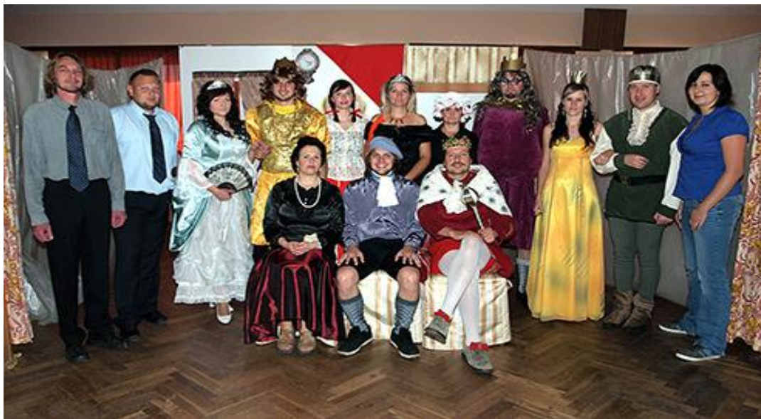
Obrázek č. 4 Členové občanského sdružení KUNA po úspěšném divadelním představení