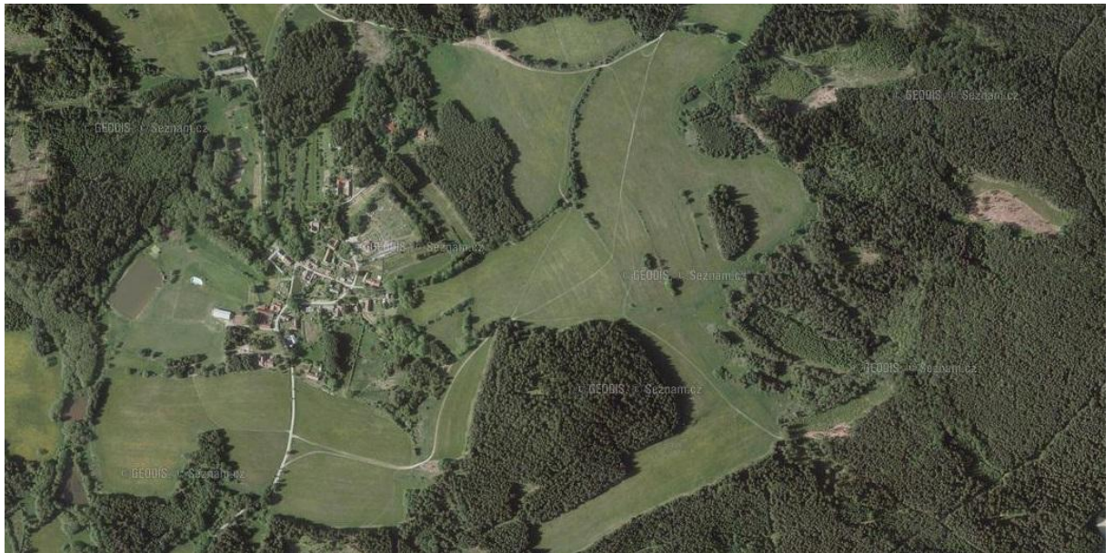
Obrázek č. 3 Letecký snímek Najdeku