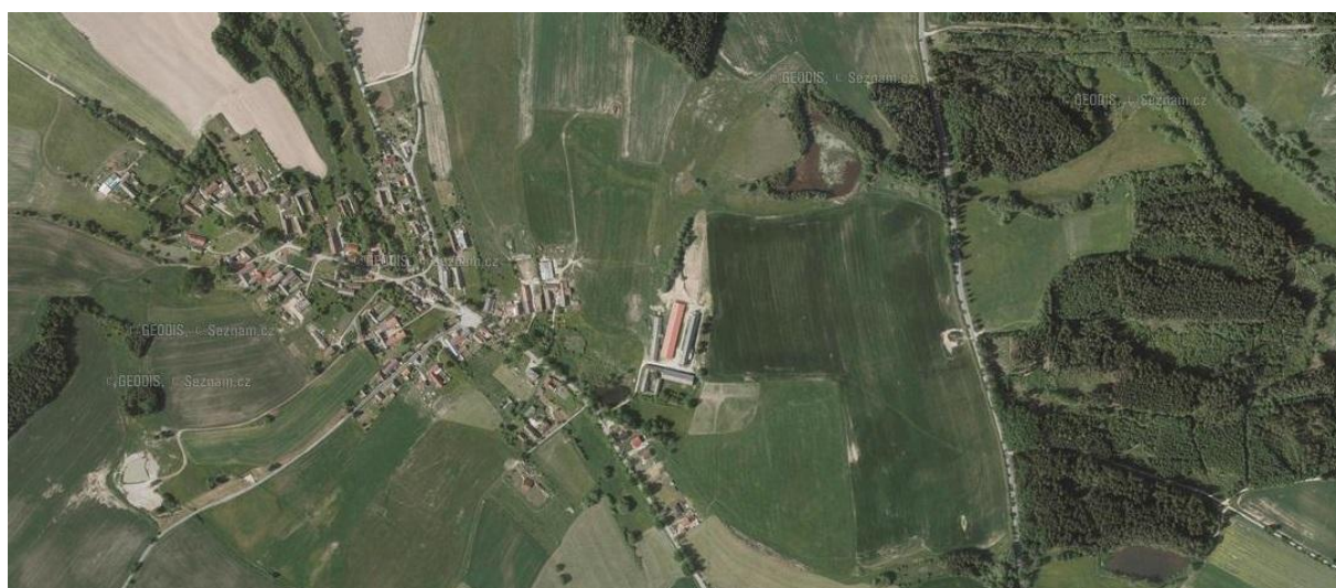
Obrázek č. 2 Letecký snímek Studnice