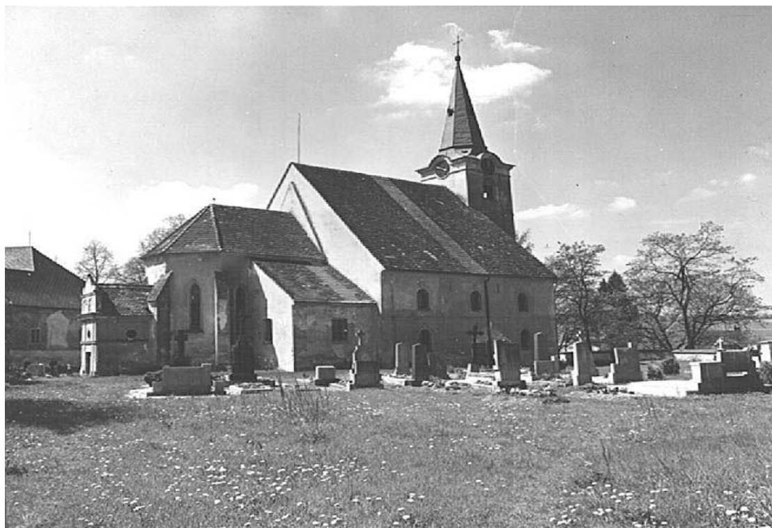
Obrázek č. 5 Snímek kostela s přilehlým hřbitovem z roku 1971