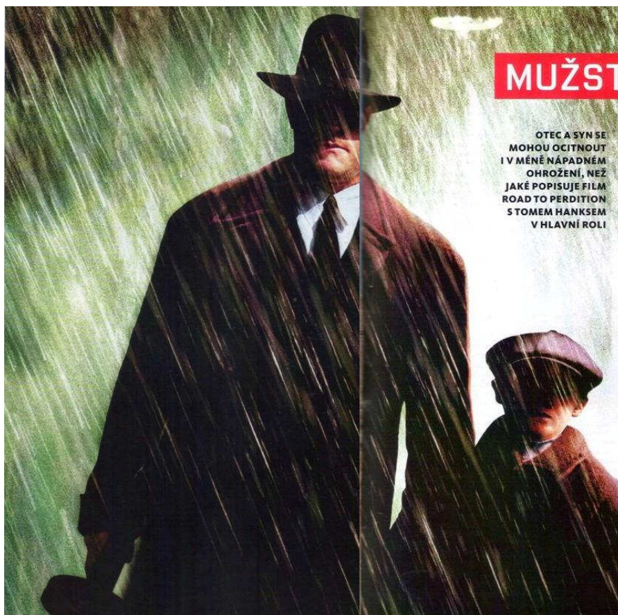
Obr. 8 [Reflex 47/2011: 40-41]