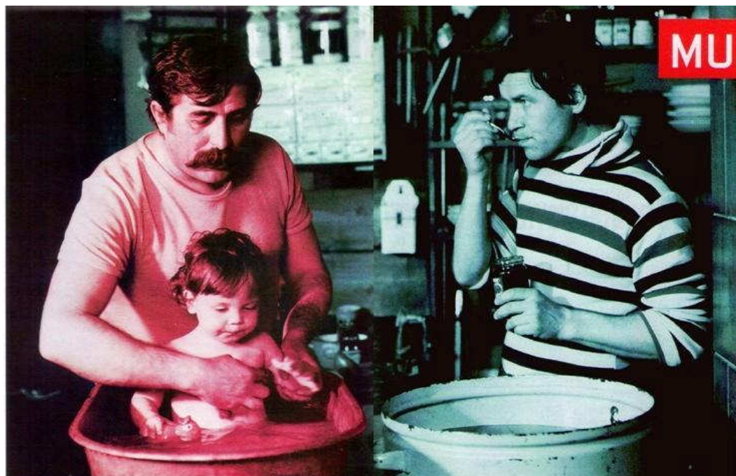
Obr. 2 [Reflex 46/2011: 72-73]