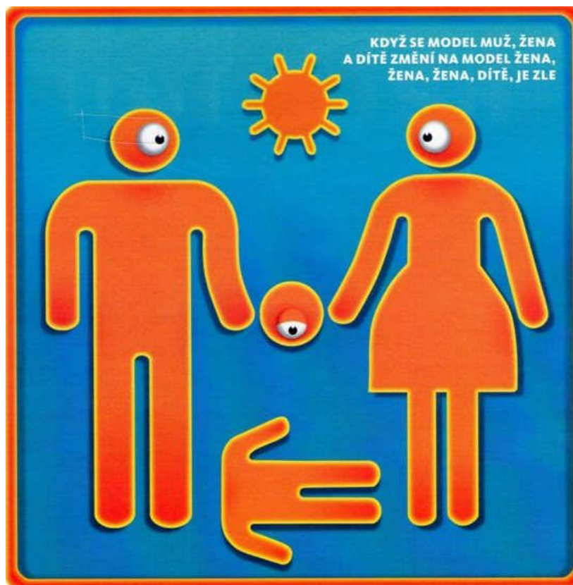
Obr. 6 [Reflex 44/2011: 38-39]