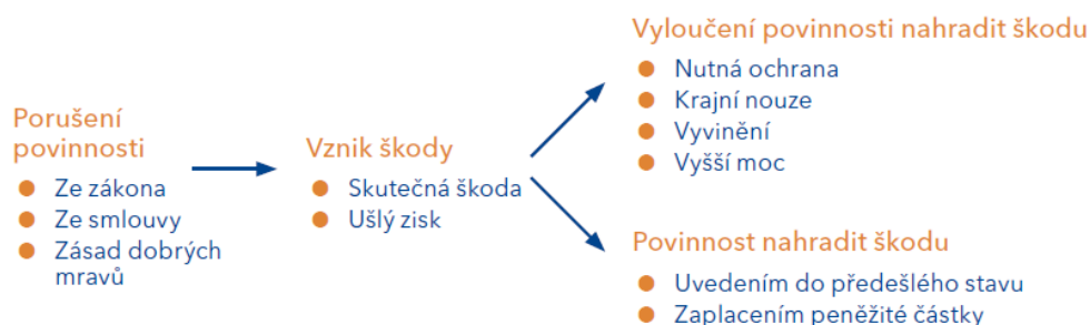
Schéma vzniku povinnosti nahradit škodu 62

náklady, jež musí být k obnovení funkčnosti vynaloženy. 61 Vznik povinnosti je demonstrován v tomto schématu: