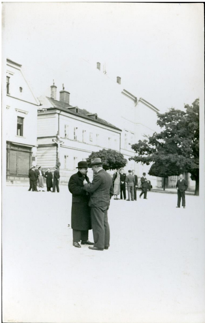
Obrázková příloha 5 – Starosta v buřince a hejtman při demonstraci v září 1938 270