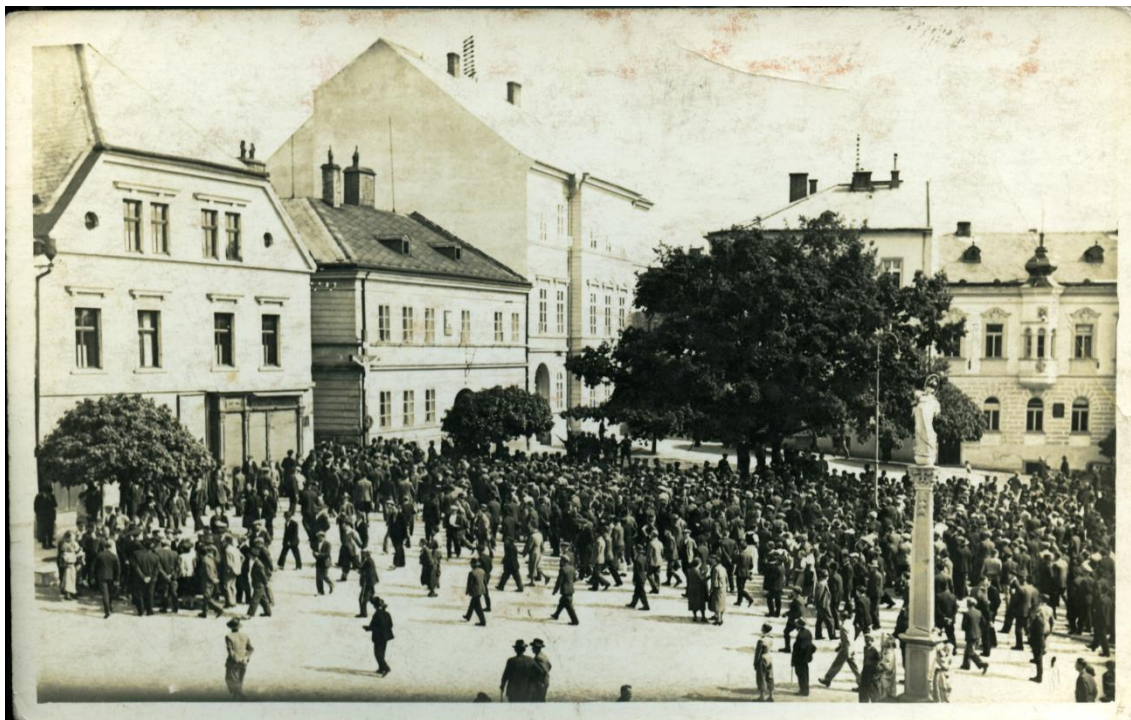
Obrázková příloha 7 – Po střelbě na náměstí v Tachově 272