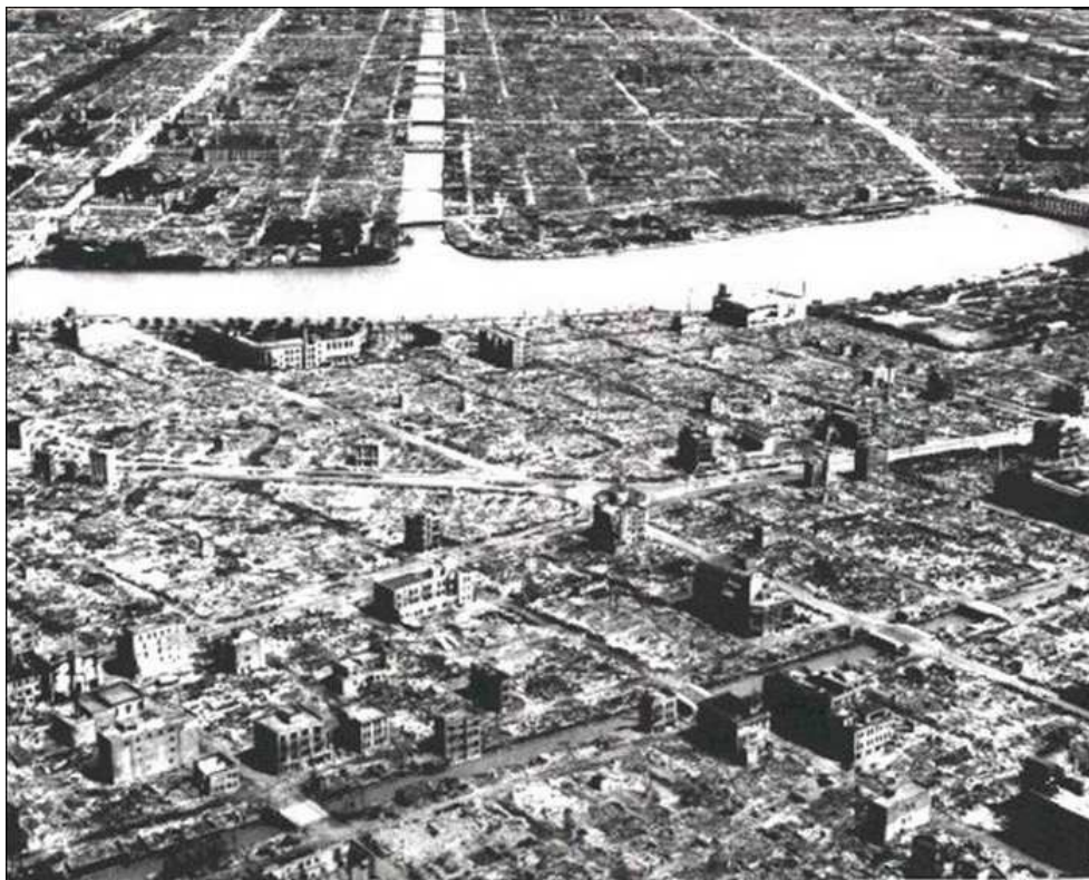
Příloha č. 3, Vypálené oblasti v Tokiu po americkém náletu