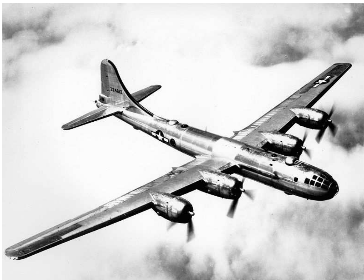
Příloha č. 2, Americký bombardér B-29, Zdroj: http://commons.wikimedia.org/wiki/File:B29.jpg