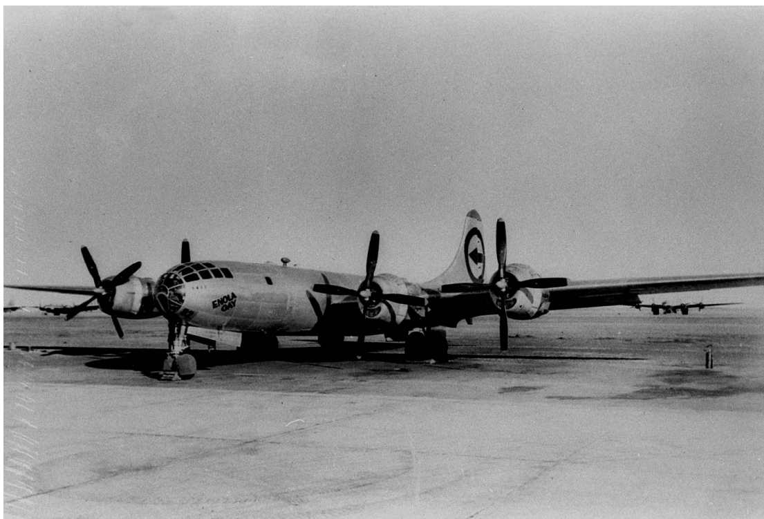
Příloha č. 5, Letadlo B-29 „Enola Gay”, které neslo atomovou bombu na Hirošimu,