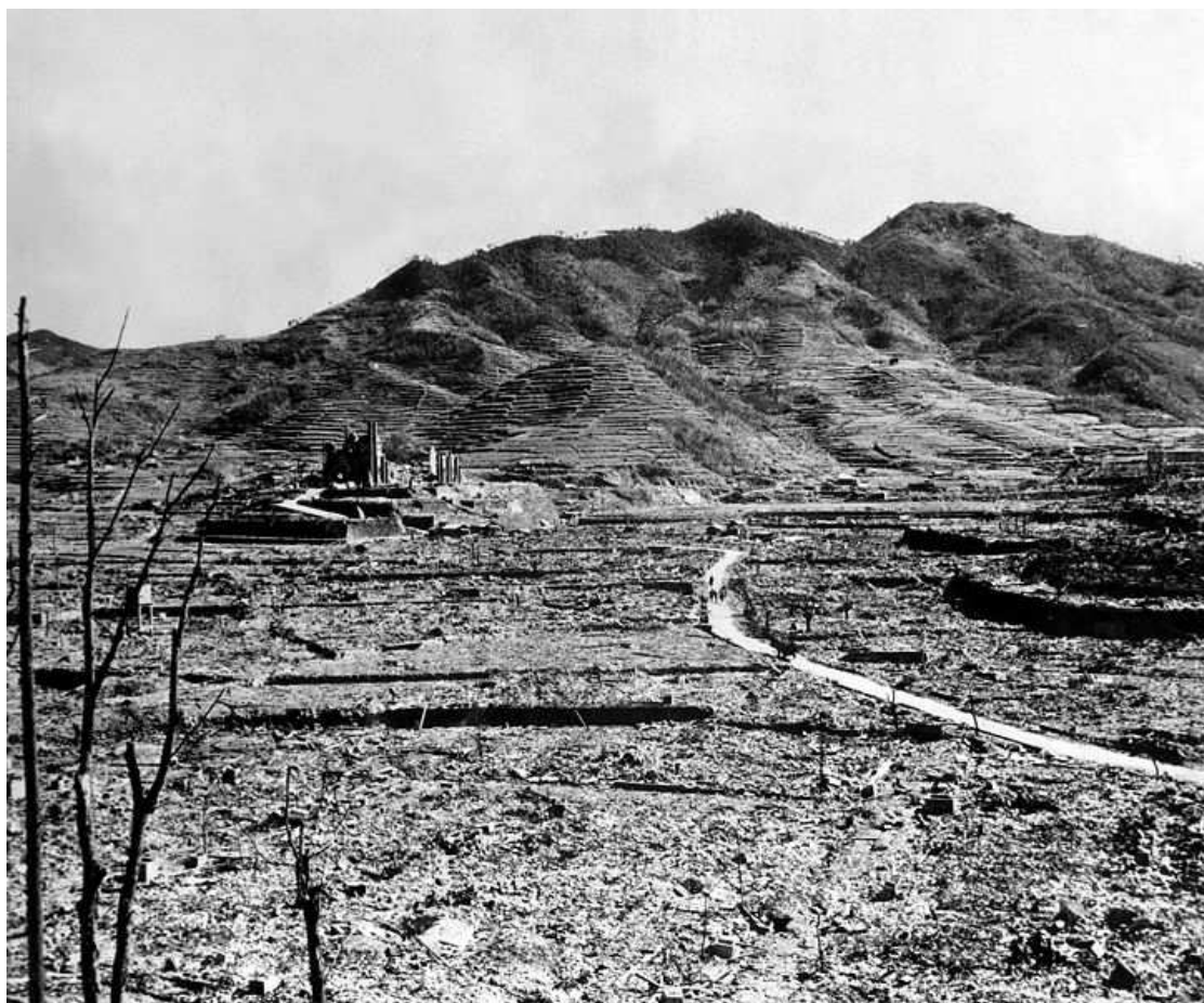
Příloha č. 7, Nagasaki po výbuchu atomové bomby, Zdroj: http://commons.wikimedia.org/wiki/File:Nagasaki-urakami.jpg