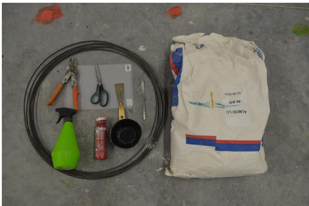
03 Pomůcky formování, fotografie