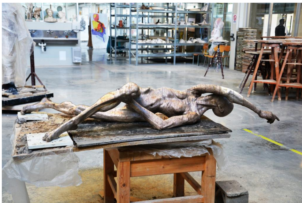
07Realizace1, fotografie