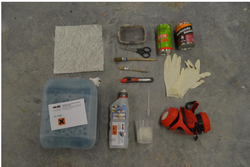
06Pomůcky laminování, fotografie