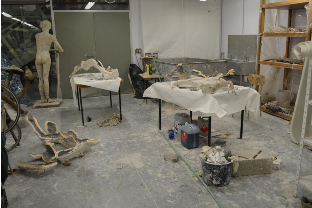
04 Pracovní prostředí, fotografie