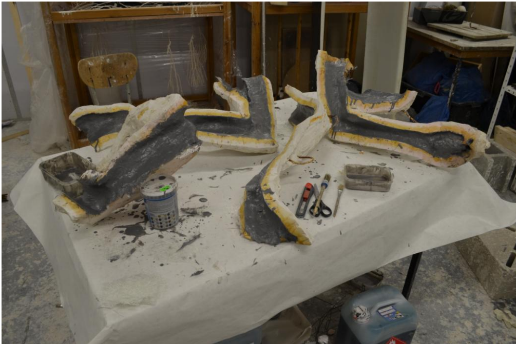
02 Forma, fotografie