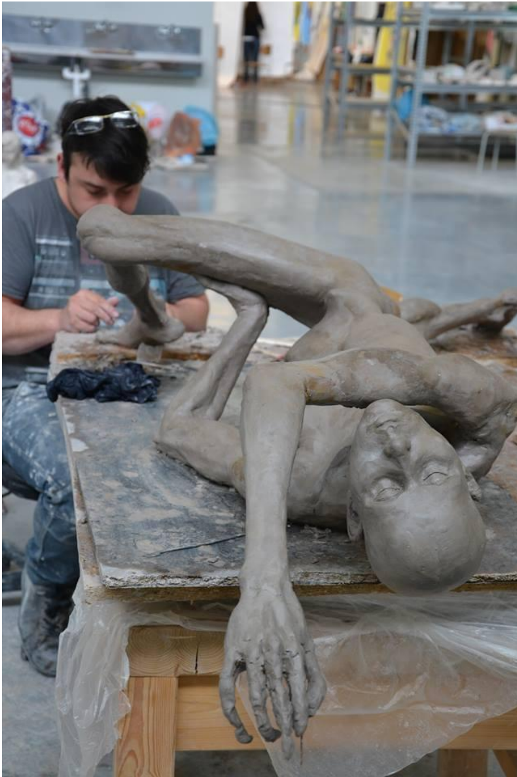
01 Modelování, fotografie, foto vlastní