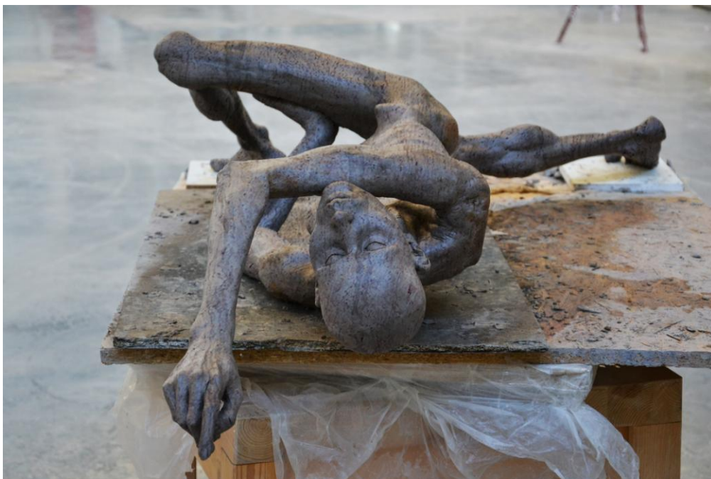
08Realizace2, fotografie