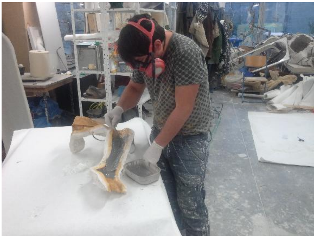
05 Laminování, fotografie