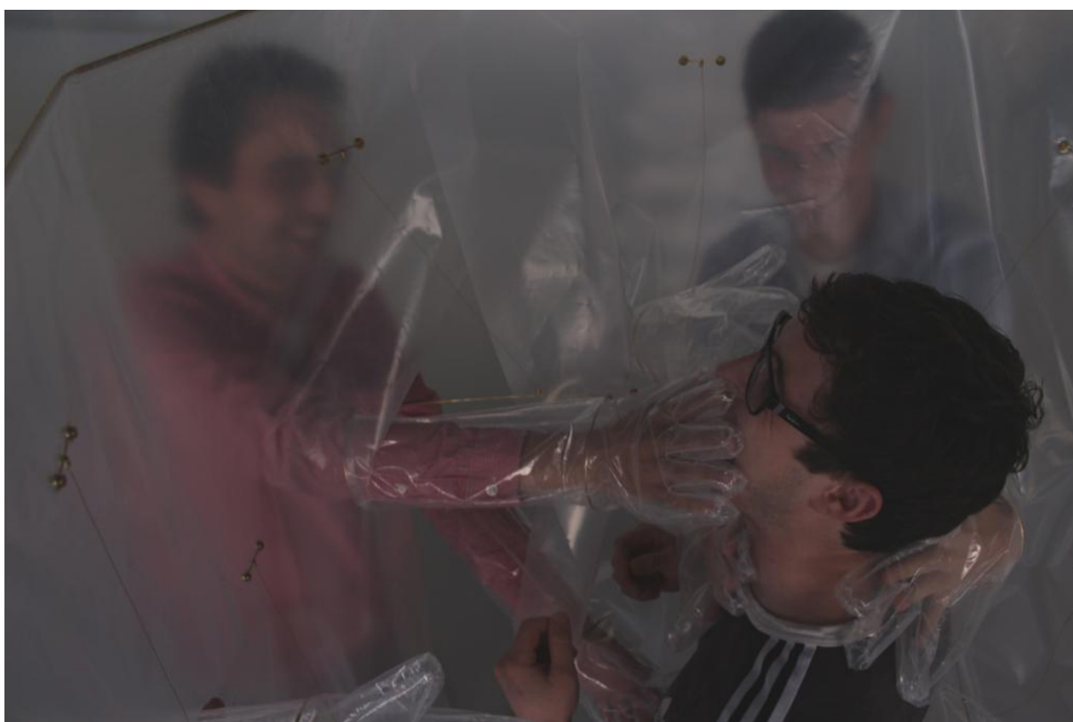
Obrázek 9: Využití "komunikačního válce"