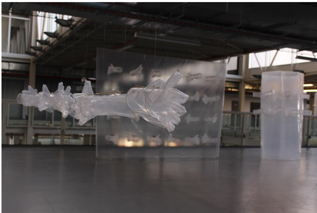
Obrázek 1: Celková instalace