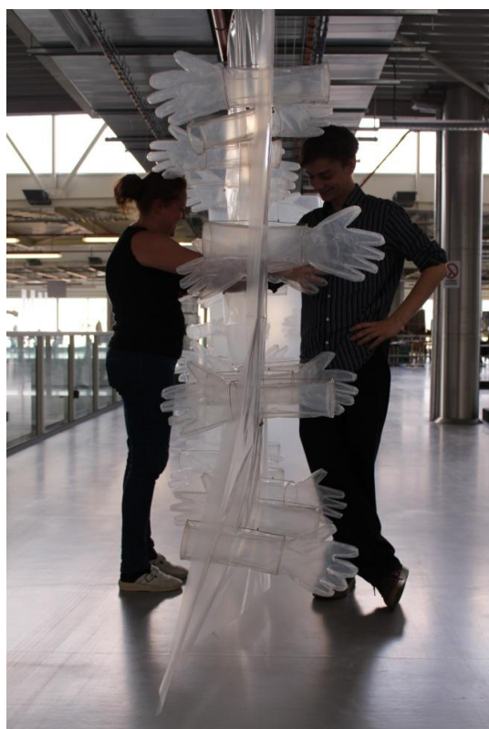
Obrázek 4: "Komunikační stěna"