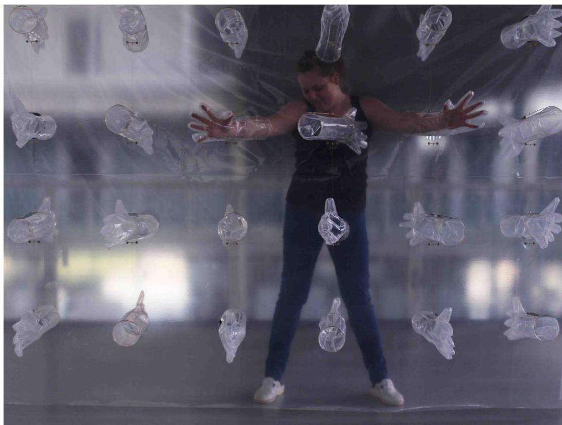
Obrázek 2: "Komunikační stěna"