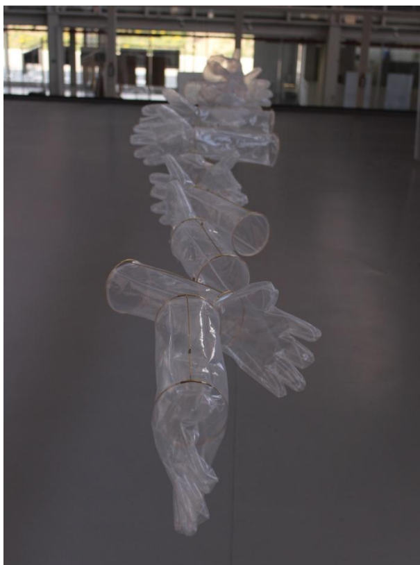
Obrázek 11: Pohled na instalaci rukavic v budově školy