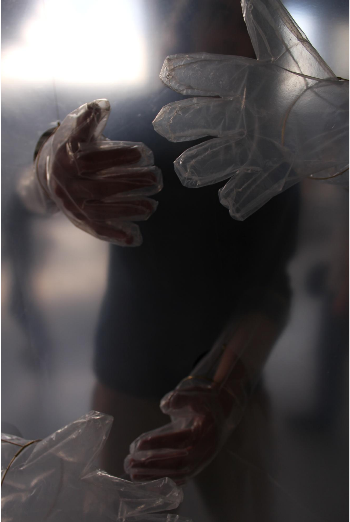
Obrázek 10: Pohled z vnitřku "válce"; foto vlastní