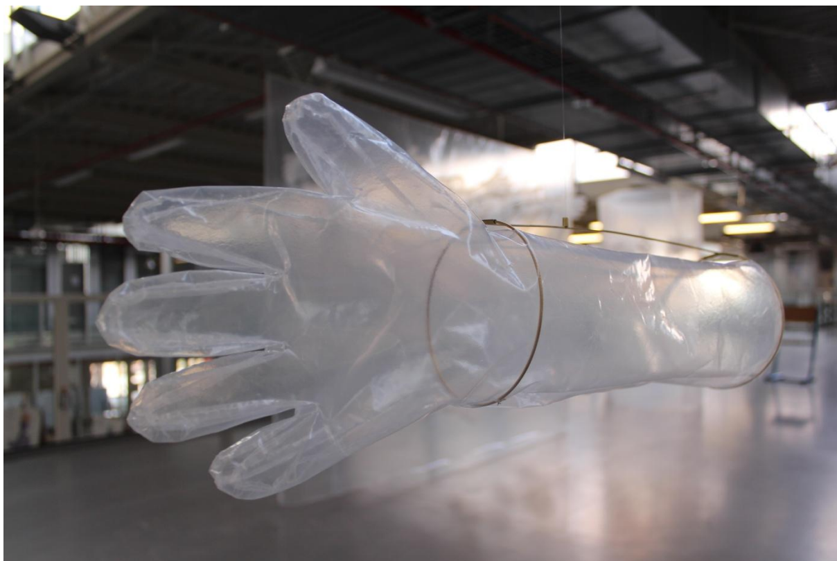
Obrázek 13: Rukavice (detail)