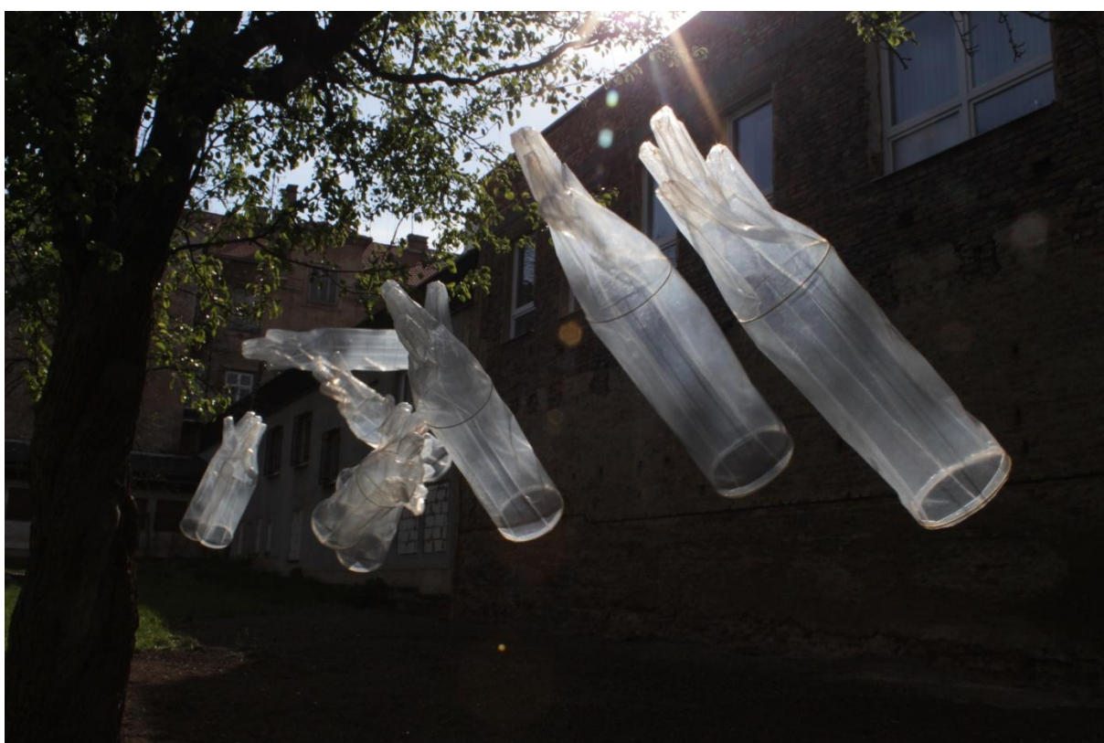
Obrázek 12: Instalace rukavic v exteriéru