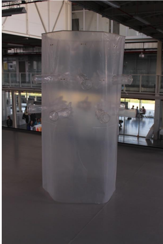
Obrázek 6: "Válec"