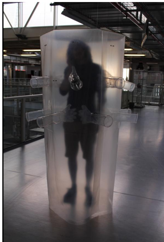
Obrázek 7: "Válec" s člověkem uvnitř