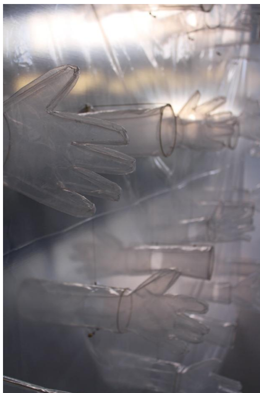
Obrázek 3: "Komunikační stěna"; foto vlastní