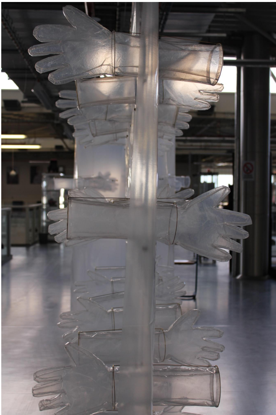
Obrázek 5: "Komunikační stěna" (detail)