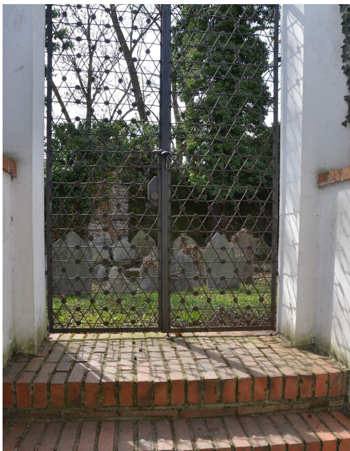
Obr. č. 12 – Starý židovský hřbitov