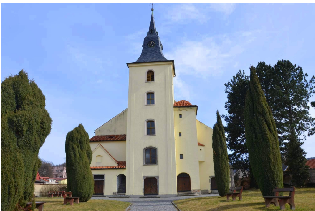
Obr. č. 10 – Kostel Nanebevzetí Panny Marie