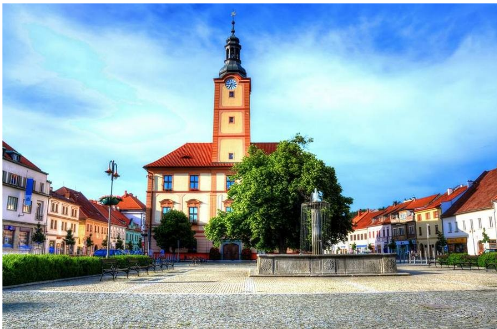
Obr. č. 3 – Radnice a radniční věž