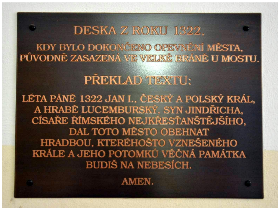
Obr. č. 2 – Překlad textu na kamenné desce