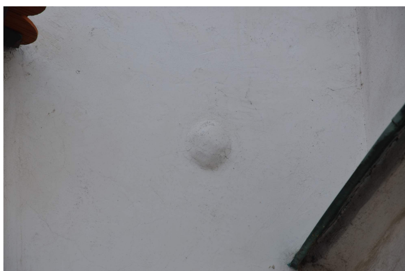
Obr. č. 9 – Údajně zabílená dělová koule z třicetileté války