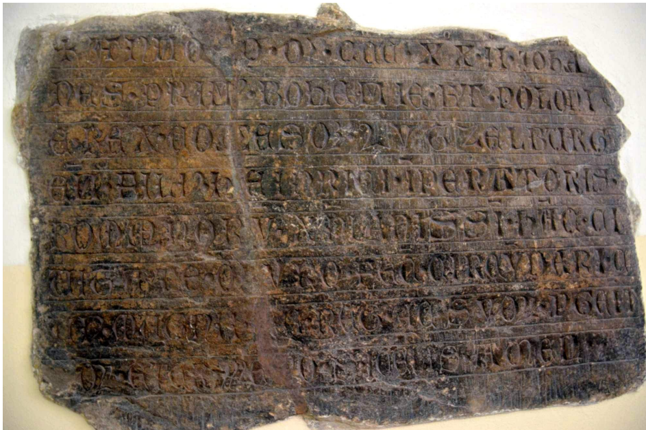
Obr. č. 1 - Kamenná deska původně umístěná v hradební zdi ve 14. století, dnes v radnici