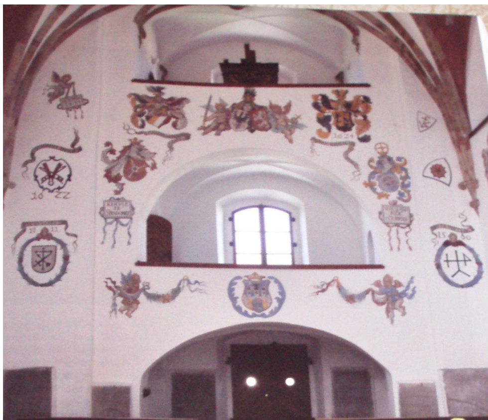
Obr. č. 11 – Výzdoba v kostele Nanebevzetí Panny Marie (znaky měšťanů ze Sušice z přelomu 16./17. století)