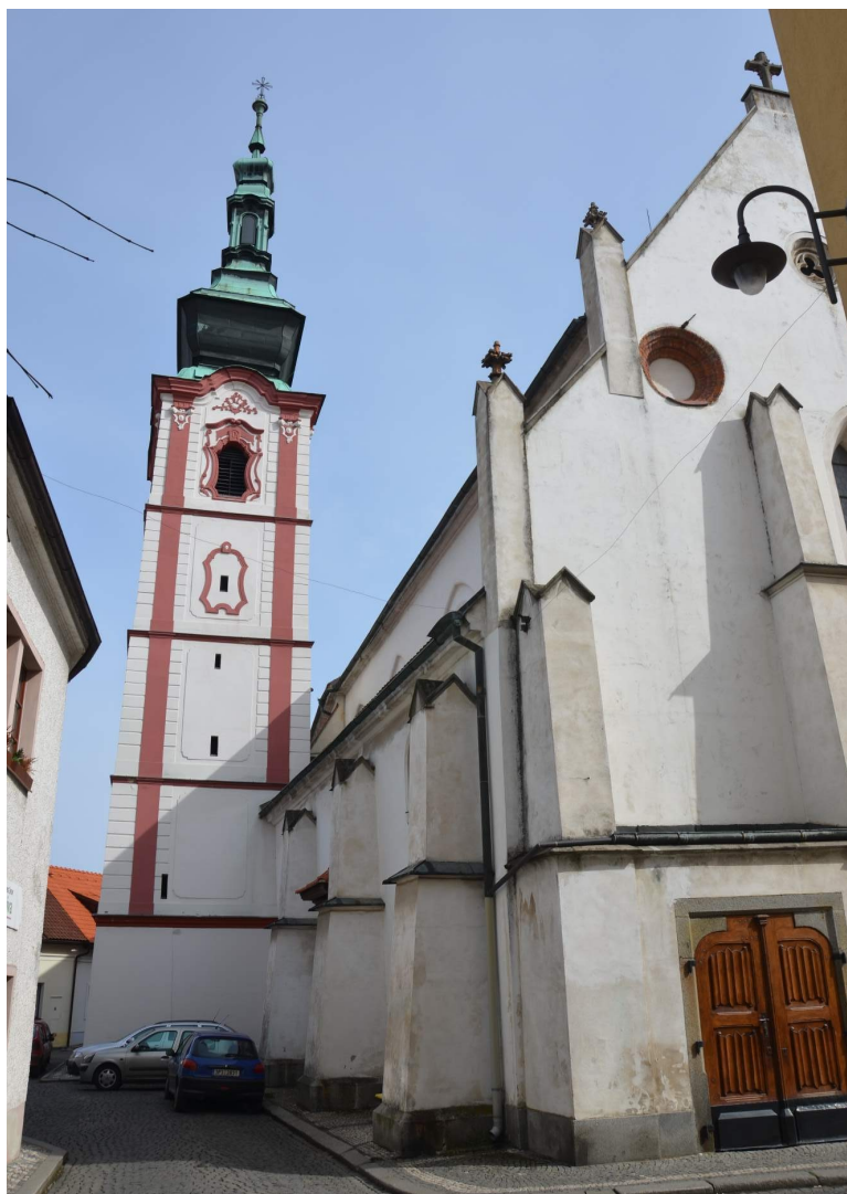
Obr. č. 8 – Kostel sv. Václava