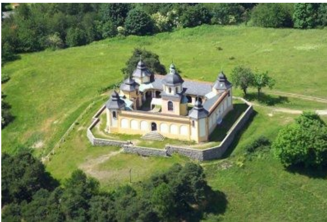
Obr. č. 19 – Kaple Anděla Strážce