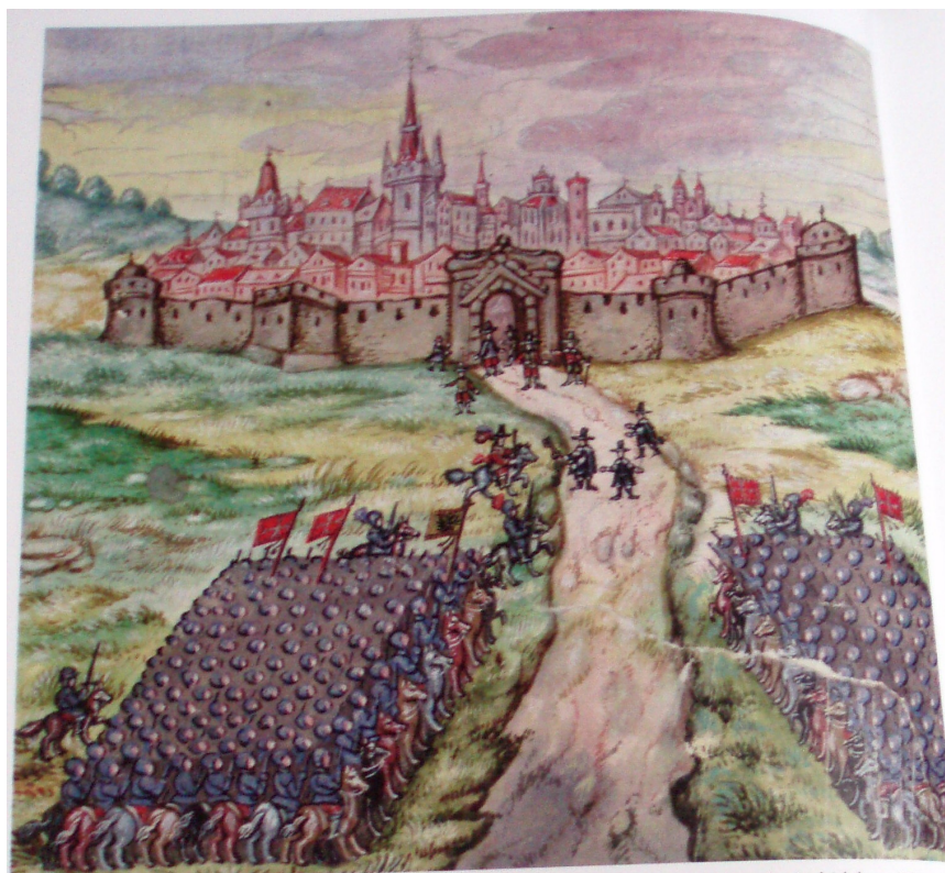
Obr. č. 13 – Zkreslený výjev předávání klíče generálu Marradasovi v roce 1620