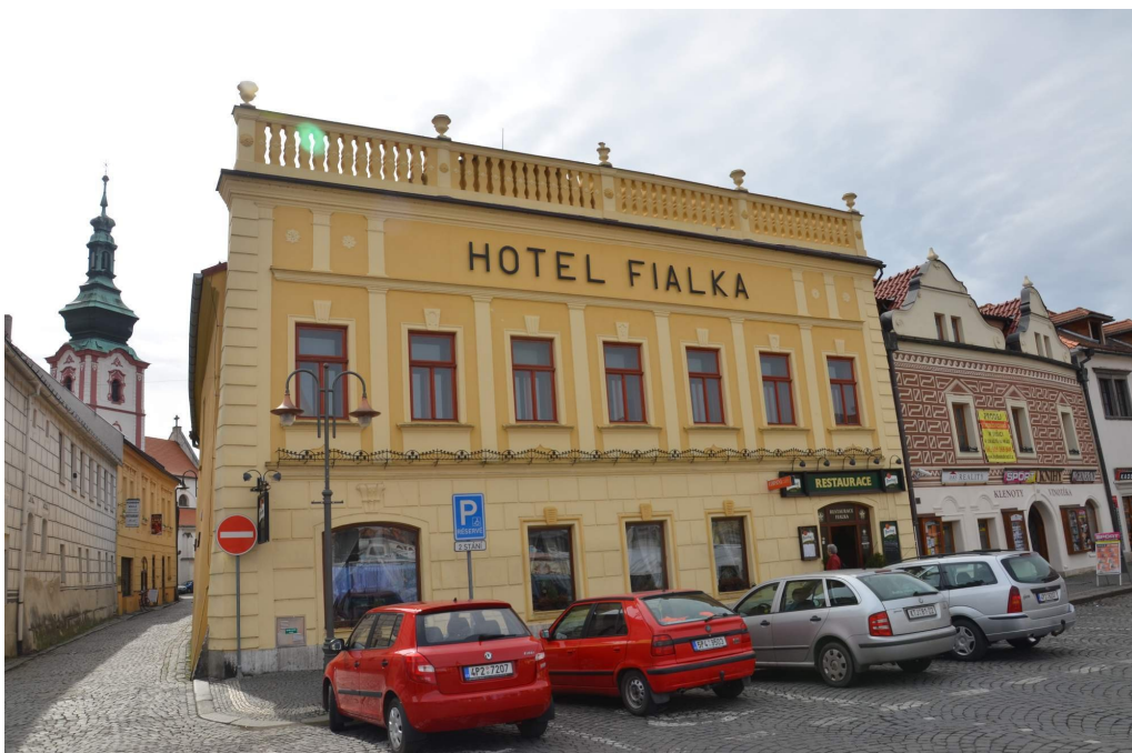
Obr. č. 7 – Krocínovský dům