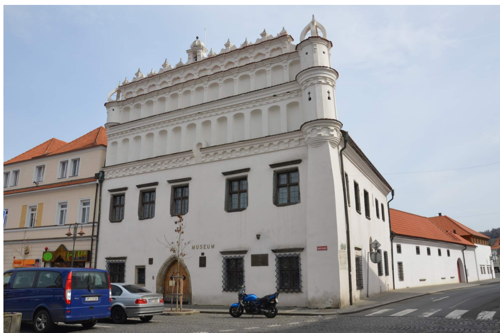
Obr. č. 4 – Voprchovský dům