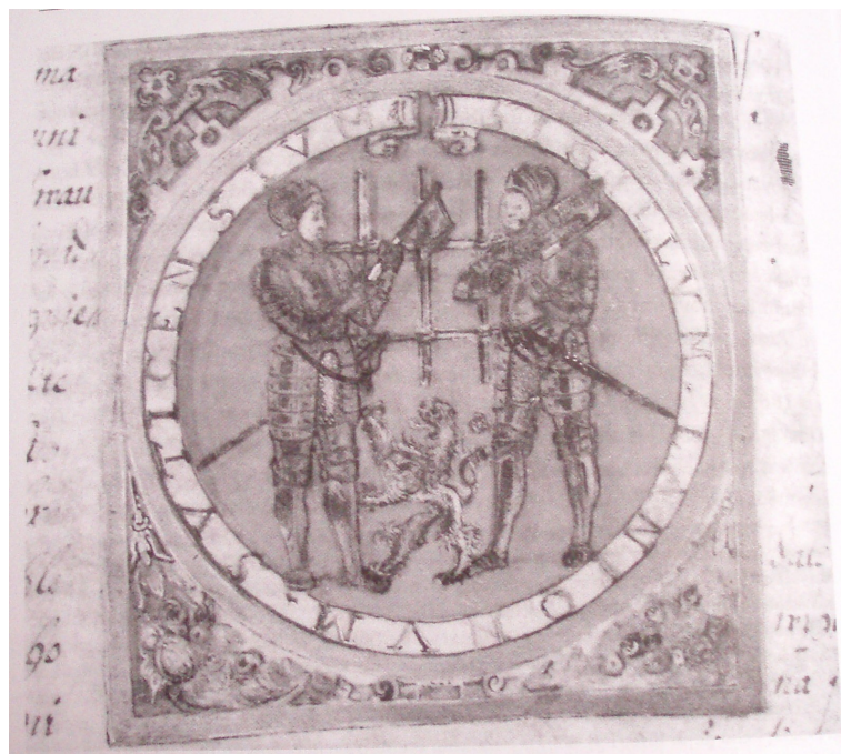
Obr. č. 17 - Erbovní znamení sušického cechu řezníků