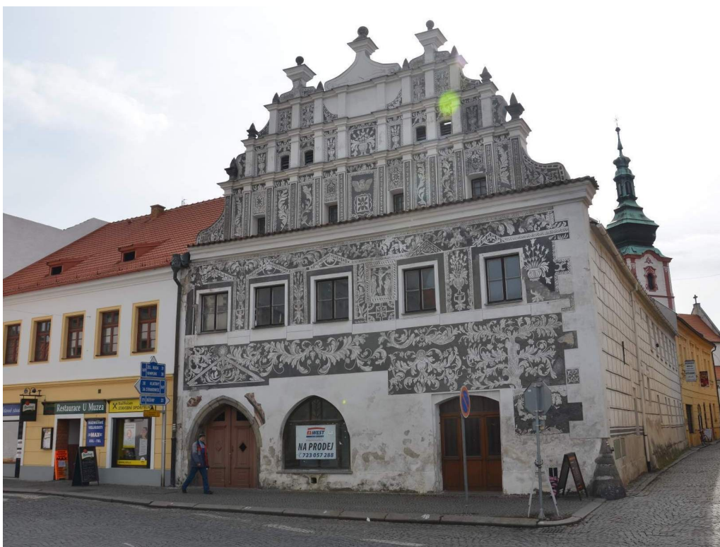
Obr. č. 6 – Rozacínovský dům