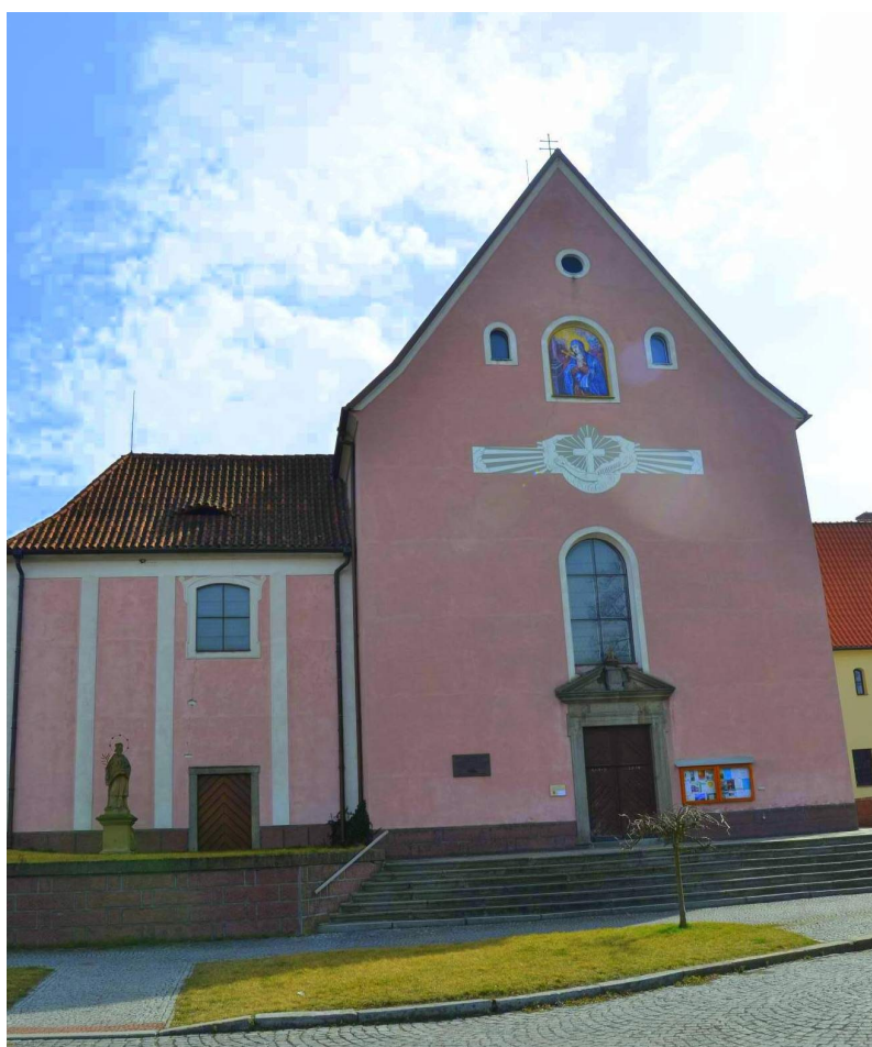
Obr. č. 18 – Kostel sv. Felixe