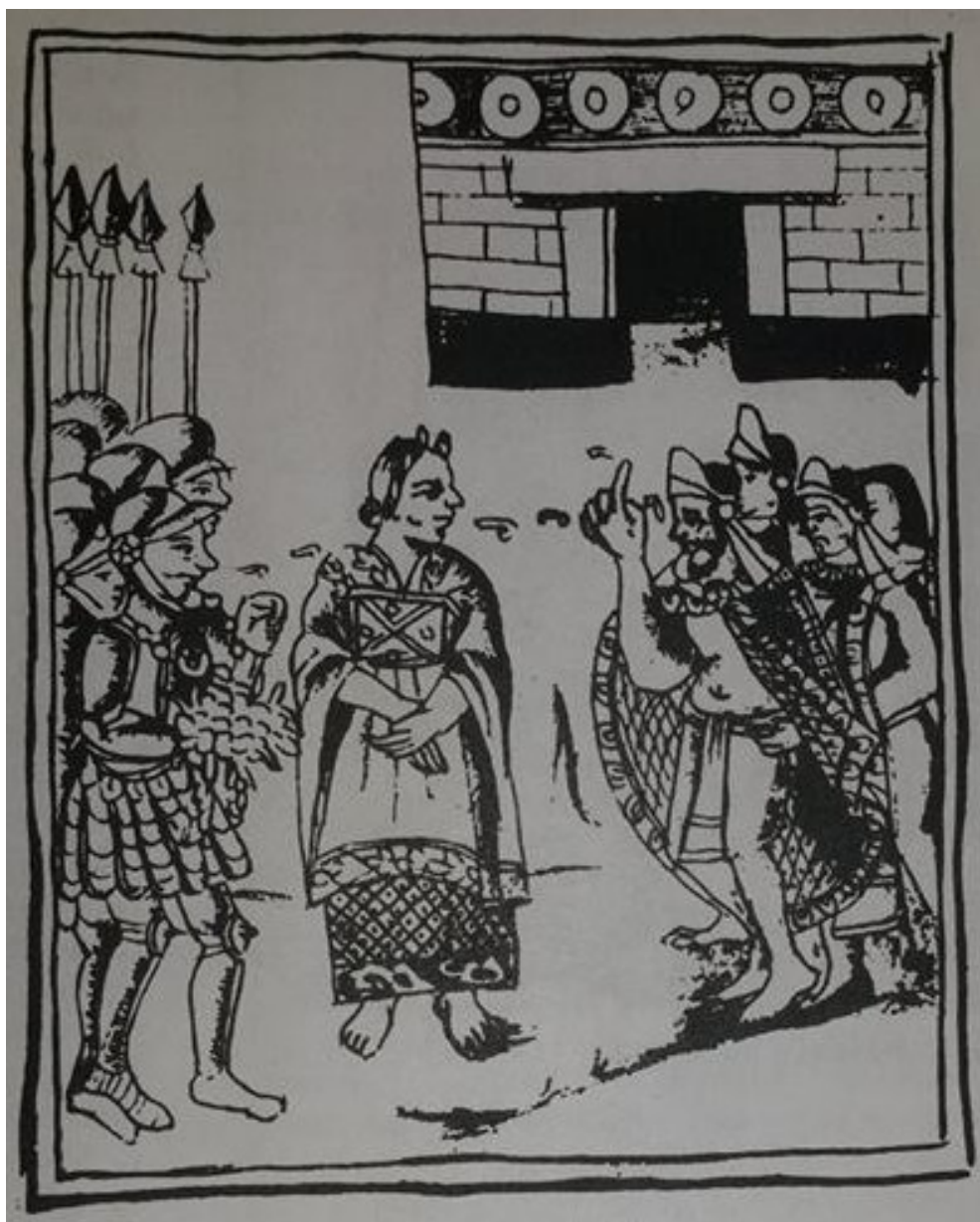
Obrázek č. 1: Malinche mezi Cortésem a Indiány