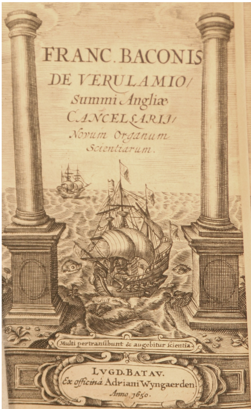
Obrázek č. 3: Titulní strana Baconovy knihy