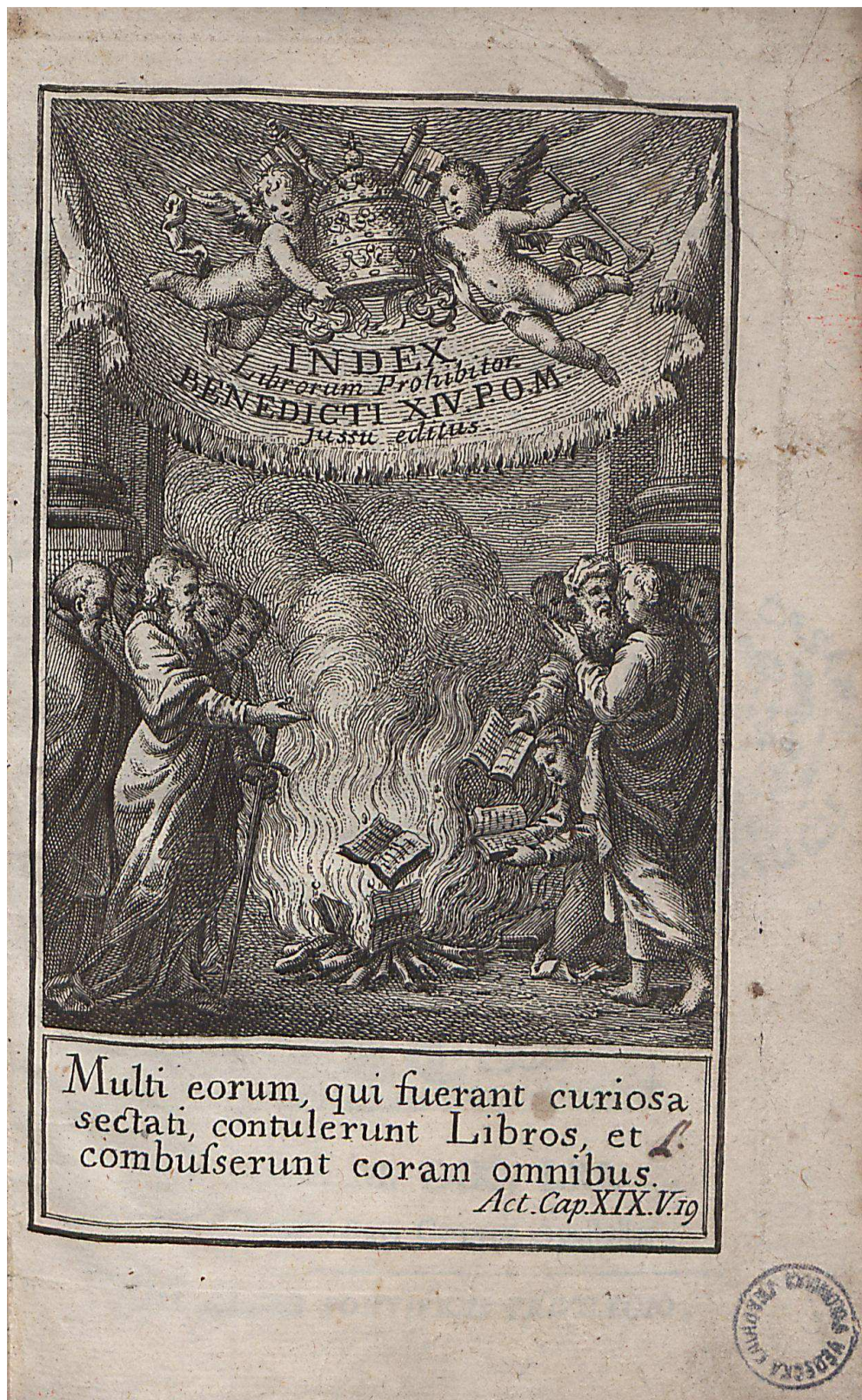
Příloha 5 - Frontispis z Index Librorum Prohibitorum z roku 1761 – Znárodnění biblické pasáže o pálení knih v Efezu s citací 19.verše 19.kapitoly Skutků apoštolů