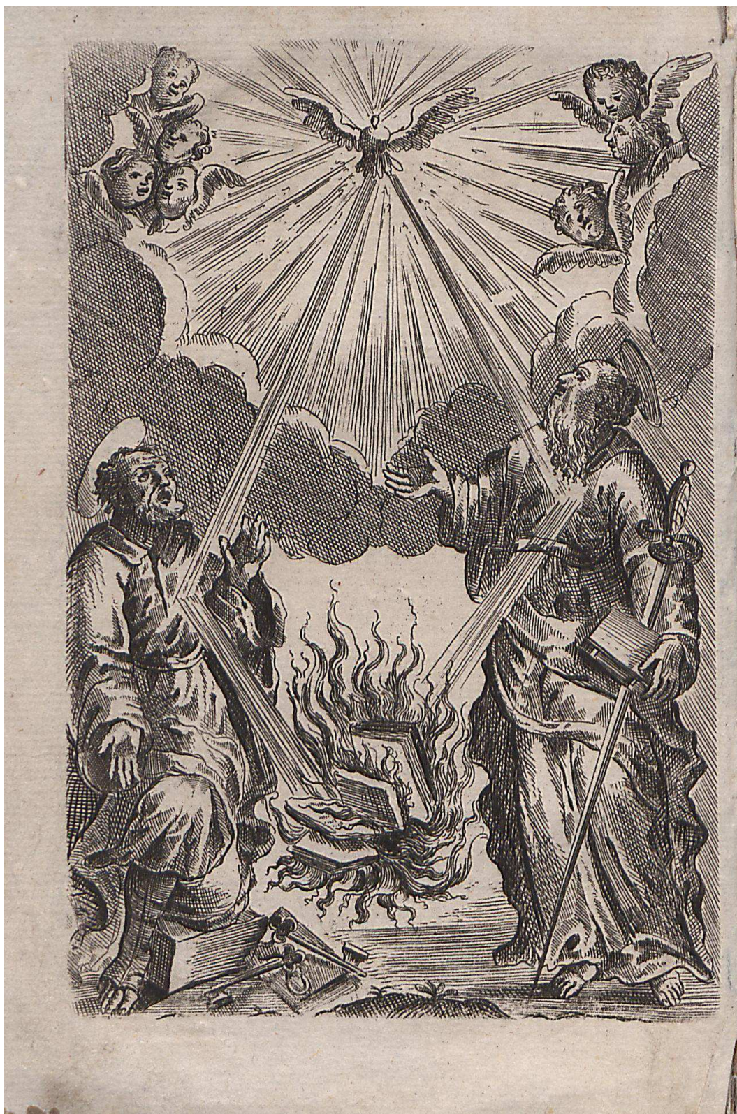
Příloha 4 - Frontispis z Index librorum prohibitorum z r. 1711