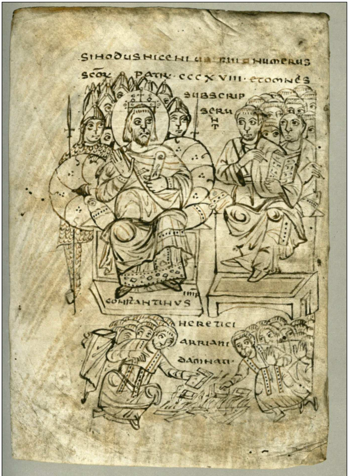
Příloha 1- Konstantin páli ariánské knihy