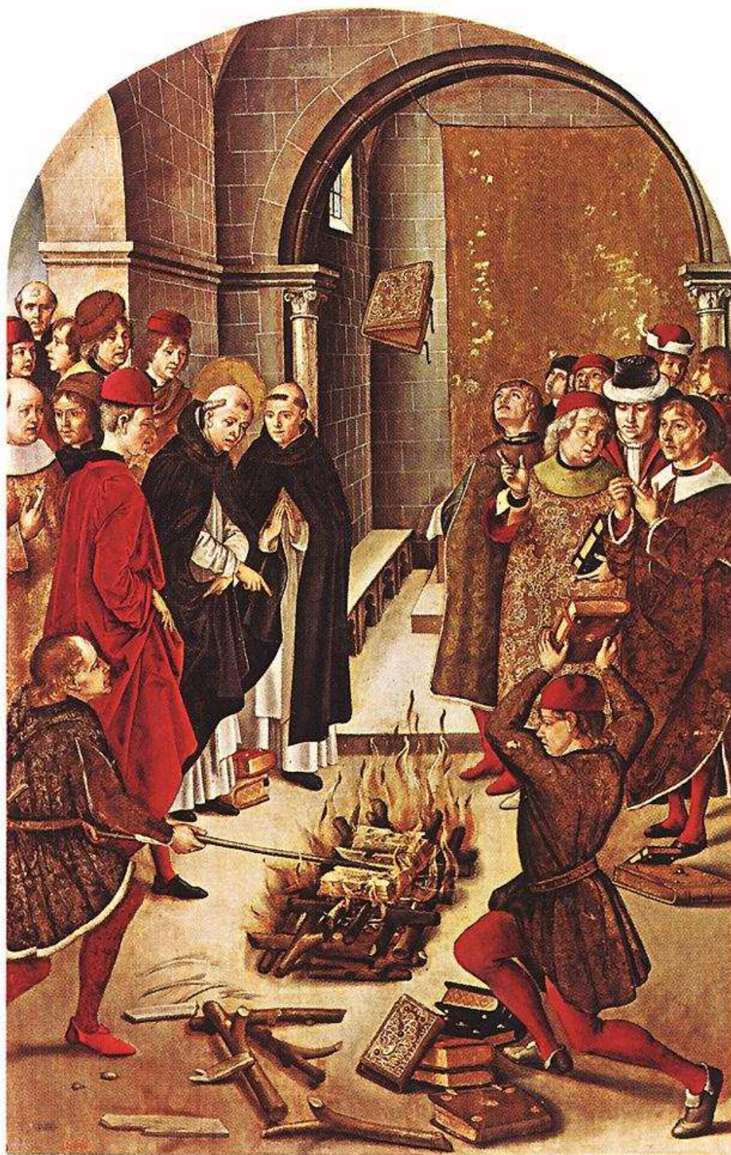
Příloha 2 – Pedro Berruguete - Svatý Dominik a albigenští