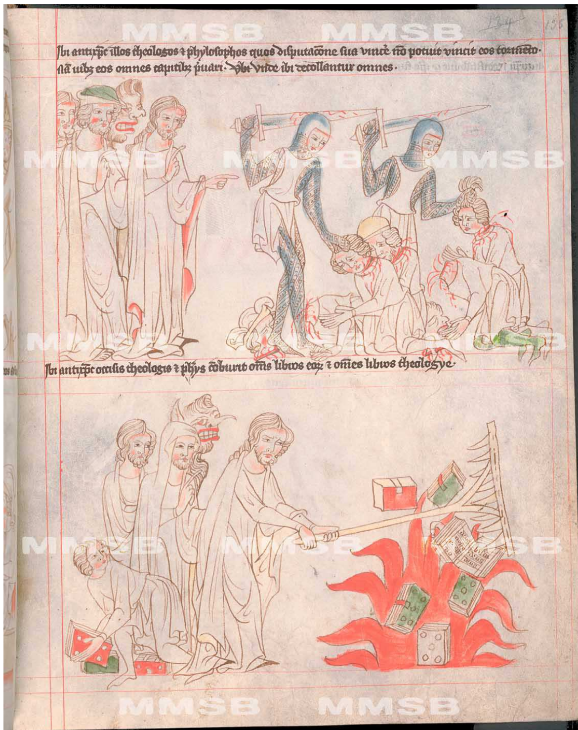
Příloha 3 - Antikrist nechává zabíjet teology, které nepřesvědčil, a pálí jejich knihy – Velislavova bible (Biblia picta Velislai) – vznik kolem roku 1340