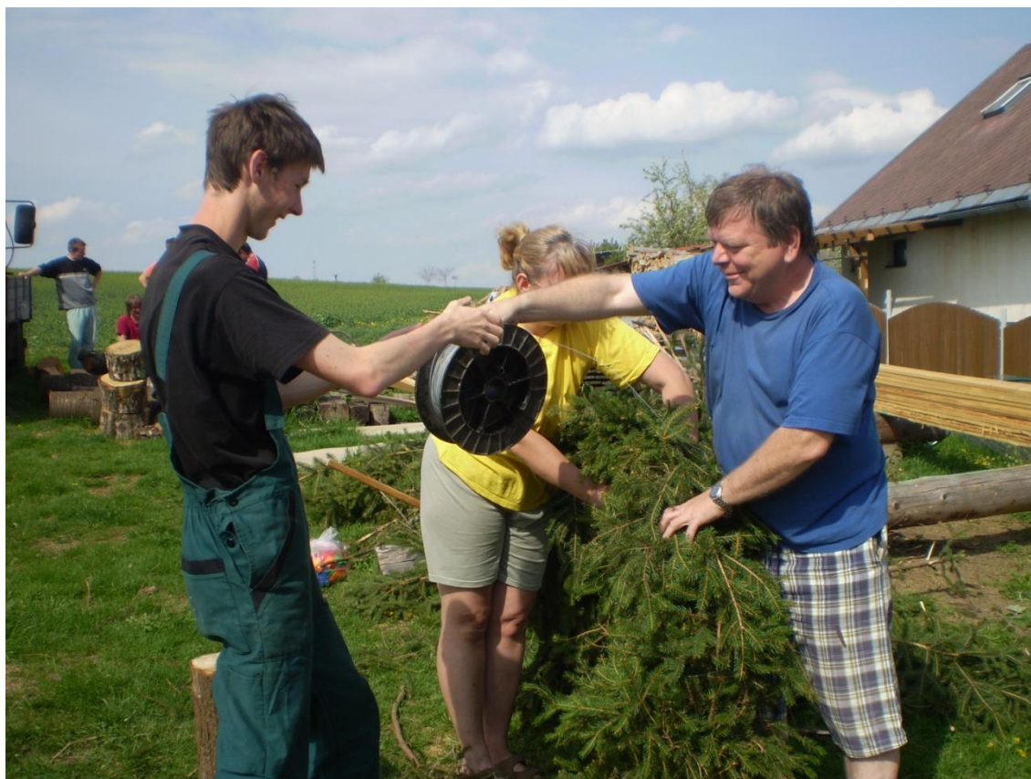
Obr. 8 Příprava věnce na Májku. (2013)