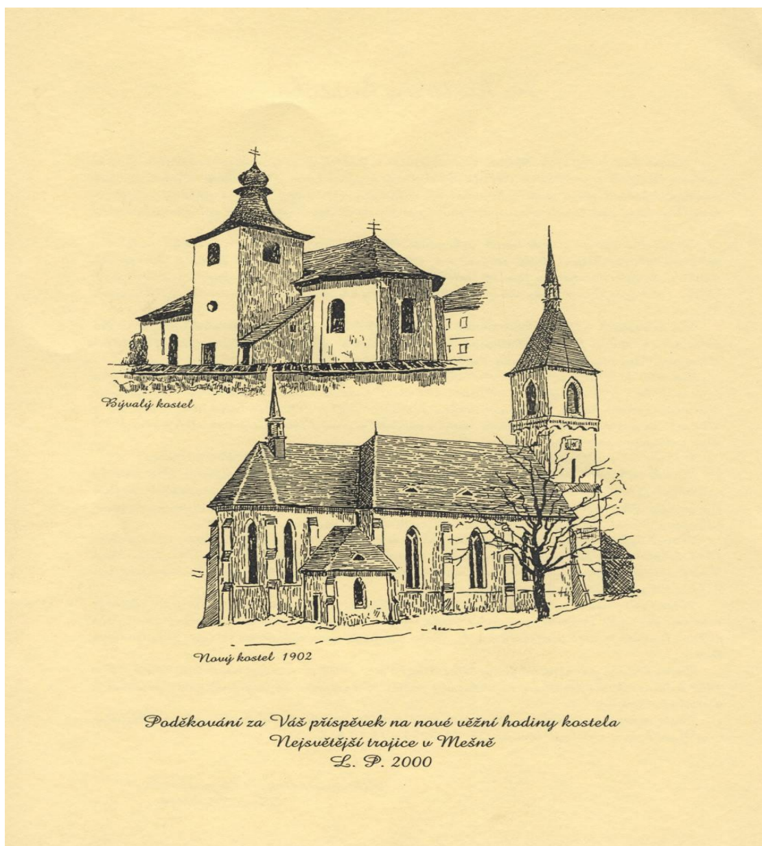
Obr. 3 Starý a nový kostel. (2000)