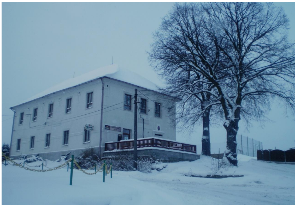
Obr. 5 Místní klub Pohoda. (2012)