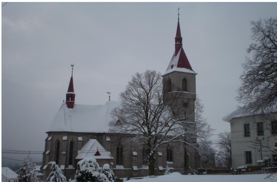
Obr. 4 Kostel Nejsvětější trojice. (2012)