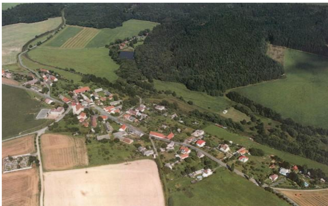
Obr. 1 Letecký snímek obce Mešno. (2005)