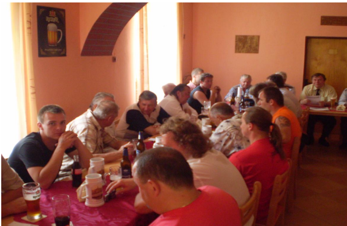
Obr. 6 Hasičská schůze. (2013)