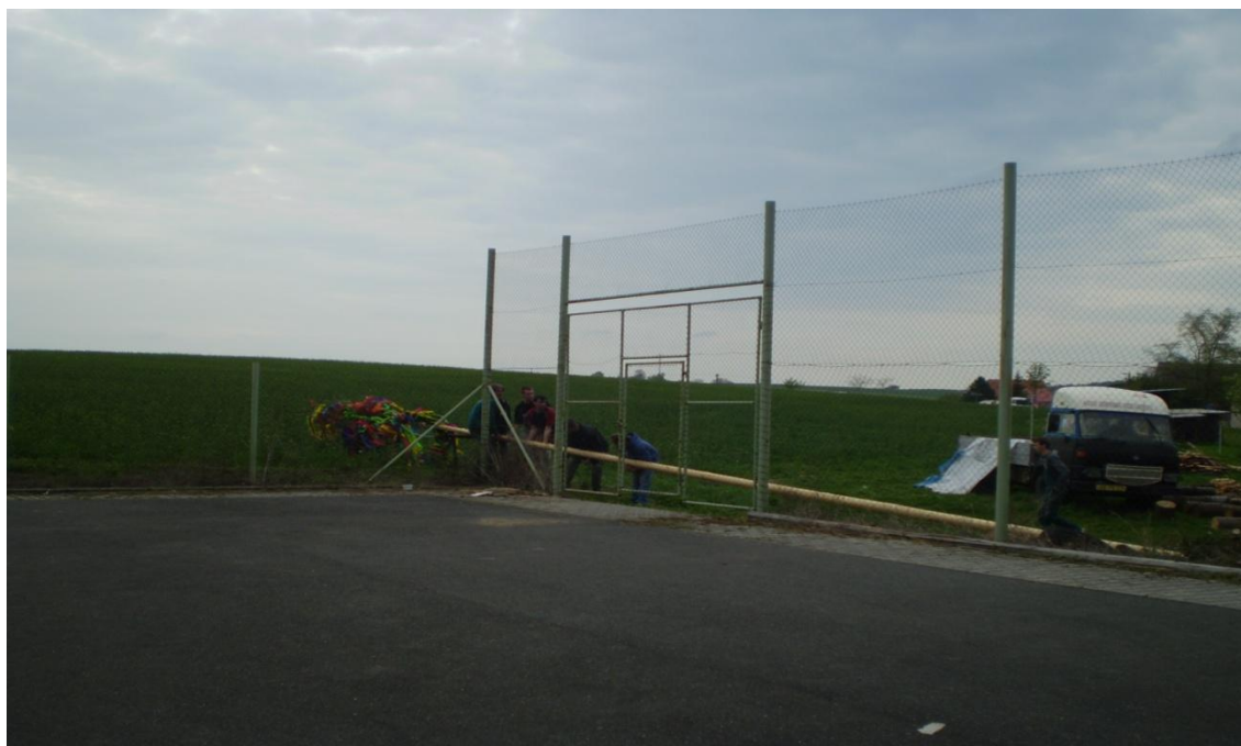
Obr. 9 Stavění Májky