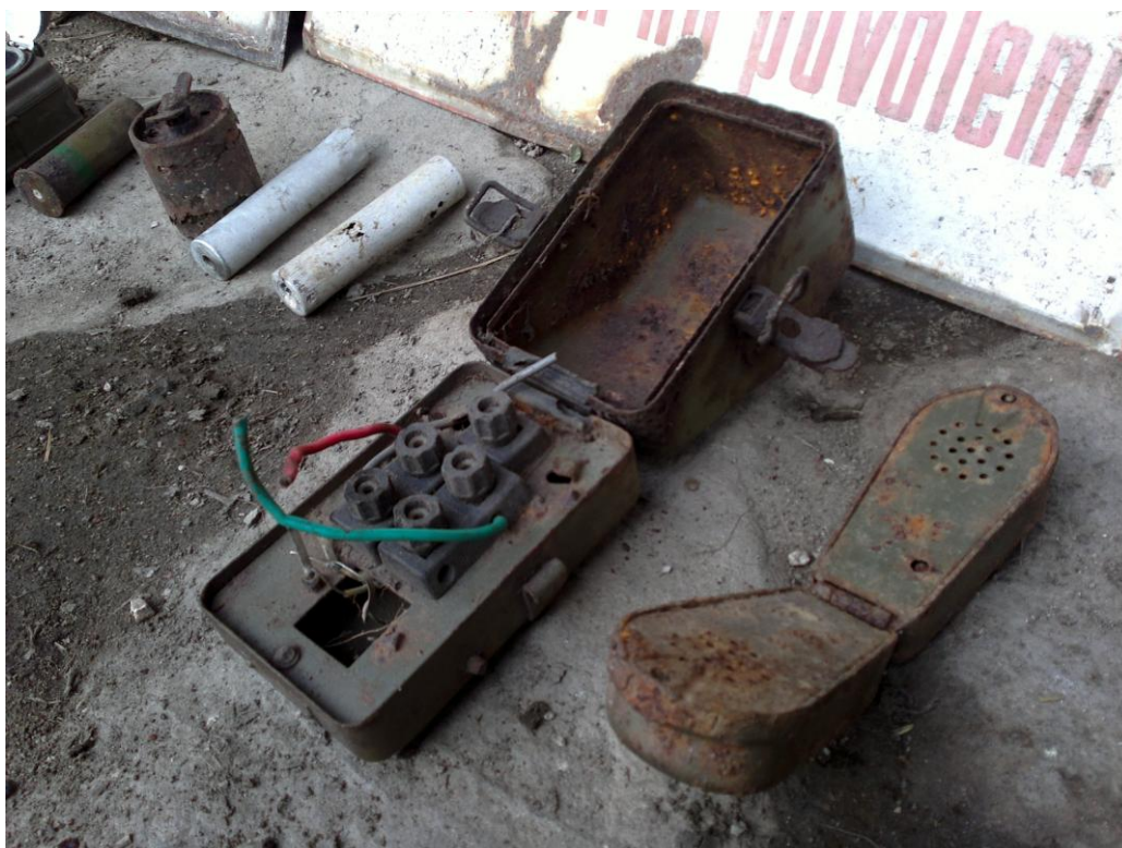
Fotografie 1: Příklady artefaktů nalezených při povrchovém sběru v bývalém hraničním pásmu. Zprava: pojítka sloužící pro komunikaci členů hlídky (sluchátko, přístroj pro zapojení sluchátka), světlice, dýmovnice. (Soukromá sbírka Jana Plášíla, Autor fotografie: Jan Straka)