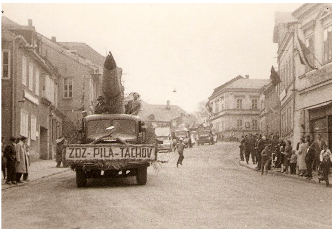
Fotografie 3: Alegorický vůz tachovské pily s raketou. Oslavy 1. máje. 50. léta, Tachov.