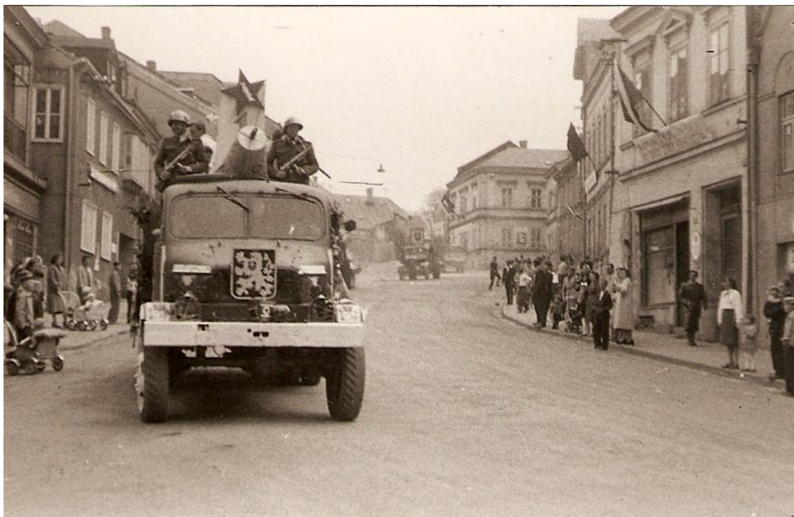
Fotografie 2: Alegorický vůz československé armády. Oslavy 1. máje. 50. léta, Tachov.