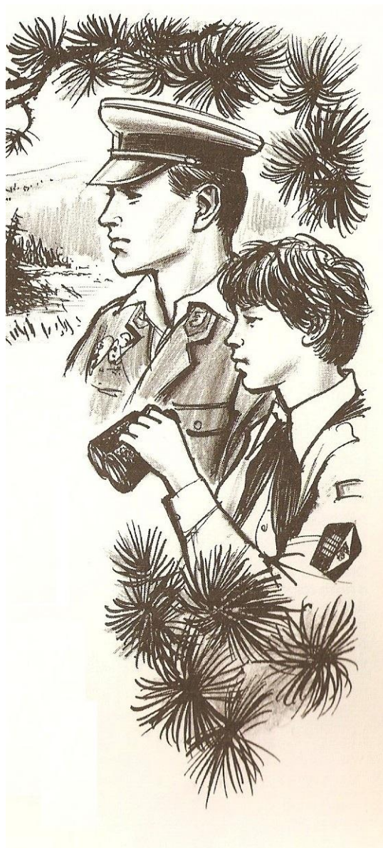
Obr. 1: Kresba zobrazující člena Mladých strážců hranic na hlídce s pohraničником (Zdroj: Míka, Václav; Kolečkář, Vladimír: 1982. Mladí strážci hranic . Naše vojsko: Praha. S. 55)