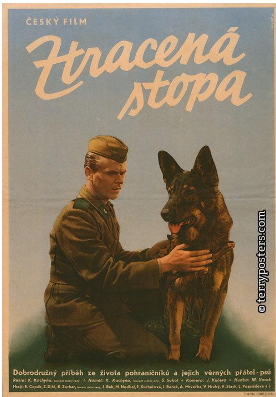
Obr 3: Plakát filmu Ztracená stopa