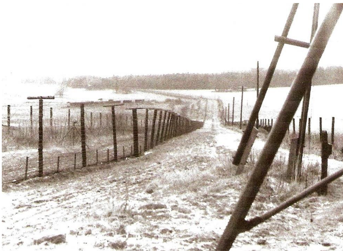
Fotografie 8: Již opuštěná signální stěna poblíž Pavlova Studence. Začátek roku 1990.