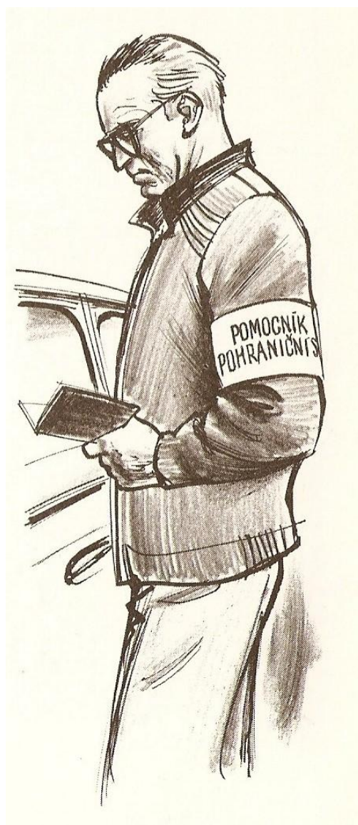
Obr. 2: Kresba zobrazující člena Pomocníků Pohraniční stráže při kontrole dokladů (Zdroj: Míka, Václav; Kolečkář, Vladimír: 1982. Mladí strážci hranic . Naše vojsko: Praha. S. 31)