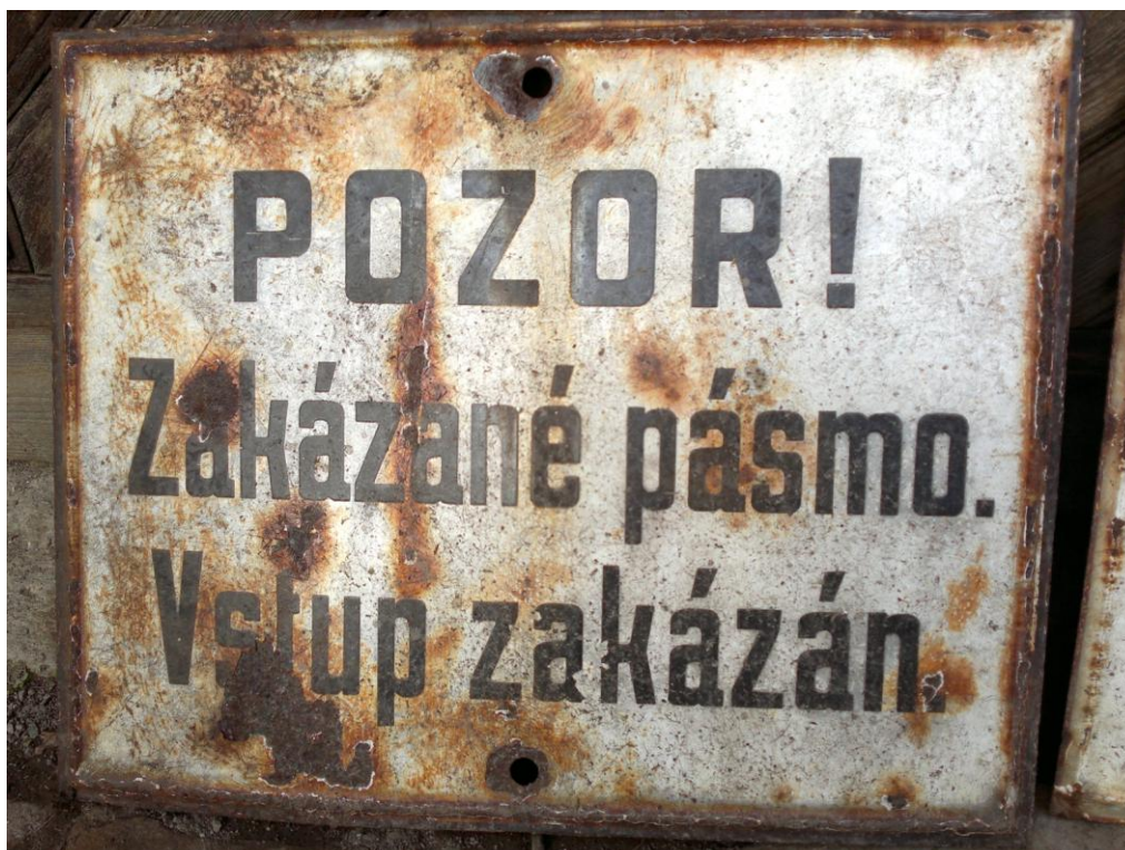
Fotografie 7: Cedule s černým nápisem vymežující zakázané pásmo