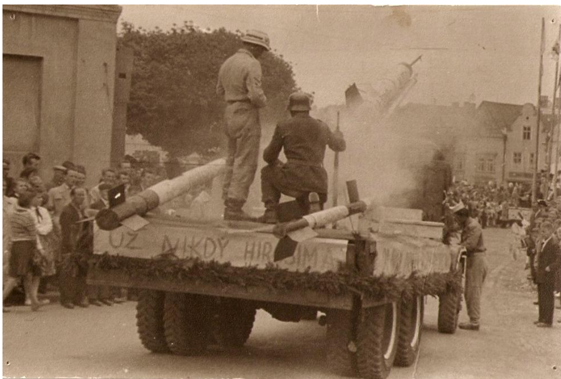
Fotografie 5: Alegorický vůz armády USA s raketami a nápisem UŽ nikdy Hirošima. Oslavy 1. máje. 50. léta, Tachov.