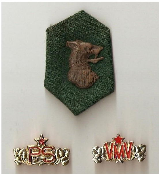
Obr. 6: Límčové označení (nahore) a součást hodnostního označení příslušníků PS (dole)