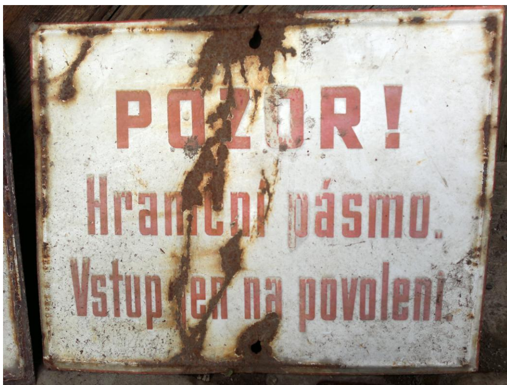
Fotografie 6: Cedule s červeným nápisem vymežující hraniční pásmo