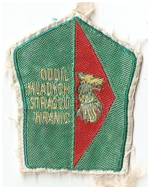
Obr. 7: Nášivka člena oddílu Mladých strážců hranic