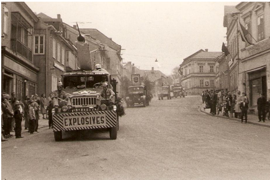
Fotografie 4: Alegorický vůz armády USA s raketami. Oslavy 1. máje. 50. léta, Tachov.