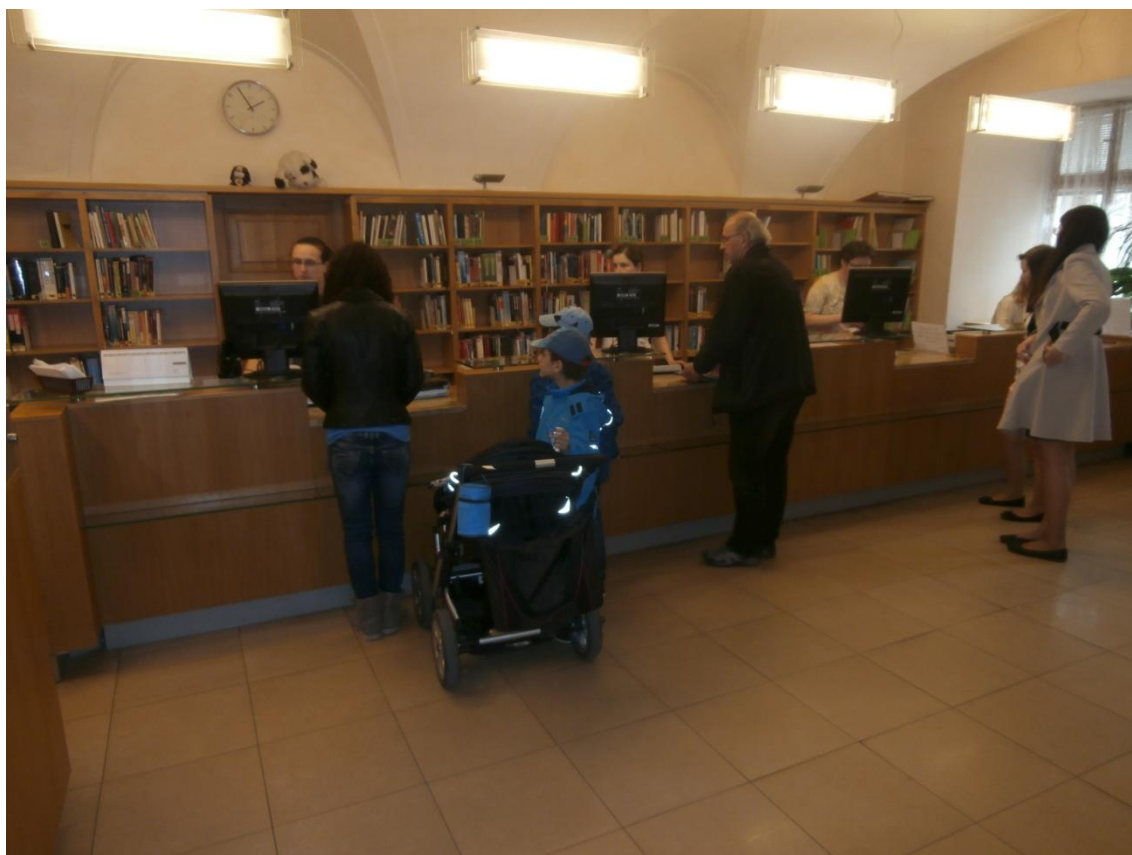
Obrázek č. 7 - Výpůjční pult.