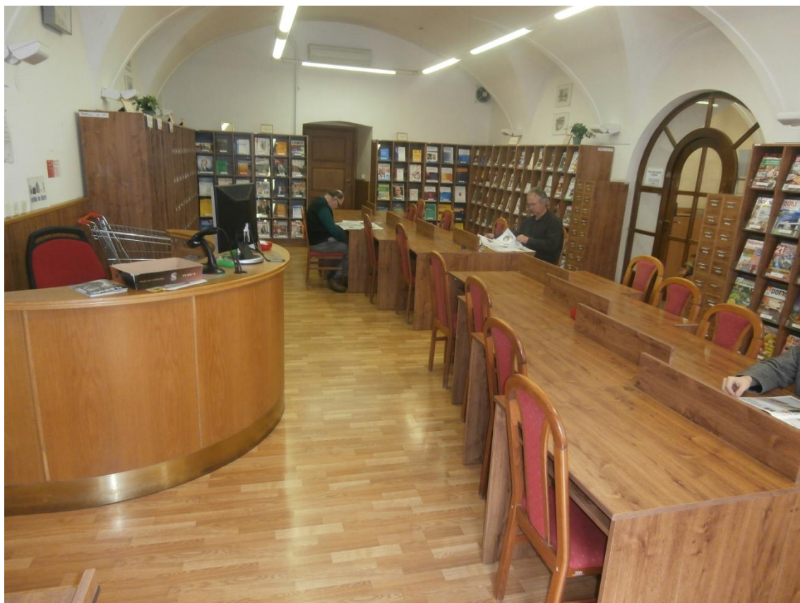
Obrázek č. 8 - Čítárna časopisů.