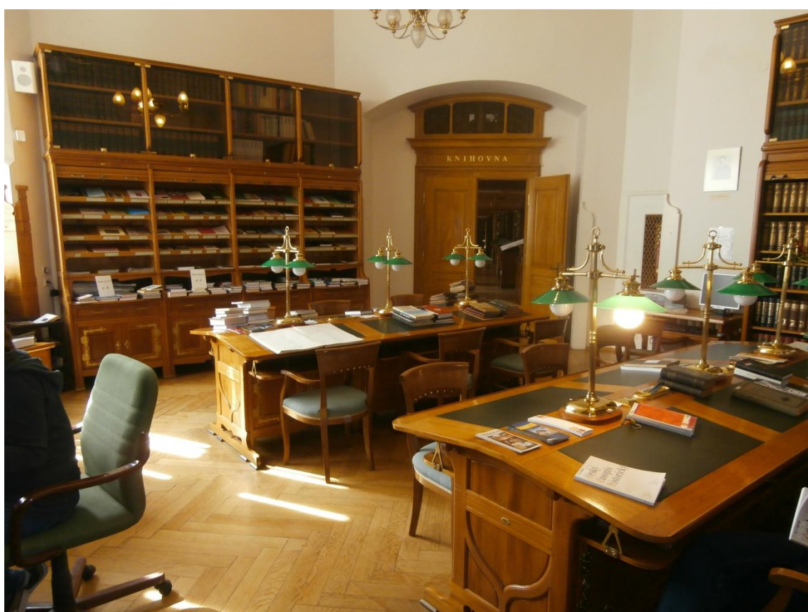
Obrázek 17 - Studovna.