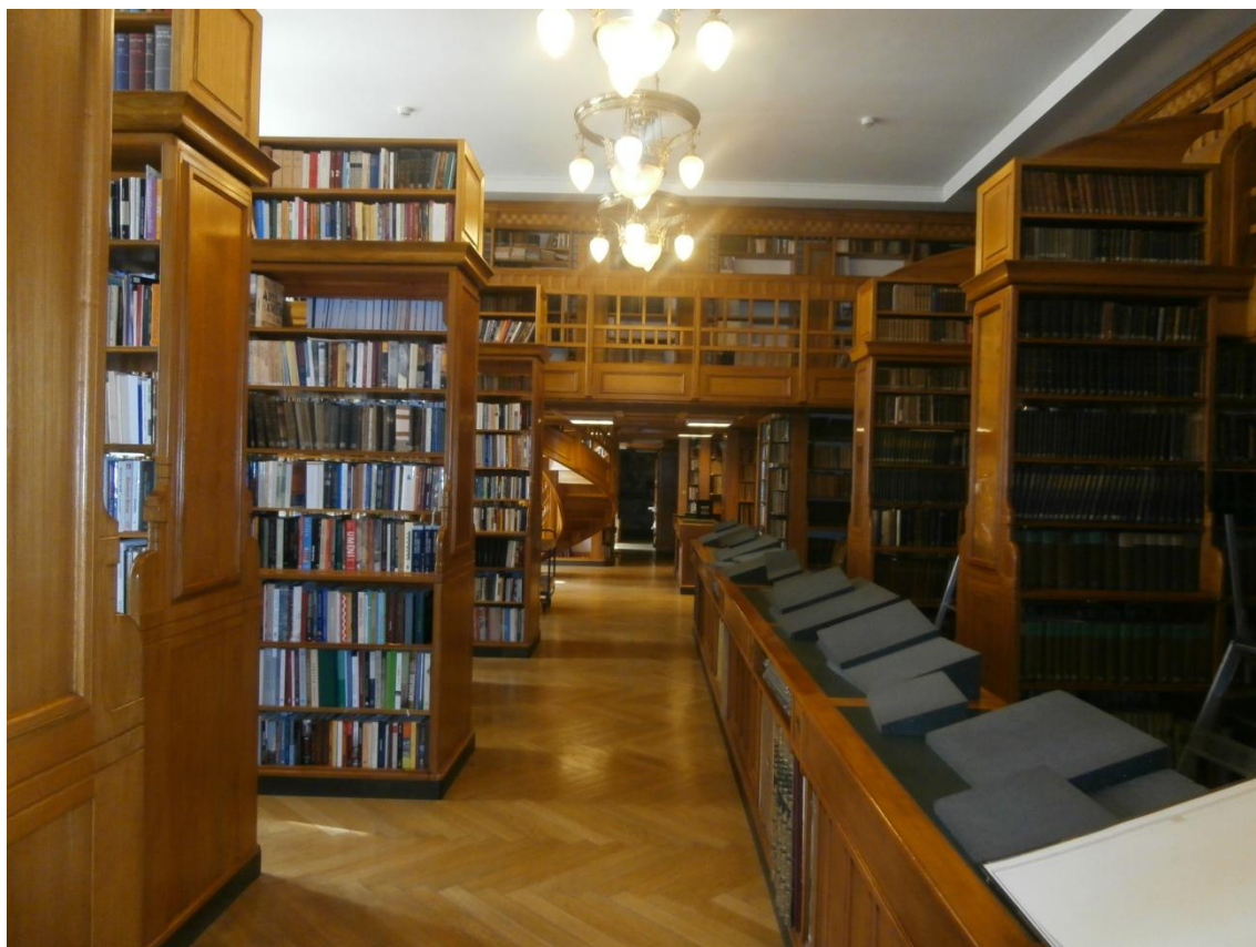
Obrázek č. 16 - Knihovna I.