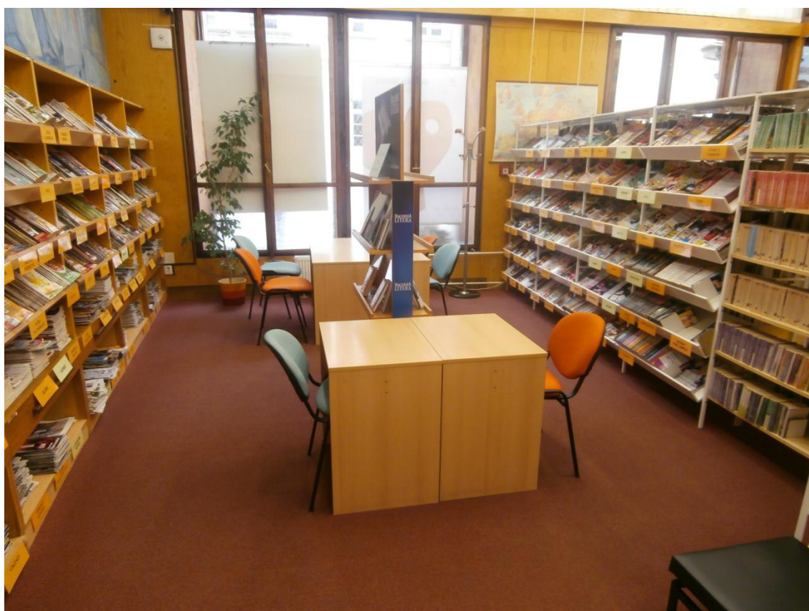
Obrázek č. 3 - Oddělení časopisů v Ústřední knihovně pro dospělé.