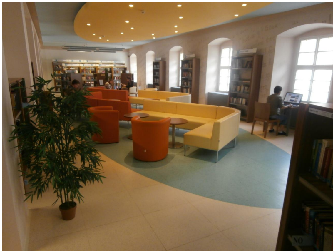
Obrázek č. 12 - Volný výběr knih II.