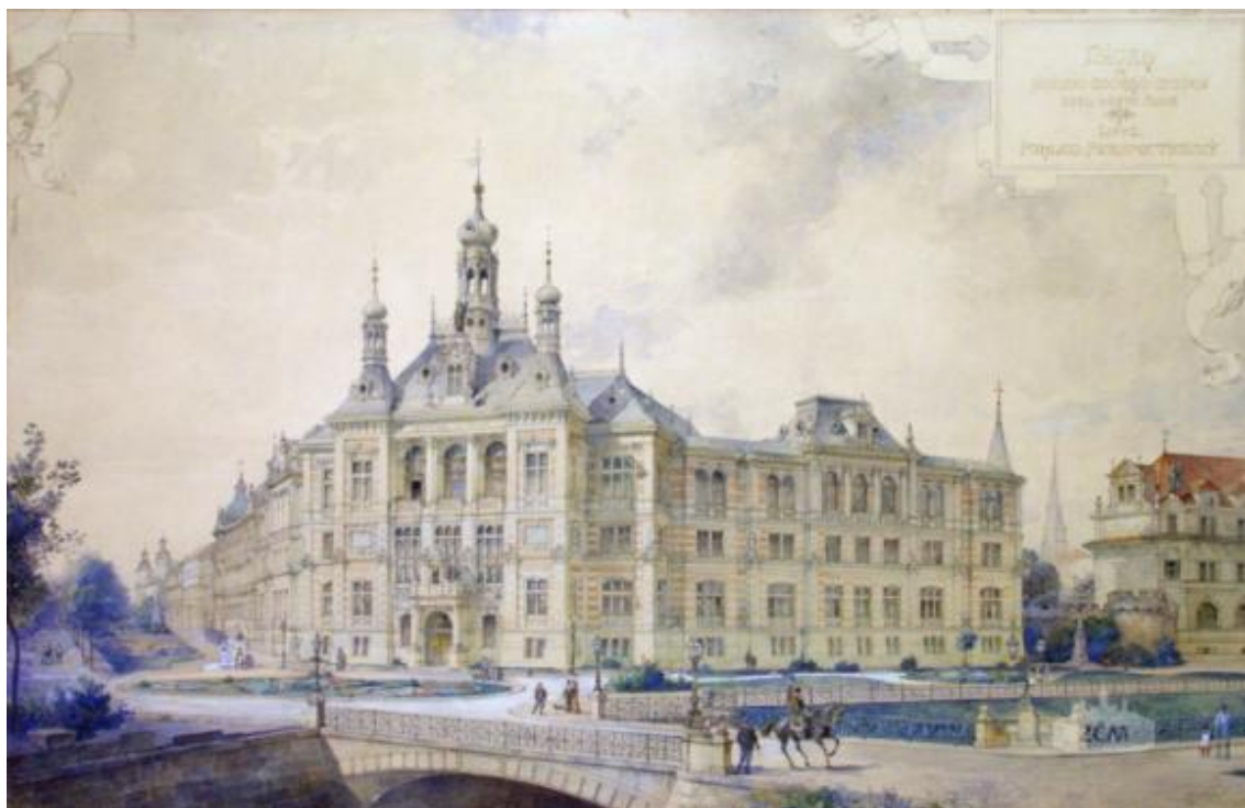
Obrázek č. 14 - Dobová fotografie budovy.