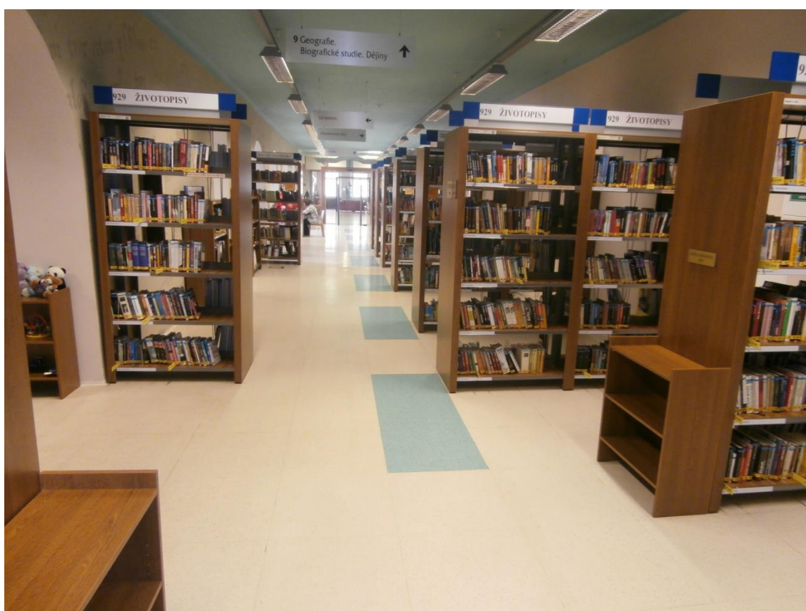
Obrázek č. 11 - Volný výběr knih I.