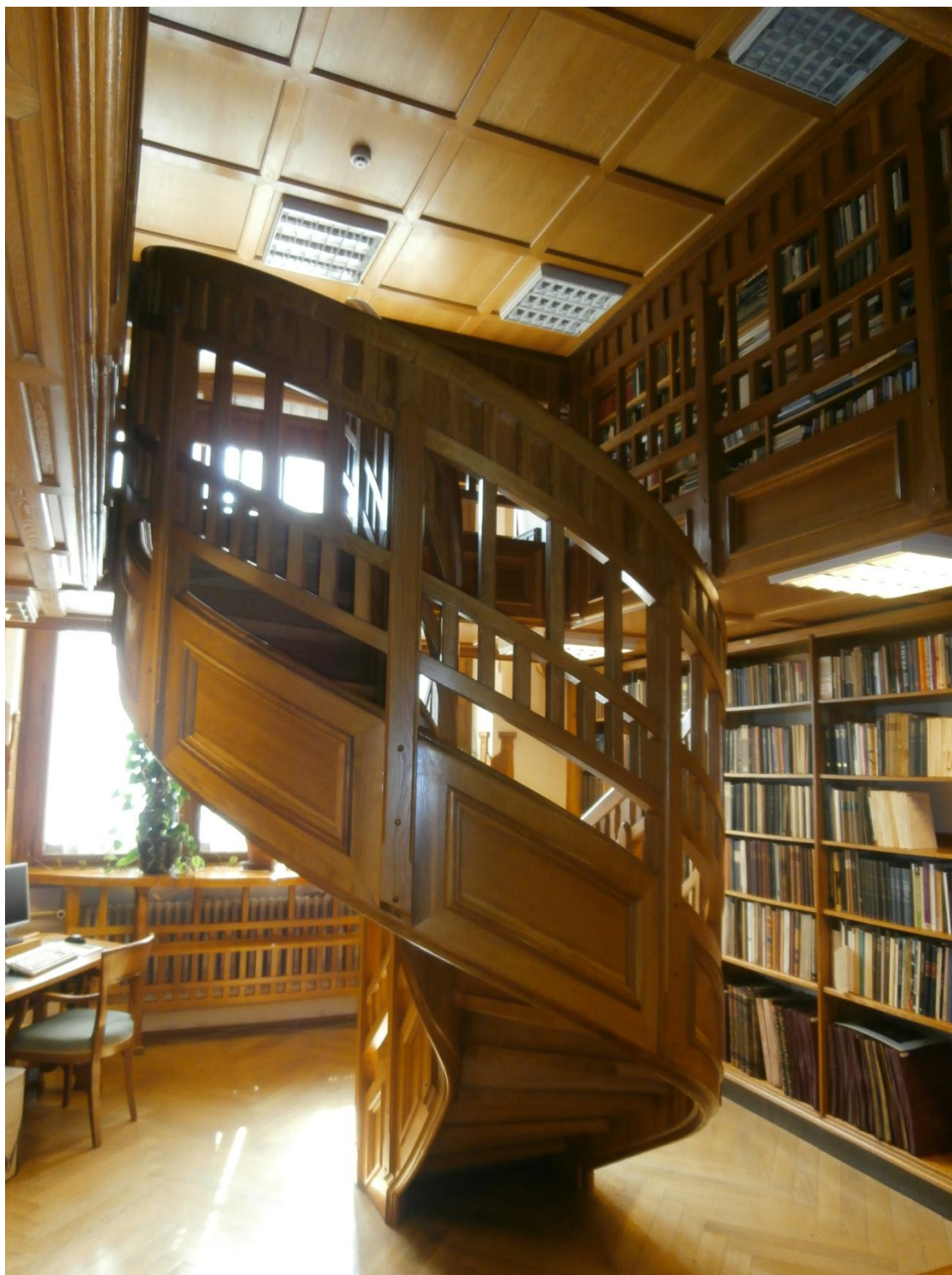
Obrázek č. 18 - Knihovna II.