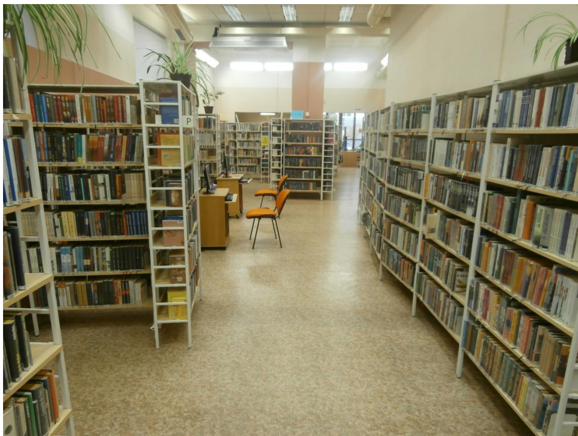
Obrázek č. 2 - Volný výběr knih v Ústřední knihovně pro dospělé.