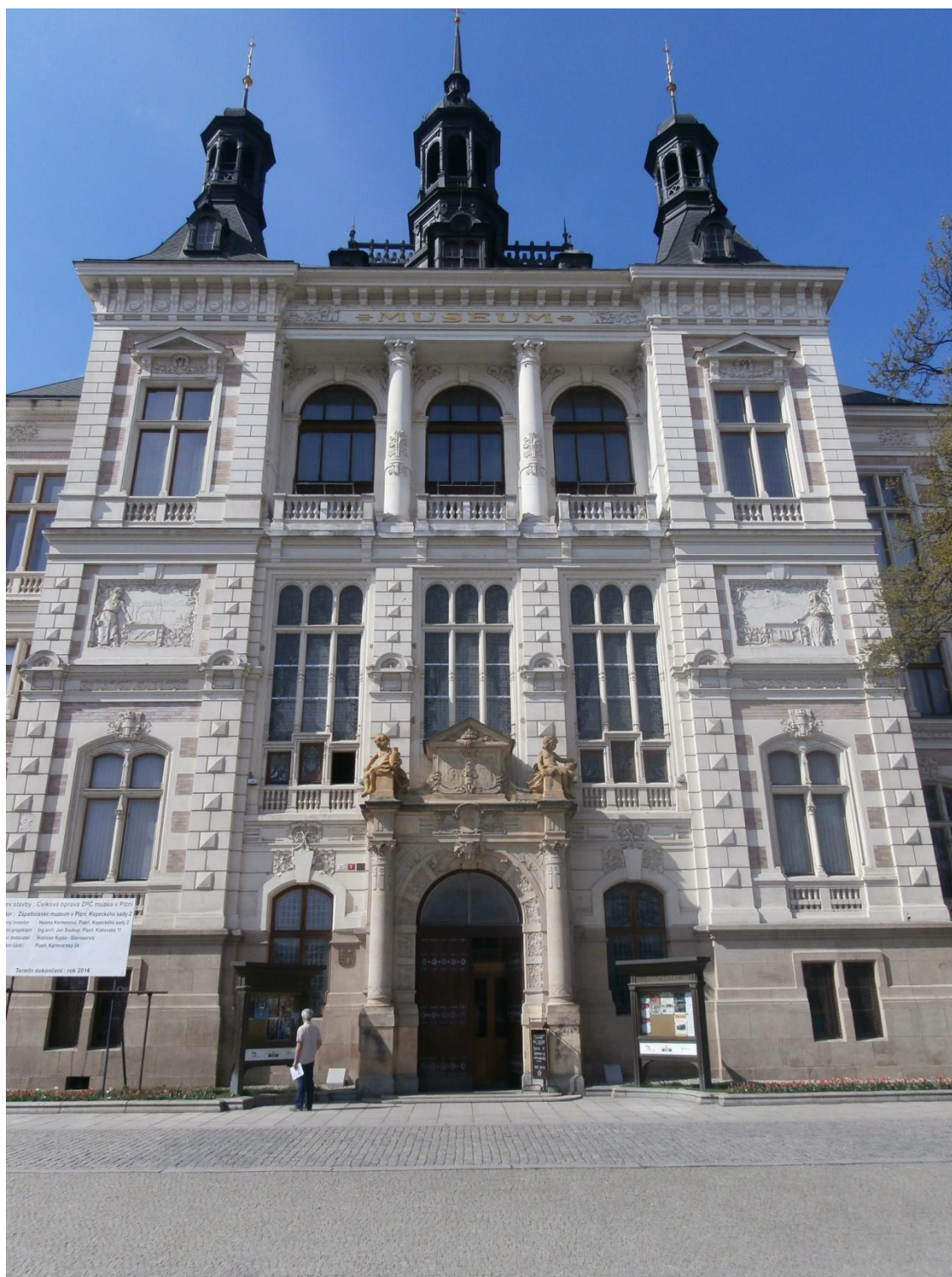
Obrázek č. 13 - Budova Západočeského muzea, ve které knihovna sídlí.