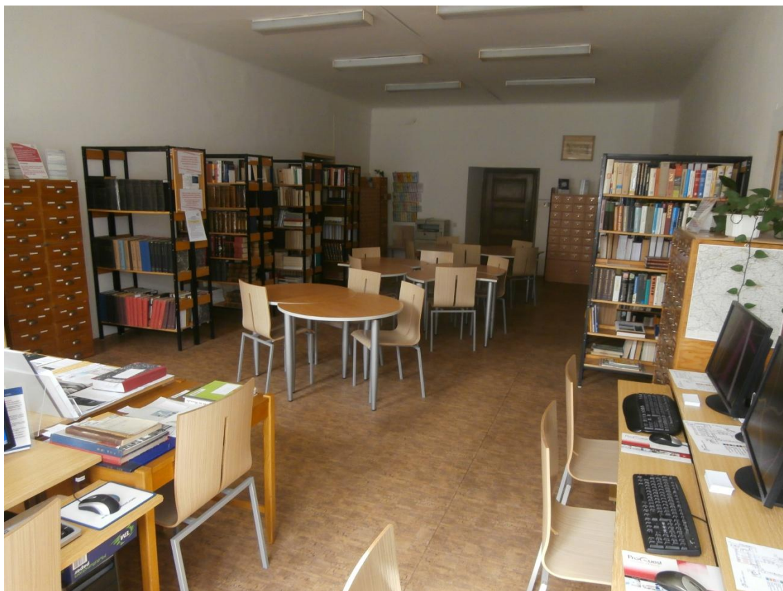
Obrázek č. 10 - Speciální studovna.