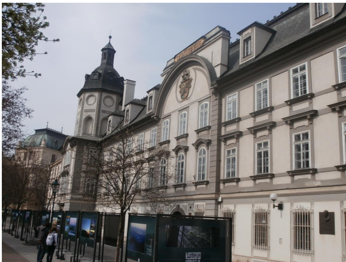
Obrázek č. 6 - Budova knihovny.