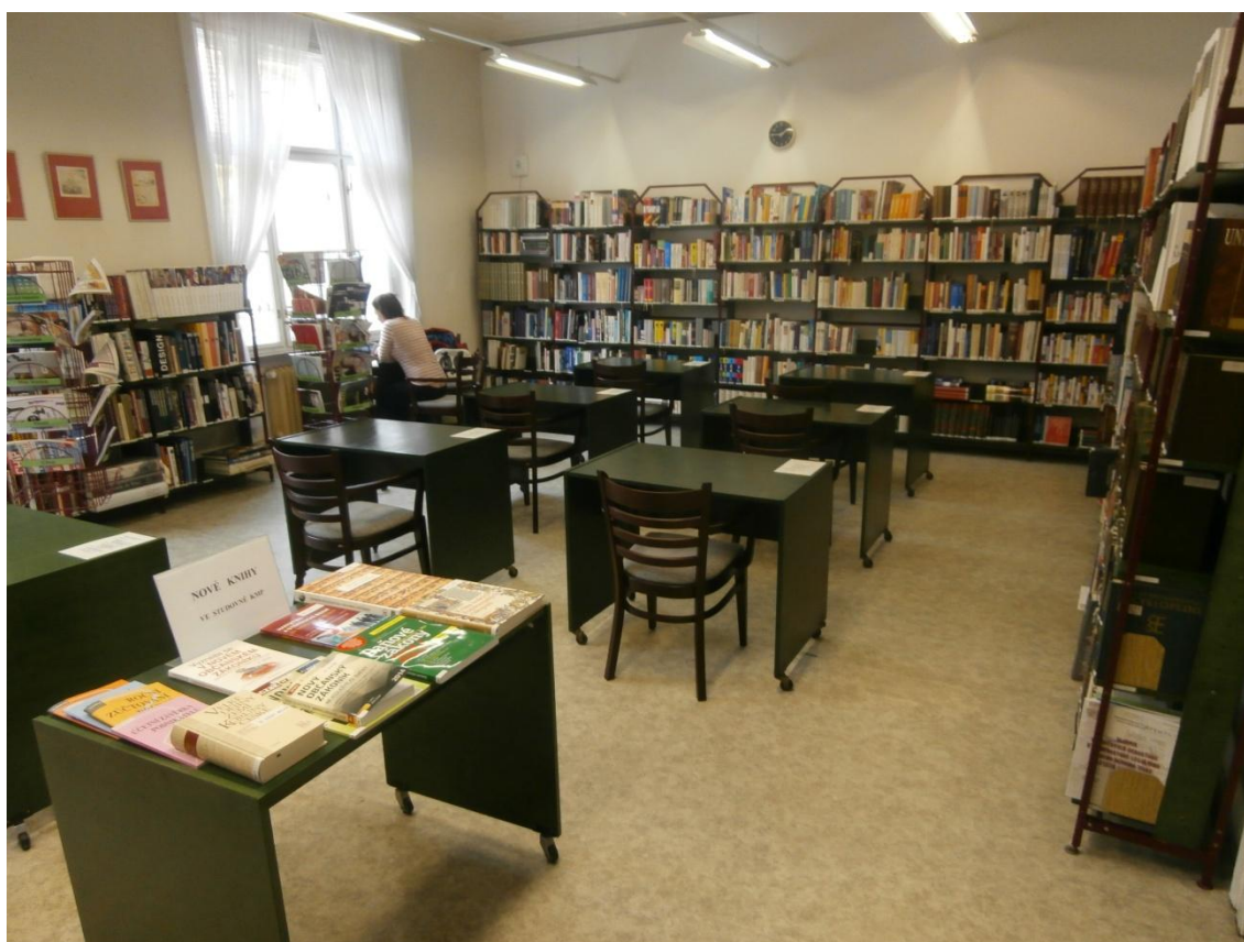
Obrázek č. 5 - Studovna II.