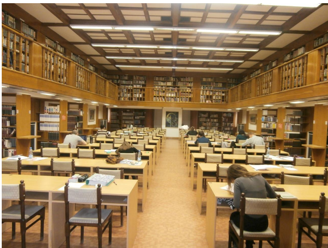
Obrázek č. 9 - Všeobecná studovna.