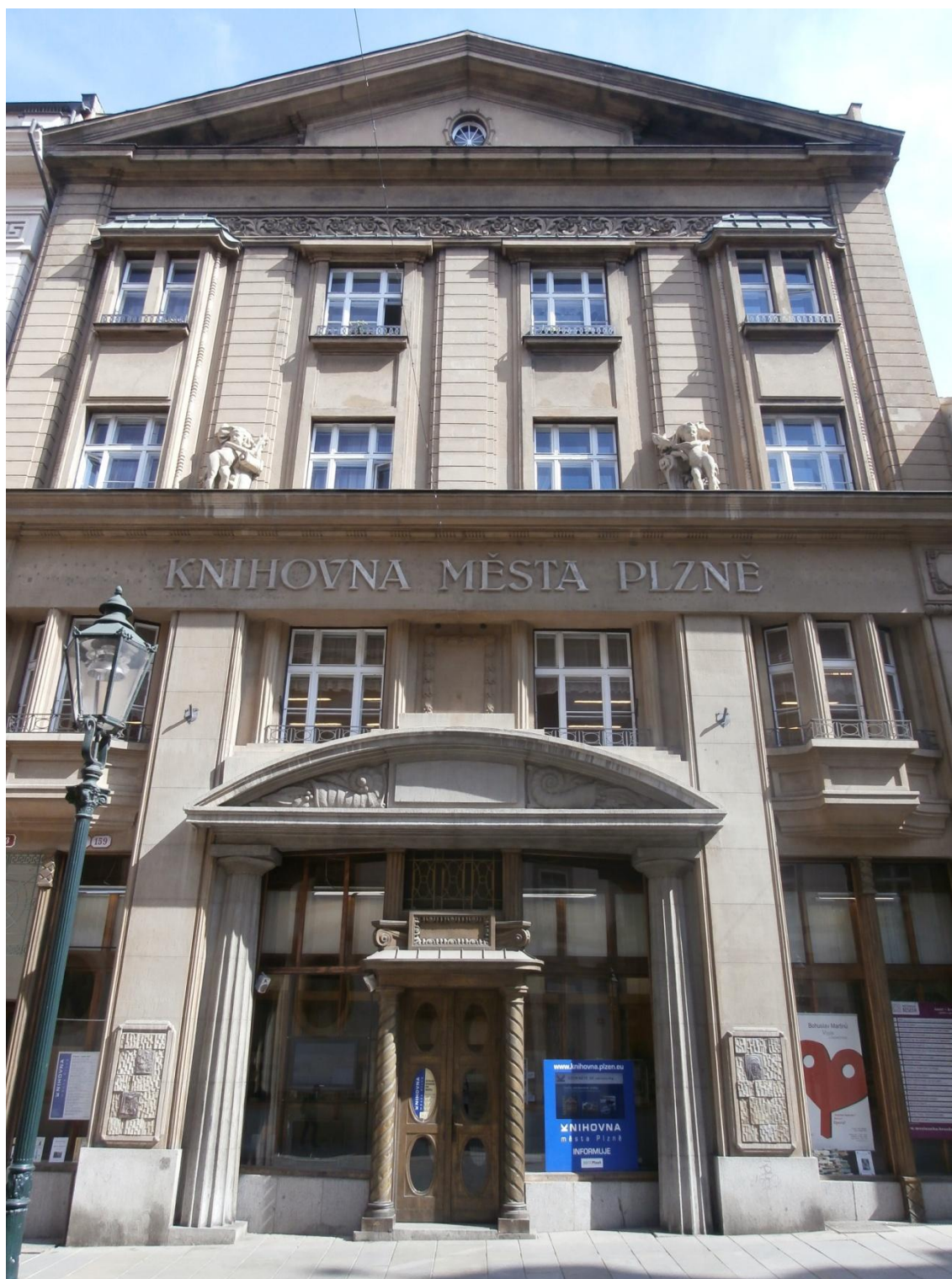
Obrázek č. 1 - Budova knihovny.