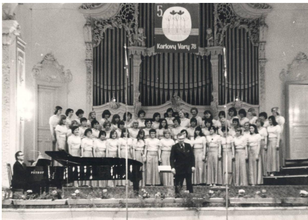
Snímky Královodvorského a Dívčího pěveckého sboru pod vedením A. Chrobáka.