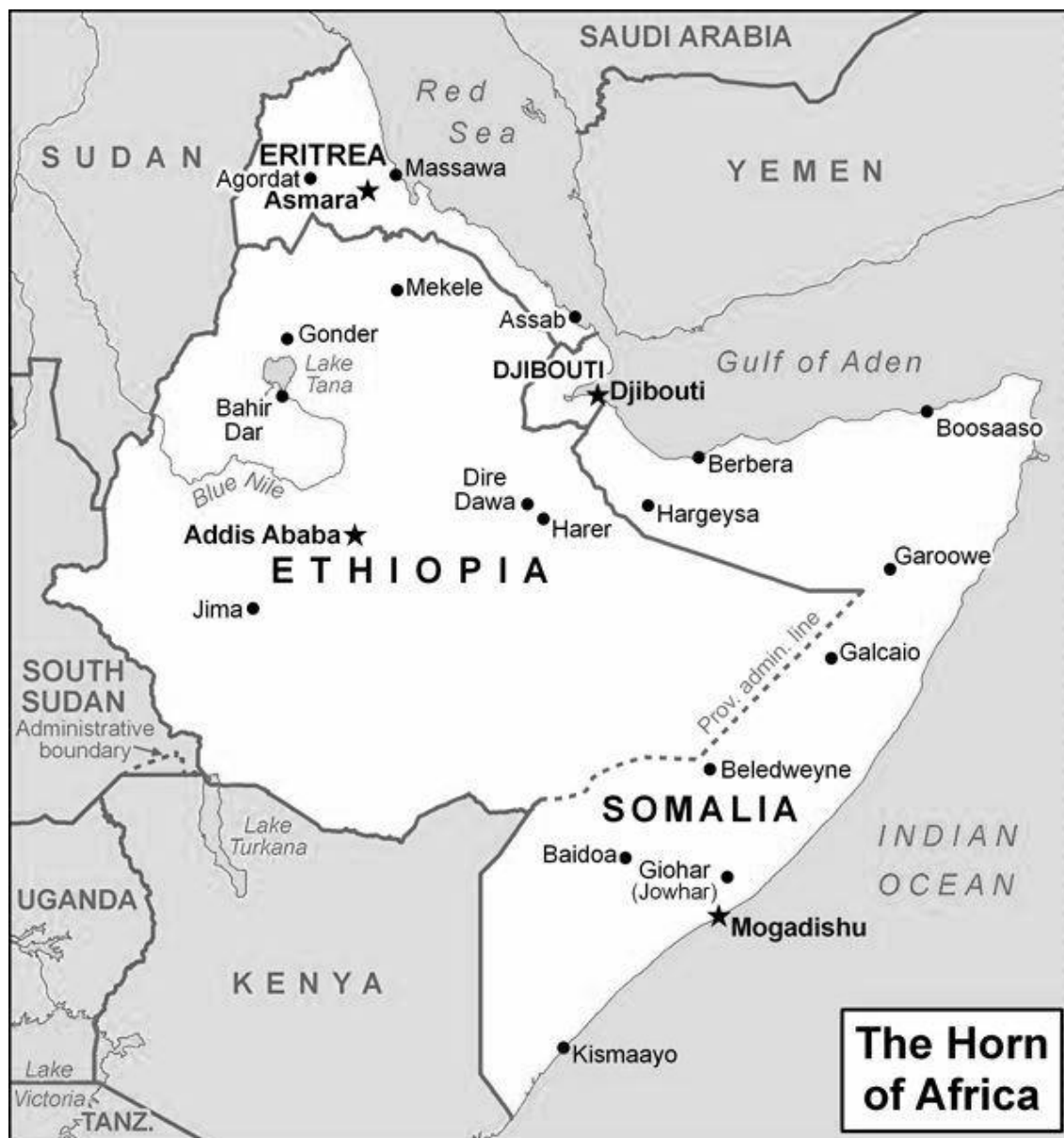
Příloha č. 1: Mapa Afrického rohu