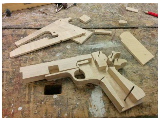
Obrázek 3 Provizorní sestavení bez lepení