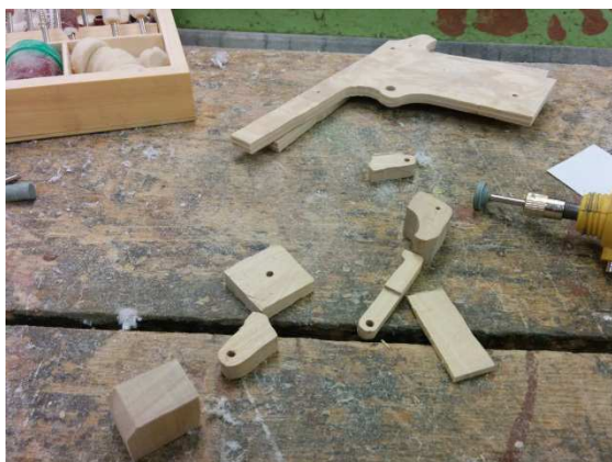
Obrázek 4 Postup práce 1

Jakmile byly všechny části připraveny, bylo třeba je dát dohromady. Některé části jsem slepil disperzním lepidlem a další pomocí šroubů sestavil.