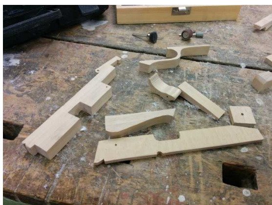
Obrázek 5 Vrchní části pistole a tělo