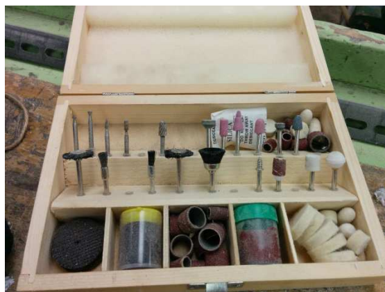
Obrázek 2 Gravírovací nástavce