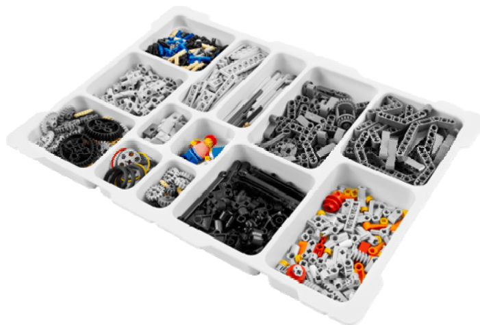
Obrázok 2 stavebnica k jednotke NXT

LEGO MINDSTORMS pozostáva s dvoch hlavných častí, jednou je jednotka NXT, teda programovateľná jednotka spolu s motormi a senzormi. Motory je možné programovo ovládať, teda môžeme im povedať ako rýchlo sa točiť, o koľko otáčok alebo stupňov sa otočiť a podobne. Senzory nám zase umožňujú vnímať vzdialenosť, svetlo, pohyb, zvuk a podobne. Prepojenie týchto komponentov s jednotkou je jednoduché a ľahko programovateľné, teda žiadny učiteľ nemusí byť znalý programátor aby vedel robota využiť naplno. Ba naopak, prostredie pre programovanie jednotky NXT je intuitívne a založené na princípe spájania blokov, nemusíme teda napísať ani slovo a predsa naprogramujeme triedič farieb.