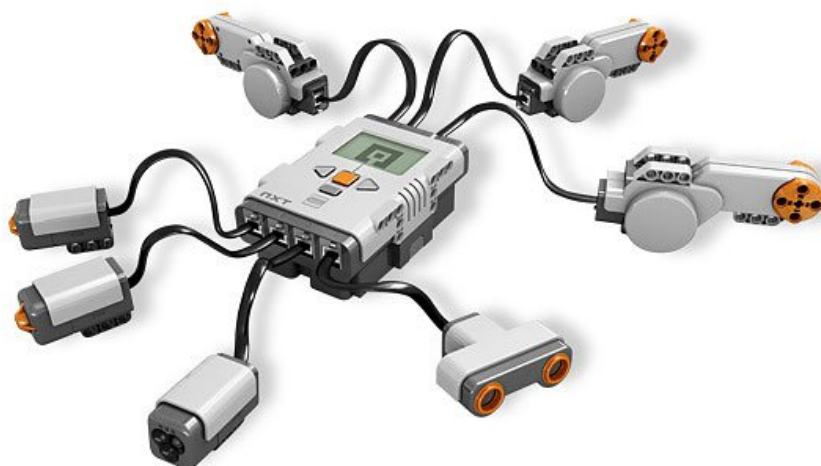
Obrázok 1 jednotka NXT spolu s motormi a senzormi