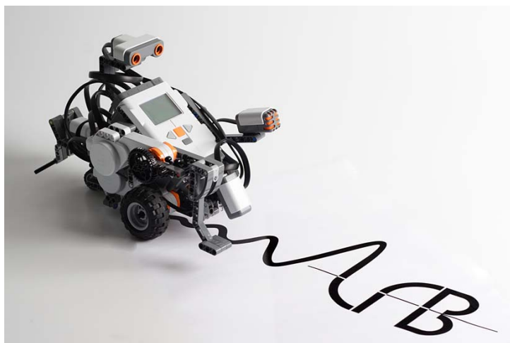
Obrázok 7 robot schopný rozoznávať čiary

Prítomnosť senzora citlivého na svetlo je skvelá ak chce učiteľ žiakov naučiť rôzne typy alebo hrúbky čiar pretože robot je schopný vyhodnotiť to čo zaznamená a môže žiaka oznámkovať. Alebo si žiaci môžu urobiť súťaž a ten s nich ktorý nakreslí lepšie požadované tvary alebo narysuje požadovaný náčrt vyhráva. Opäť je obmedzením v tomto tematickom celku iba fantázia samotného učiteľa