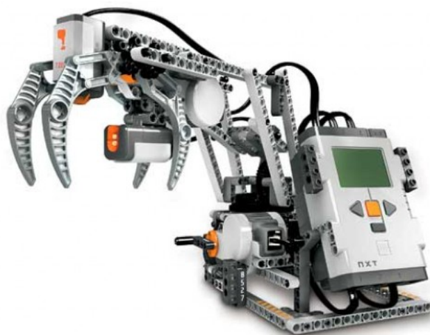
Obrázok 6 príklad stroja na ťažbu dreva

Z obrázku vyplýva že v tomto tematickom celku sa robot môže uplatniť ako ukážka rôznych strojov a mechanizmov pri spracovaní, ťažbe alebo obrábaní technických materiálov. Stavebnica ponúka rôzne návody ako vyrobiť rôzne stroje a tak sa žiaci môžu oboznámiť nie len s tým ako taký stroj vyzerá, ale aj ako funguje. Hlavnou výhodou je časová nenáročnosť pretože ak má škola viac stavebníc, v pomerne krátkom čase si žiaci „chytia“ viacero strojov, ktorých opis by klasickou metódou výkladu zabral nejednu vyučovaciu jednotku.