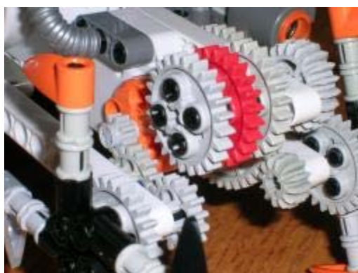
Obrázok 3 sústava ozubených kolies