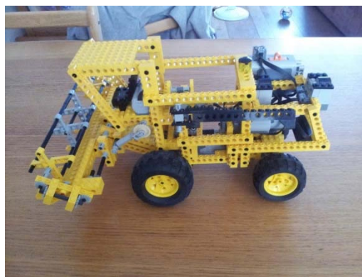
Obrázok 4 kombajn

To že jednotka NXT nám umožňuje nastaviť motor na otočenie o 360° prináša možnosť nie len žiakov naučiť rôzne druhy prevodov, ktoré si môžu postaviť sami, ale aj vysvetliť im pojmy ako prevodový pomer. Vzťahy medzi rôznymi ozubenými kolesami a ich vplyv v súkolesí tak uvidia priamo a naživo. Niektoré stroje je dokonca možné zostrojiť úplne a tak môžu žiaci vidieť ako funguje kombajn alebo auto. Je jasné že to bude len približný