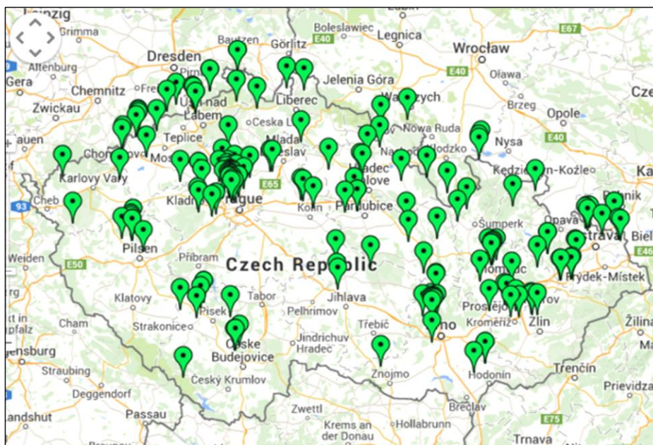
Obr. č. 2: Regionální rozložení sociálních podniků v České republice