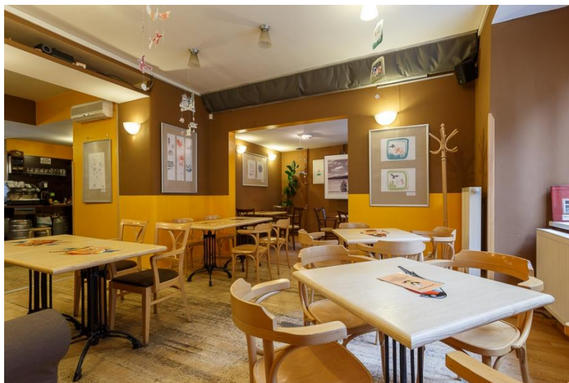
Obr. č. 1: Interiér Café Restaurantu Kačaba

Na následujícím obrázku si lze prohlédnout interiér Café Restaurant Kačaba.