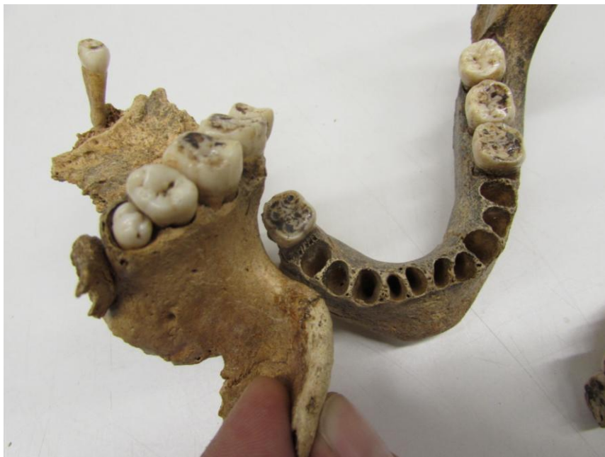
Obr. č. 5 Prořezávají se devátý zub u jedince z hrobu č. 6.