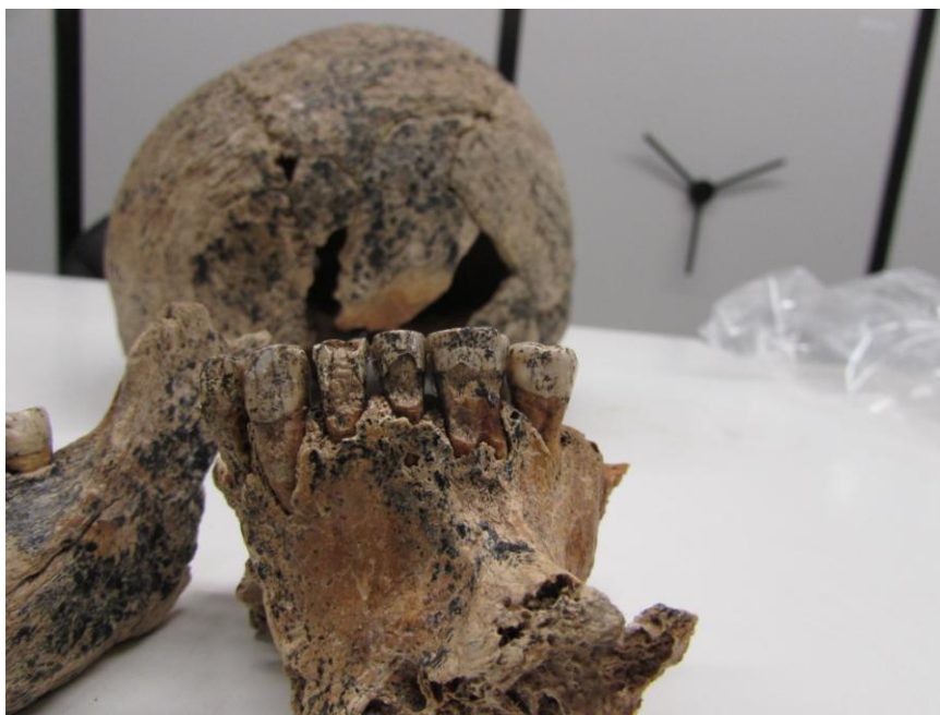
Obr. č. 6 Část mandibuly nalezeného na pohřebišti s projevy protivampyrických opatření.