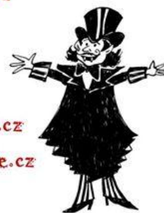
Obr. č. 3 Plakát k akci Výprava za čelákovickými upíry 20

Přijďte se seznámit s jejich synem Čendou Czerným z Čelákovic, a zároveň zjistit, jak to s těmi upíry doopravdy je!