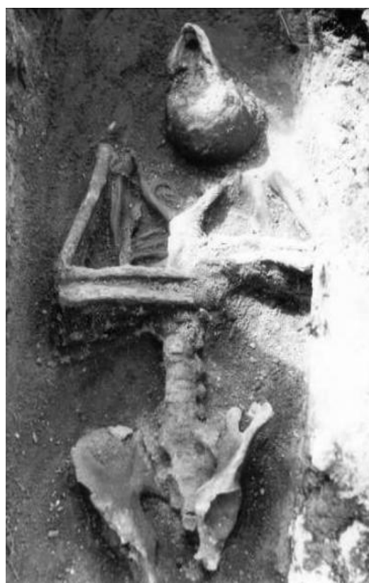
Obr. č. 1 a 2 Způsob uložení jedince nalezeného na pohřebišti s projevy protivampyrických opatření. Foto: Jaroslav Špaček 6)