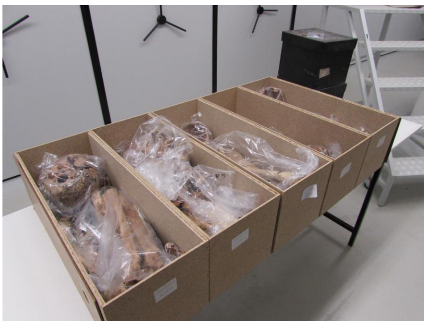
Obr. č. 8 Ostatky jedinců z pohřebiště s projevy protivampyrických opatření uložené v depozitáři Národního muzea.

V závěru publikace Jaroslava Špačka Poznámky k nové interpretaci pohřebiště s projevy vampyrismu a několik poznámek k otázce soudnictví městečka Čelákovic (2009), zmiňuje autor, že na kosterních pozůstatcích měla být provedena revize, avšak do této doby se tak nestalo, a