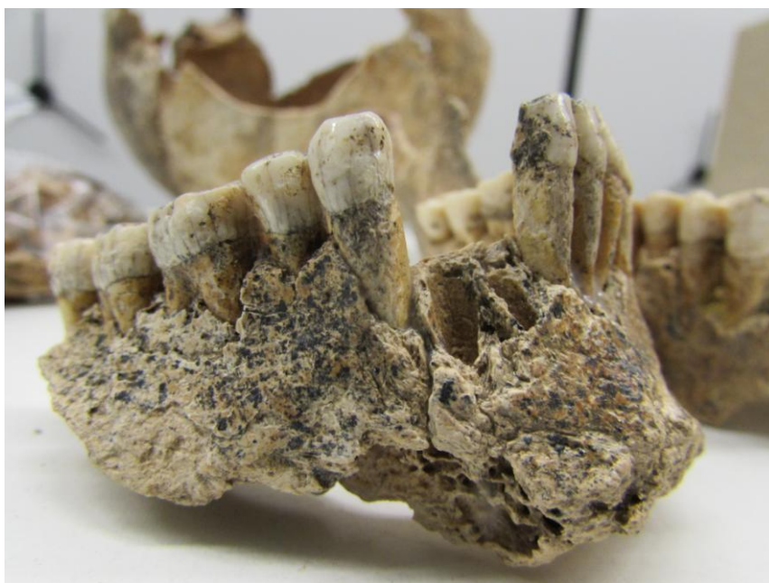
Obr. č. 4 Mandibula jedince nalezeného na pohřebišti s projevy protivampyrických opatření.

Na základě mé osobní zkušenosti mohu tedy vyvrátit tvrzení spisovatelky Jenny Nowak, která se, jak je již zmíněno v kapitole Vampirismus , inspirovala čelákovickými upíry při psaní některých svých knih. Ta roku 1998 v rozhovoru pro deník Metro uvedla o upírech z Čelákovic, že: „Všichni měli sice bezvadný chrup, avšak u všech byly zároveň nalezeny atypické deváté zuby a špičáky přesahující linii prvních stoliček až o 9mm. 27)