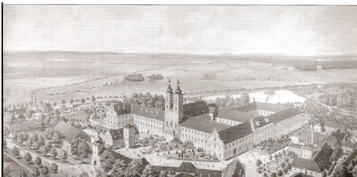
Ideální prospekt kláštera od firmy Weeser-Krell z roku 1908 (pohled od jihozápadu).

Příloha č. 1 Ideální prospekt kláštera