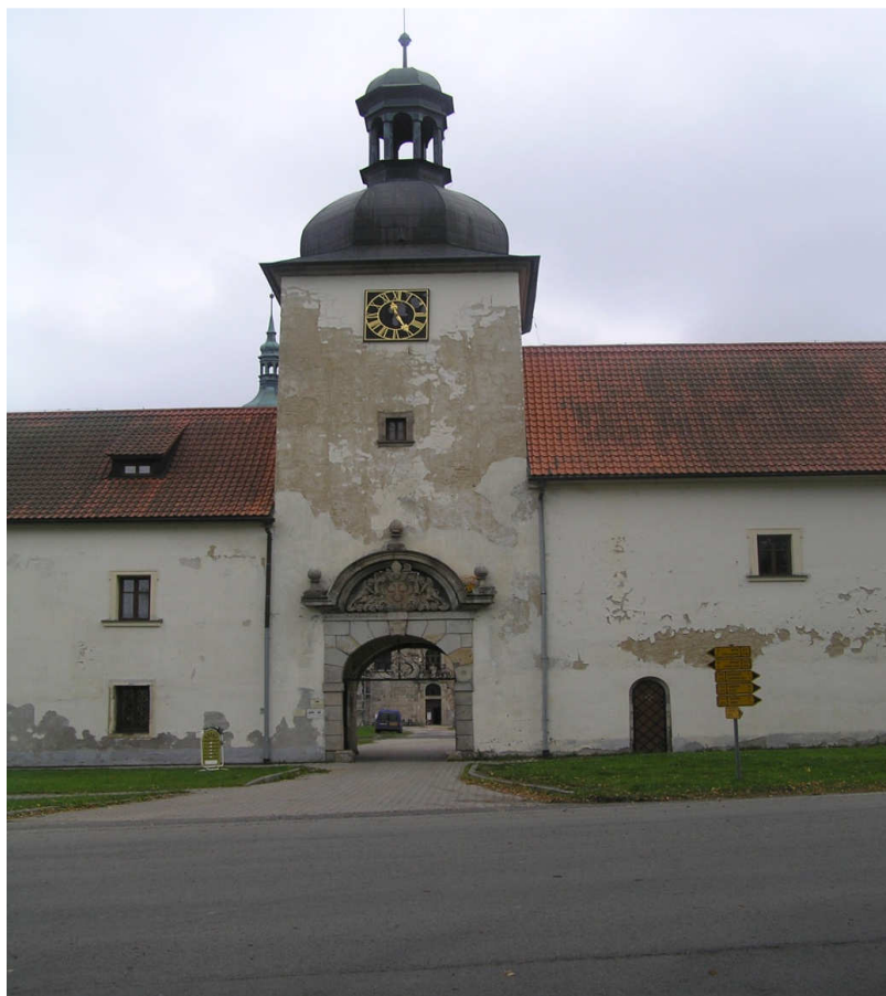
Příloha č. 2 Vstupní brána kláštera v Teplé