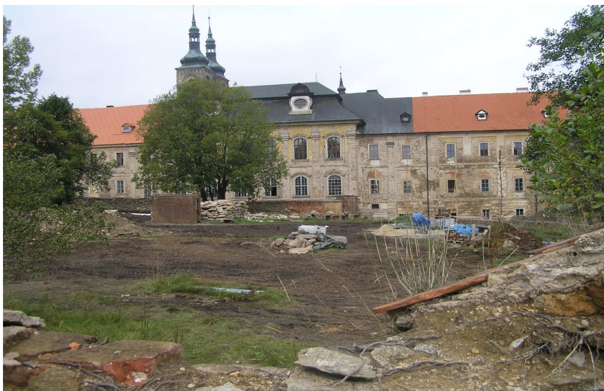
Příloha č. 4 Trakt knihovny, východní strana kláštera