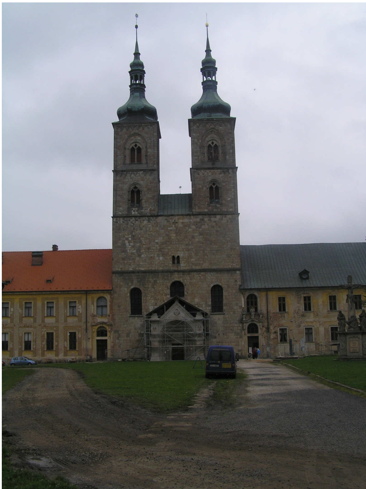
Příloha č. 3 Kostel zvěstování páně