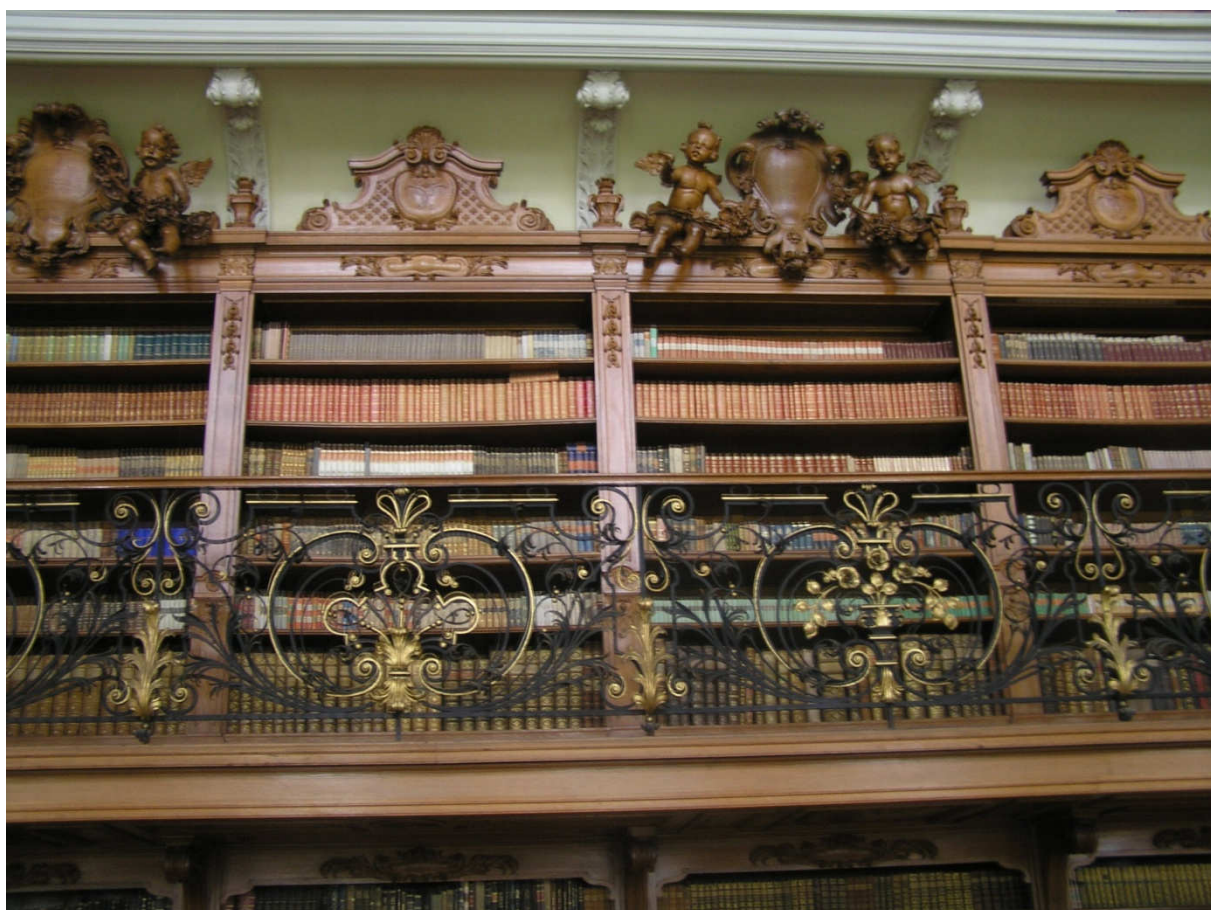
Příloha č. 6 První galerie knihovního sálu