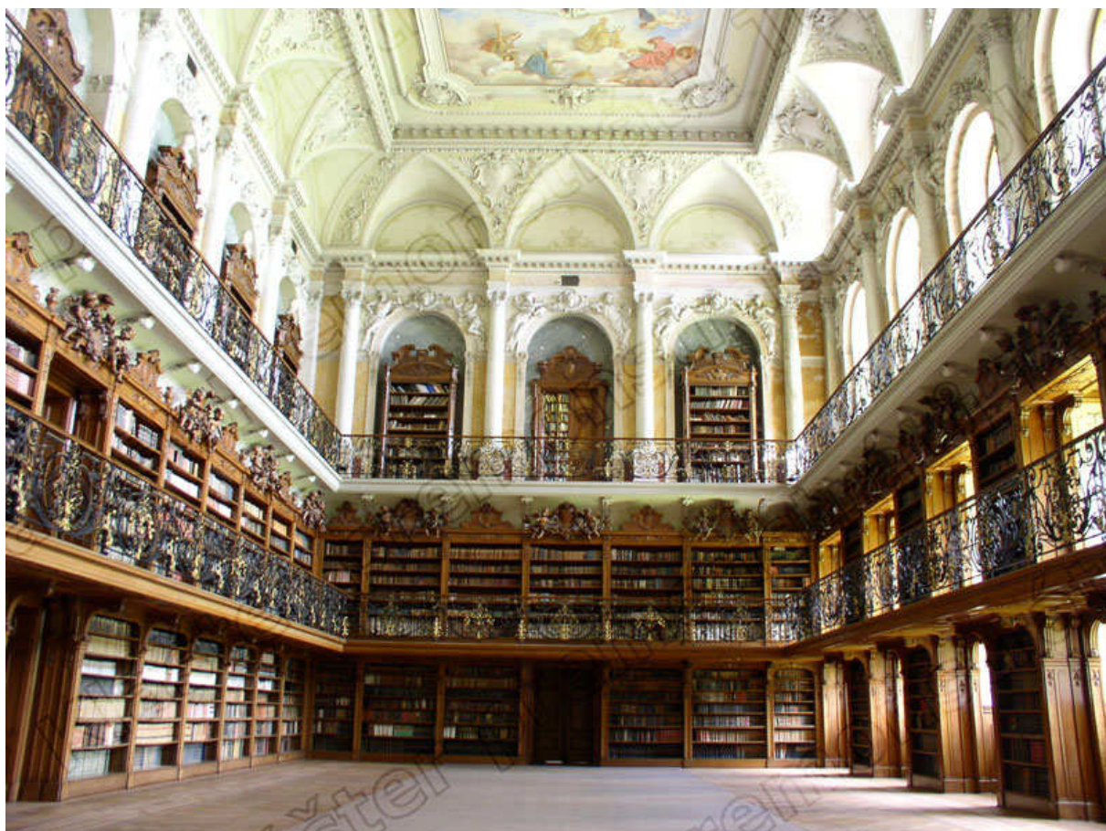
Příloha č. 5 Sál klášterní knihovny v Teplé