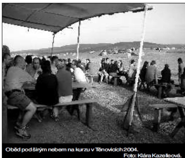
Oběd pod širým nebem na kurzu v Těnovicích 2004.