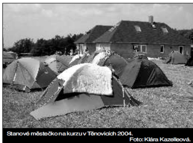
Stanové městečko na kurzu v Těnovicích 2004.

„Když jsem toto místo poprvé uviděl, věděl jsem, že je musíme získat,“ komentoval prý krásný výhled z těnovické louky lama Ole Nydahl. Jeho žákům se to podařilo. Realizace projektu začala v roce 1997, kdy se od vlastníků postupně odkupovaly jednotlivé pozemky, které mají v současné době celkovou rozlohu asi 12 hektarů. Stavět se začalo v létě 2002, ale první kurz se na pozemku v Těnovicích konal již v roce 1999, kdy se v podstatě na holé louce sešlo jedenáct set lidí. 4