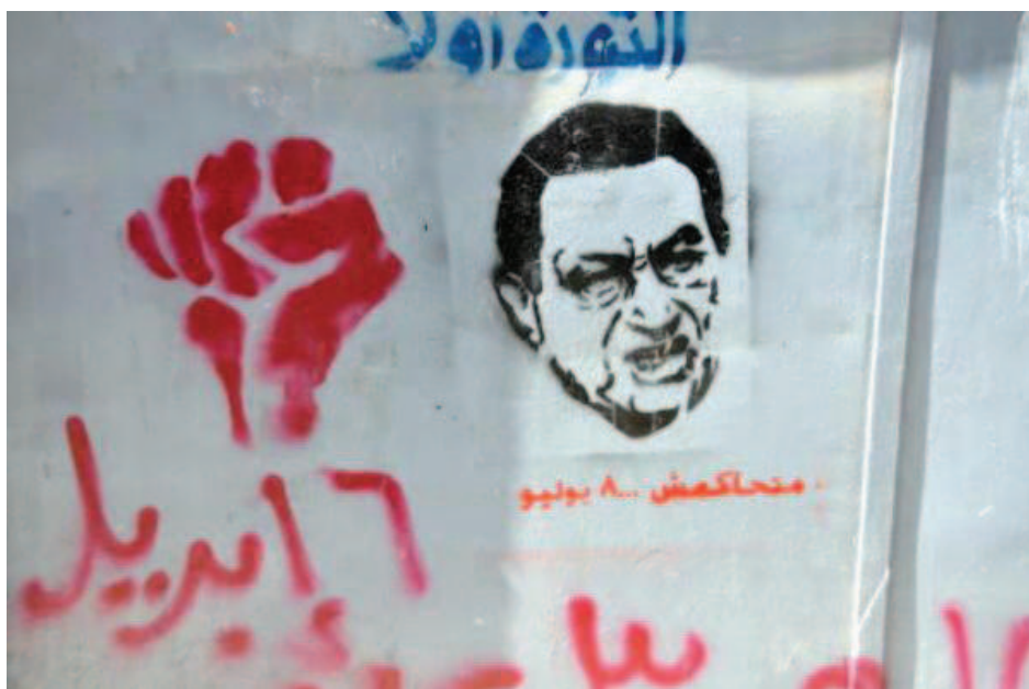
Symbol Hnutí mládeže 6. dubna (vlevo) vedle portrétu prezidenta Husního Mubáráka