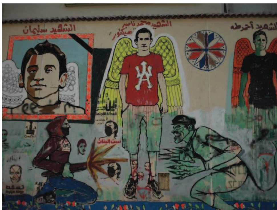
Portréty demonstrantů zabitých během protestů, ulice Muhammada Mahmúda v Káhiře