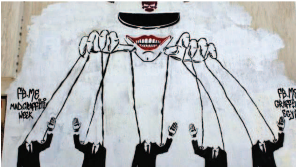
Graffiti znázorňující Nejvyšší radu ozbrojených sil, která drží kontrolu nad prezidentskými volbami v roce 2012, jako kdyby šlo o loutkovou hru.