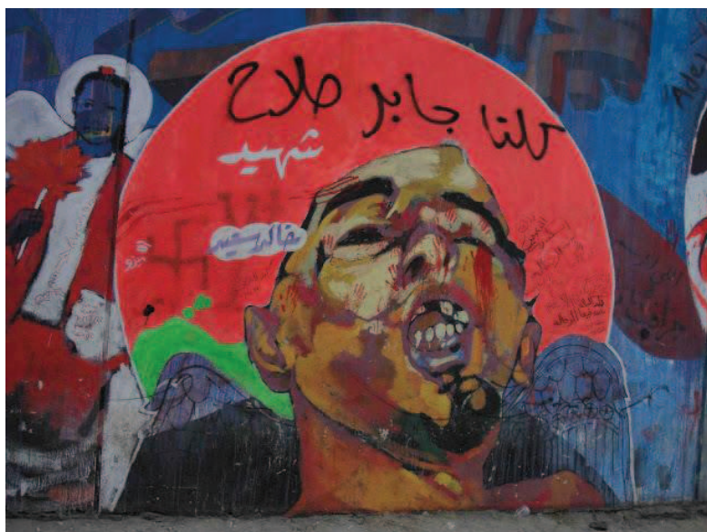
Portrét zobrazující mrtvého Chálida Sa ʿ ída vytvořený na základě fotografií, které se po útoku policistů šířily na internetu.