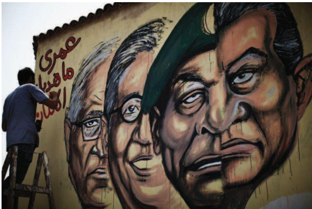
Vpravo portrét složený z tváří bývalého prezidenta Husního Mubáráka a jeho faktického nástupce armádního velitele Muhammada Husajna Tantáwího, v pozadí obličej prezidentů kandidátů Amra Músy a Ahmada Šafíka. Muž maluje nápis: „Nikdy vám nedám pokoj.“