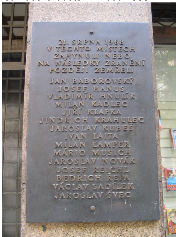
Příloha č. 10: Pamětní deska obětem v roce 1968