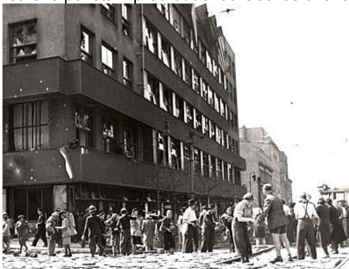
Příloha č.6: Květnové povstání před budovou Československého rozhlasu