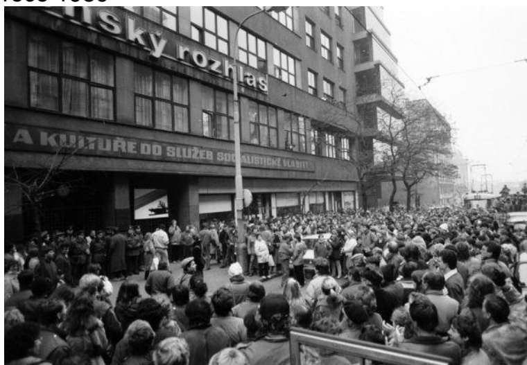
Příloha č. 11: Demonstrace před budovou Československého rozhlasu na Vinohradech v roce 1989