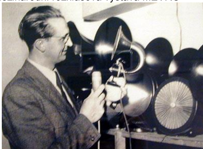
Příloha č. 7: Mezinárodní rozhlasová výstava MEVRO