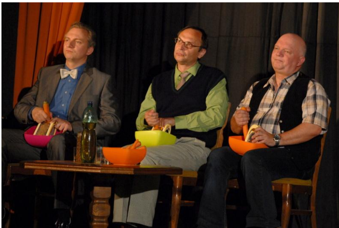
Obrázek 13: Kalba manželů šilených aneb Manželství je kabaret 2