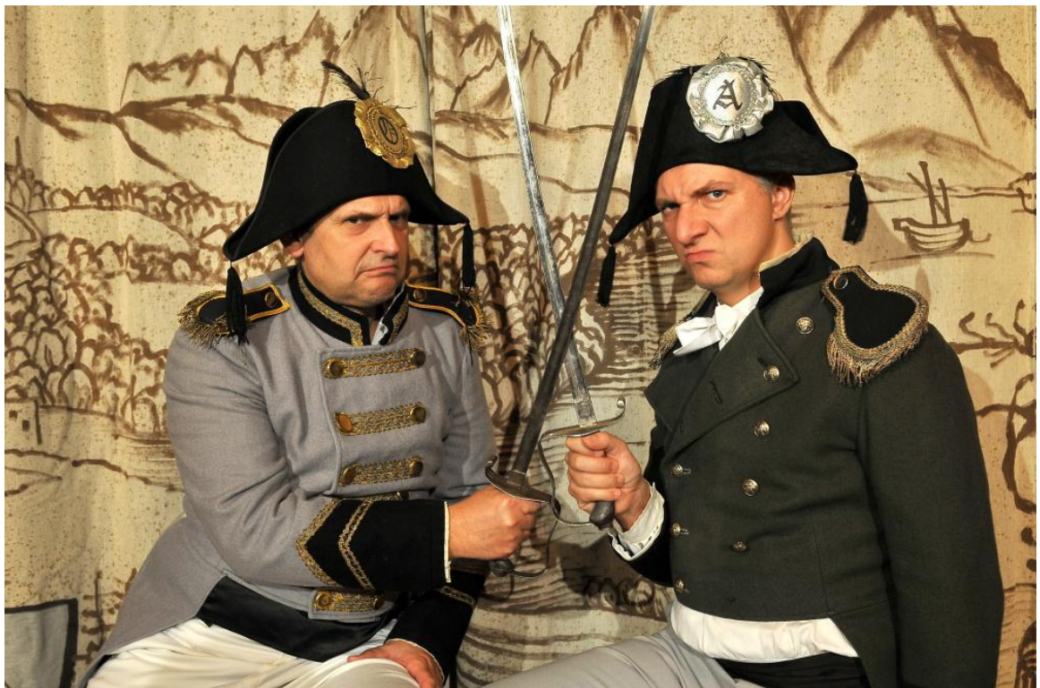
Obrázek 6: Dva muži v šachu