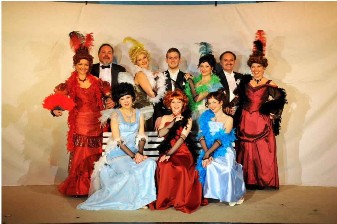
Obrázek 16: Pletky Straussovy operetky