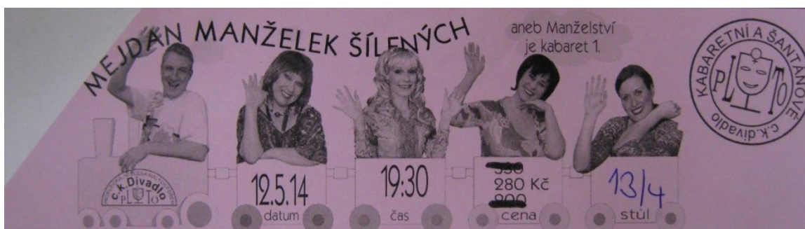
Obrázek 32: Lístek z představení - Mejdan manželek šílených