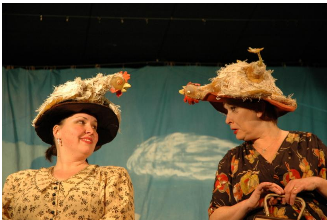
Obrázek 4: Jak se válčí na pavlači