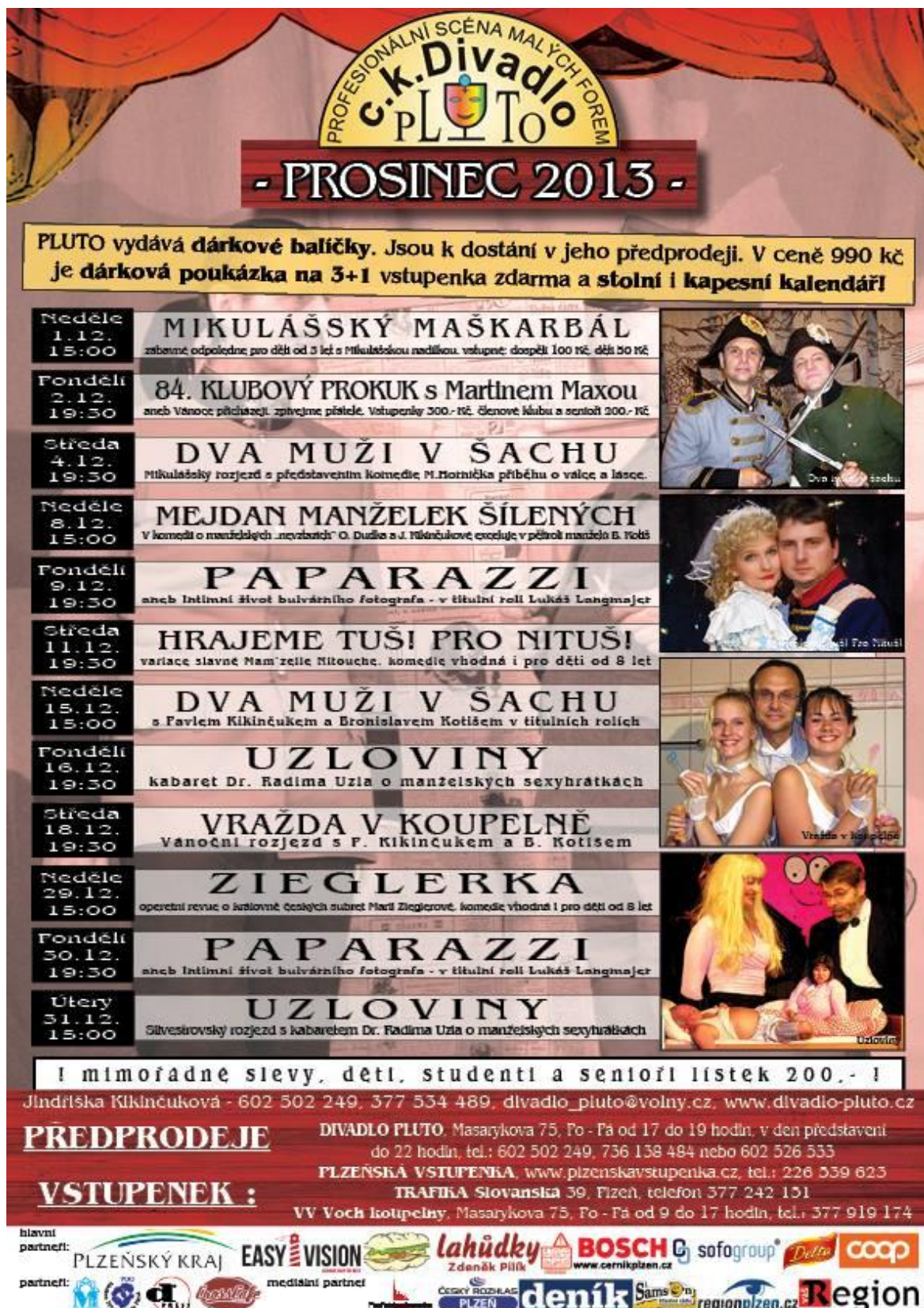
Obrázek 23: Program prosinec 2013