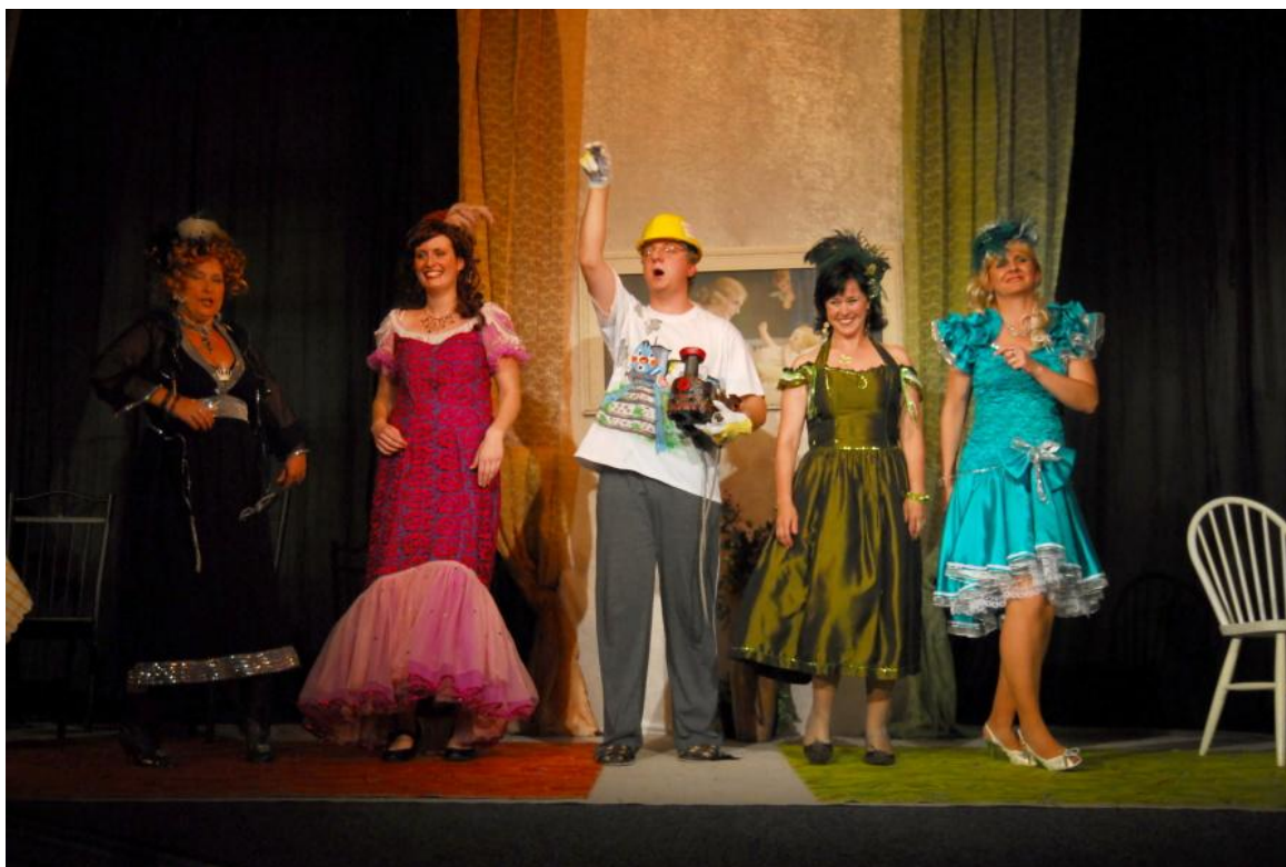
Obrázek 12: Mejdán manželek šilených aneb Manželství je kabaret