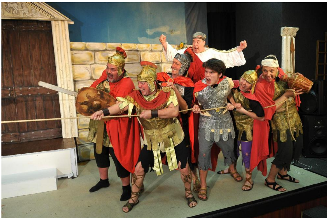
Obrázek 14: Nejkrásnější válka