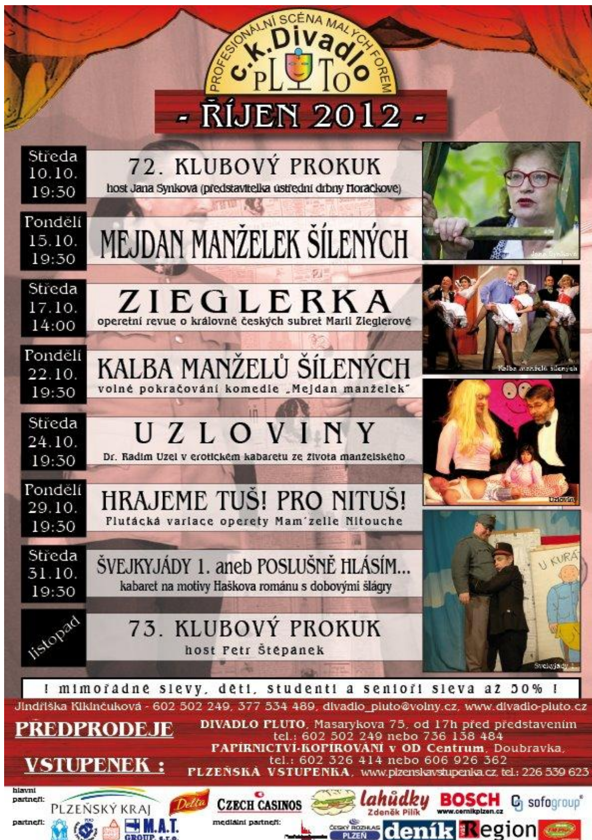
Obrázek 22: Program říjen 2012