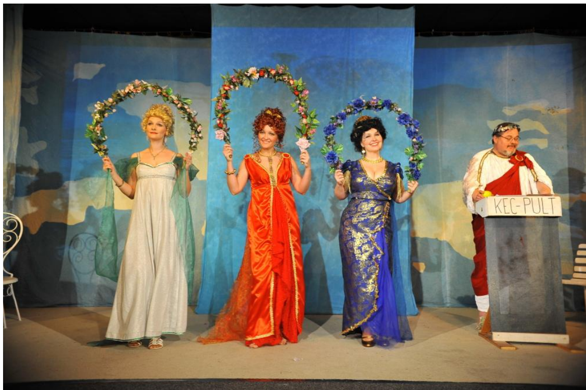
Obrázek 17: Pletky Straussovy operetky