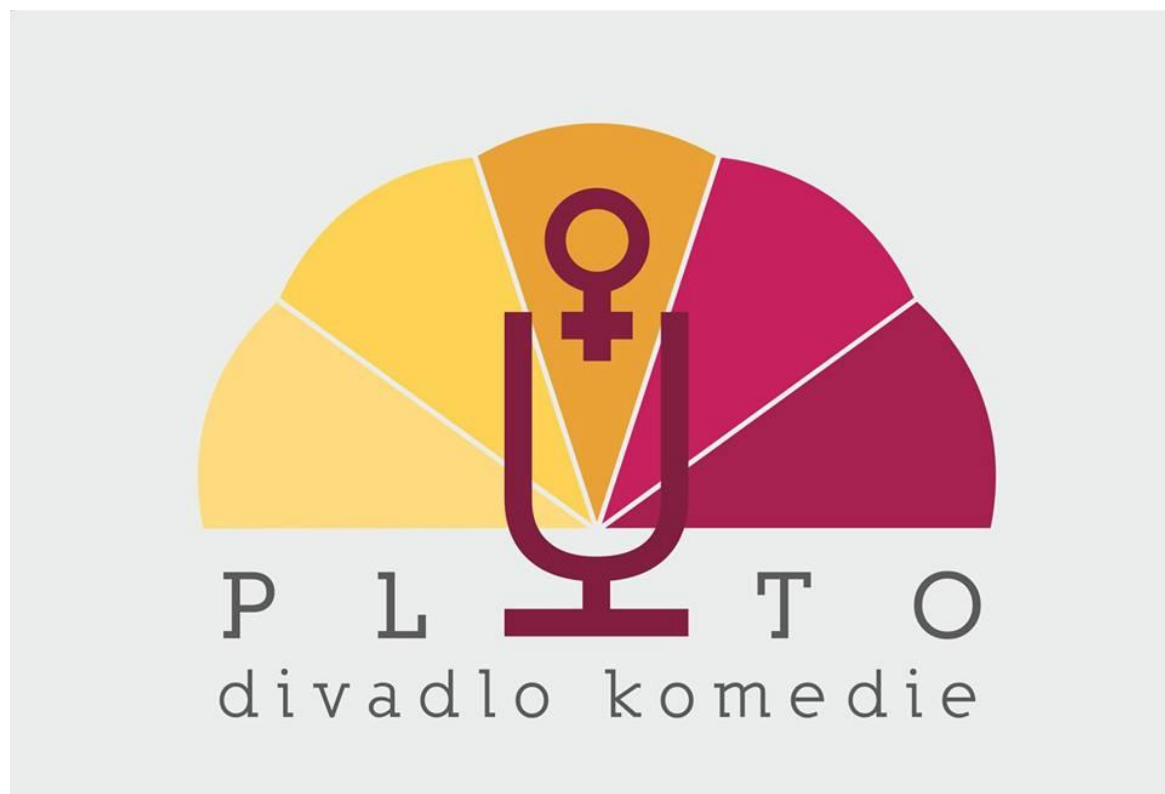
Obrázek 2: Nové logo Divadla Pluto