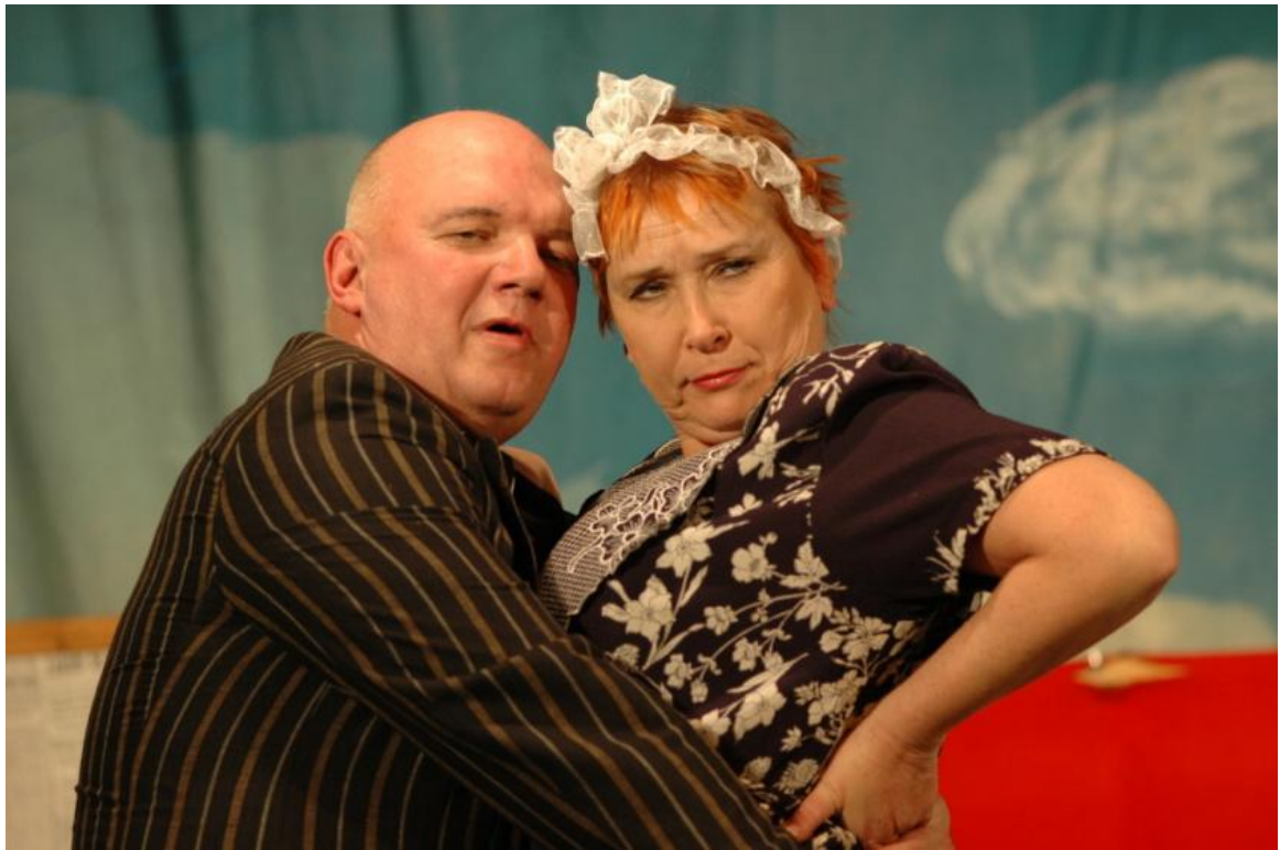
Obrázek 5: Jak se válčí na pavlači