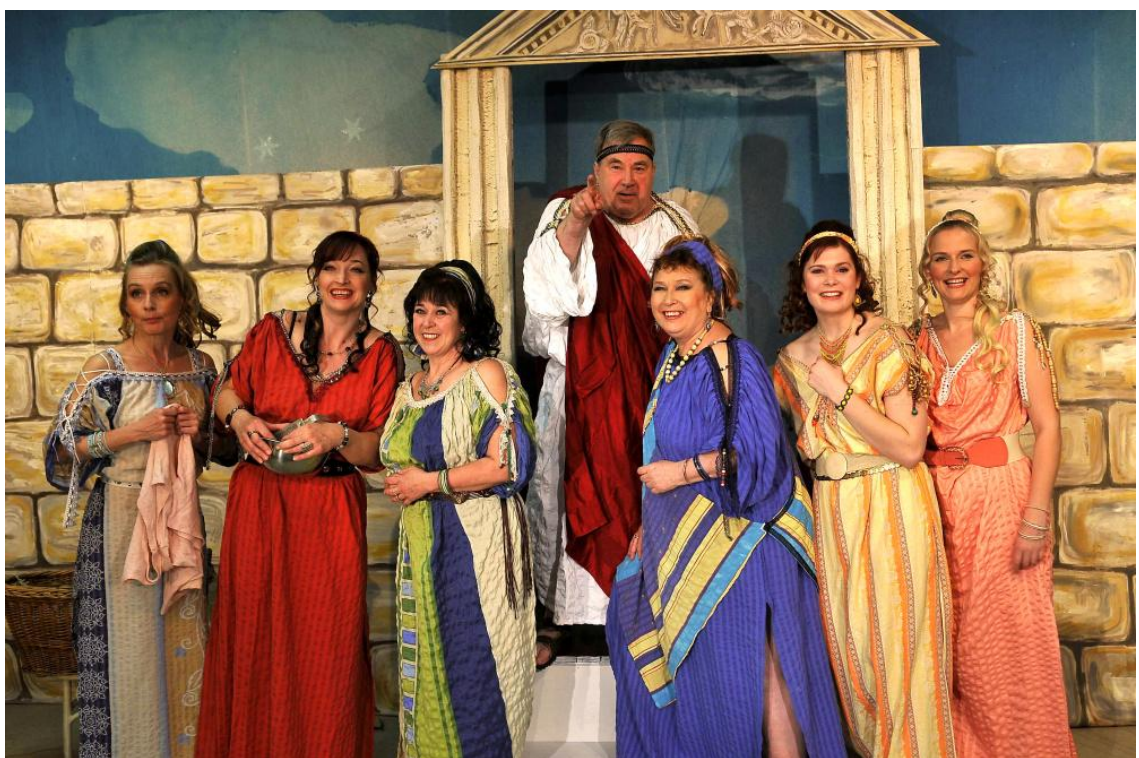
Obrázek 15: Nejkrásnější válka