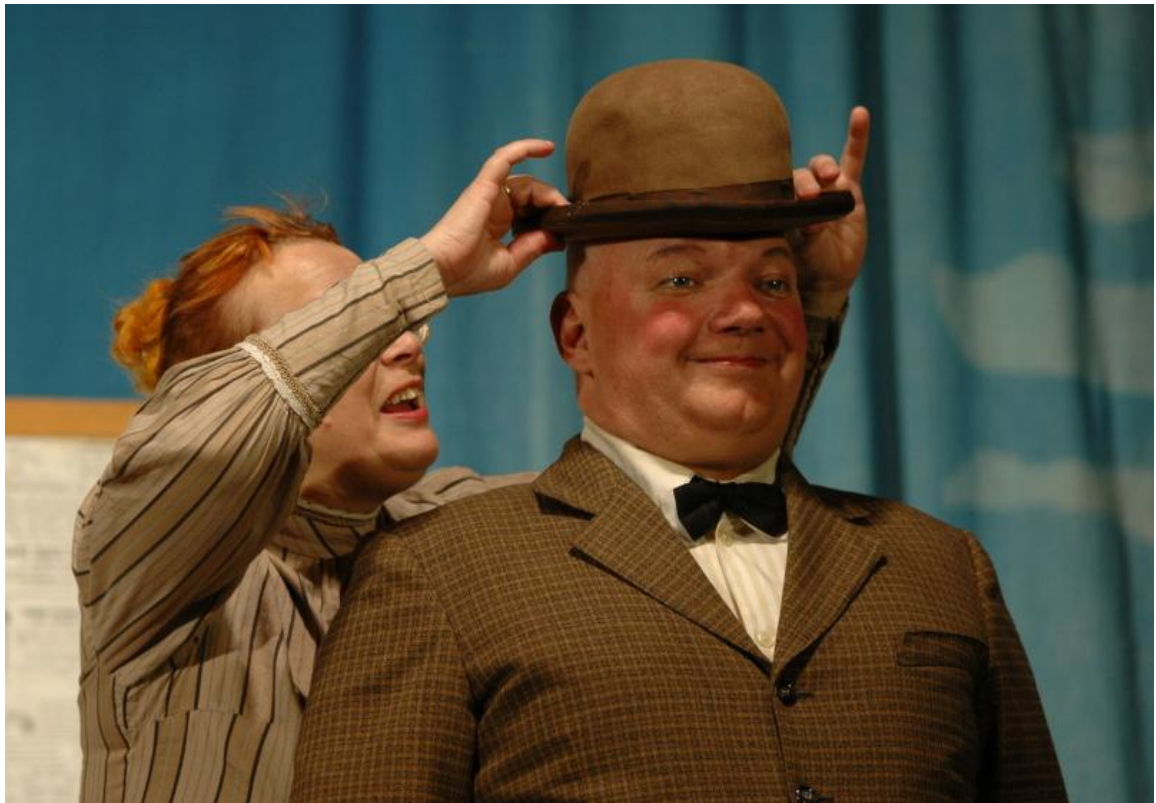
Obrázek 7: Švejkyjády aneb Poslušně hlásím...