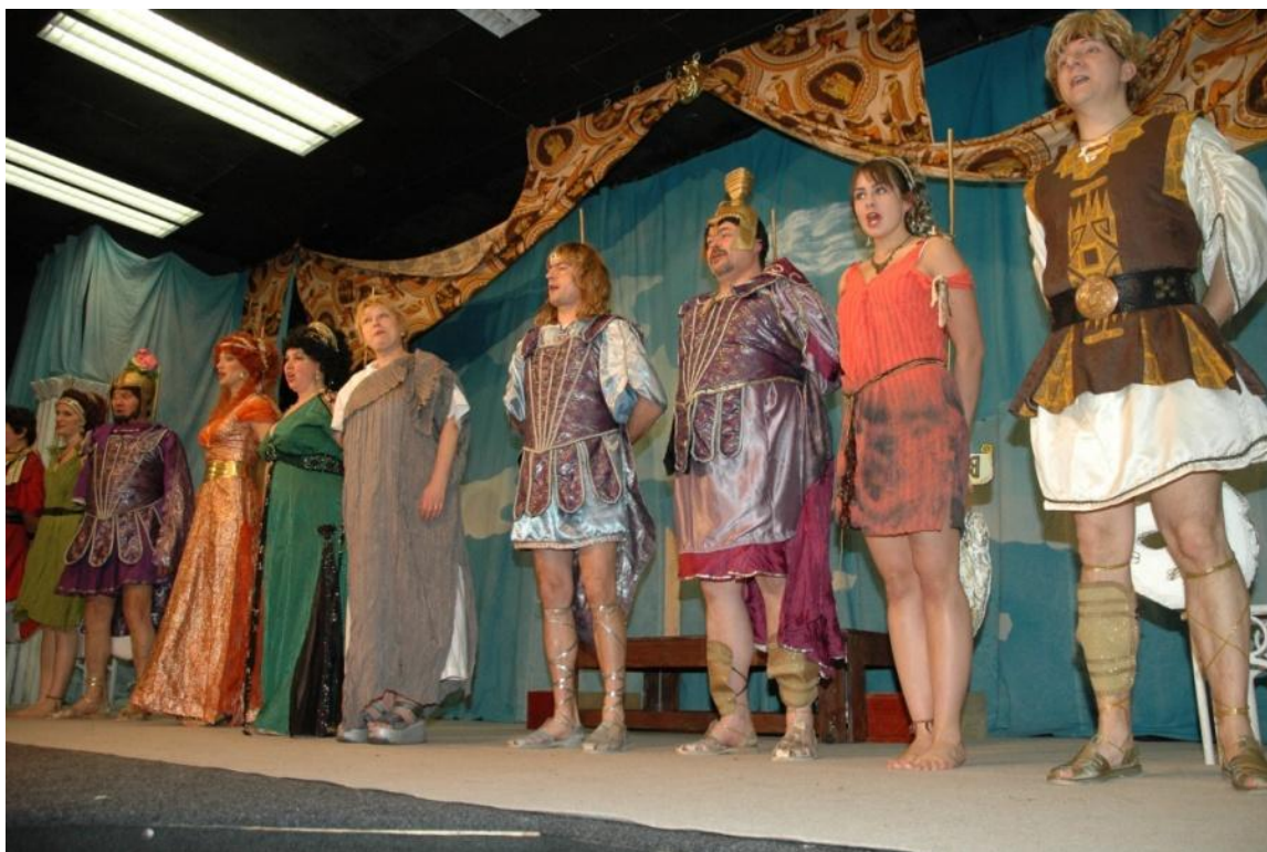
Obrázek 11: Paráda papá Offenbacha aneb Návrat Odyssea