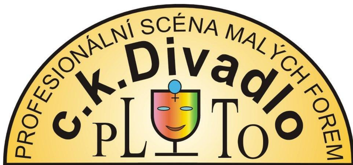
Obrázek 1: Původní logo Divadla Pluto