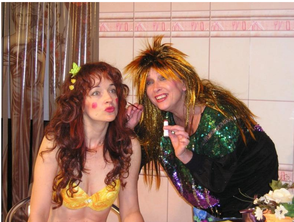
Obrázek 10: Vražda v koupelně aneb Namydlené historky 1