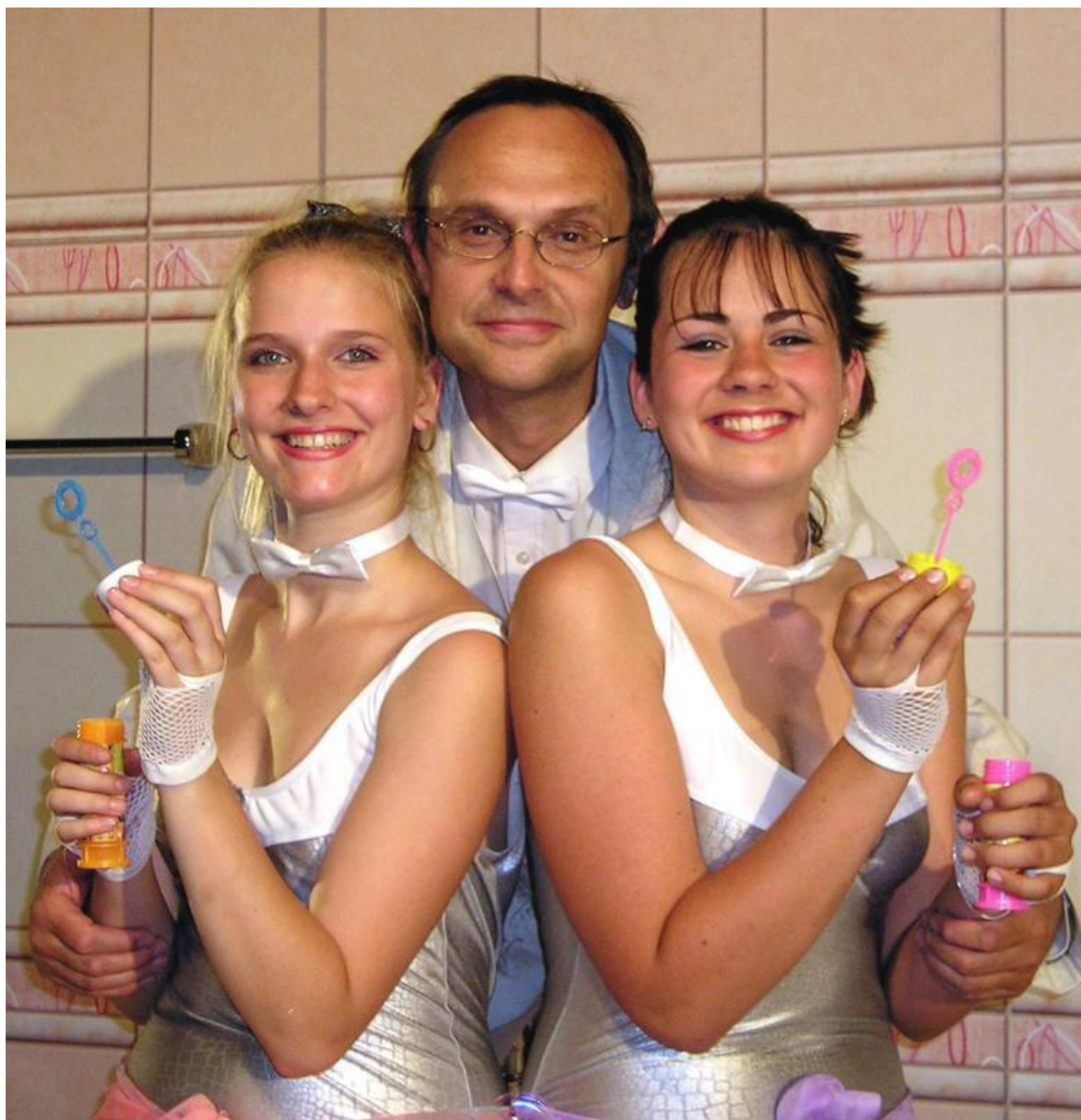
Obrázek 9: Vražda v koupelně aneb Namydlené historky 1