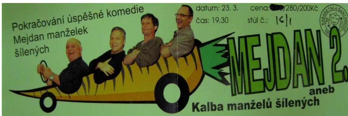
Obrázek 33: Lístek z představení - Kalba manželů šílených