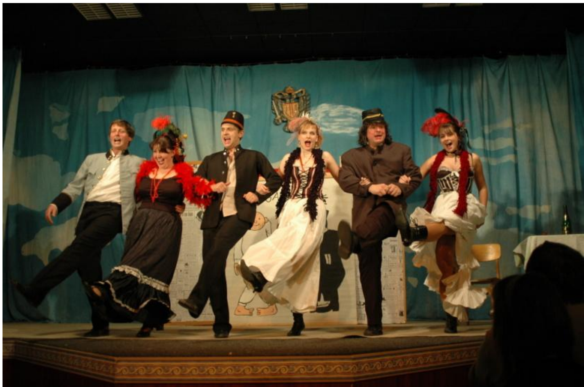
Obrázek 8: Švejkyjády aneb Poslušně hlásím...