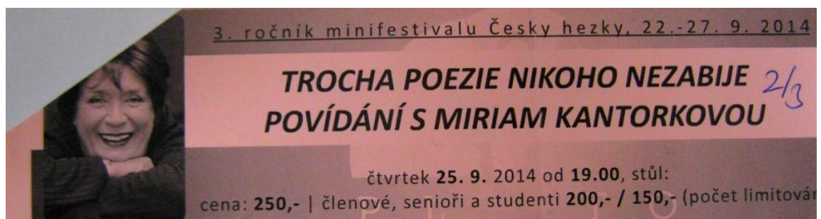
Obrázek 35: Lístek z Minifestivalu - Trocha poezie nikoho nezabije