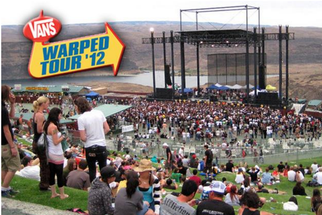
Obr. 12: Vans Warped Tour ( http://97rockonline.com )