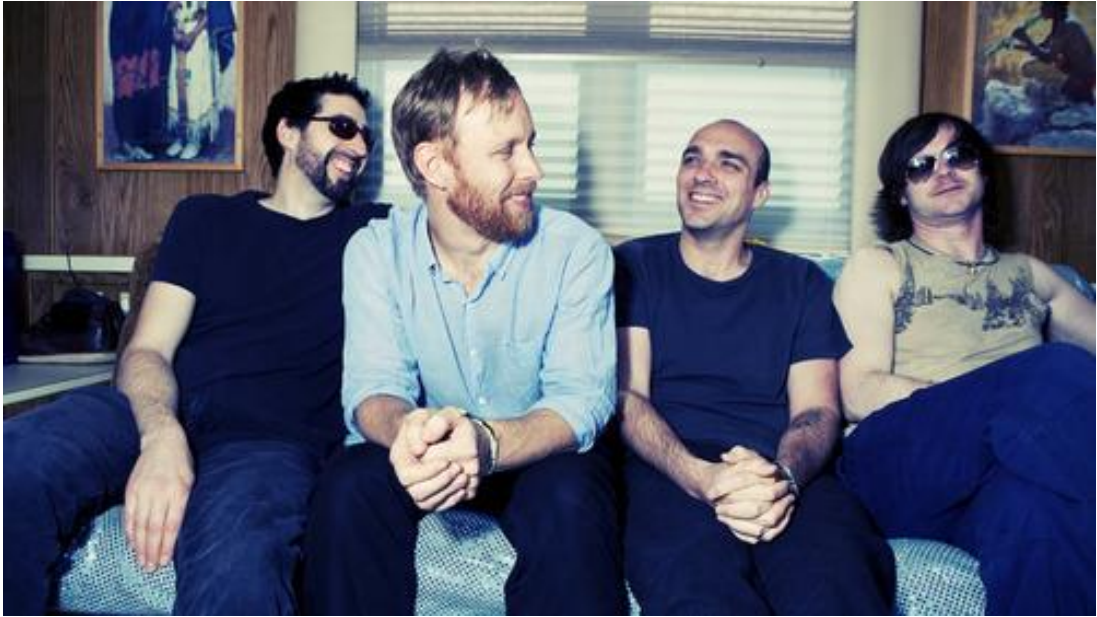
Obr. 7: Sunny Day Real Estate