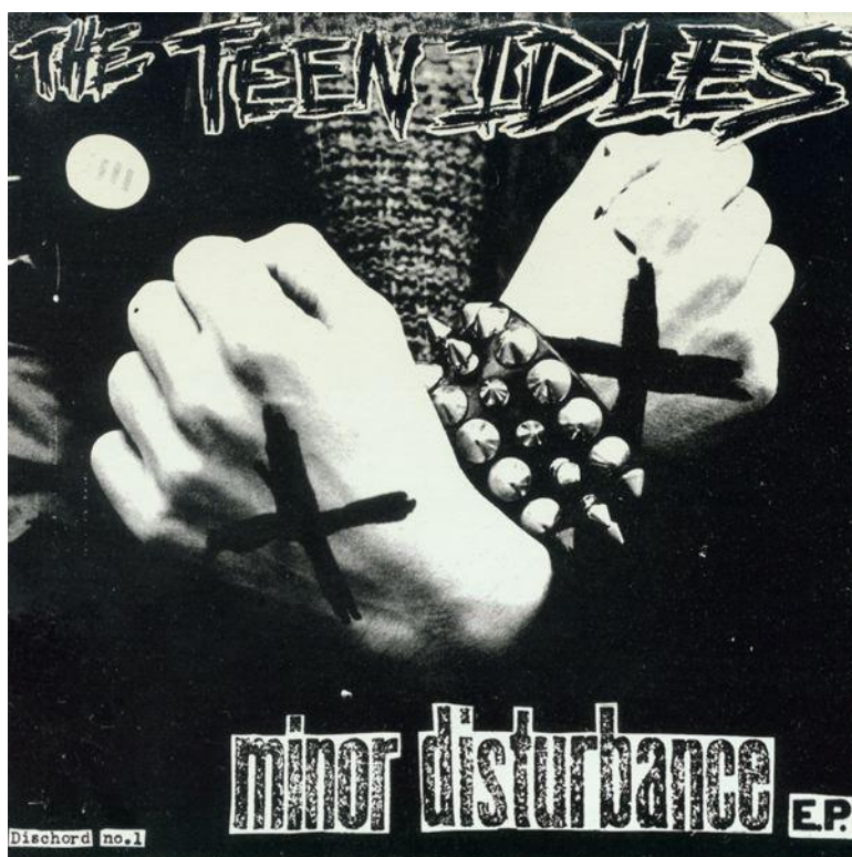
Obr. 1: Obal desky Minor Disturbance od The Teen Idles ( http://www.musicya.net )