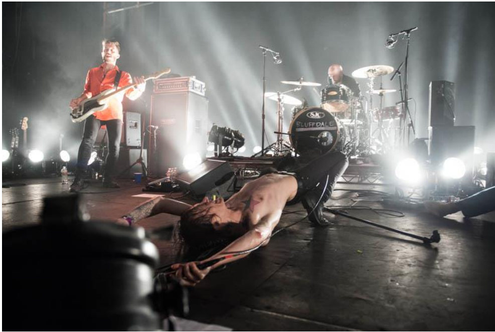
Obr. 11: Refused