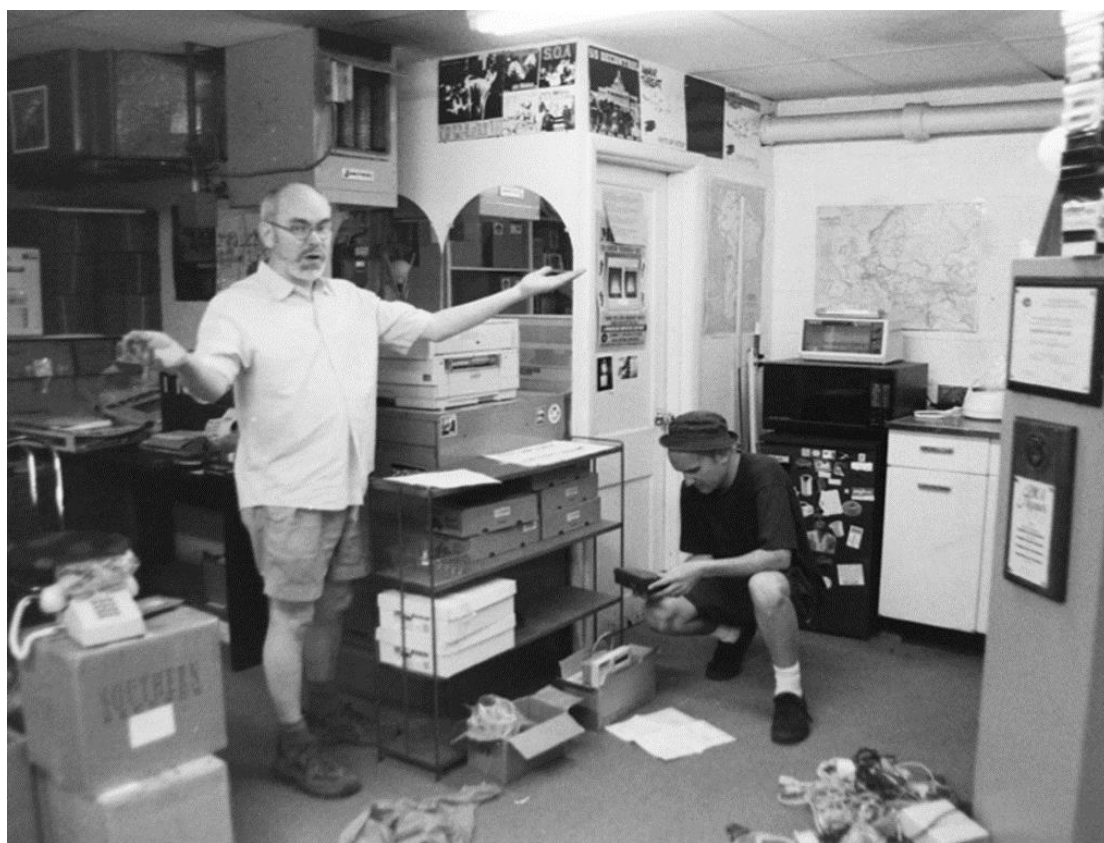
Obr. 6: Kancelář Dischord Records ( http://dischord.tumblr.com )