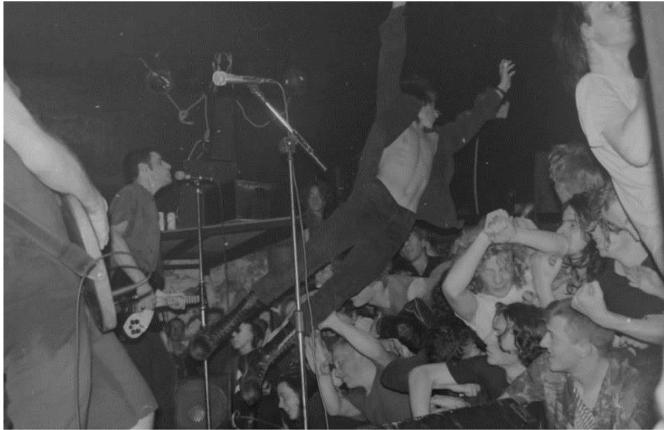
Obr. 3: Koncert skupiny Fugazi