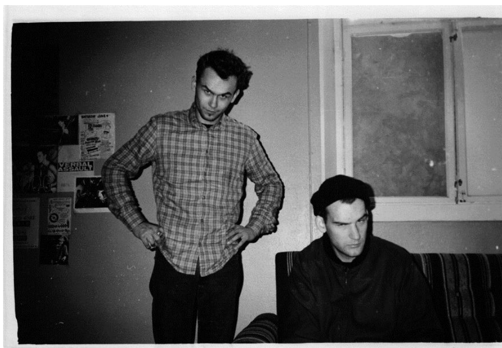
Obr. 2: Zleva Alec a Ian Mackaye