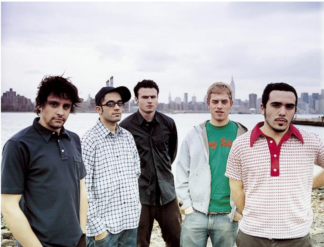
Obr. 8: Glassjaw