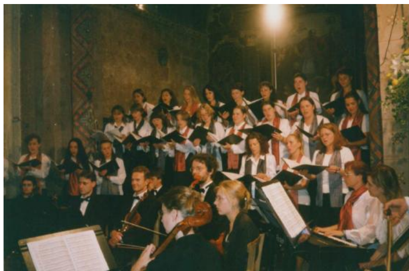
Obr. 4 Dívčí akademický sbor na uměleckém zájezdu v Bordeaux 2001 zdroj záznamy z kronik ĎAS)