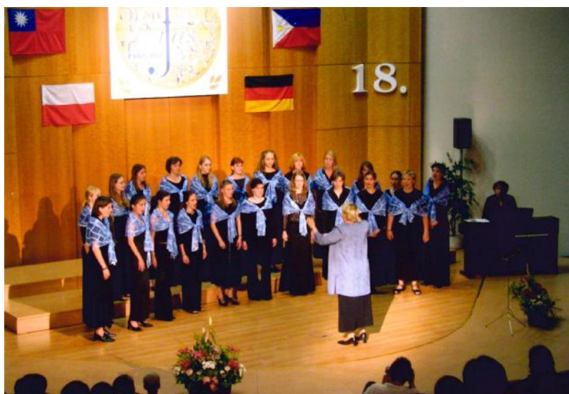
Obr. 5 Dívčí akademický sbor na Mezinárodním festivalu akademických sborů IFAS