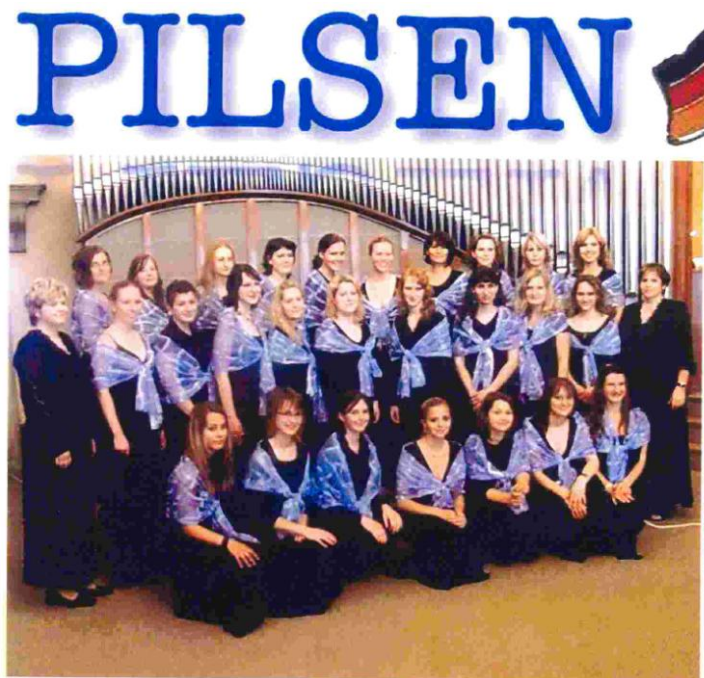
Obr. 7 Dívčí akademický sbor v Kolíně nad Rýnem 2008

V listopadu roku 2008 navštívil sbor opět německé sousedy, tentokrát zazářil spolu s Folklórním souborem Univerzity Kolín v Kolíně nad Rýnem. Zde těleso pořídilo velice zdařilou nahrávku svého vystoupení, vyniká na ní vysoká umělecká hodnota sboru (viz. Obr 7). Spolupráce s folklórním souborem Univerzity v Kolíně byla velmi obohacující a Kolínský soubor přijel hned v dubnu roku 2009 na koncert do Plzně, kde Dívčí akademický sbor křtil své již druhé CD s názvem Zpěvy z Plzeňska. 35