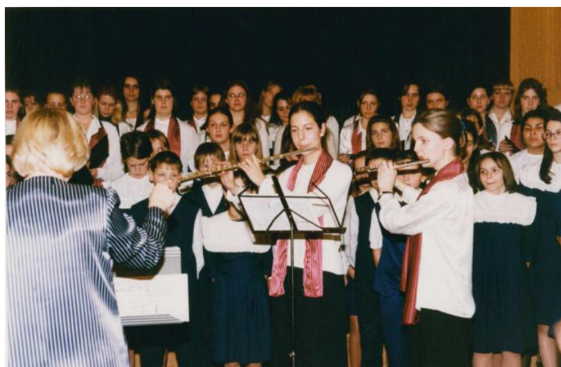
Obr. 2 Dívčí akademický sbor a dětský pěvecký sbor Mariella Plzeň