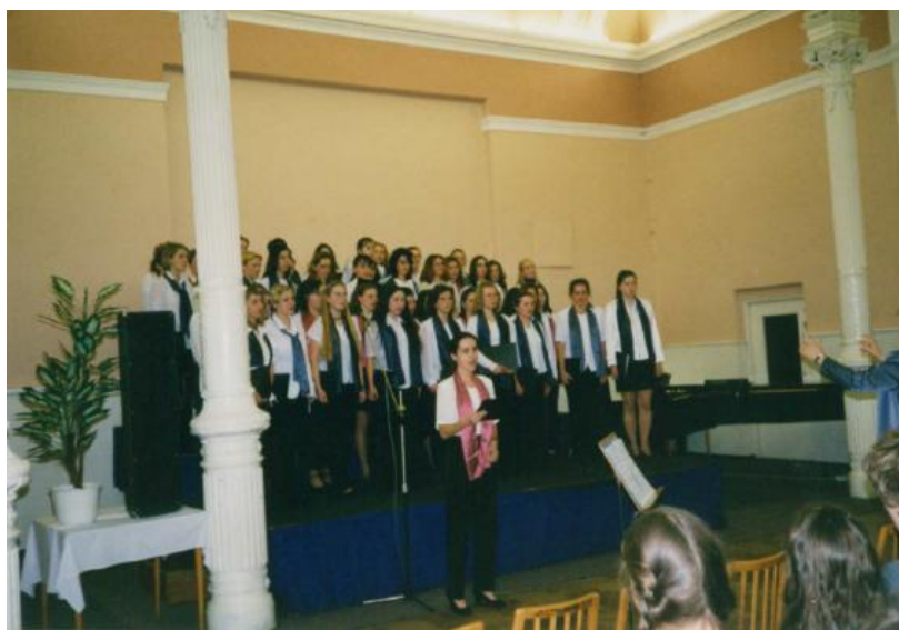
Obr. 3 Dívčí akademický sbor na festivalu Smetanovské dny