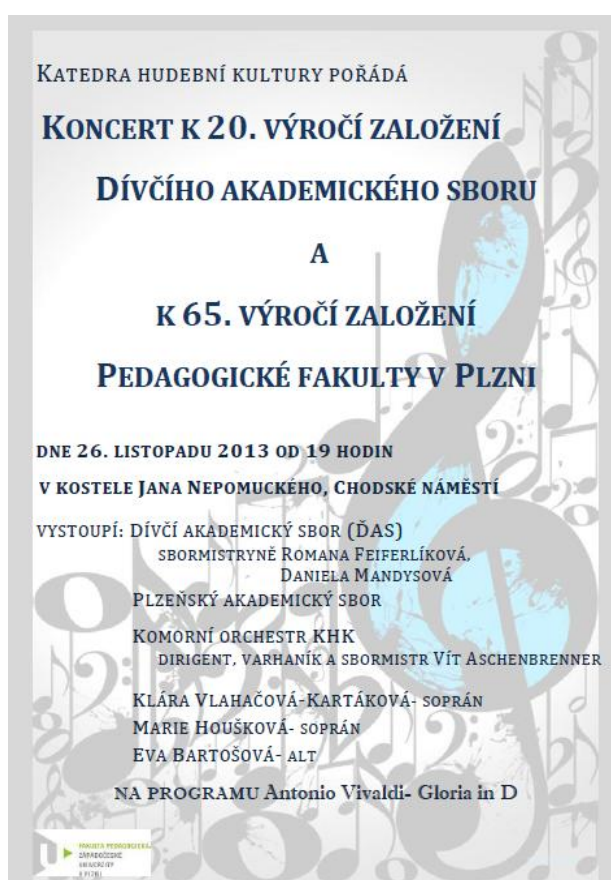
Obr. 8 Plakát ke koncertu k 20. výročí založení sboru a k 65. výročí založení Pedagogické fakulty v Plzni (zdroj kroniky ĎAS)

PAS začal organizačně fungovat jako součást Dívčího akademického sboru. Ačkoli toto uspořádání vynívá velmi zvláště, pravdou je, že hudební potenciál sboru zvýšil a sbormistrům se otevřely nové možnosti při volbě repertoáru. Sbory nacvičují jak ženské a mužské sbory, tak mají možnost při spojení interpretovat skladby pro sbory smíšené. Nové uspořádání předvedlo těleso obohacené již o pánskou složku v rámci 16. ročníku Šumava – Bayerischer Wald, kde sbor nastudoval pod vedením sbormistra V. Aschenbrennera Vivaldiho Glorii in D, tentokrát ve smíšené sazbě a předvedl ji v německém městě Bad Kötzting. V listopadu pak ĎAS oslavil 20. výročí svého působení a 65. výročí Pedagogické fakulty slavnostním koncertem duchovní hudby v kostele Jana z Nepomuku (viz. Obr. 8)