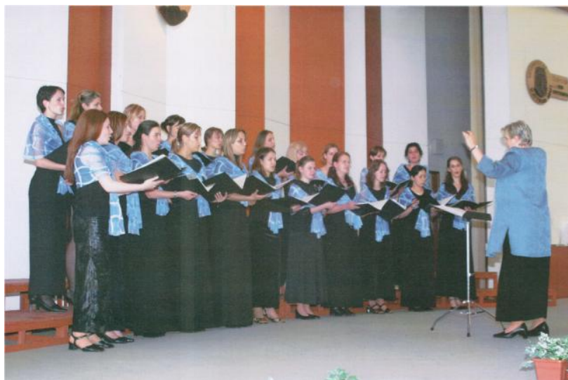
Obr. 6 Dívčí akademický sbor na Mezinárodním soutěžním festivalu vysokoškolských sborů v Báňské Bystrici (zdroj kroniky ĎAS)

Opětovně ovšem sbor zazářil na Mezinárodním soutěžním festivalu vysokoškolských pěveckých sborů v Báňské Bystrici, kde získal hned tři ocenění. Ze Slovenska si dívky odvezly diplom za umístění ve zlatém pásmu v kategorii ženských pěveckých sborů, opakovaně obdržely Cenu Asociace speváckých zborov Slovenska za vyspělou hlasovou kulturu a do třetice Cenu primátora města Banská Bystrica nejlepšímu zahraničnímu pěveckému sboru festivalu (viz. Obr. 6).