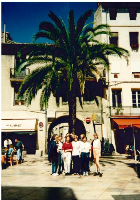
Obr. 1 Dívčí akademický sbor na uměleckém zájezdu ve Francii rok 1997

Pro tuto příležitost sbormistryně připravily repertoár plný skladeb soudobých i klasických českých autorů a dokonce i děl západočeských autorů. Neopomněly však ani skladatele světové, a to rovněž klasické i soudobé. Sboristky zde doprovázel Komorní orchestr KHK FP ZČU složený z členek sboru. 7