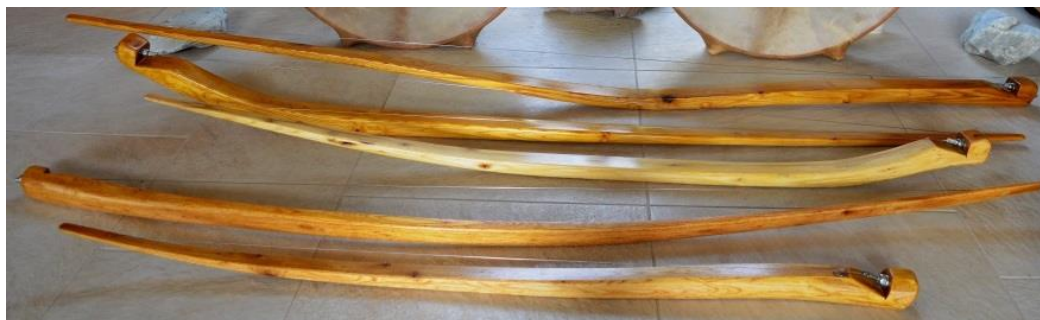
Obrázek G/1 – Hudební luky