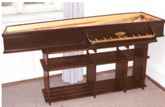
Obrázek G/9 – Cimbal d'amour