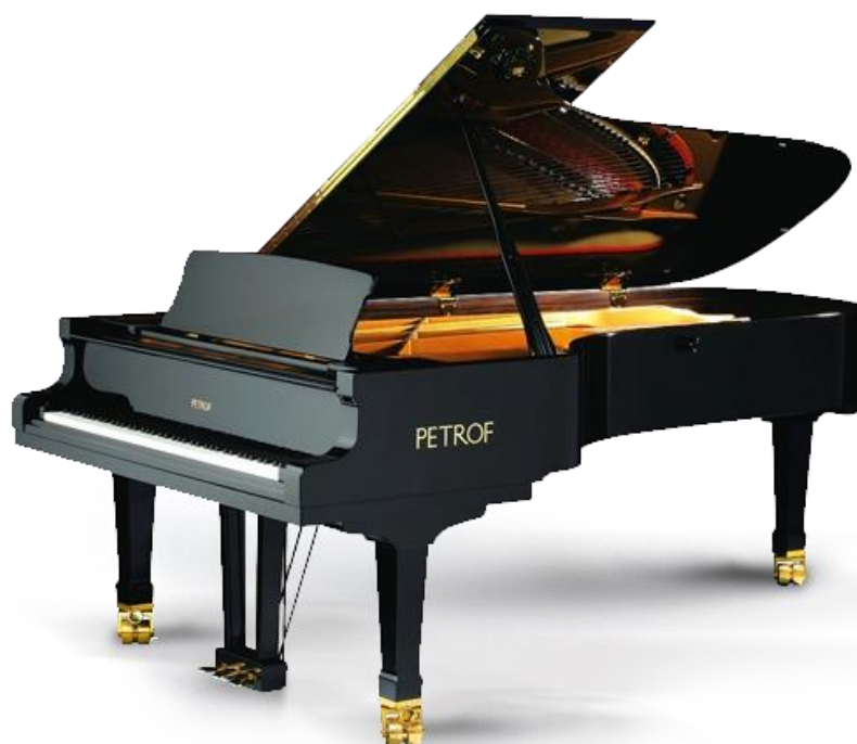
Obrázek G/12 – Klavírní křídlo

Obrázek G/11 : PETROF. Pianina [online]. [cit. 2015-03-19]. Dostupné z: http://www.petrof.cz/files/pianino_p_125_m1/p-125-m1-1.jpg