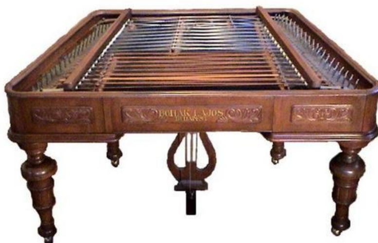
Obrázek G/2 – Cimbál

Obrázek G/1 : Léčení zvukem. Hudební luk [online]. [cit. 2015-03-19]. Dostupné z: http://www.leceni-zvukem.cz/hudebni-luk/#dsc-0009-1-jpg