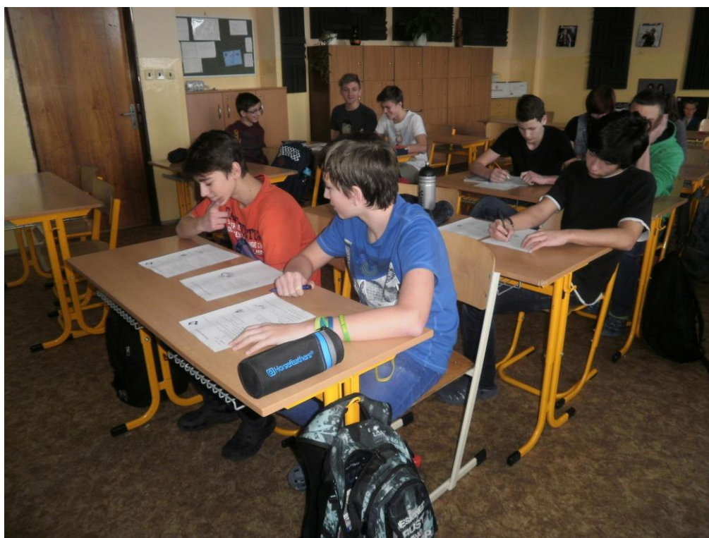
Obrázek H/2 – Práce s pracovními listy (M. F.)