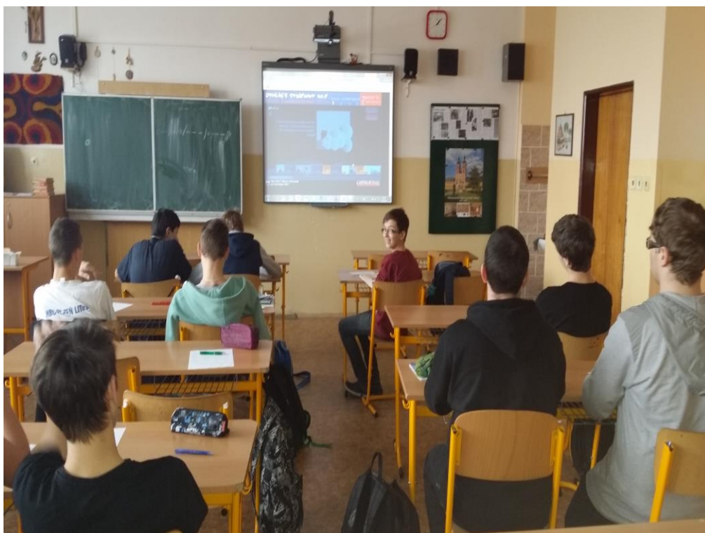
Obrázek I/4 – Interaktivní video symfonie Z Nového světa od A. Dvořáka (M. F.)