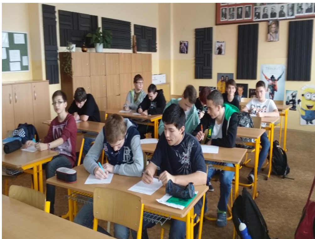
Obrázek I/2 – Práce s pracovními listy (M. F.)