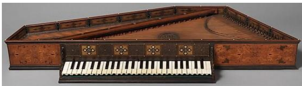
Obrázek G/8 – Virginal

Obrázek G/7 : Musical Instruments at Your Fingertips: Keyboard. Spinet [online]. [cit. 2015-03-19]. Dostupné z: