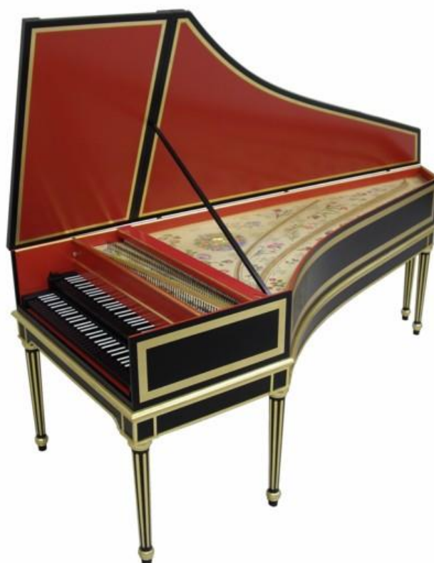
Obrázek G/6 – Clavicembalo

Obrázek G/5 : The Metropolitan Museum of Art. Clavichord [online]. [cit. 2015-03-19]. Dostupné z: http://www.metmuseum.org/toah/images/h2/h2_1986.239.jpg