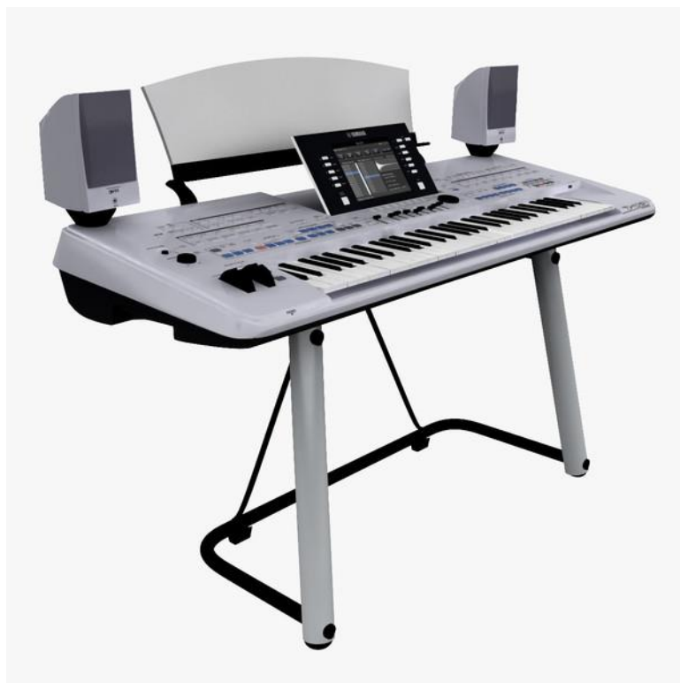
Obrázek G/13 – Keyboard (klávesy)