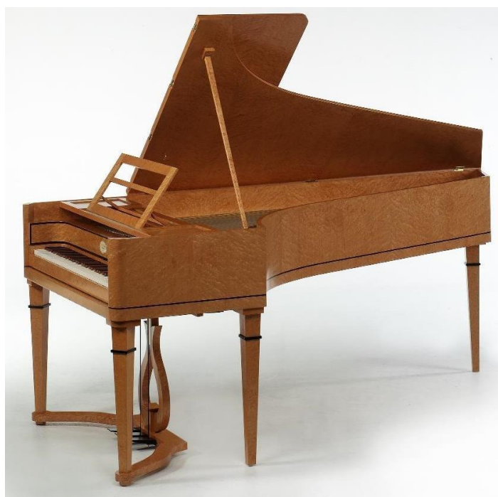
Obrázek G/10 – Fortepiano

Obrázek G/9 : Marc Vogel: Harpsichords. Cimbal d'amore [online]. [cit. 2015-03-19]. Dostupné z: http://www.vogel-scheer.de/images/image/instr/spin/damore1.jpeg