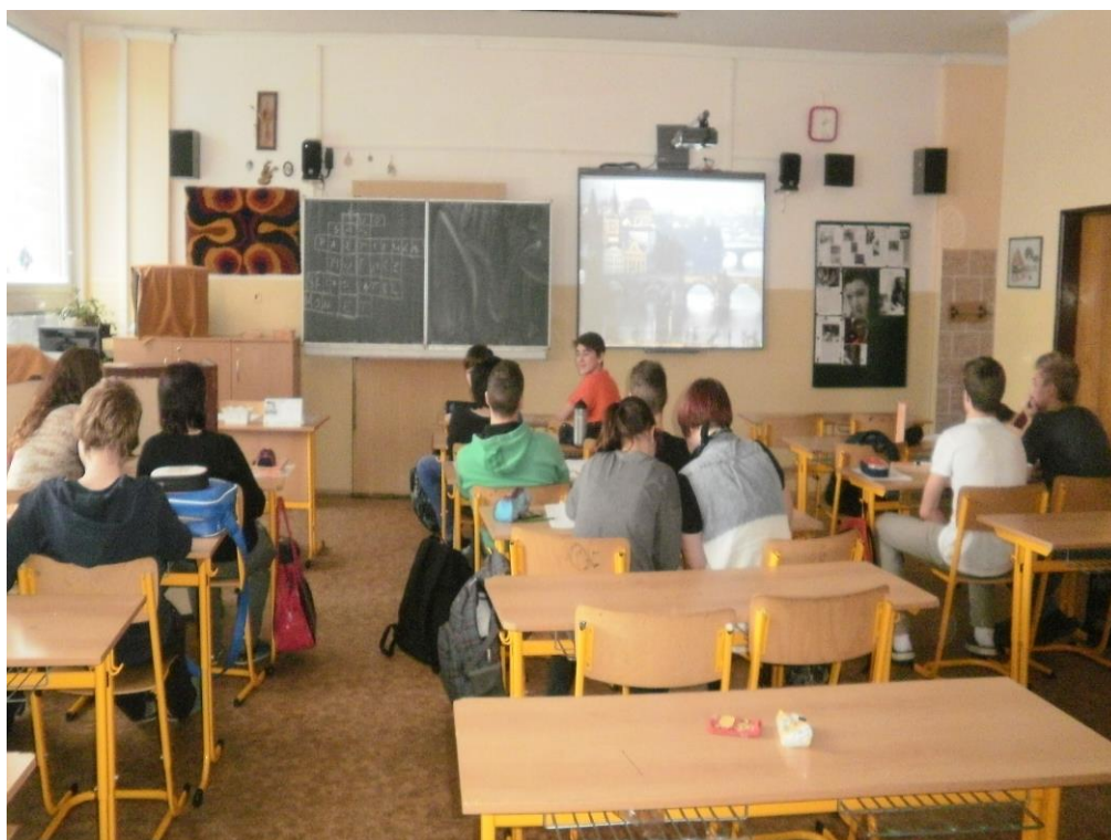
Obrázek H/4 – Řazení částí symfonické básně Vltava dle poslechu (M. F.)