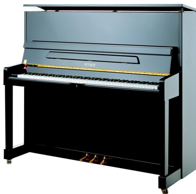
Obrázek G/11 – Pianino