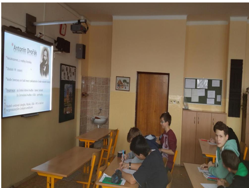
Obrázek I/3 – Téma HV Antonín Dvořák (M. F.)