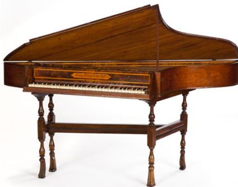
Obrázek G/7 – Spinet