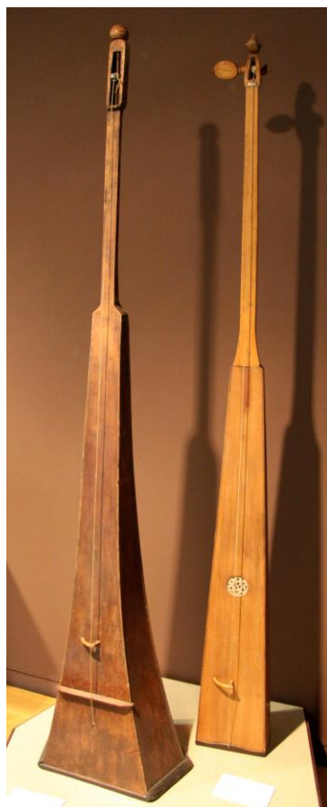
Obrázek G/3 – Monochordy