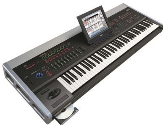
Obrázek G/14 – Syntezátor

Obrázek G/13 : Turbo Squid. Workstation Keyboard Yamaha Tyros [online]. [cit. 2015-03-19]. Dostupné z: http://preview.turbosquid.com/Preview/2014/07/06__15_10_32/Workstation_Keyboard_Yamaha_Tyros_00.jpg8783ce25-1712-4c5b-88e4-70b1bd4057beOriginal.jpg