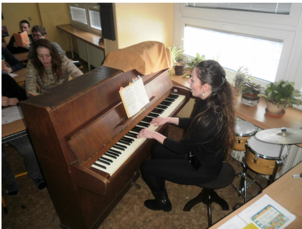
Obrázek H/3 – Klavírní doprovod a zpěv písně Kde domov můj (M. F.)