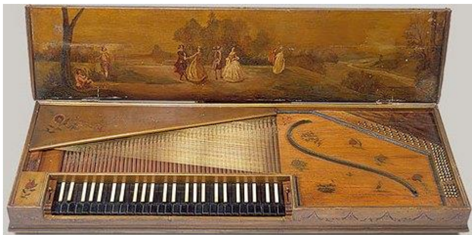
Obrázek G/5 – Clavichord