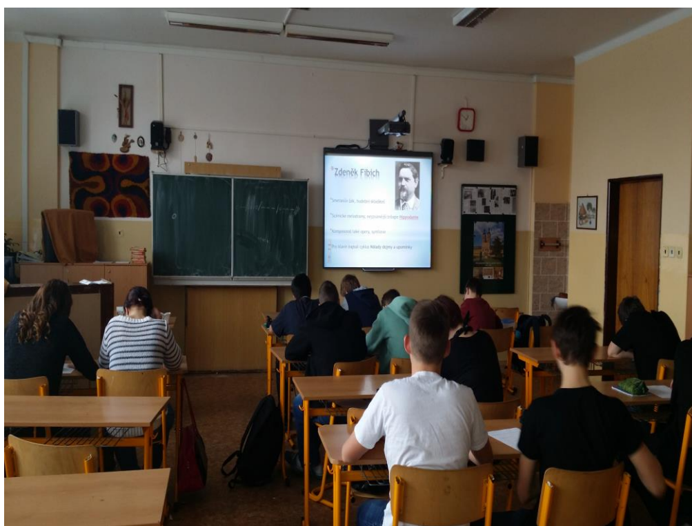
Obrázek I/1 – Téma HV Zdeněk Fibich (M. F.)