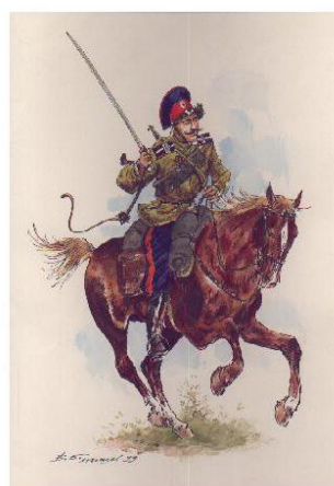
Obrázek 2 – Donský kozák