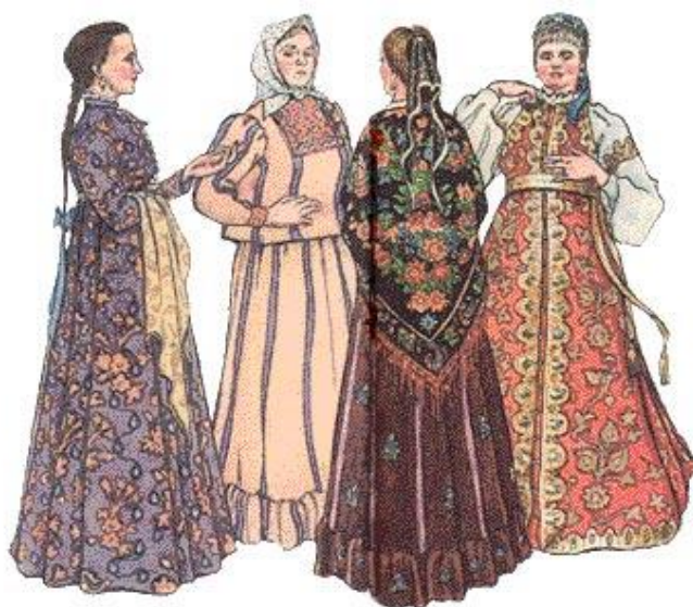
Obrázek 9 – Kozáčky

Ženský oděv kozáckých manželek je obtížnější specifikovat. Jedná se o velice pestrou škálu oblečení, protože každá stanice, každé vojsko a dokonce každý kozácký rod měl svůj specifický šatník. Nemusel se lišit naprosto celý, ale pouze detaily. Zvláštností ženského kozáckého oděvu byly pokrývky hlavy. Nosily tak zvané „povojniky“, to jsou zdobné šátky. Ženám nebylo dovoleno chodit do kostela s nezakrytou hlavou, pokud žena neměla zakrytou hlavu, byla považována za naprosto nevychovanou a divokou bytost. Později nosily i krajkové šátky a v 19. století jakési čepčky (kloboučky) neboli „kolpaky“. Těmito různými pokrývkami rovněž ženy poukazovaly na svůj rodinný stav. Vdaná žena by se nikdy před lidmi neobjevila bez kloboučku (kolpaku), všechny nosily krajkové šátečky. Bylo by naprosto nemyslitelné, aby jej některá neměla, bylo by to stejné, jako kdyby kozák neměl na hlavě svou typickou čapku. Děvčata si zaplétala vlasy do copů a do nich vplétaly barevné stužky, tyto copy ještě stáčely do jakéhosi kruhu. [14]