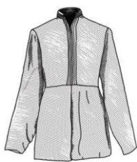
Obrázek 4 – „rubácha“

Kalhoty byly právě přizpůsobené jízdě na koni. Jedná se o široké kalhoty. Neměnili jejich vzhled už od jejich vzniku, až do 18. - 19. století. Košile byly dvou typů. Jedna, která byla obyčejná, byla šitá z plátna „rubácha“ ( pyбaxa ). Zastrkávali si ji do kalhot a druhá byla slavnostní, většinou šitá z hedvábí „bešmet“ ( бешмет ), tu nechávali volně viset. Obyvatelé stepí rádi používali hedvábnou látku, říkali totiž, že na hedvábí se neudrží vši. Pokud byla zima, oblékali si krátký kožíšek a na něj ještě parku, což je teplá, delší bunda. Navrch si oblékali prošívaný plášť volného střihu, podobající se kaftanu. Když byla opravdu veliká zima a nečas, nosili dlouhý ovčí kožich., dobře po něm stékala voda a když byl mráz, tak na rozdíl od obyčejné kůže nepraskal. Na Kavkaze místo tohoto kožichu nosili plášť z plstě. Na hlavu si nasazovali kapuce, které byly na konci špičaté. Měli velikou škálu vysokých bot, které byly při jízdě na koni také důležitou součástí kozáckého oděvu. Používali ozdobné boty s měkkou podrážkou, což je pro ně typické. Také nosili koženou obuv s řemínky, takzvané „bašmaky“ ( башмаки ), které získaly svůj název podle toho, z čeho byly vyráběné a to z kůže telat. [15]