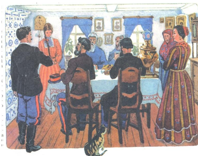
Obrázek 14 – namlouvání nevěsty

V ulicích zněly zvony a kozácké písně, k domu nevěsty přijížděl ženich se svým doprovodem. Nevěsta se mezitím rozloučila s rodiči. Seděla u stolu se zapleteným copem oblečená do svatebních šatů. Spolu s ní seděli u stolu sestry, bratři, dědečkové s biči v ruce a nepustili ženicha k nevěstě, dokud si ženich nevěstu nevykoupil. Poté, co se tak stalo, byli mladí oddáni a poté odjeli k ženichovi domů, kde je vítali a žehnali jim chlebem. Tradicí bylo tento chléb lámat nad jejich hlavami, což mělo značit, aby žili v blahobytu. Sypali na ně ořechy, bonbony, pšenici a chmel. Po obřadě ženě dívky rozpletly její cop a vyčesaly jí je na vrcholek hlavy, oblékly jí do oděvu, který označoval, že je dívka vdaná. Následující den se obcházelo s tradičním svátečním chlebem a vybíraly se dary, od otce dostal syn koně se sedlem a od matky dojnou krávu. Mladí novomanželé děkovali všem svatebčanům a loučili se s nimi, tato tradice trvala někdy i celý týden. Novomanželé navštěvovali příbuzné a známé. [12]