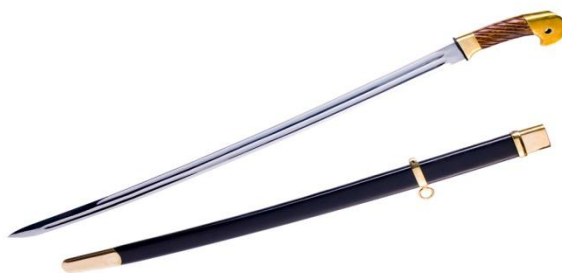
Obrázek 13 – kozácká šavle

K neznámějším symbolům patří typická čepice, se kterou si kozáka asociuje snad většina lidí. Čepici odkládají během zasedání kruhu, při motlitbě nebo při přísaze nebo jestliže přijdou na návštěvu. V opačném případě ji nosí neustále na hlavě. Pokud kozákovi někdo srazí čepici z hlavy, značí to výzvu k souboji. [15]