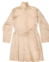
Obrázek 5 – „bešmet“