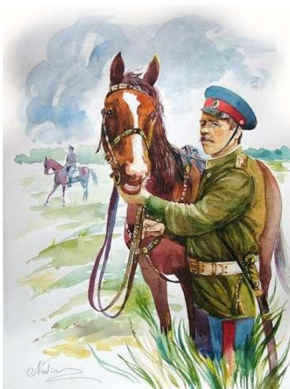
Obrázek 3 – Kozáci, milovníci koní

Jak jsem již výše zmínila, kozák byl nezávislý člověk, který prahl po svobodě, nemínil být spoutaný zákony a pravidly carské ruské vlády. Hodlal poslouchat pouze pravidla a vojenská nařízení svého vůdce atamana. Jinak byl vládcem sám sobě. Kozáci byli skvělými bojovníky, kteří se dokázali mistrně pohybovat stepí na koni. Donští kozáci chytře využívali plody řeky Don a její blahodárné okolí.