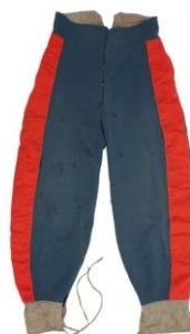
Obrázek 12 – donské kozácké kalhoty s pruhy

Dalším typickým symbolem jsou pruhy na kalhotách, ukazující na kozáckou příslušnost. Jsou to barevné nášivky na kozáckých kalhotách. Podle barvy se pozná příslušnost k vojsku a barva je vždy stejná jako pruhy na čepici. Symbolizuje svobodu kozáků a u jednotlivých vojsk se mohou barvy lišit. Například donští mají rudé pruhy, orenburské vojsko má pruhy modré a Zabajkalci zase žluté. [17]