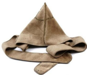
Obrázek 7 – „bašlyk“

Jako všichni vojáci, nosili vojenskou standardní uniformou, od ostatních se lišila malými detaily, knoflíky na uniformě, náušnicemi v uších. Symbolika nošení náušnic má svá pravidla, pokud má rodina pouze jedno dítě a to chlapce, tento chlapec nosí náušnici v levém uchu a pokud v rodině bylo více dětí, ale pouze jedním z nich byl chlapec, nosil náušnici v pravém uchu. Na hlavě nosili Kozáci především plátěné čepice se špičatými vršky, tzv. „bašlyk“ ( баулык ), velice známé byly vysoké, kožešinové čepice „papacha“ ( Папача ). Tyto čepice měly hlubokou symboliku. Například, když se kozák vrátil ze služby, hodil svou čepici do řeky, od které pocházel. Jestliže si kozák bral za ženu vdovu, hodil čepici jejího bývalého muže do vln řeky. Obyčejně byly do čepic zašívány svaté ikony nebo modlitby napsané dětskou rukou, které měly ochraňovat jejich nositele. Za klopu si vojáci vkládali osobní dokumenty nebo různá nařízení. Razili pravidlo, že kozák může ztratit tuto čepku pouze se svou hlavou. [15]