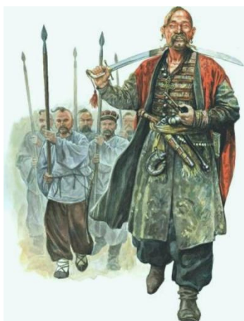
Obrázek 1 – Záporožští kozáci

Za nejstarší kozácké vojsko je považováno Záporožské. Název vznikl podle místa, které vojsko zaujímalo, jednalo se o polohu za peřejemi Dněpru (pozn. rusky peřeje – porogi, za kterými se vojska usadila. To znamená, že vojska byla rozložena za „porogami“, od toho se tedy odvozuje název vojska Záporožské). Vojáci byli odpůrci Polska, proti němuž se koncem 16. století znovu postavili. Rozšiřování carské moci se dotklo i tohoto kozáctva. Vzhledem k tomu, že vojsko nedokázalo uznávat cizí autority, bylo jejich území místem mnoha konfliktů s carskou mocí a po jejich potlačení byla vojska nucena přestěhovat se do údolí řeky Kubáň, kde se poté formovali noví kozáci, tedy kubánští, kteří si uchovali ukrajinský jazyk i jména. [1]