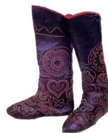
Obrázek 6 „bašmaki“