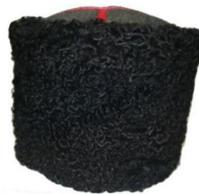
Obrázek 8 – „papacha“