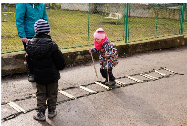
Fotografie č. 7 – Skoky na lyžích

V této disciplíně jsou zahrnuty lokomoční pohybové dovednosti – poskoky a skoky, konkrétně přeskakování malých překážek plynule za sebou, vpřed a snožmo. Děti se musí odrážet z obou nohou a na obě nohy dopadat. Dále by nohy měly být při odrazu vedle sebe, nikoliv jedna noha před druhou. Vzdálenost mezi dolními končetinami by měla být na šířku pánve. Odraz by měl být plynulý, dynamický a z kolen. Také se zde nachází nelokomoční pohybová dovednost – udržování rovnováhy v různých polohách. V tomto případě jde o situaci po dopadu, kdy je dítě nuceno udržet rovnováhu a nenechat se rozhodit.