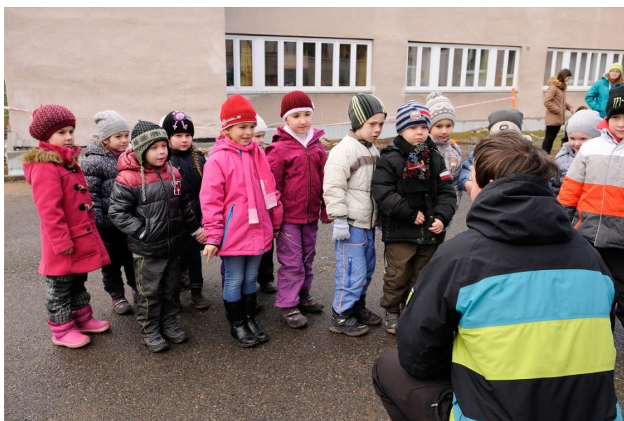
Fotografie č. 3 – Úvodní část

Funkce úvodní části je především organizační a motivační. Děti jsem si shromáždil kolem sebe a vhodným způsobem jim sdělil obsah sportovního dopoledne. Stručně jsem jim vysvětlil, co jsem si pro ně přichystal a že jejich úkolem bude nasbírat 5 razítek se zvířátky na kartičku, kterou si poté budou moci nechat. V průběhu vstupního mluveného slova jsem zároveň pohledem překontroloval cvičební oblečení dětí včetně obuvi a jejich aktuální zdravotní stav.