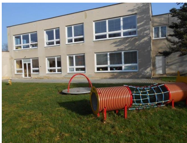
Fotografie č. 1 - MŠ V Parku

Mateřská škola V Parku Rakovník je dvoutřídní MŠ pro děti ve věku zpravidla od 3 do 6 let. Kapacita MŠ je 52 dětí. Třídy jsou heterogenní.