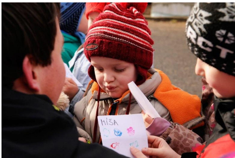
Fotografie č. 5 – Závěrečná část

Na závěr jsem si děti svolal k sobě a tázal se jich, jaká zvířátka nasbíraly, co jim přišlo nejtěžší a co je nejvíc bavilo.