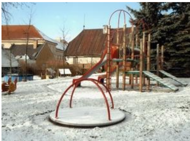
Fotografie č. 2 - MŠ V Hradbách

1. mateřská škola V Hradbách má v současné době 72 dětí, které jsou rozděleny do 3 tříd podle věku. Nejmladší děti jsou jablíčka, děti navštěvující druhou třídu se jmenují kytičky a nejstarší jsou hvězdičky.