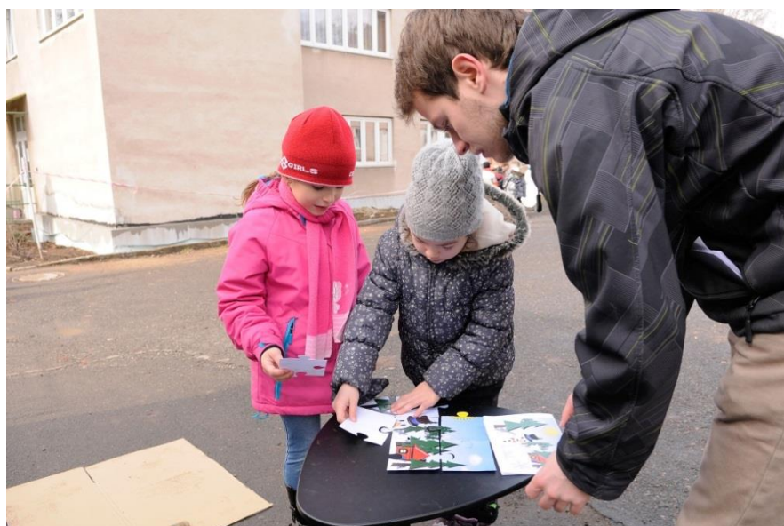
Fotografie č. 8 – Zimní Puzzle

Tato aktivita je složena jak z manipulační, tak i lokomoční pohybové dovednosti. Manipulační dovednosti - jemná manipulace dlaní a prsty horních končetin, uchopování a podávání. Lokomoční dovednost - běh. Zároveň jde o sociální dovednosti, kdy se děti učí spolupráce v kolektivu.