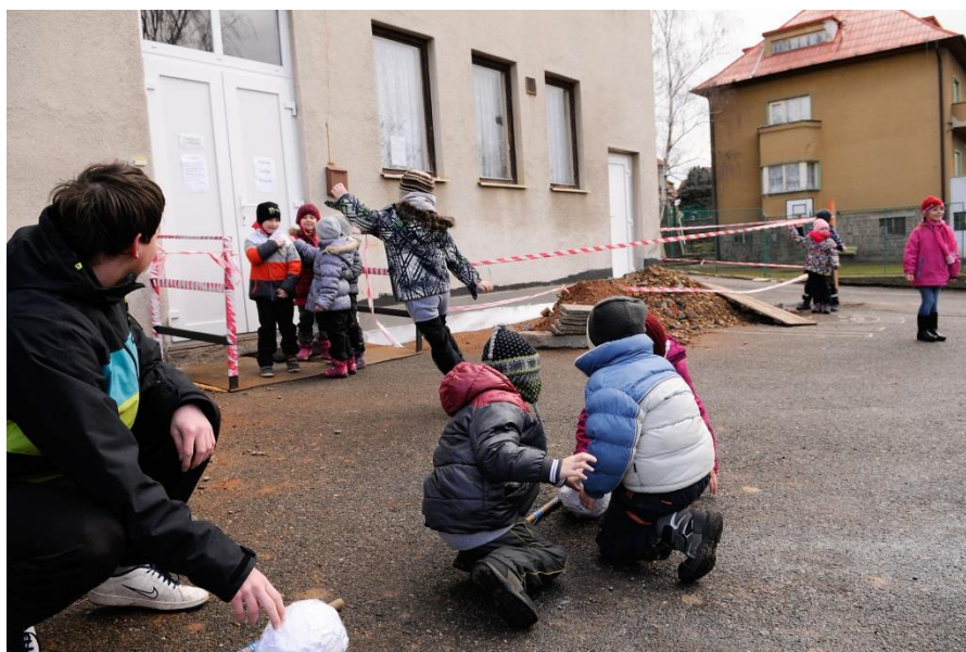
Fotografie č. 4 – Rušná část

Já jsem zvolil pro rušnou část pohybovou hru, která nese název, Čáp ztratil čepičku. Opakoval jsem ji celkem čtyřikrát s různými barvami. Děti se proběhly a zahřály. Pokud nemohly najít určenou barvu, povolil jsem jim najít barvu na oblečení někoho z nich.