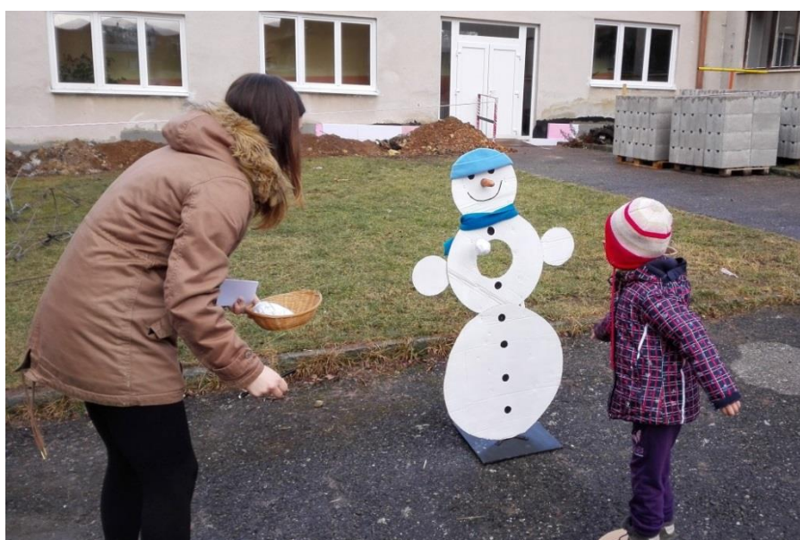
Fotografie č. 6 – Hod na sněhuláka

Tato aktivita patří mezi manipulační pohybové dovednosti – hod vrchem jednoruč. Správná technika provedení začíná u správného postoje, kdy má dítě jednu nohu vpředu (pro praváka je vpředu levá noha). Míček drží v pravé dlani a při přípravě na hod zapaží v úrovni ramen a mírně natočí trup vpravo. Při samotném hodu přenesse váhu z pravé nohy na levou současně s rotací pánve a ramen a vypuštění míčku z ruky.