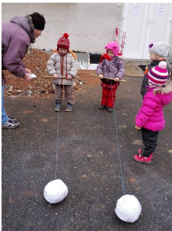
Fotografie č. 10 – Namotávání sněhové koule

Tato aktivita patří mezi manipulační pohybové dovednosti – ovládání předmětu horními končetinami a jemná manipulace dlaní a prsty. Důležité je, aby děti držely násadu od koštěte nadhmatem s palcem v opozici.