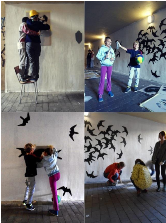
Obrázek č. 14 - Kultivace podchodu – didaktická část