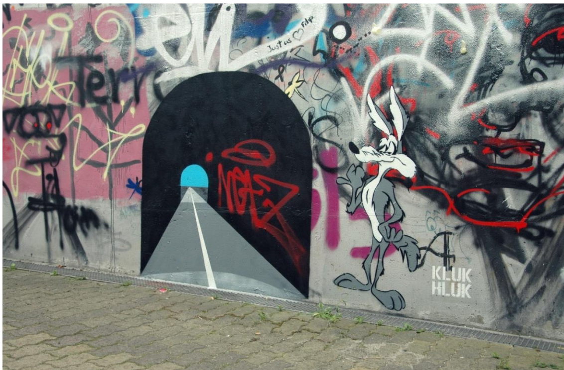
Obrázek č. 12 - Kultivace podchodu – didaktická část