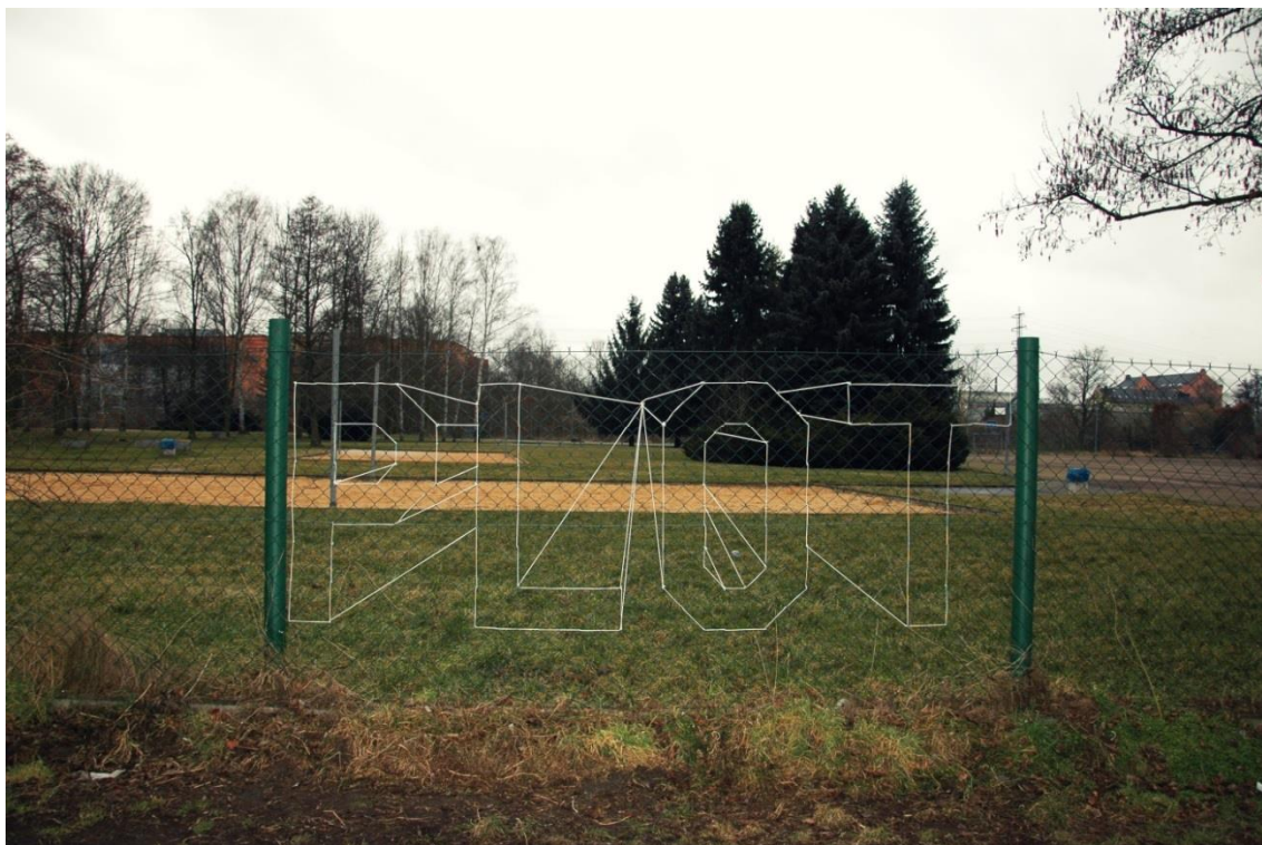
Obrázek č. 10 - Památník obětem narcismu