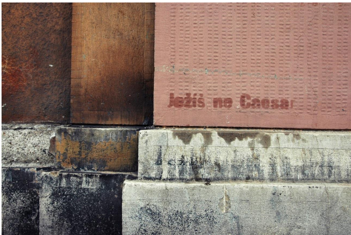
Obrázek č. 4 - Vox populi – odtrhávací leták