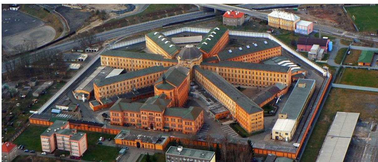
Letecký pohled na věznici - současnost