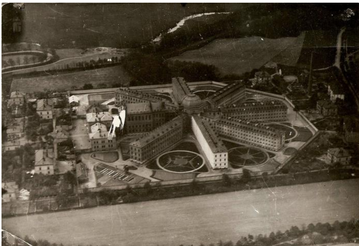
Letecký pohled na věznici z roku 1935