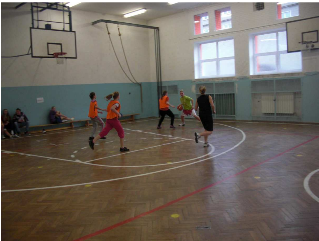
Obrázek 6 - dívky 8 - 9. třída