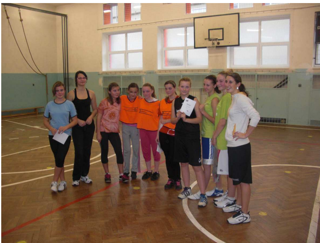
Obrázek 9 - závěrečné fotografie dívky