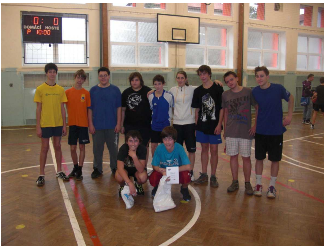
Obrázek 8 - závěrečné fotografie chlapci