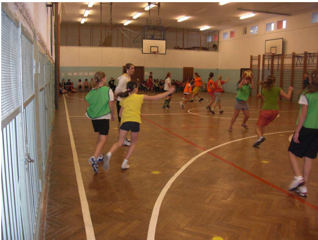
Obrázek 5 - kategorie 6 -7. třída