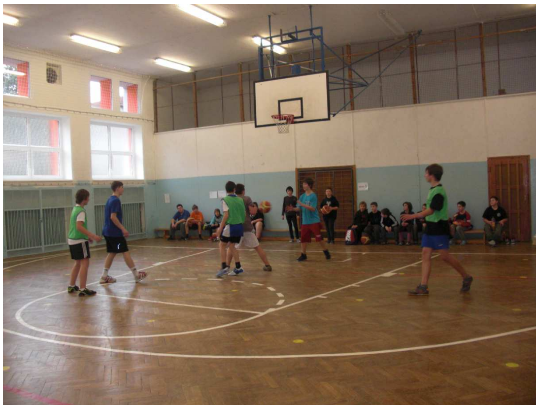
Obrázek 7 - chlapci 8 - 9. třída