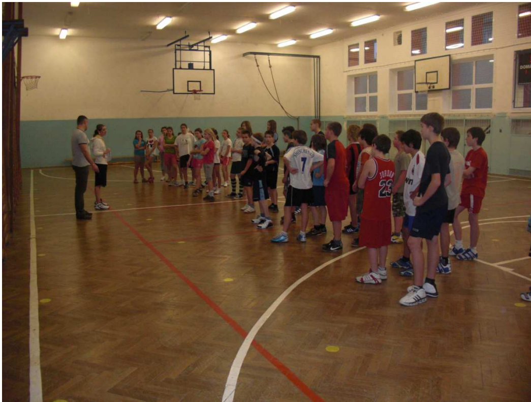
Obrázek 4 - nástup