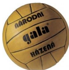
Obrázek 1: Míč pro národní házenou

Míč je vyroben z kůže nebo z umělého materiálu, jeho obvod se musí pohybovat v rozmezí 58,0-60,5 cm a hmotnost na počátku utkání mezi 290 a 420gramy.