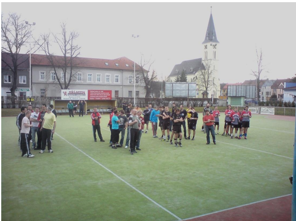
Obrázek 6: Závěrečné vyhlášení