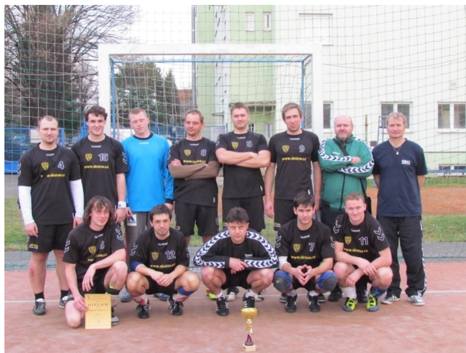
Obrázek 8: TJ Dioss Nýřany „A“ – 3. místo