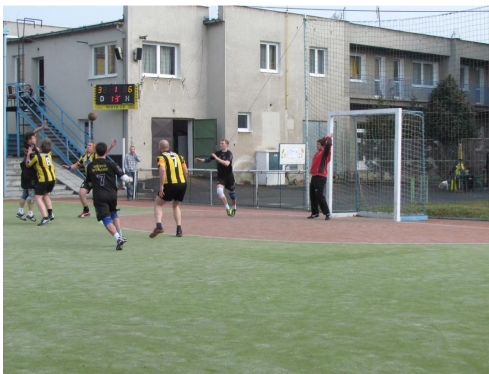
Obrázek 4: Družstvo TJ Dioss Nýřany „A“ při zakládání útočné akce