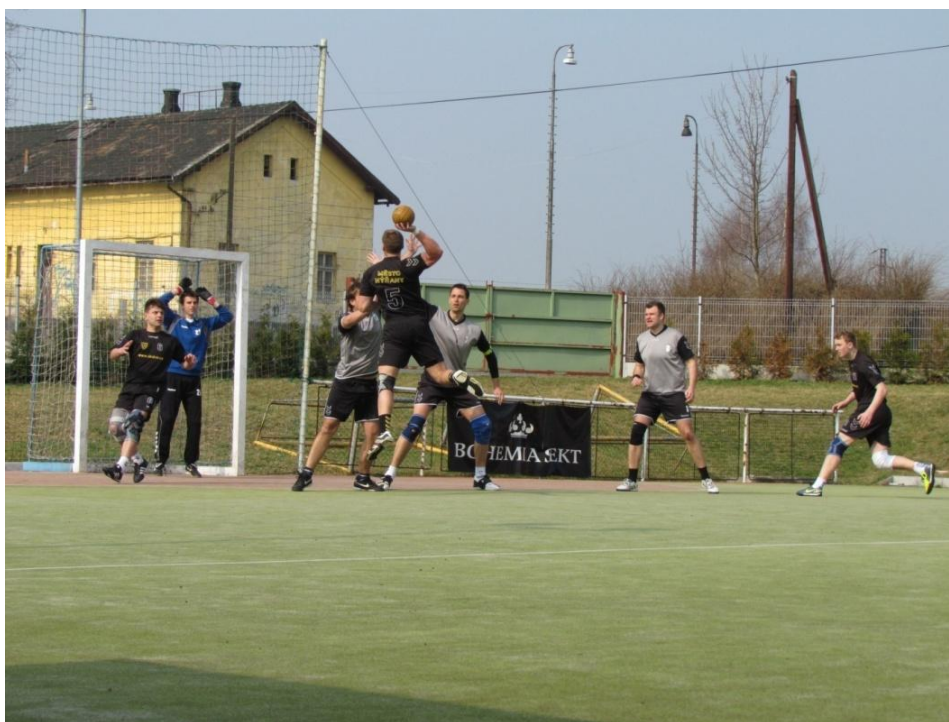
Obrázek 3: Útočník TJ Dioss Nýřany „A“ střílí na bránu soupeře