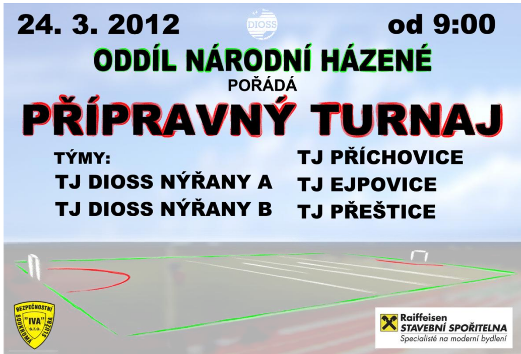
Obrázek 9: Plakát turnaje