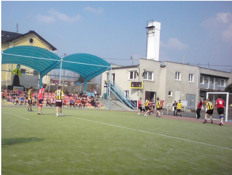
Obrázek 5: Útočníci Ejpvovic dobývají branku Nýřan „B“