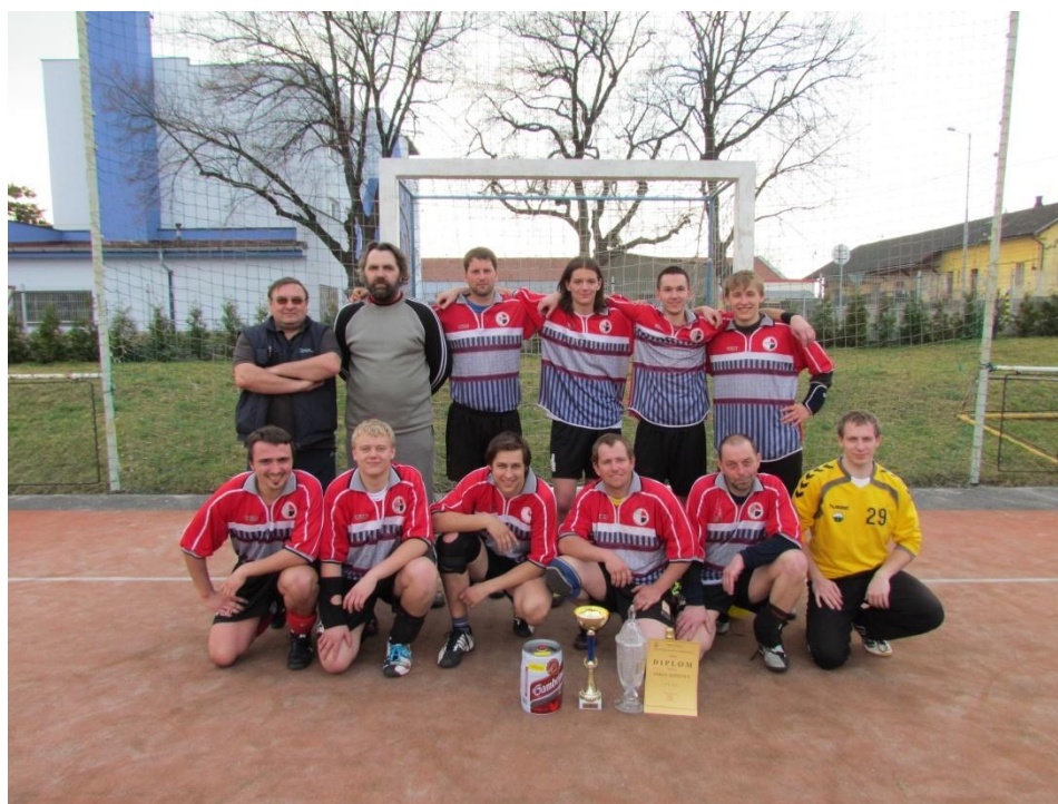
Obrázek 7: Vítěz turnaje TJ Sokol Ejovice