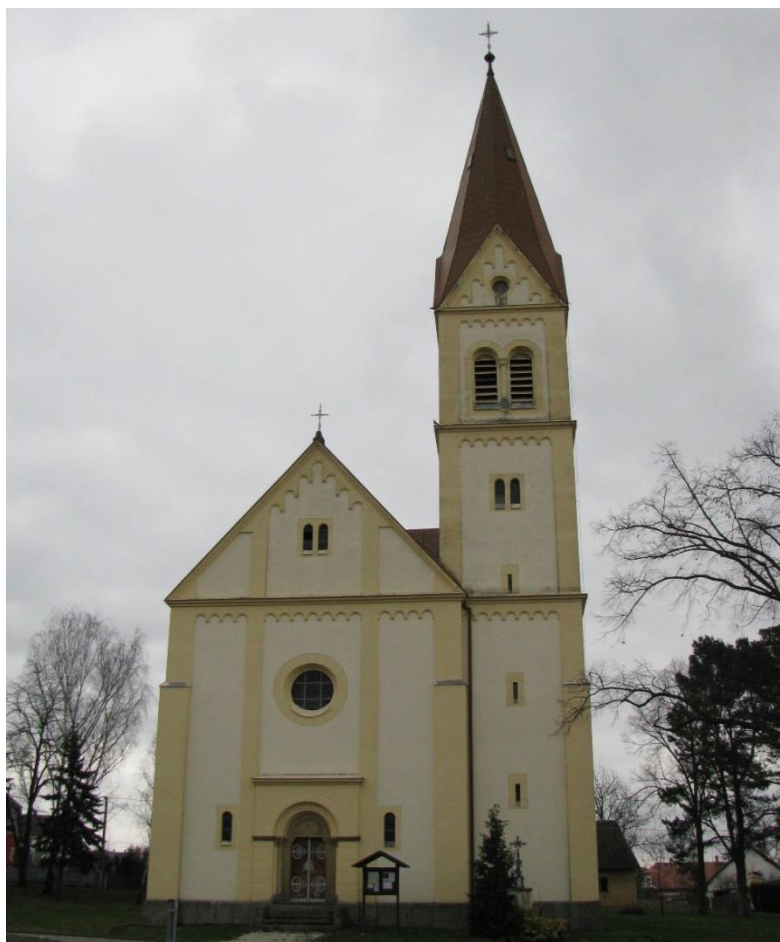
Obr. č. 8: Kostel sv. Václava - Bezděkov 10. 3. 2016