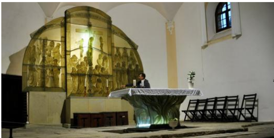
Obr. č. 10: Oltář Dobrá Voda

www.vira.cz [online]. [cit. 20. 3. 2016]. Dostupné z: