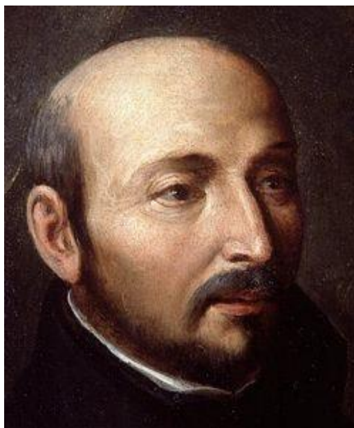
Obr. č. 1: Zakladatel řádu Ignác z Loyoly cs.wikipedia.org.[online],[cit. 20. 3. 2016]. Dostupné z: http://cs.wikipedia.org/wiki/Ign%C3%A1c_z_Loyoly