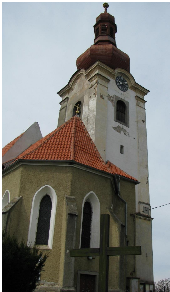
Obr. č. 14: Kostel Nanebevzetí Panny Marie – Týnec 20.3.2016