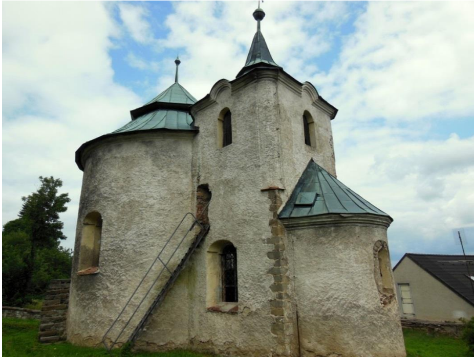
Obr. č. 15: Rotunda Zborovy

www.fotomapy.cz [online]. [cit. 20. 3. 2016]. Dostupné z: http://foto.mapy.cz/original?id=371625