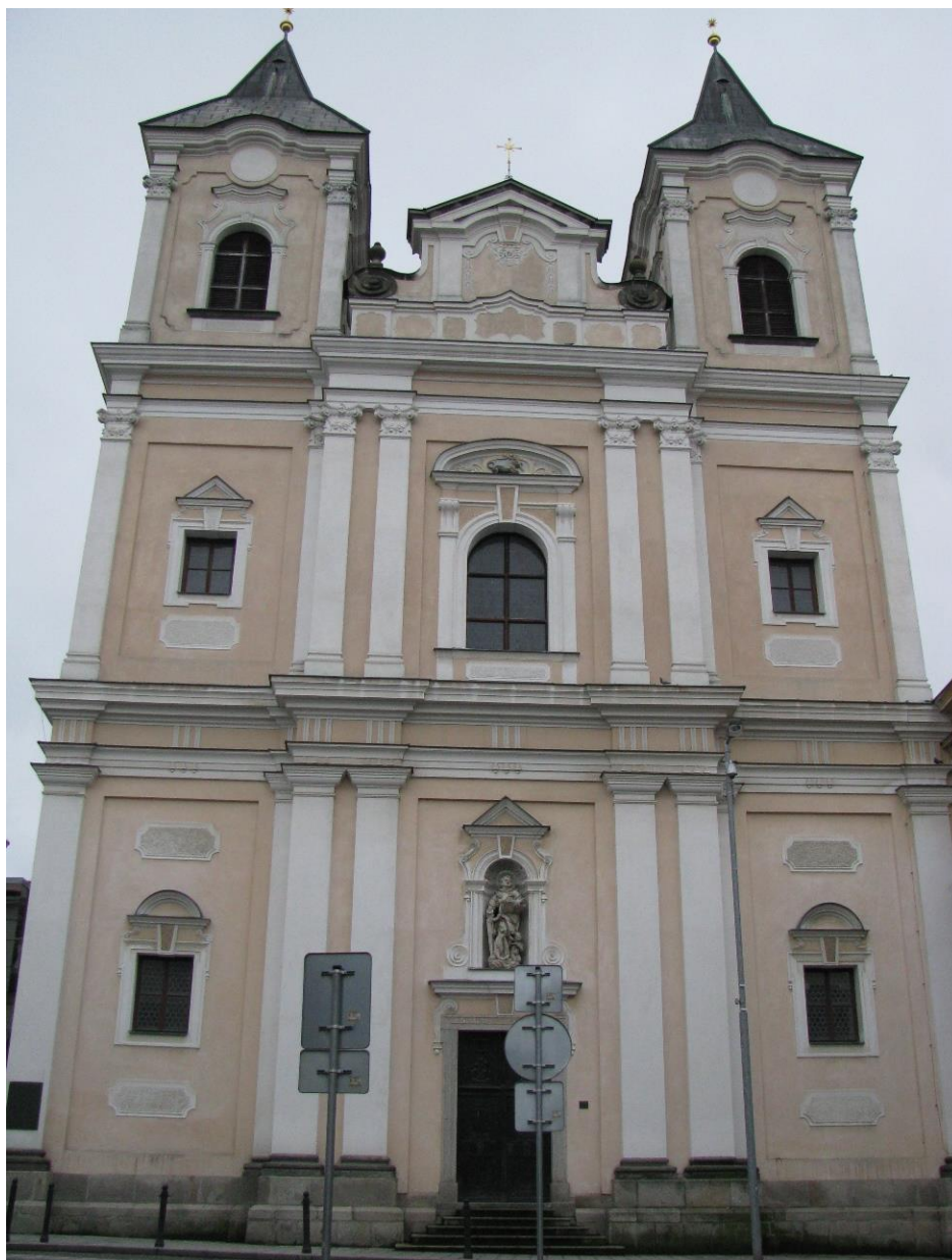
Obr. č. 7: Kostel sv. Vavřince 10. 3. 2016