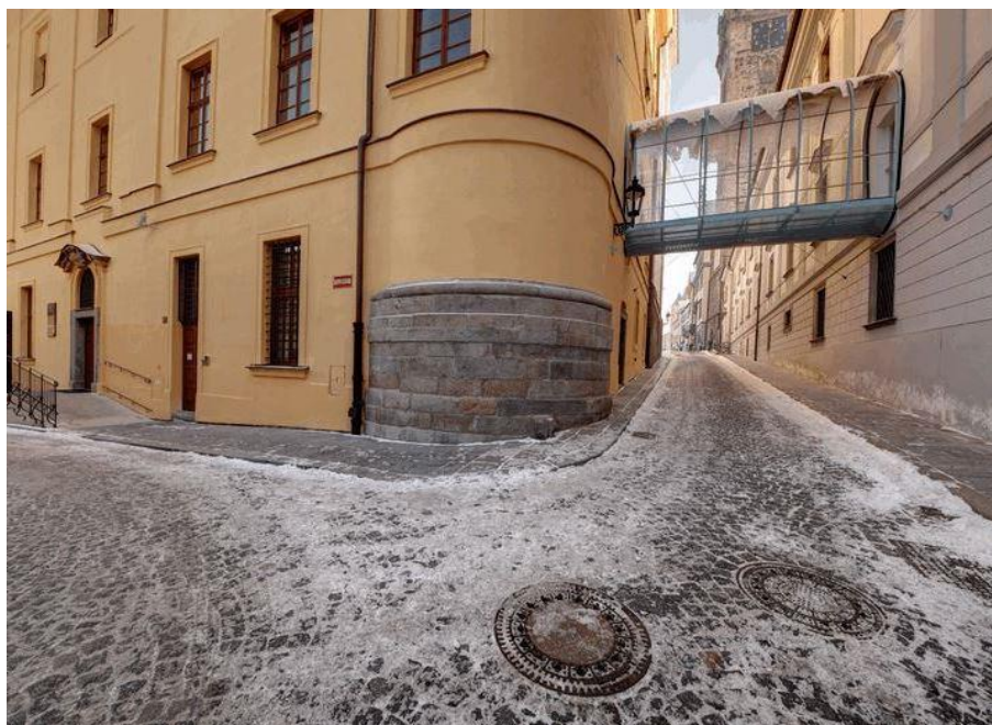
Obr. č. 4: Mostík Evy Jiříčné

http://www.katakomy.cz/galeriefotografii/virtualni-prohlidka-katakomb#photos