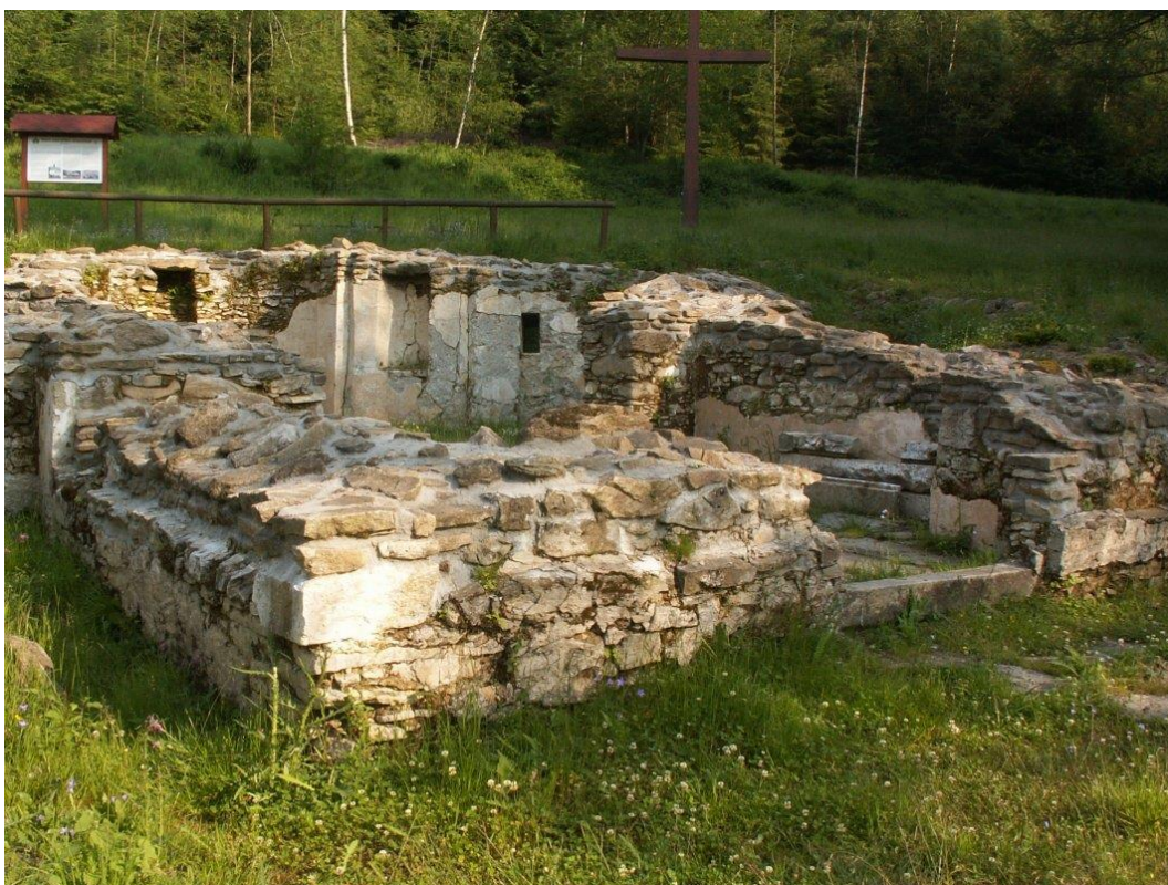
Obr. č. 11: Zbytky kostela sv. Kříže – Hamry

http://www.vira.cz/Texty/Clanky/Skleneny-oltar-sv-Vintir-Dobra-Voda.html