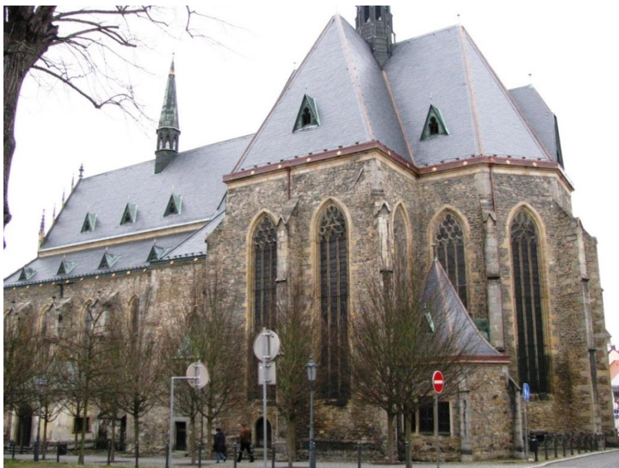
Obr. č. 5: Děkanský kostel 10. 3. 2016