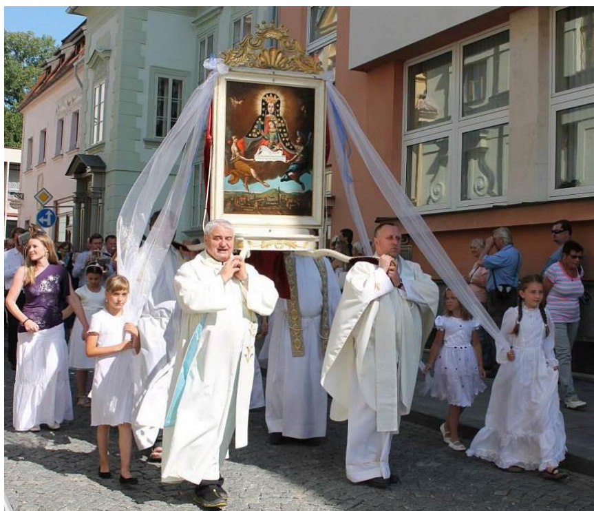
Obr. č. 6: Procesí s obrazem Panny Marie Klatovské při konání poutí www.klatovsky.denik.cz . [online]. [cit. 20. 3. 2016]. Dostupné z: http://klatovsky.denik.cz/galerie/pruvod-s-obrazem-panny-marie-klatovske.html