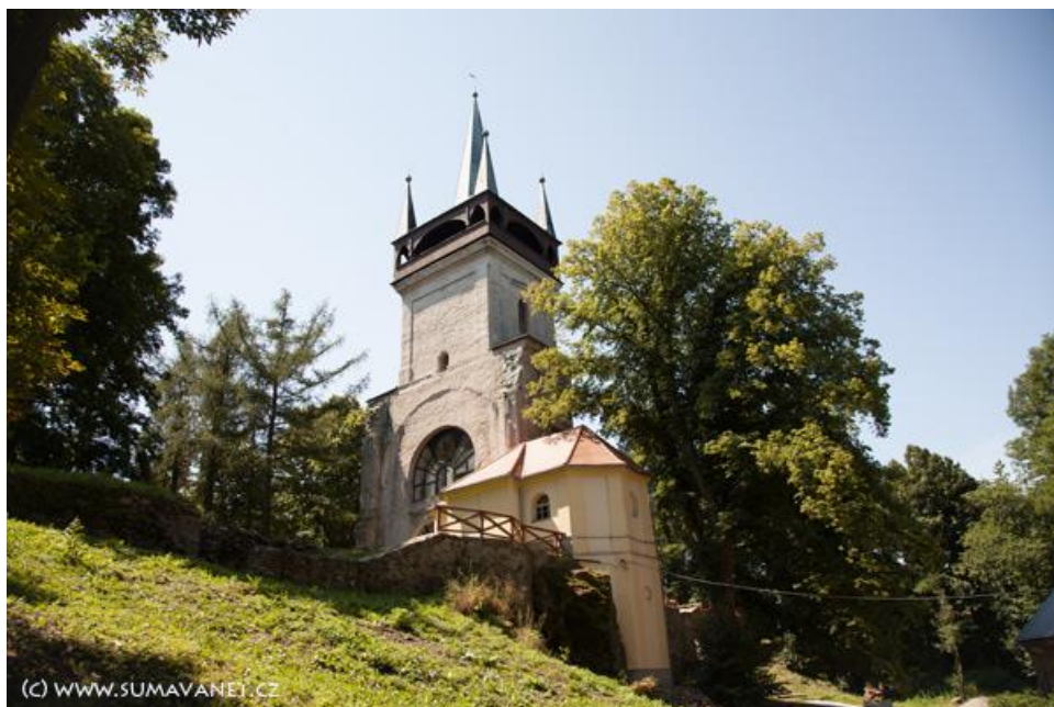
Obr. č. 12: Bolfánek – Chudenice

www.sumavanet.cz [online]. [cit. 20. 3. 2016]. Dostupné z: