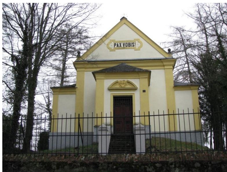
Obr. č. 9: Kostel sv. Anny - Bezděkov