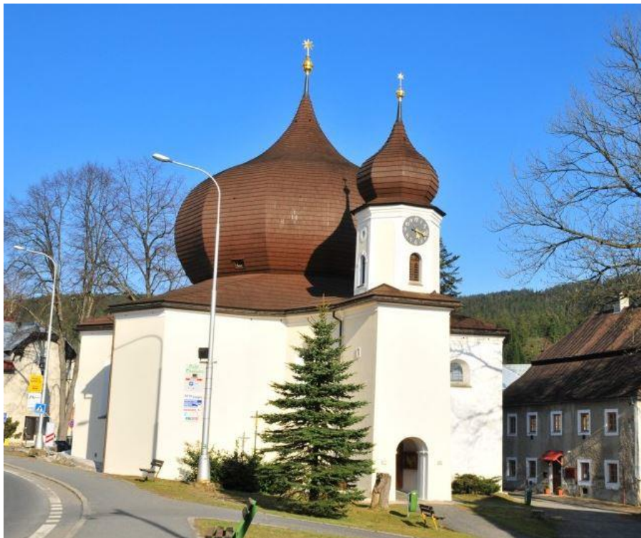
Obr. č. 16: kostel Panny Marie Pomocné - Železná Ruda

www.fotomapy.cz [online]. [cit. 20. 3. 2016]. Dostupné z: http://foto.mapy.cz/original?id=371625