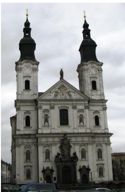
Obr. č. 2: Jezuitský kostel 10. 3. 2016