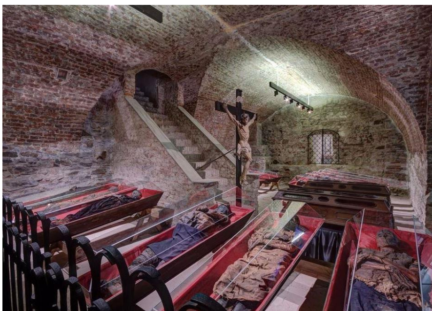
Obr. č. 3: Katakomy

www.katakomy.cz[online].[cit. 20. 3. 2016]. Dostupné z: