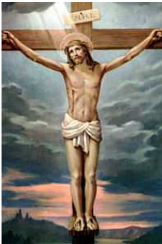
Obr. 5. Vyobrazení Ježíše Krista na kříži, zdroj: www.google.cz