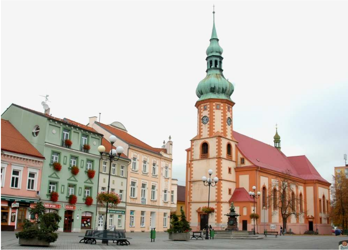
Obr. 7. Kostel sv. Jakuba v Sokolově, zdroj: www.google.cz