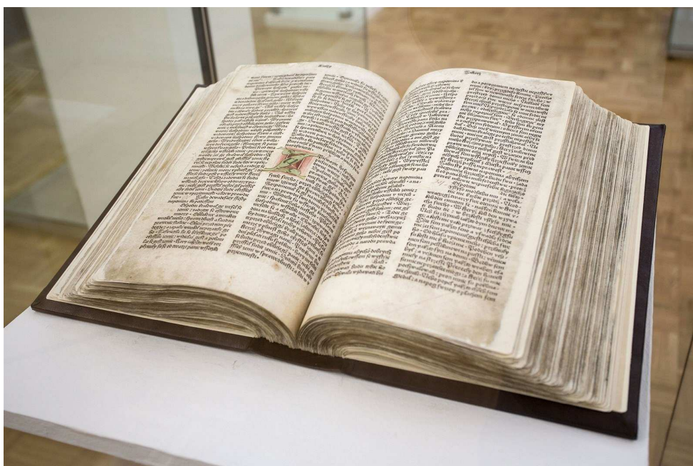
Obr. 6. Originál první slovanské tištěné Bible