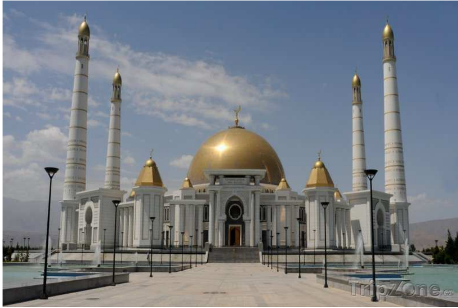
Obr. 3. Mešita