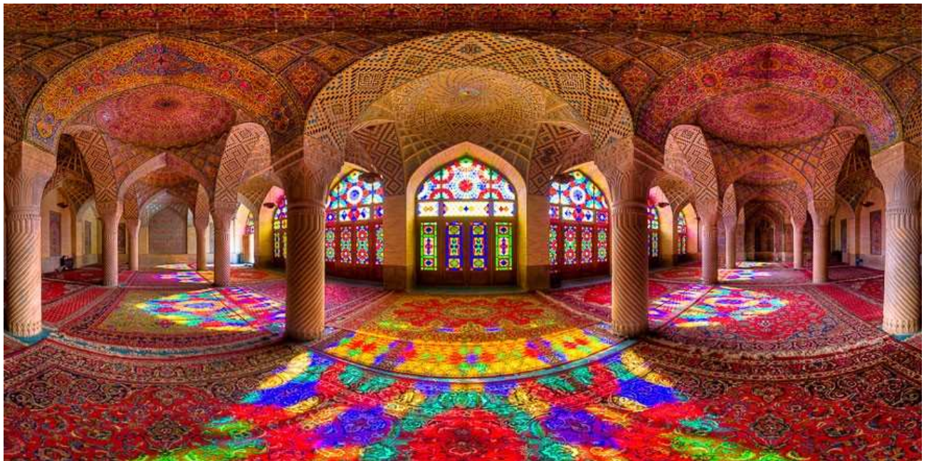
Obr. 4. Interiér mešity