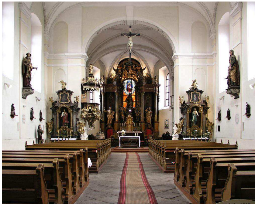
Obr. 8. Interiér kostela sv. Jakuba v Sokolově, zdroj: www.google.cz