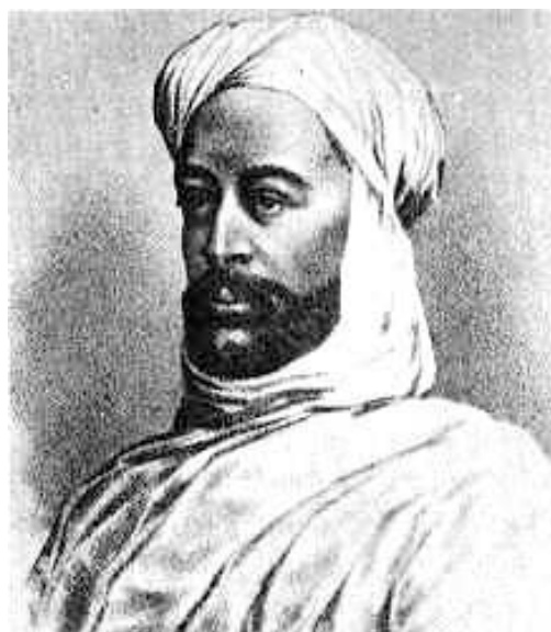
Obr. 2. Prorok Mohamed