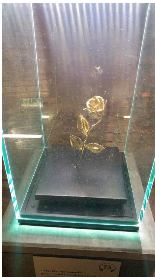
Příloha č. 2 Zlatá růže darovaná papežem Janem Pavlem II. Velehradu.