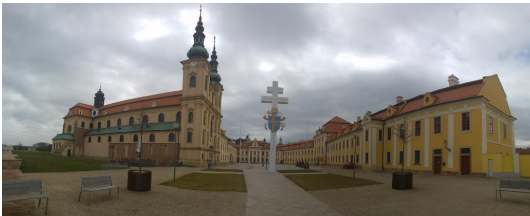
Příloha č. 1 pohled na farnost ve Velehradě