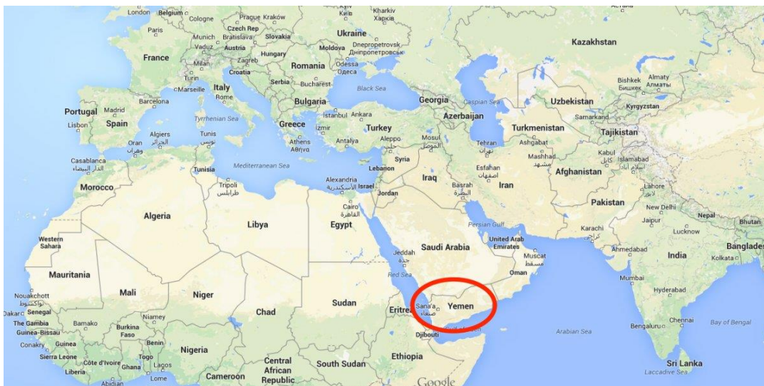
Obr. 1 – Jemen je červeně zakroužkván

Jemen se nachází v oblasti Blízkého východu na jihu Arabského poloostrova (viz. obr. 1). Sousedí se Saúdskou Arábií na severu a Ománem na severovýchodě. Jemen dělí od Afrického kontinentu průliv Bab-al-Mandab, který je jednou z nejdůležitějších přepravních cest světa. Spojuje totiž Suezský průplav a Rudé moře s Adenským zálivem, který je součástí Arabského moře a obklopuje Jemen z jihu. Hlavním městem Jemenu bylo město San c á, avšak od roku 2015 je okupováno, a proto byl dočasně hlavním městem ustanoven Aden. 1