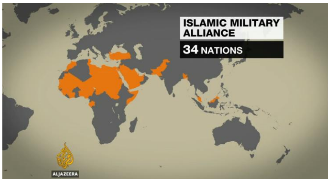
Obr. 4 – Členové Islámské vojenské koalice vedené Saúdskou Arábií

Egypt, Maroko a další (viz obrázek níže.) Z možného připojení ke koalici byl očekávaně vyloučen Írán, ale také Sýrie a Irák, 98 a to pravděpodobně proto, že je Saúdská Arábie považuje za regionální rivaly. Toto je překvapivé, jelikož na jednu stranu se Saúdská Arábie nechce spojit s těmito zeměmi v koalici, ale na druhou stojí tyto státy na jedné straně při boji proti Daeš.