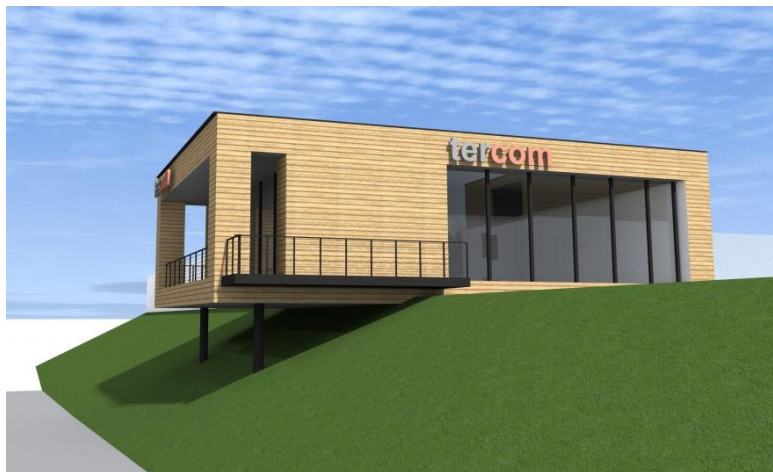
Obr. č. 4: návrh nové vzorkovny