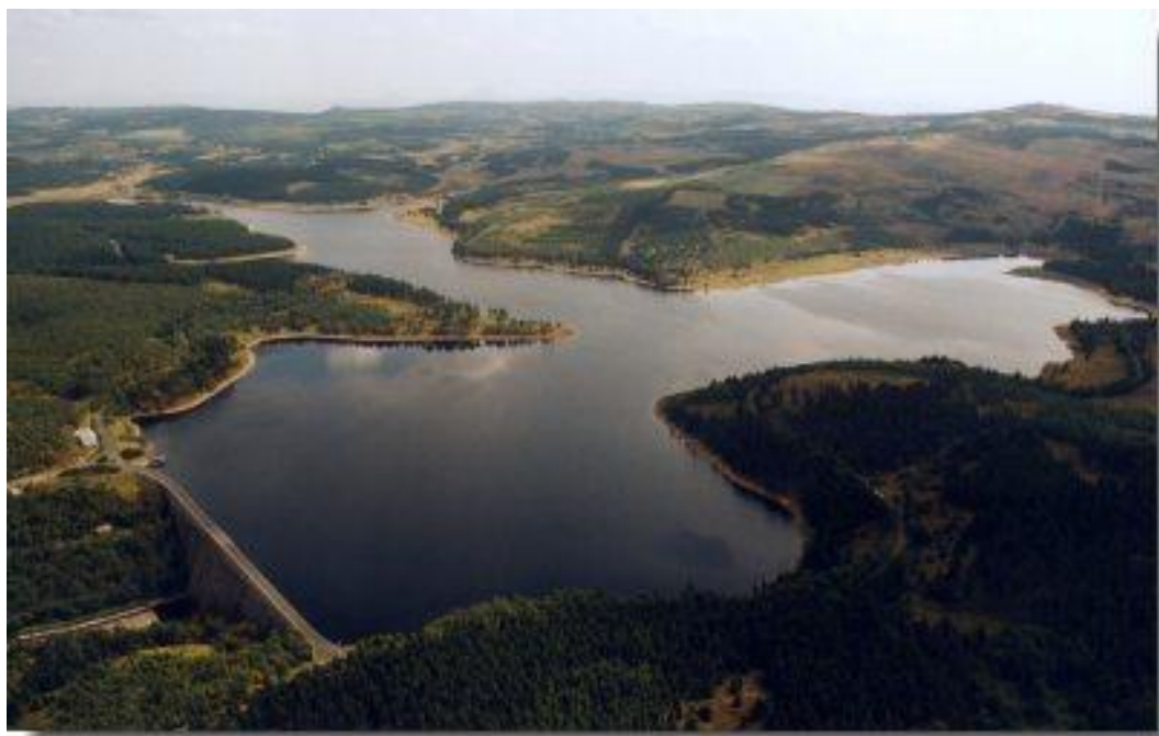
Obrázek č. 8 Vodní nádrž Fláje