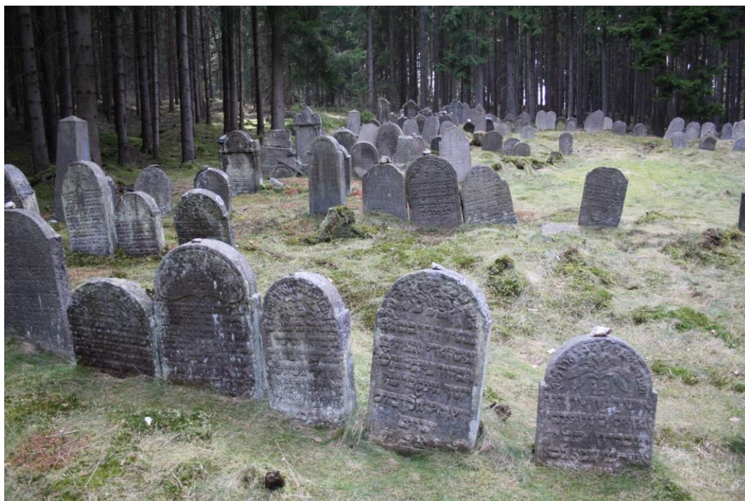
Obrázek č.3 Židovský hřbitov v obci Drmoul