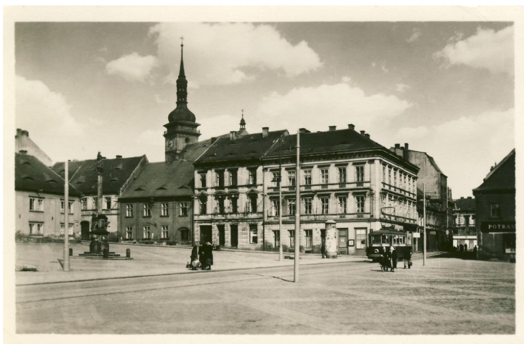
Obrázek č. 4 Starý Most 3. náměstí, 1950