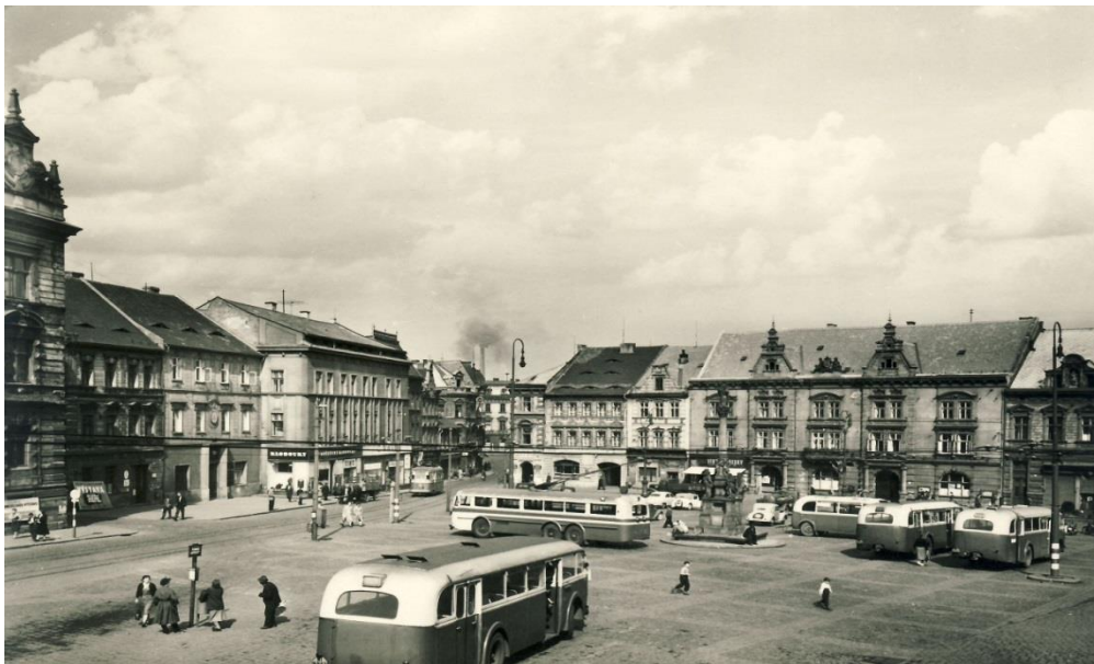
Obrázek č. 5 Starý Most 1. náměstí, 1950