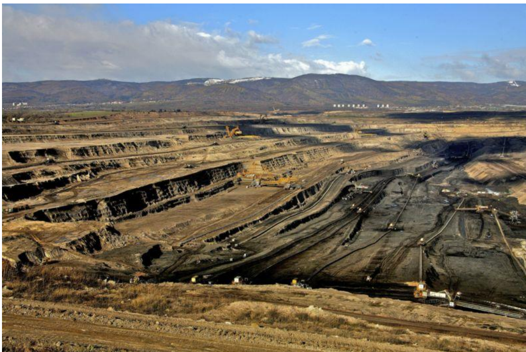
Obrázek č. 6 Mostecko, těžební oblast