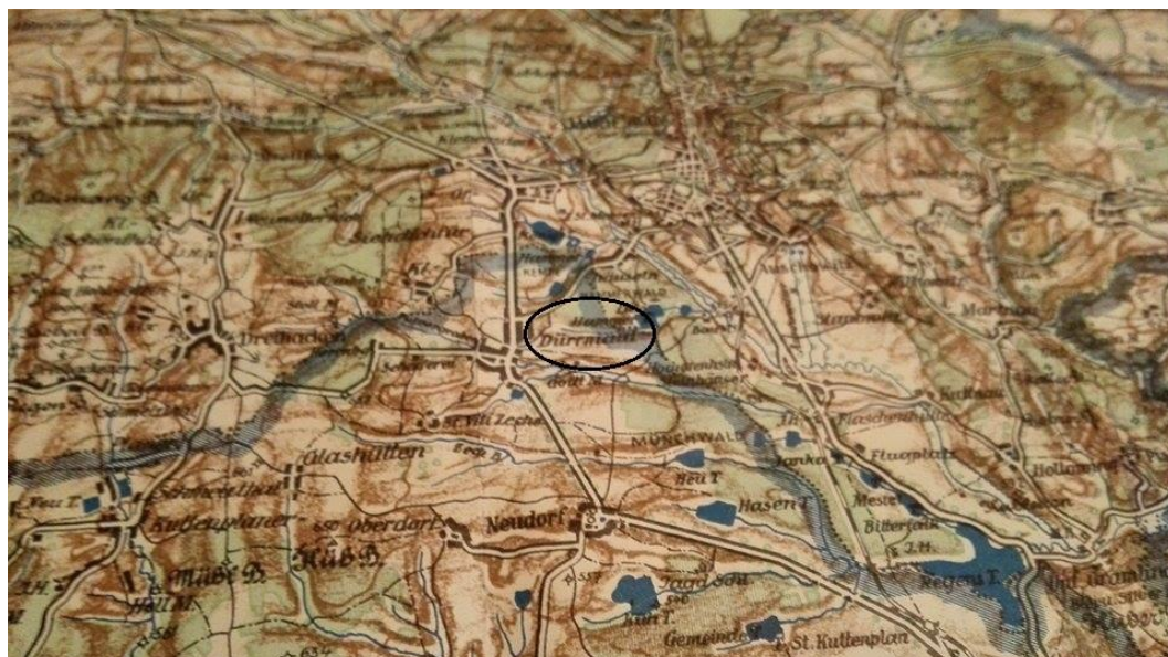
Obrázek č. 2 Okres Mariánské Lázně, Drmoul 1939