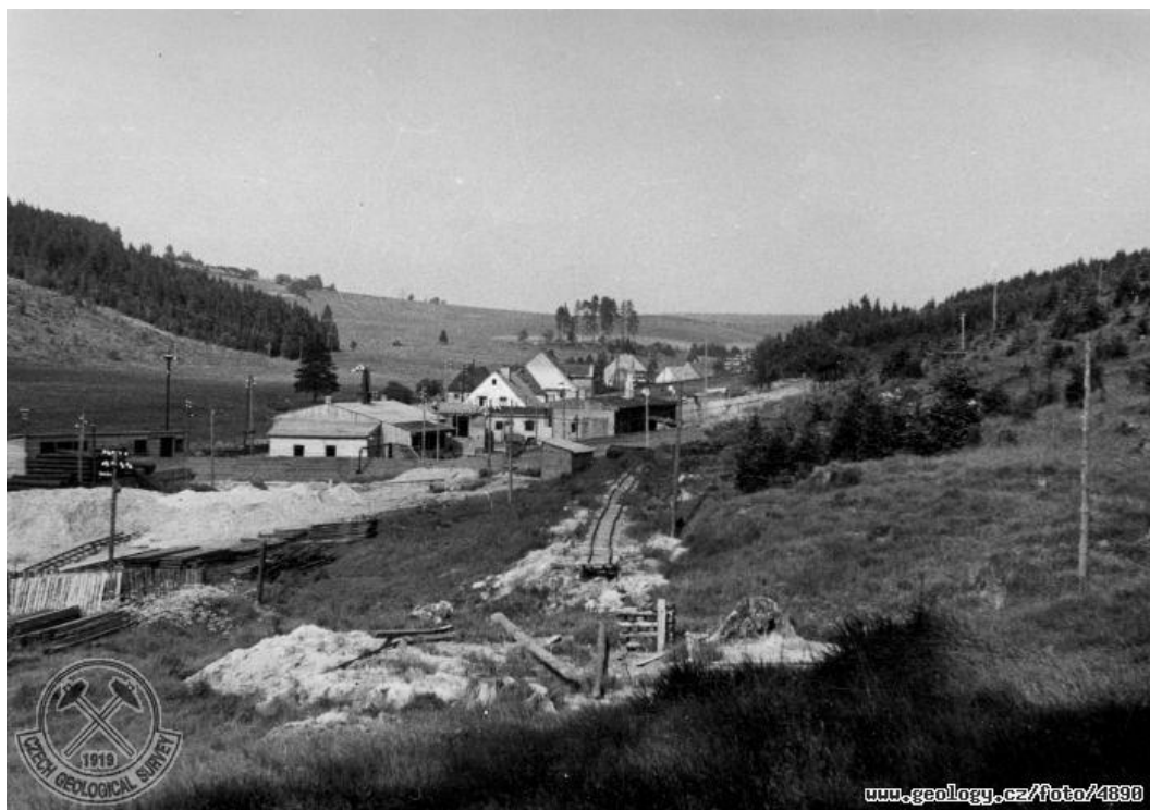
Obrázek č. 7 Zaniklá obec Fláje