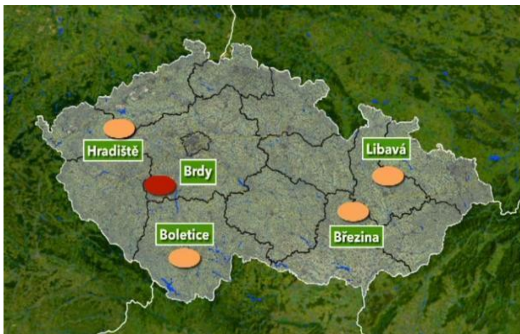
Mapa č. 1 : Přehled vojenských újezdů na území ČR