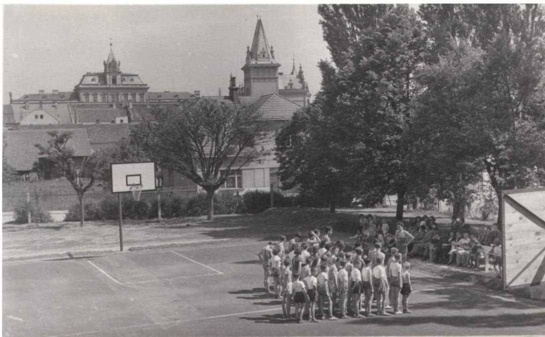
Foto 6: V přeloučském turnaji obsadily ženy v roce 1959 druhé místo