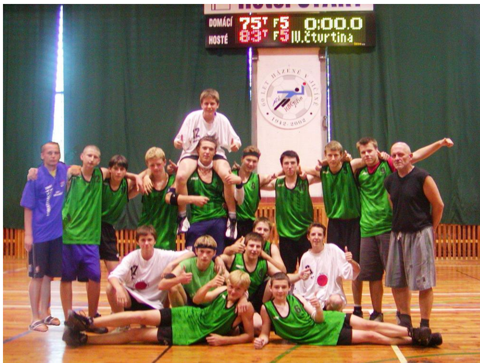
Foto 16: Mladší žáci v sezóně 2005/2006, ve které vybojovali v žákovské lize páté místo v České republice (z kroniky oddílu)