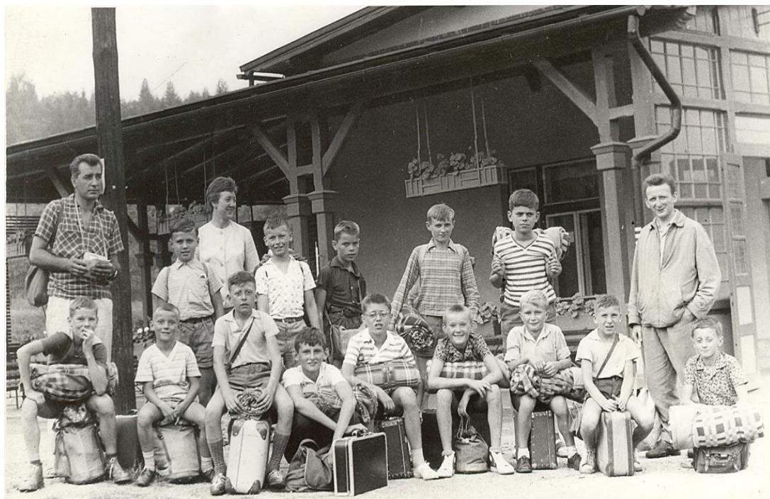
Foto 8: Starší žáci zvítězili v roce 1966 v Oblastním přeboru