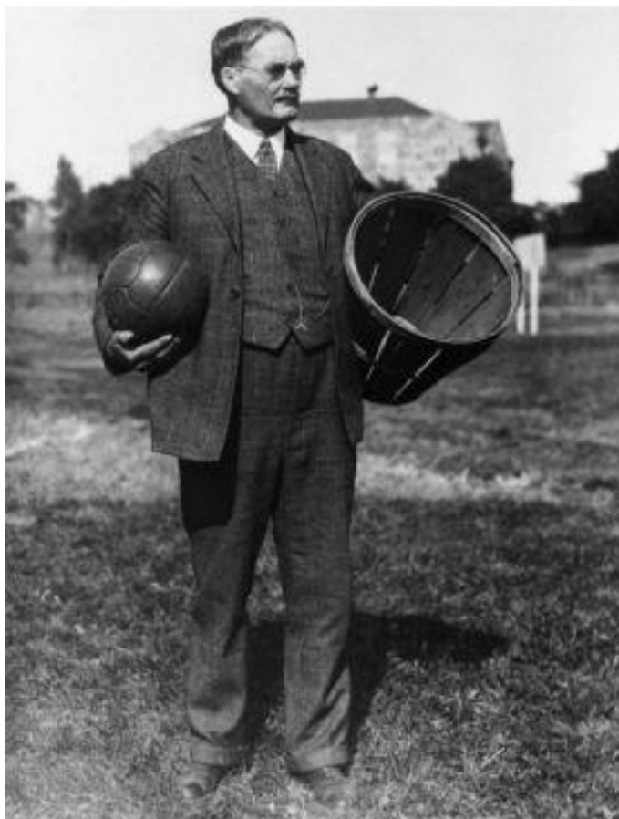
Foto 1: Profesor tělocviku James Naismith ze Springfield College v USA