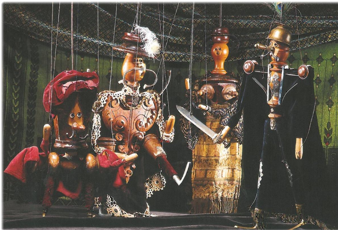
Příloha č. 24