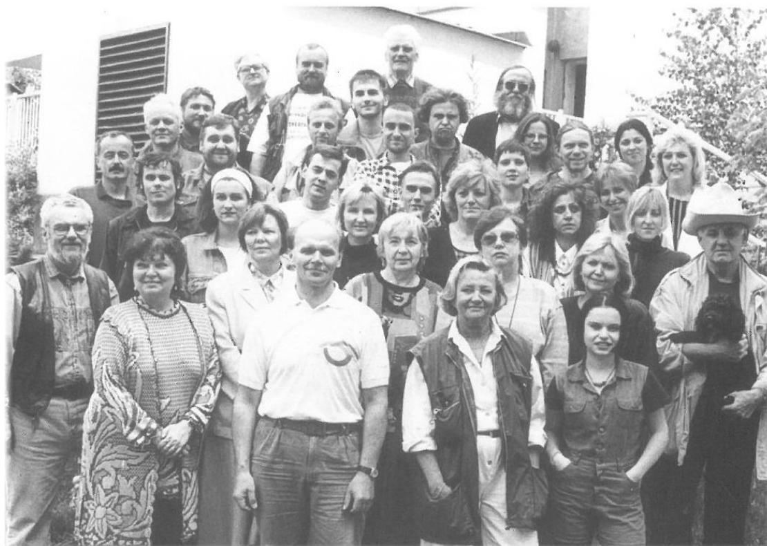
Příloha č. 8