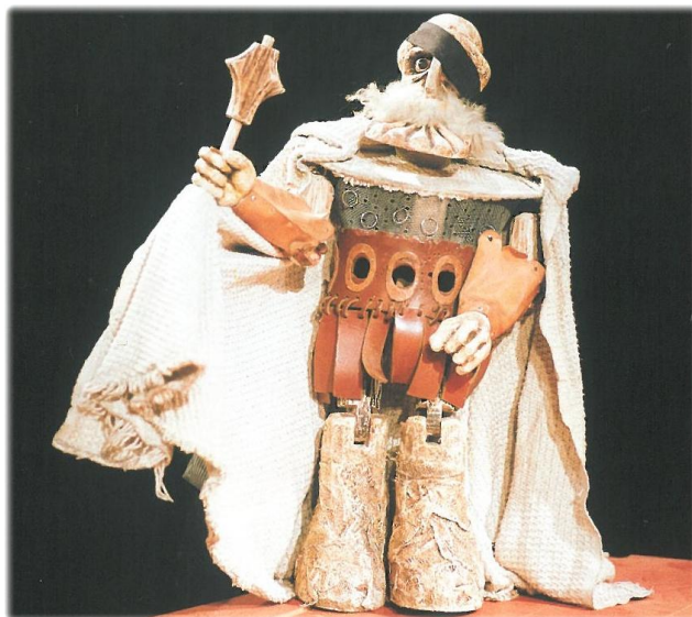
Příloha č. 17