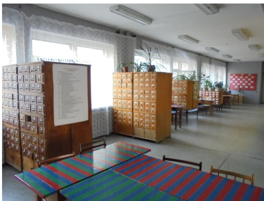
Obrázek 12: Katalogy v knihovně