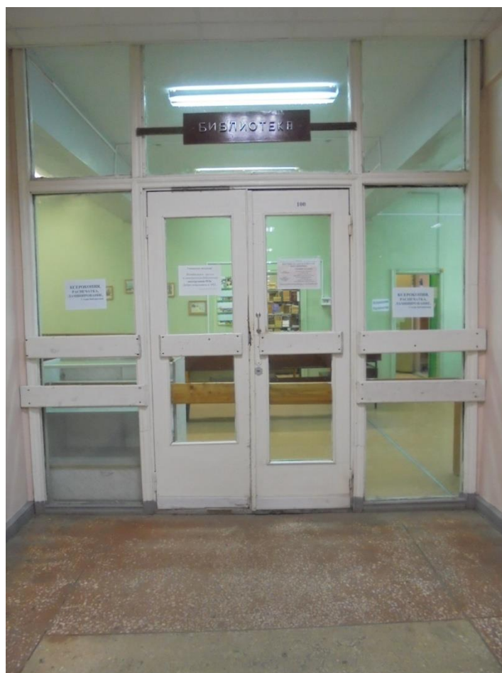
Obrázek 11: Vstup do knihovny