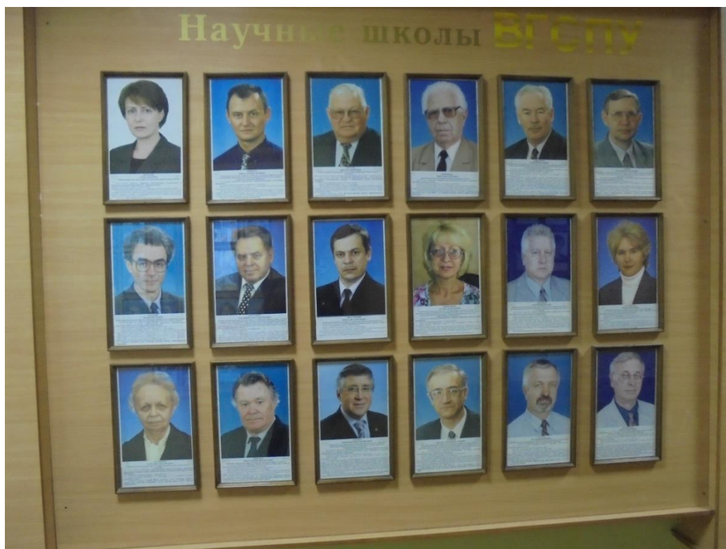
Obrázek 16: Významné osobnosti univerzity