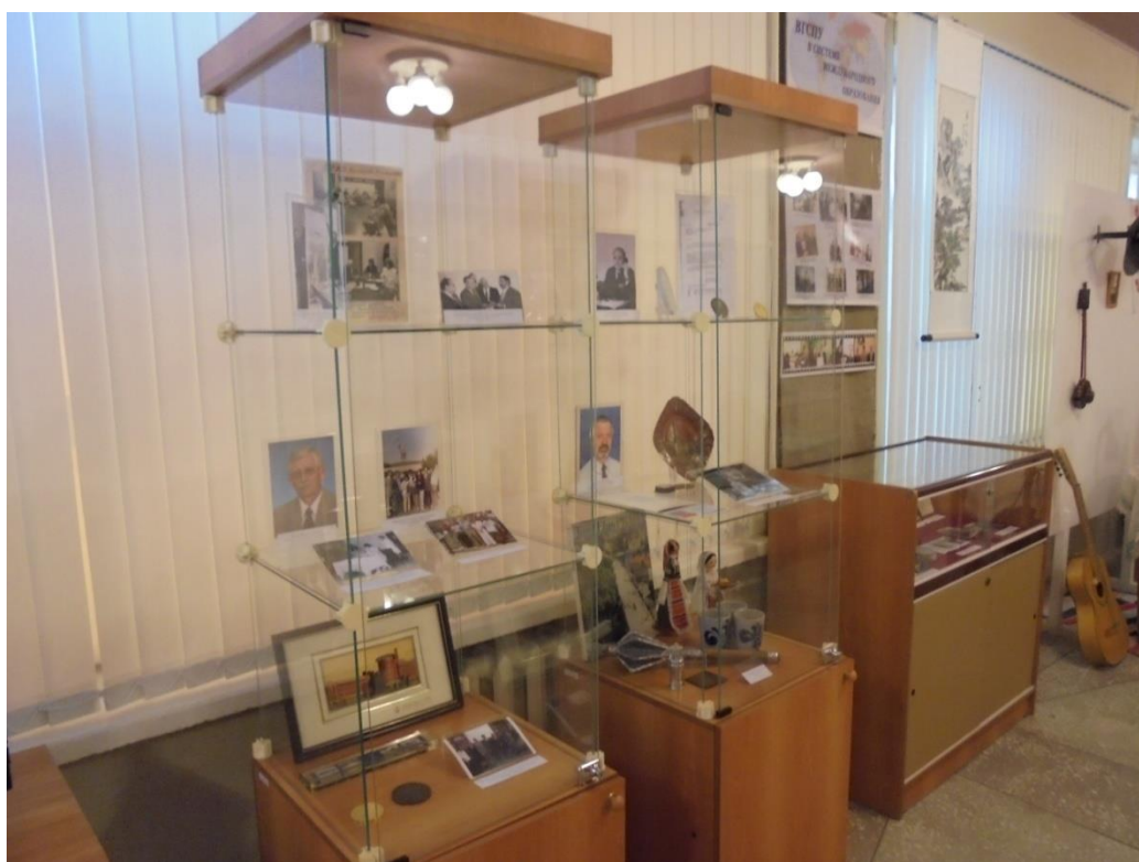
Obrázek 14: Univerzitní historické muzeum