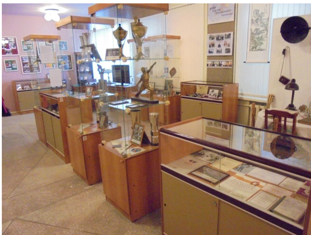
Obrázek 13: Univerzitní historické muzeum