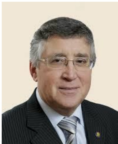
Obrázek 5: N. K. Sergejev

V současné době je rektorem VGSPU Nikolaj Konstantinovič Sergejev. Pochází z Volgogradské oblasti (dříve Stalingradské). Je dalším absolventem Volgogradské vysoké školy, kterou ukončil v roce 1972. Studoval na matematické fakultě. Za svůj život vydal mnoho vědeckých publikací. V roce 1998 byl zvolen rektorem Volgogradské státní pedagogické univerzity, tuto funkci vykonává dodnes. Působil rovněž jako prorektor pro vědecko-výzkumnou činnost. Pod jeho vedením bylo uskutečněno přes 40 vědeckých konferencí se zaměřením na problematiku pedagogiky a školství, z těchto konferencí bylo vydáno mnoho publikací. N. K. Sergejev je činný rovněž jako redaktor v univerzitních novin „Věstník Volgogradské státní pedagogické univerzity“ v sekci Pedagogika. Vložil mnoho sil do rozvoje pedagogiky na univerzitě, dosáhl významných úspěchů ve vědecko-pedagogické činnosti a vyškolil mnoho pracovníků v oblasti vzdělávání. Za jeho významnou práci mu byl udělen titul „Čestný pracovník vysoké školy RF“ („Заслуженный работник высшей школы Российской Федерации“), obdržel medaili „Osobnost národního vzdělávání“ („Отличник народного просвещения“), jako významná osobnost je uváděn v různých publikacích, např. v Pedagogickém encyklopedickém slovníku, dále pak v Encyklopedii „Významné osobnosti Ruska“. 35