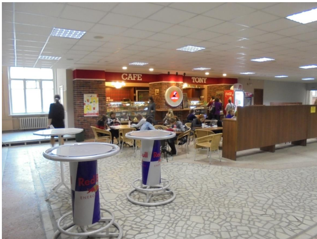
Obrázek 10: Občerstvení na univerzitě