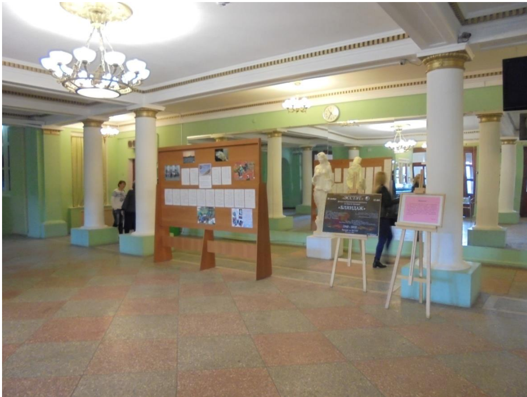
Obrázek 9: Hlavní chodba