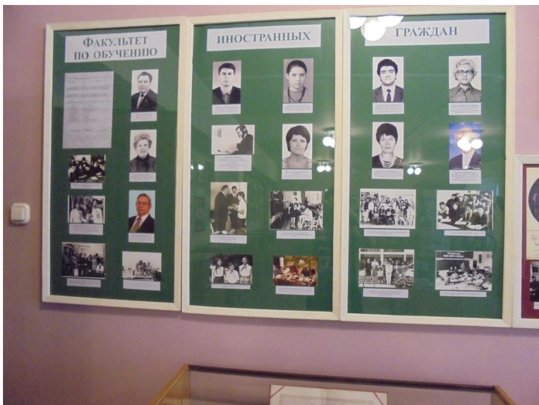
Obrázek 15: Univerzitní historické muzeum