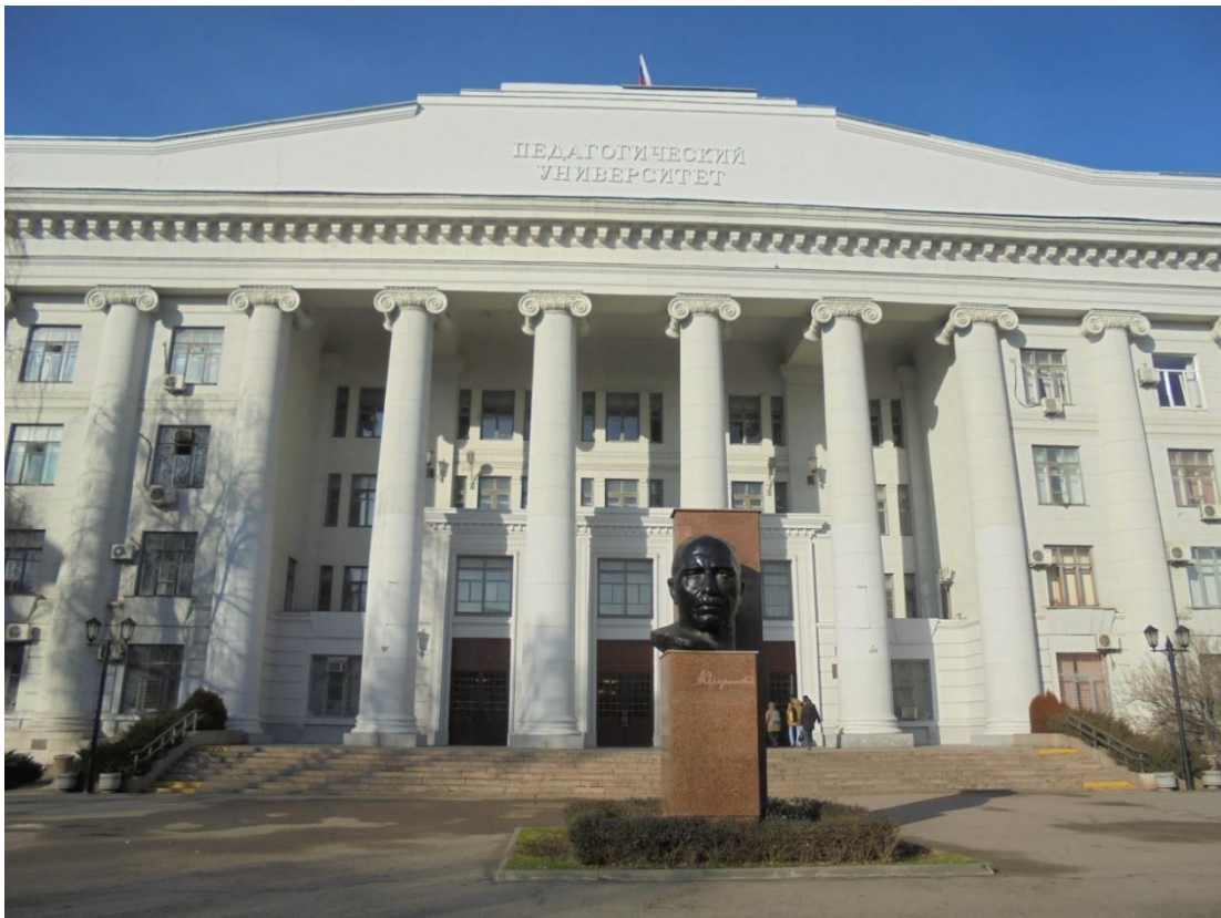
Obrázek 7: Volgogradská státní sociálně-pedagogická univerzita