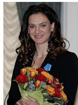
Obrázek 6: J. G. Isinbajeva

K významným a celosvětově známým patří rovněž sportovkyně a absolventka Volgogradské pedagogické univerzity Jelena Gadžijevna Isinbajeva (naroz. 1982 ve Volgogradě). Olympijských her se zúčastnila v letech 2004, 2008, v r. 2012 získala na olympijských hrách 2. místo. Je držitelkou 28 světových rekordů, v r. 2012 byla vyhodnocena jako nejúspěšnější sportovkyně Ruska. V současné době pracuje jako trenérka lehké atletiky v Ústředním vojenském sportovním klubu, má hodnost armádního majora, byla oceněna vyznamenáním „Zasloužilý mistr sportu Ruska.“