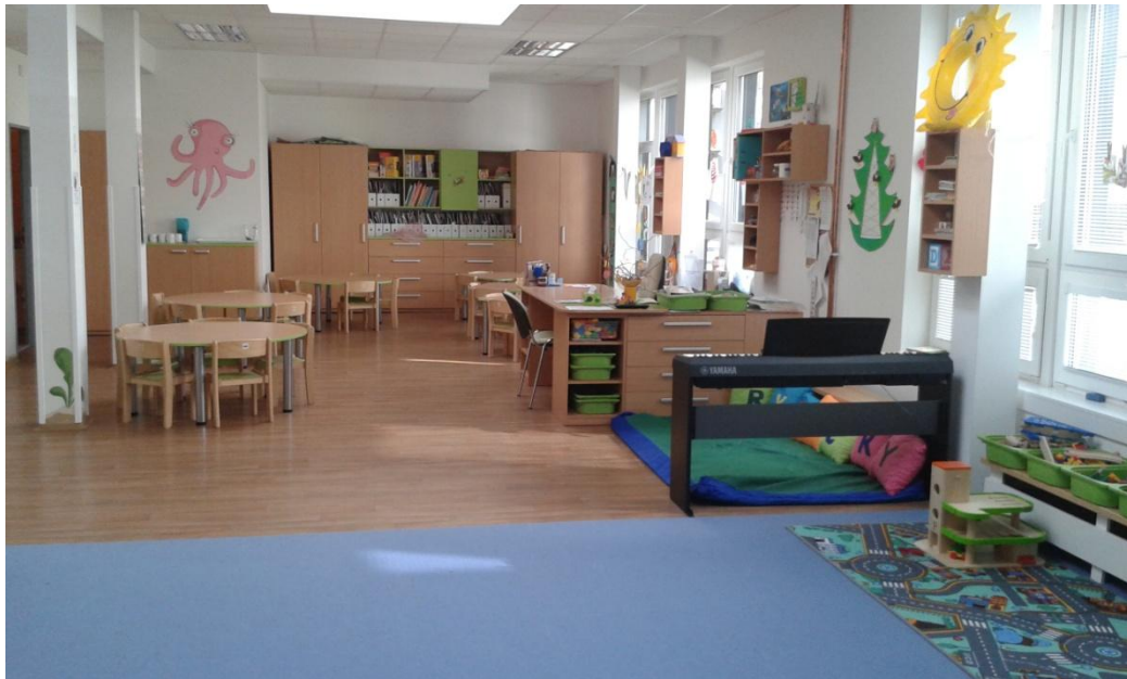
Obrázek 3 Třída Rybičky pohled 1