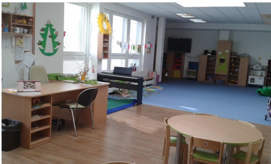
Obrázek 4 Třída Rybičky pohled 2

Obrázek 1-4 byly pořízeny autorem bakalářské práce. Fotografie slouží pro potřeby této bakalářské práce [Dobřany, MŠ Dobřany - Stromořadí 2016].