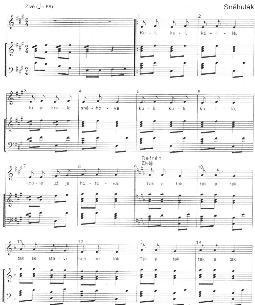
Obrázek 13 Notový materiál k hudebně pohybové hře Sněhulák s. 46

KULHÁNKOVÁ, Eva. Taneční hry s písničkami: od 4 let do 9 let . Vyd. 1. Praha: Portál, 2006, 144 s. 126 ISBN 80-7367-108-5.