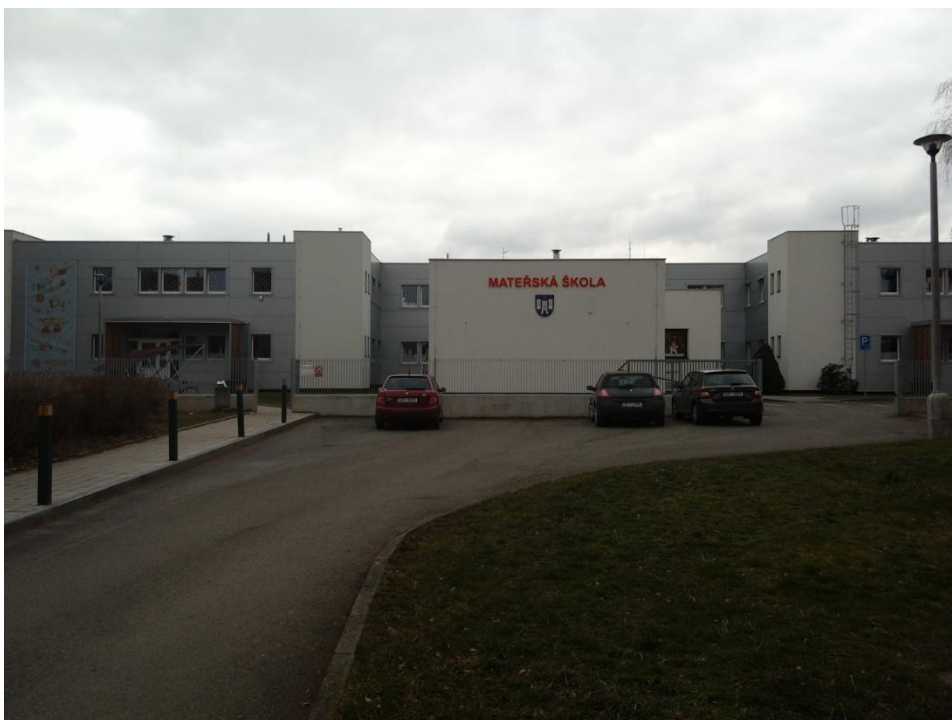
Obrázek 1 Budova MŠ Dobruška - Stromořadí