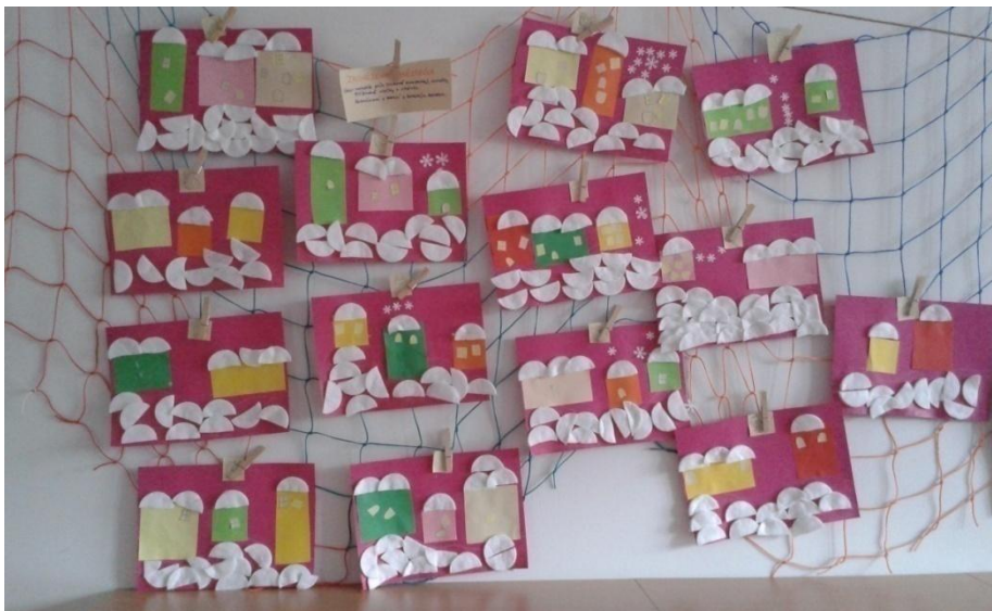
Obrázek 17 Výtvary dětí - Zasněžené městečko