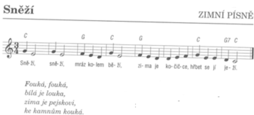
Obrázek 12 Notový materiál k písni Sněží

KULHÁNKOVÁ, Eva. Taneční hry s písničkami: od 4 let do 9 let . Vyd. 1. Praha: Portál, 2006, 144 s. 126 ISBN 80-7367-108-5.