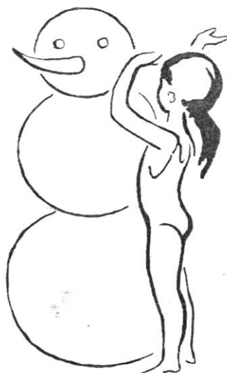
Obrázek 14 Notový materiál k hudebně pohybové hře Sněhulák s. 47

[:Tak a tak, tak a tak, tak se staví sněhulák:].