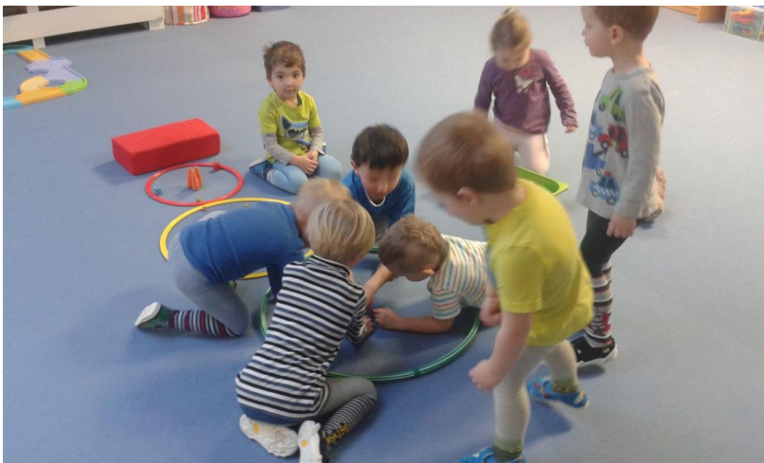
Obrázek 19 Realizace hudebně pohybové hry Sněhulák

Fotografie slouží pro potřeby této bakalářské práce [Dobřany, MŠ Dobřany - Stromořadí 2016].