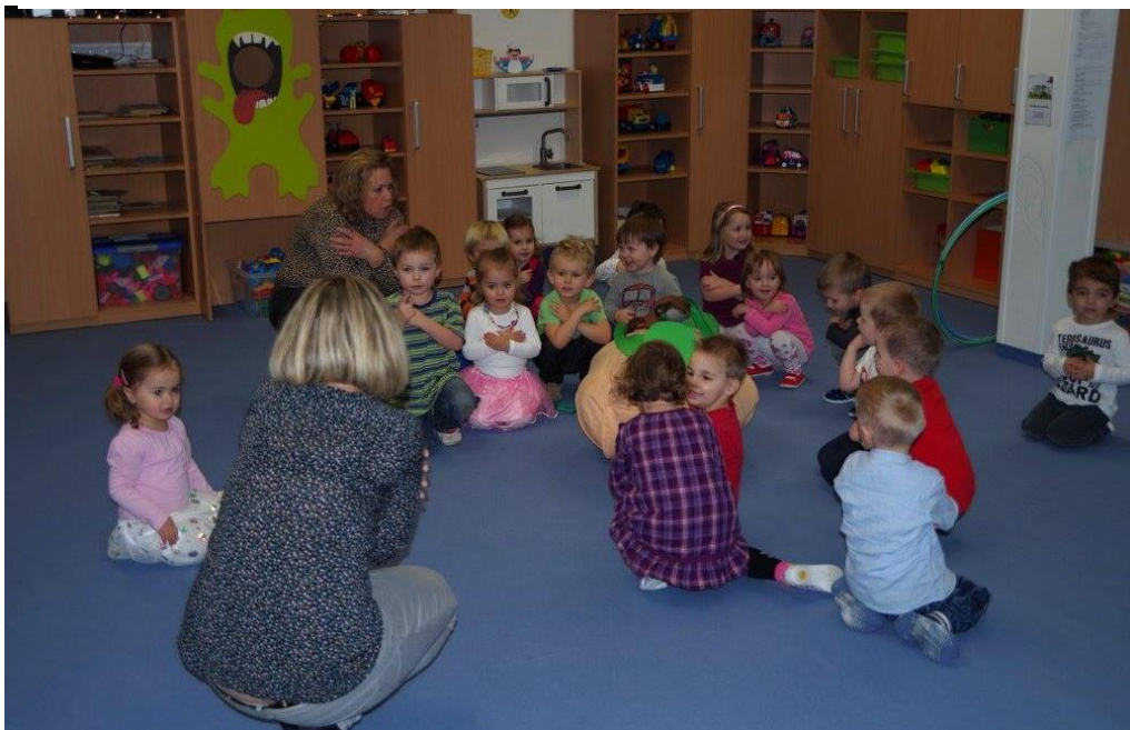
Obrázek 6 Fotografie z vánoční besídky třídy Rybičky z 21. 12. 2015

Fotografie 5-6 dostupné ze skupiny na Facebooku: Facebook, Přátelé MŠ Dobřany - Stromořadí [online]. Poslední aktualizace 2016 [datum citace 10. 4. 2016]. Dostupné z https://www.facebook.com/groups/458809764206088/