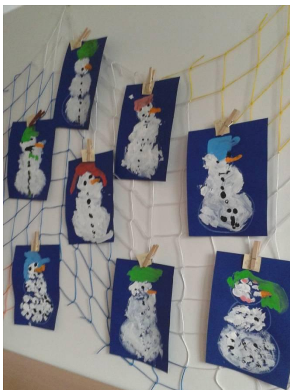
Obrázek 18 Výtvary dětí - Sněhulák