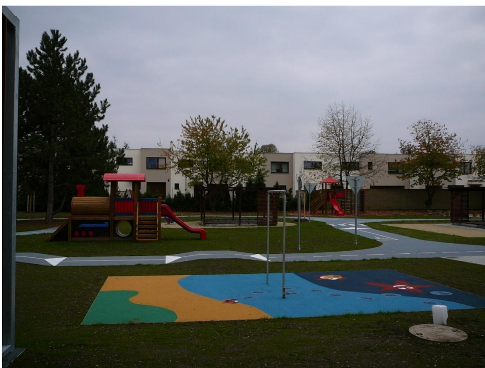
Obrázek 2 Zahrada po revitalizaci