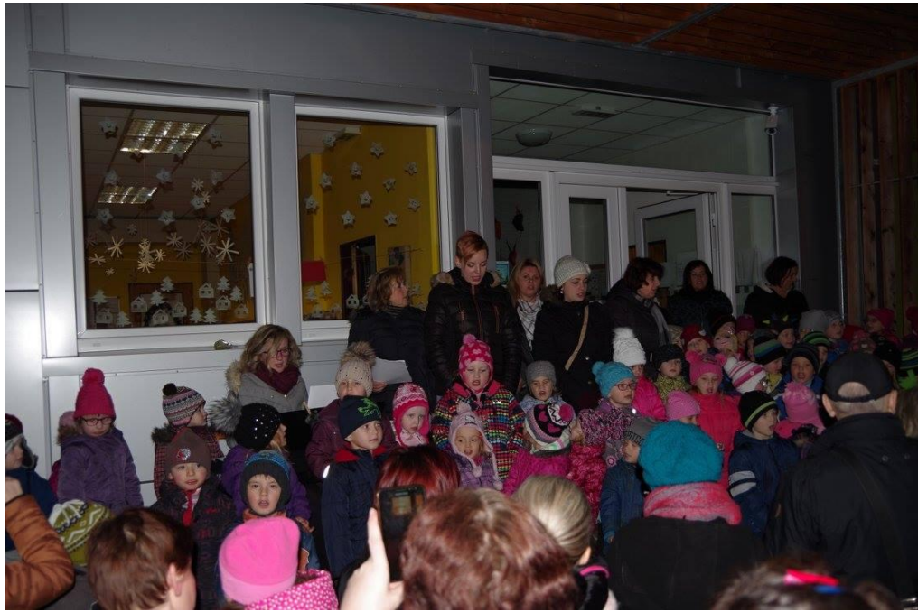
Obrázek 5 Fotografie z akce Rozsvícení vánočního stroměčku před MŠ ze 17. 12. 2015