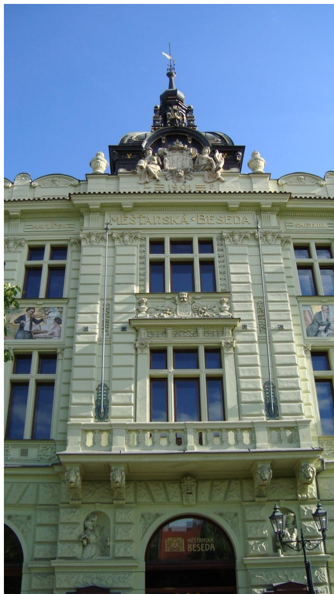
Nová budova Měšťanské besedy v Kopecského sadech