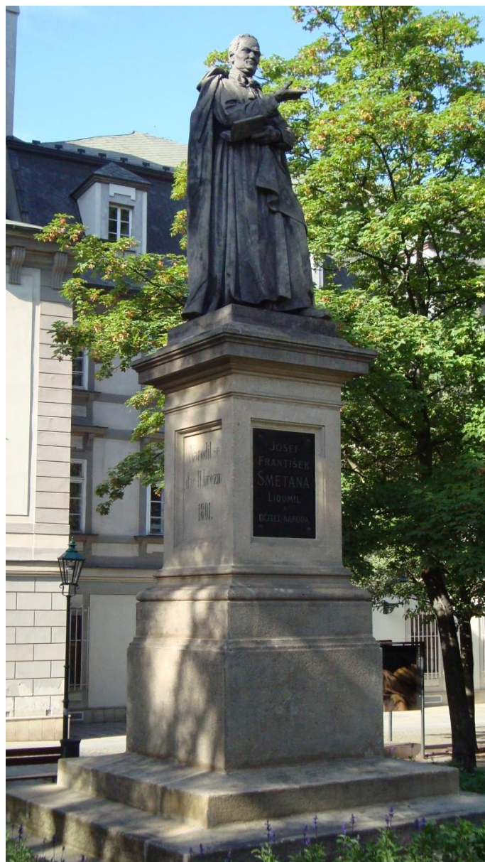
Památník Josefa Františka Smetany