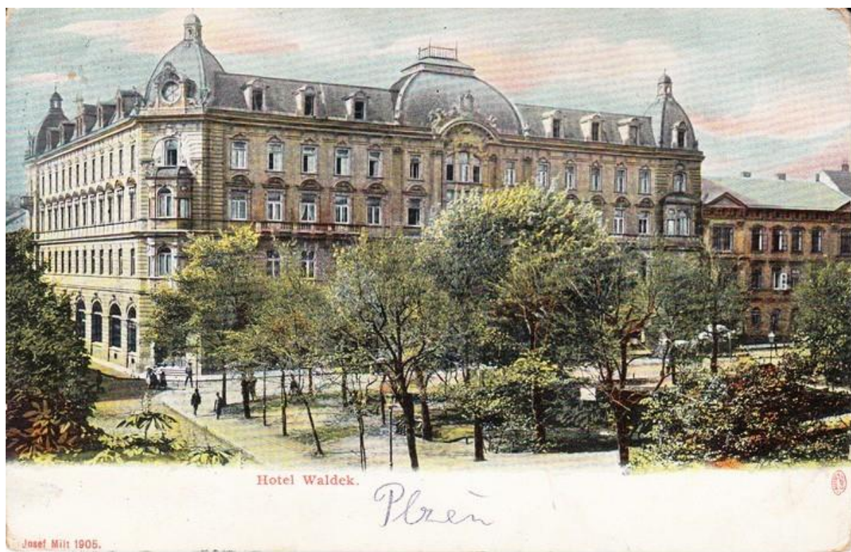
Hotel Waldek, dnes Slovan v roce 1905