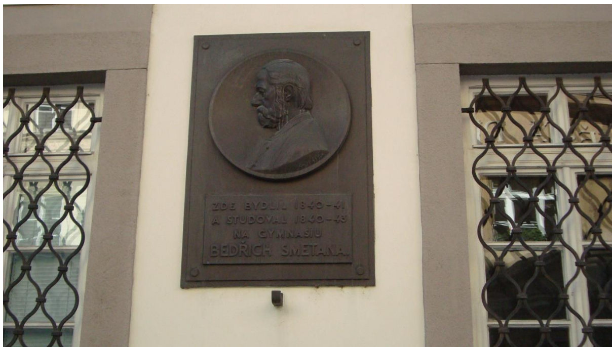
Pamětní deska Bedřicha Smetany

Text pamětní desky: „ Zde bydlil 1844 – 41 a studoval 1840 – 43 na gymnasiu Bedřich Smetana. “