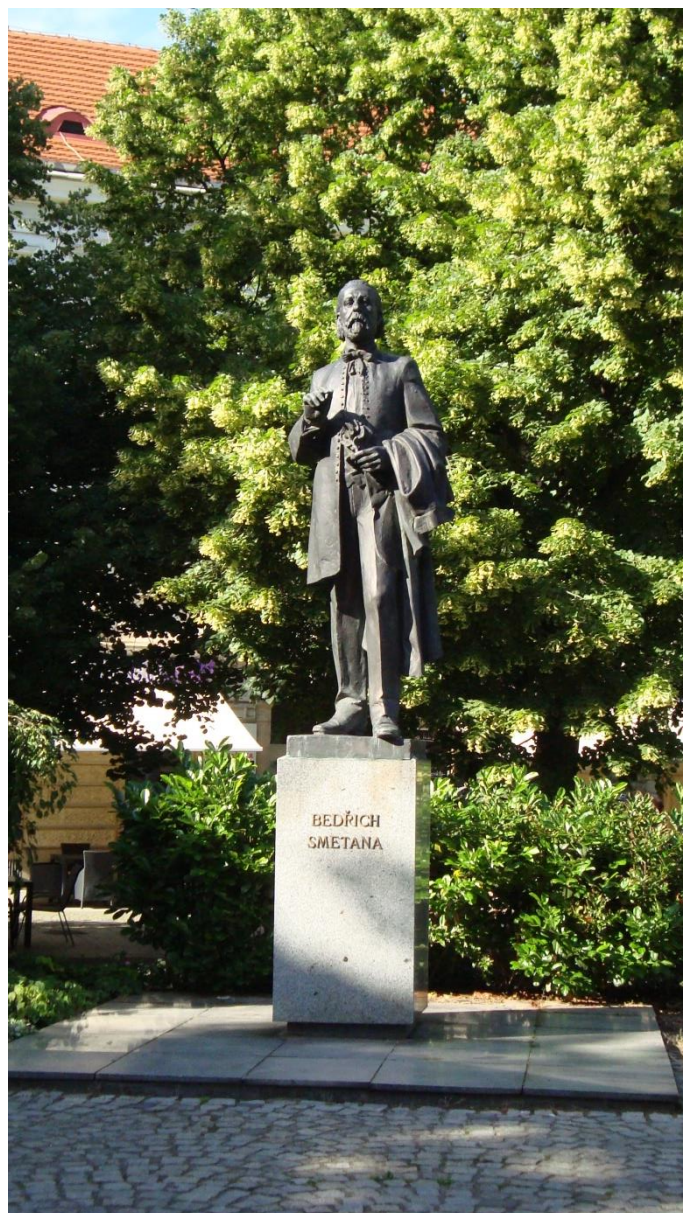
Památník Bedřicha Smetany v Kopeckého sadech