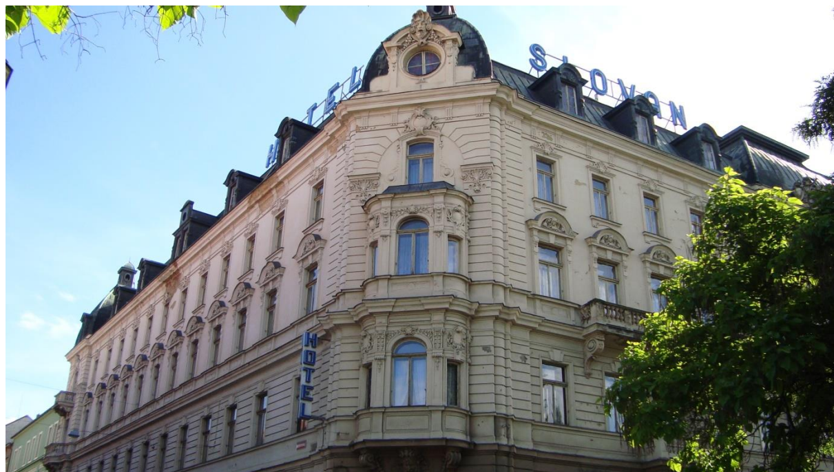
Hotel Waldek, dnes Hotel Slovan