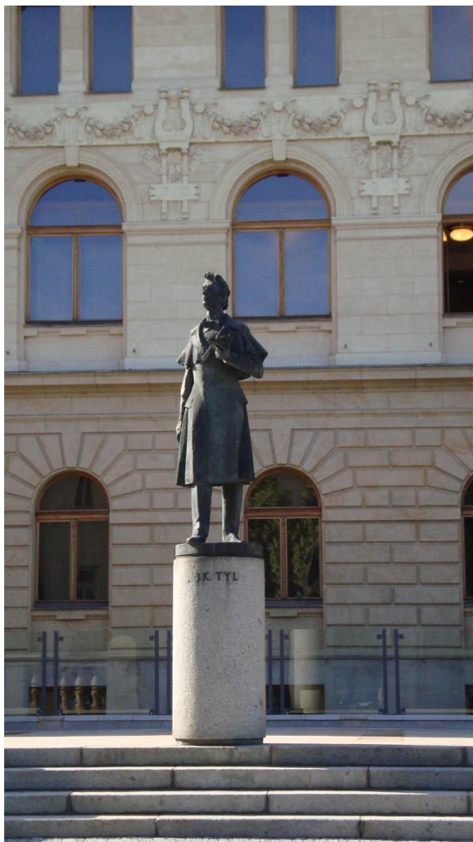
Socha Josefa Kajetána Tyla u Velkého divadla