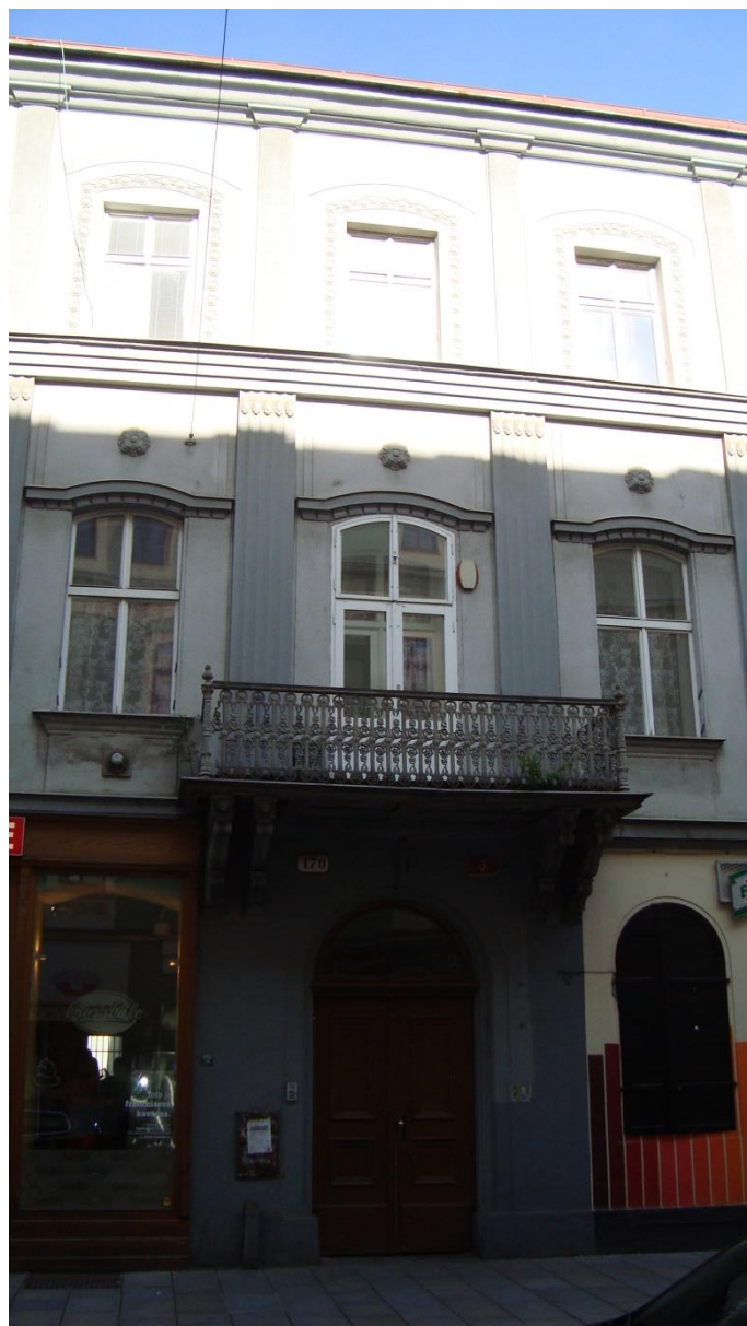
Původní budova Měšťanské besedy ve Vankově, dnes Jungmannově ulici