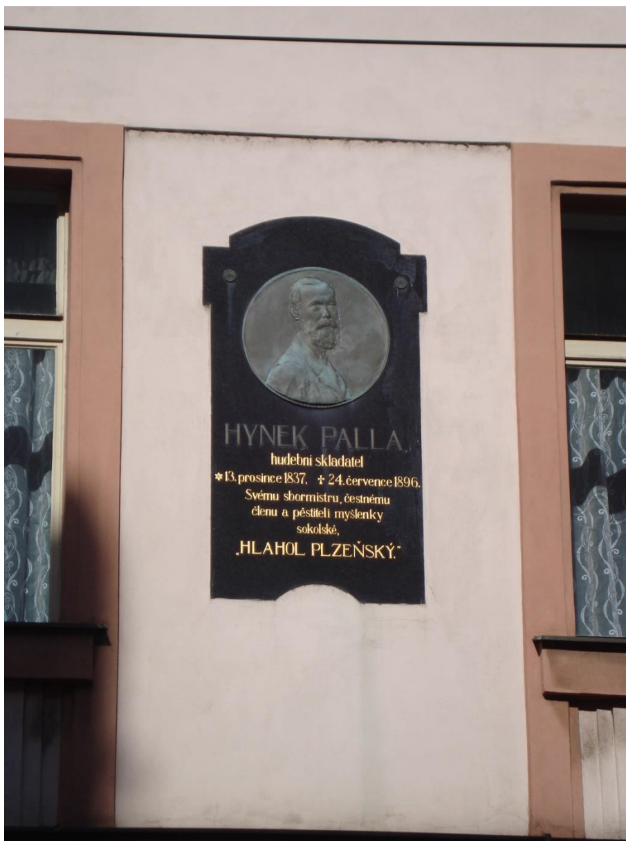
Pamětní deska Hynka Pally v Prokopově ulici.

Text pamětní desky: „ Hynek Palla, hudební skladatel *13. prosince 1837, † 24. července 1896. Svému sbormistru, čestnému členu a pěstiteli myšlenky sokolské. „Hlahol plzeňský“. “