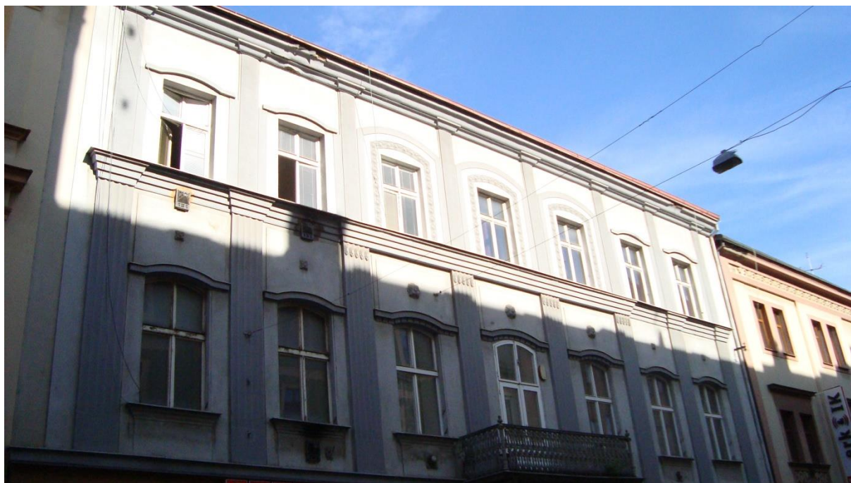
Původní budova Měšťanské besedy ve Vankově, dnes Jungmannově ulici