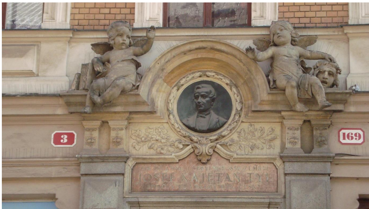
Pamětní deska Josefa Kajetána Tyla v dnešní Prešovské ulici

Text pamětní desky: „Zde žil a dne 11. července 1856 zemřel Josef Kajetán Tyl, spisovatel a dramatik český.“