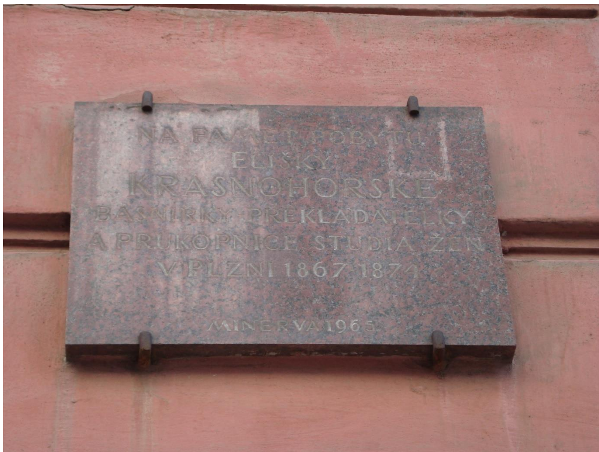
Pamětní deska Elišky Krásnohorské v dnešní Goethově ulici

Text pamětní desky: „ Na paměť pobytu Elišky Krásnohorské, básniřky, překladatelky a průkopnice studia žen v Plzni 1867 – 1874. ,Minerva 1965‘ “