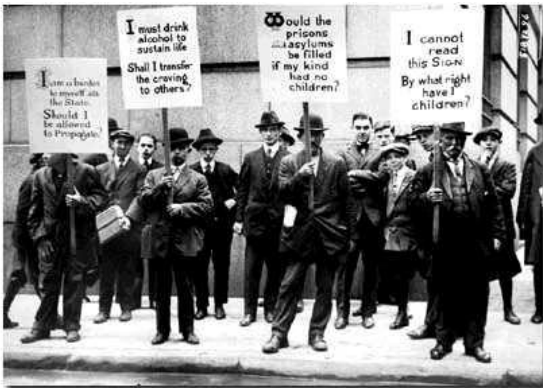
Příloha č. 4: Shromáždění podporující eugeniku. Wall Street, New York, 1915.

https://en.wikipedia.org/wiki/Eugenics_in_the_United_States#/media/File:Eugenics_supporters_hold_signs_on_Wall_Street.jpg