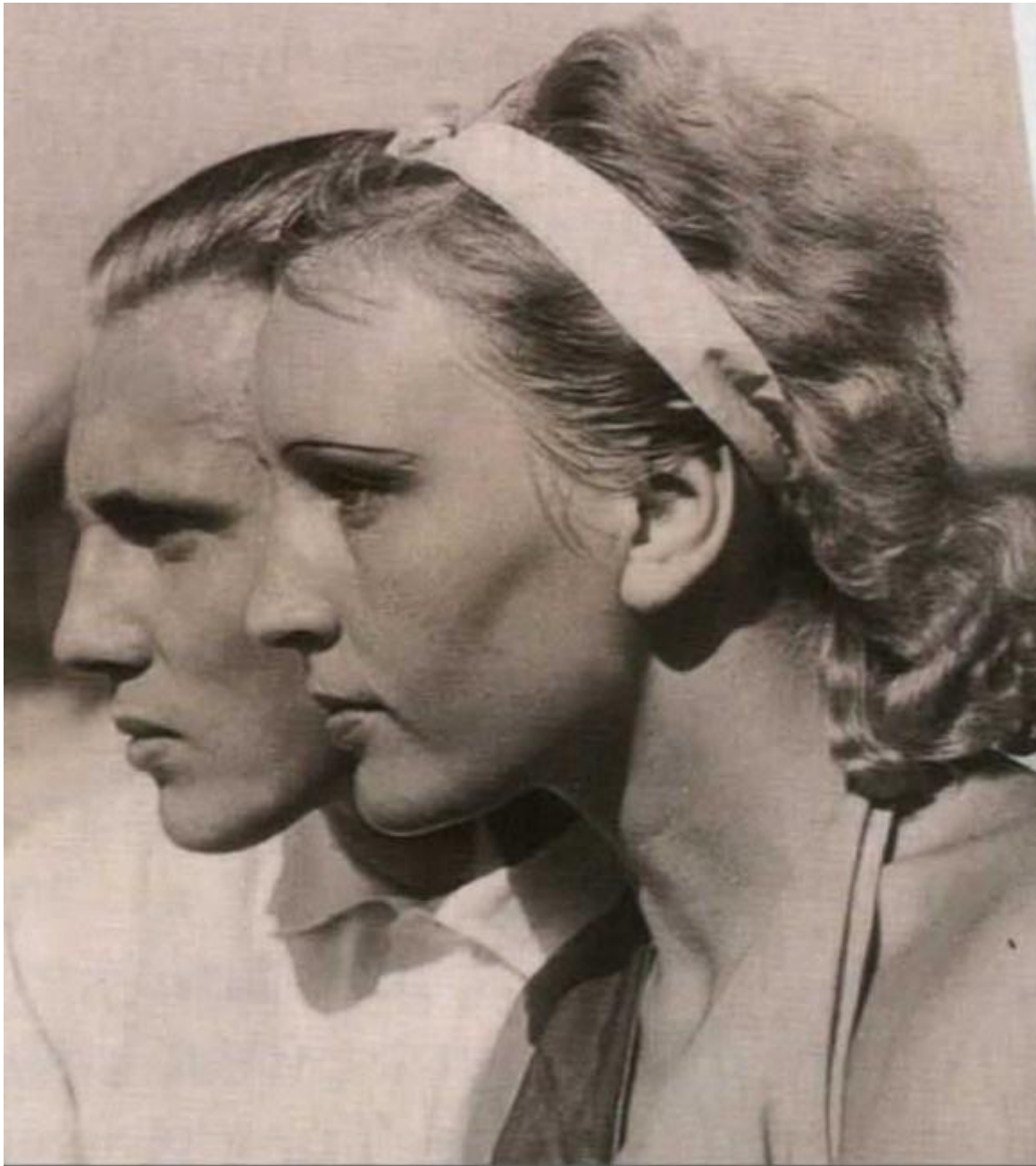
Příloha č. 3: Ideální árijský pár.

https://h8edgereich.files.wordpress.com/2008/09/aryans-thumb.jpg