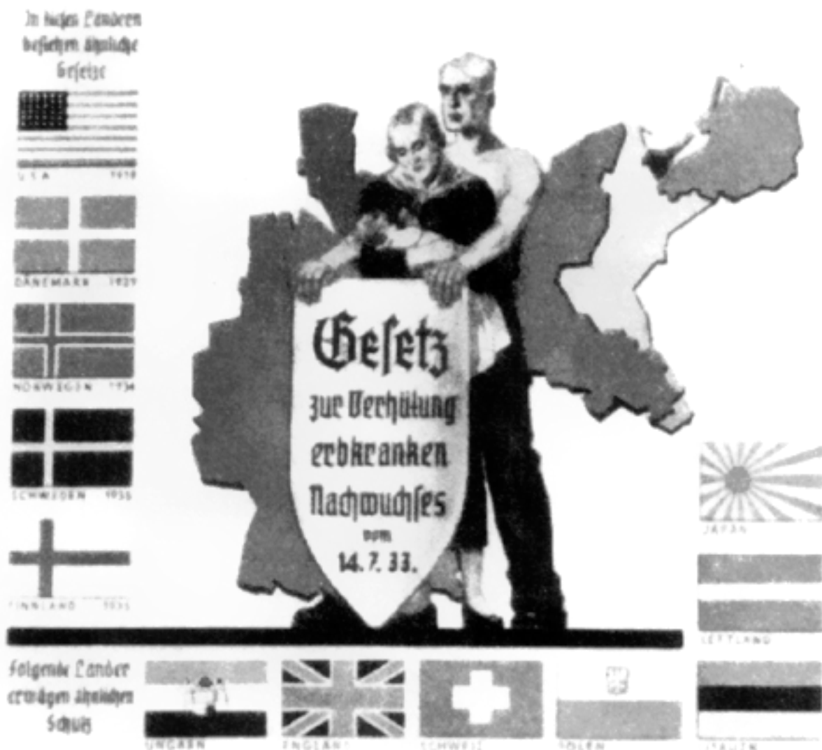
Příloha č. 2: Nacistický plakát ukazující, že Německo není v boji proti dědičným chorobám samo.

https://cs.wikipedia.org/wiki/Eugenika_ve_Spojen%C3%BDch_st%C3%A1tech_americk%C3%BDch#/media/File:Wir_stehen_nicht_allain.png